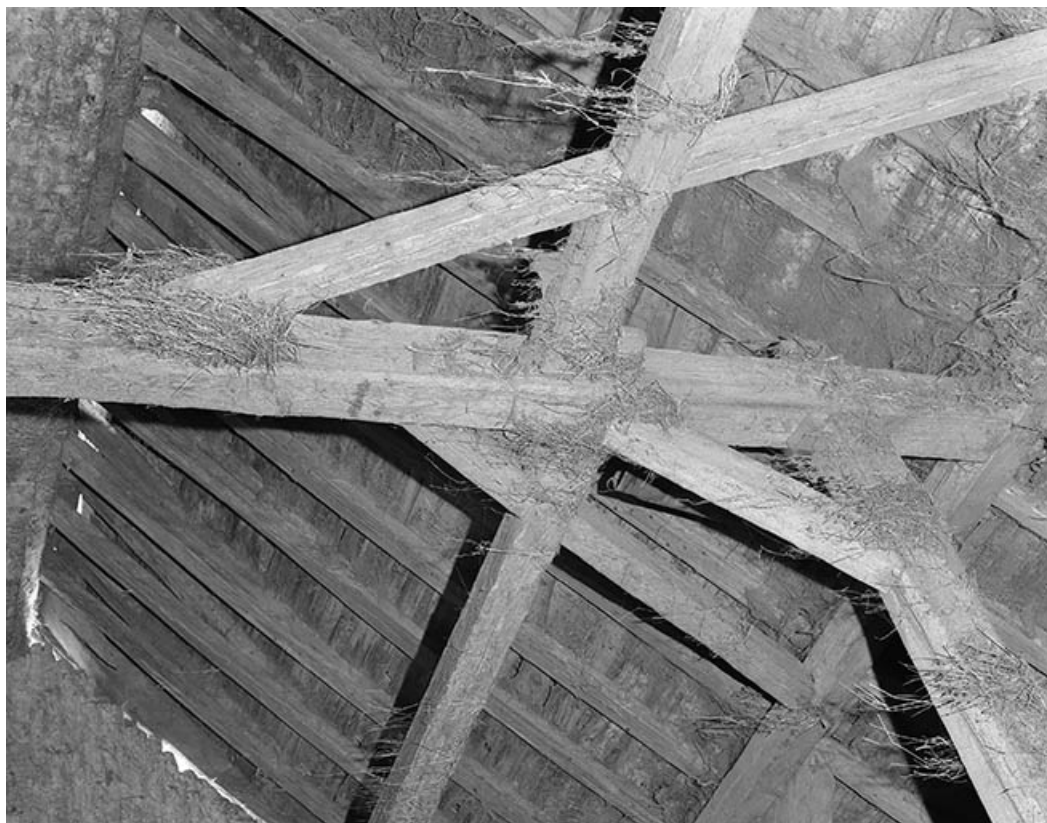
Poteau de charpente latéral d'une ferme. 25, Villeneuve-d'Amont, lieudit : la Perrière