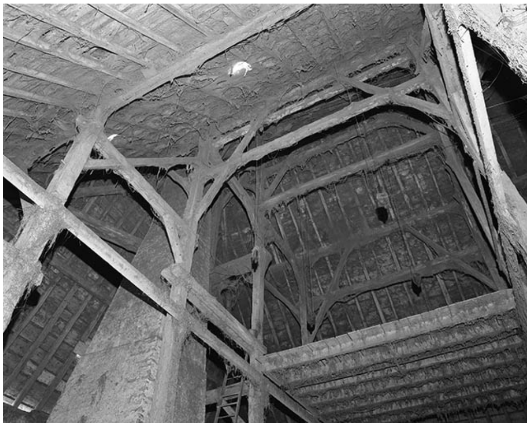
Disposition d'ensemble de la charpente.

25, Villeneuve-d'Amont, lieudit : la Perrière