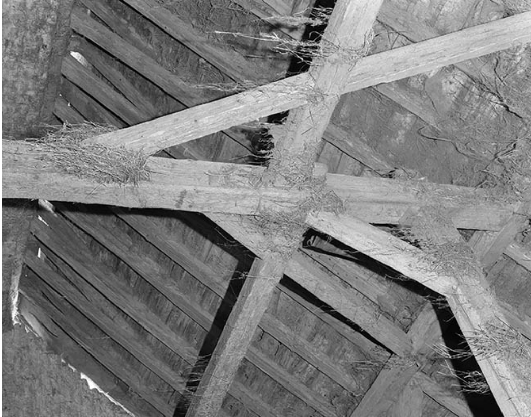
Poteau de charpente latéral d'une ferme. 25, Villeneuve-d'Amont, lieudit : la Perrière