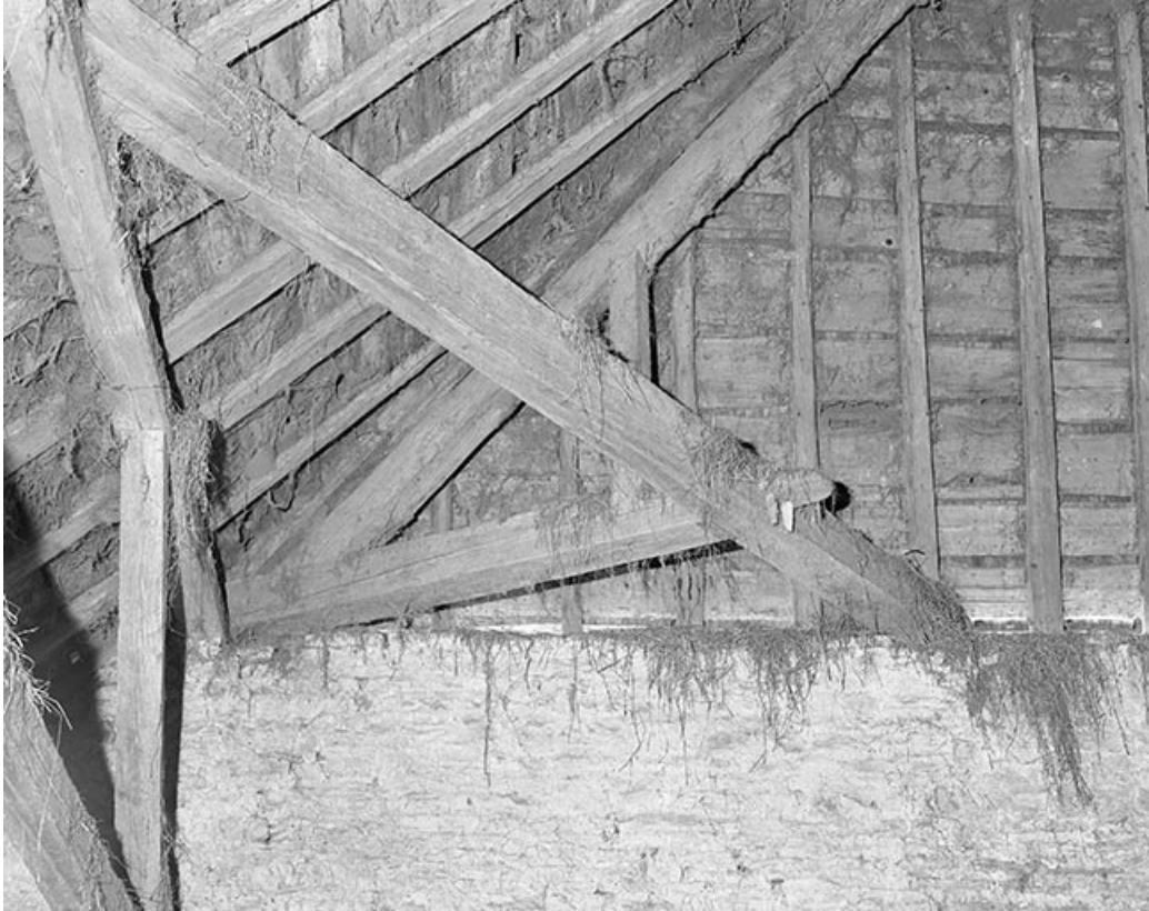
Détail de la charpente au niveau d'une demi-croupe.

25, Villeneuve-d'Amont, lieudit : la Perrière