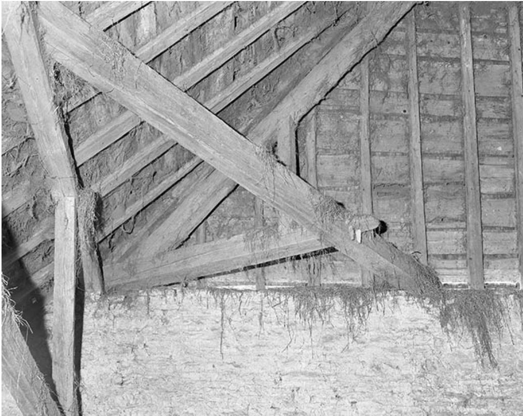
Détail de la charpente au niveau d'une demi-croupe.

25, Villeneuve-d'Amont, lieudit : la Perrière