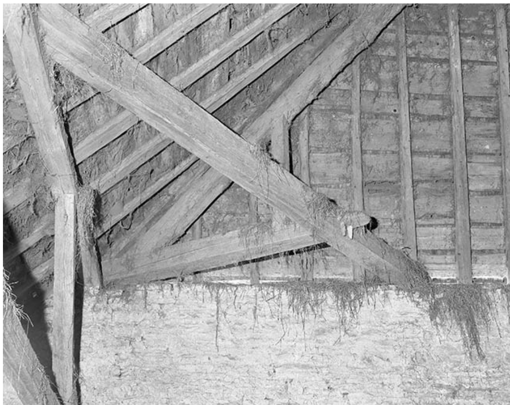
Détail de la charpente au niveau d'une demi-croupe.

25, Villeneuve-d'Amont, lieudit : la Perrière