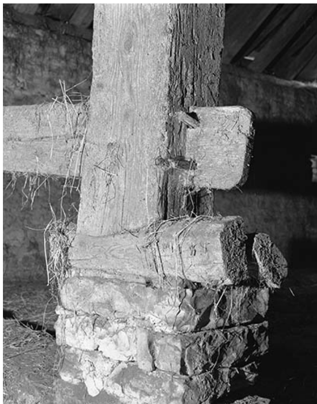
Partie inférieure d'un poteau de charpente au niveau de la partie habitation.

25, Villeneuve-d'Amont, lieudit : la Perrière