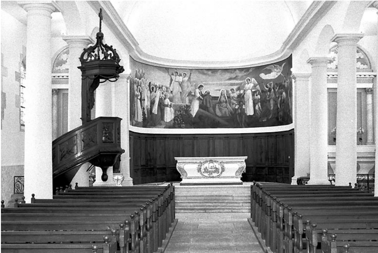
La nef et le chœur vus depuis l'entrée.