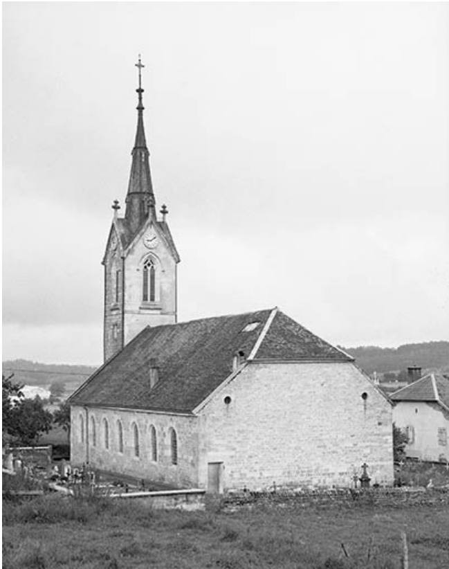
Extérieur : chevet et face latérale droite.