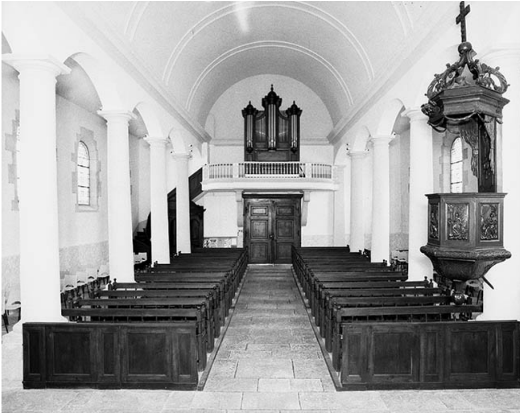
Intérieur : nef depuis le chœur.