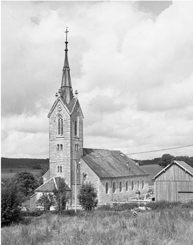
Extérieur : faces antérieure et latérale droite.