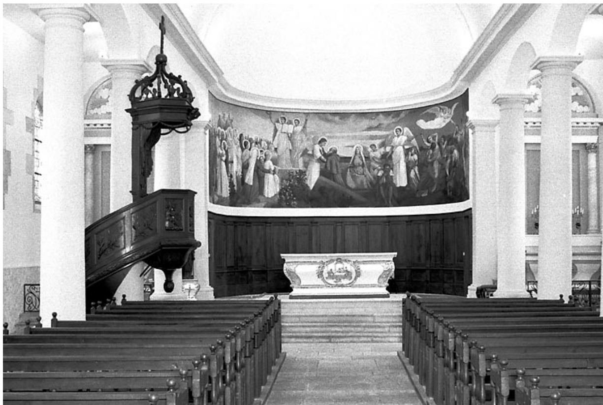
La nef et le chœur vus depuis l'entrée.