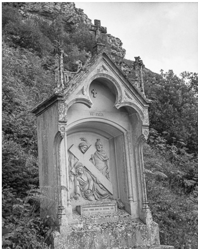
Septième station. 25, Sombacour