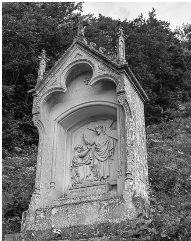
Sixième station. 25, Sombacour