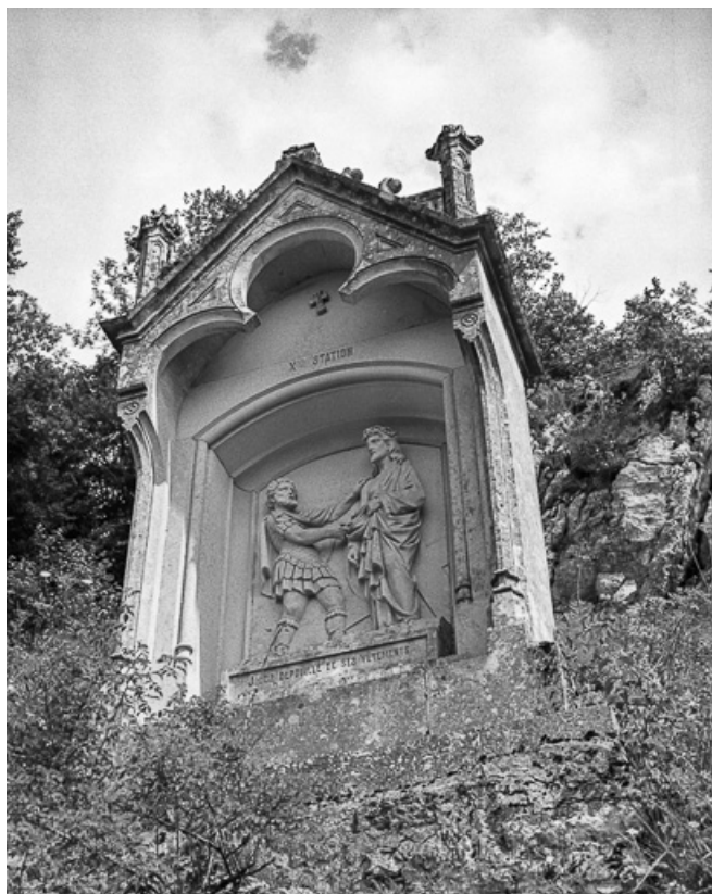
Dixième station. 25, Sombacour