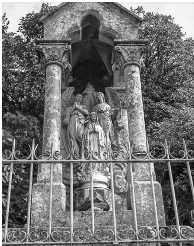
Edicule supérieur vu de face.