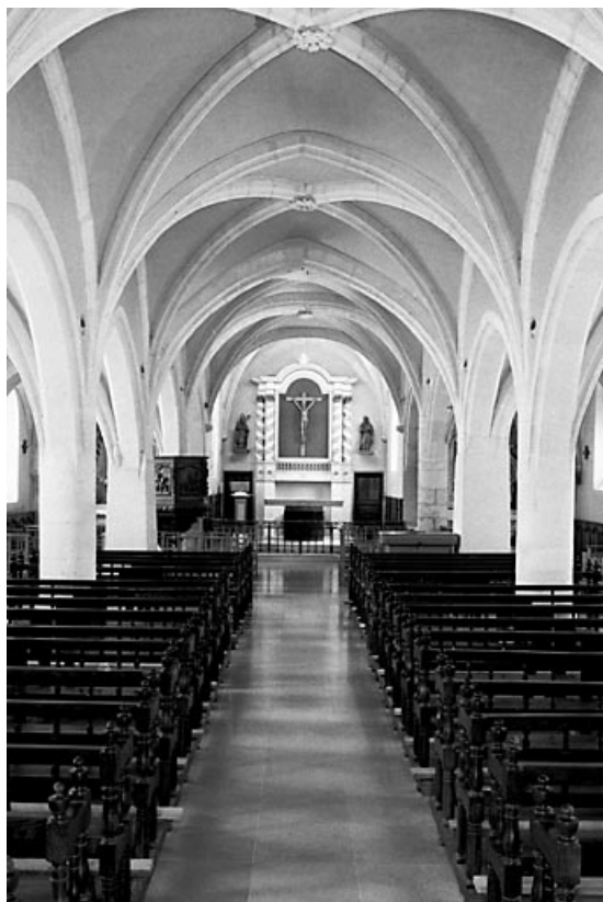
Vue de la nef et du chœur depuis l'entrée.