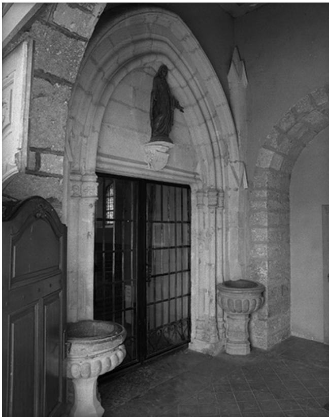
Portail d'entrée depuis la nef. 25, Sombacour rue de l' Eglise