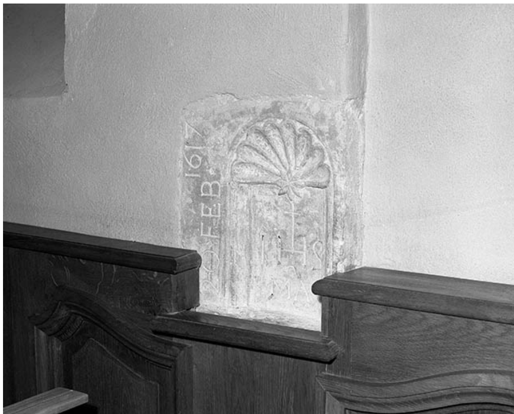
Niche de la 2e travée du collatéral gauche.