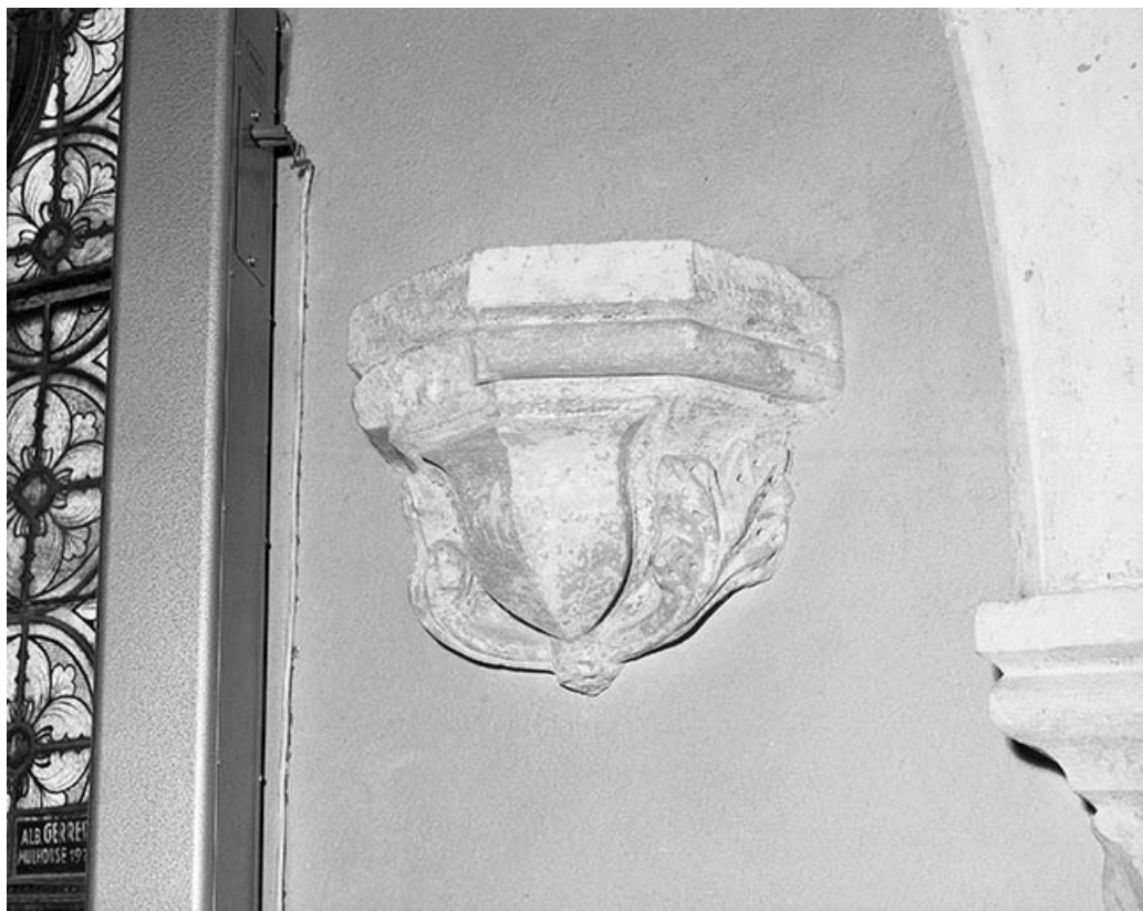
Console dans la 3e travée du collatéral gauche.