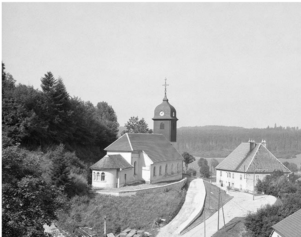
Chevet et face latérale gauche.