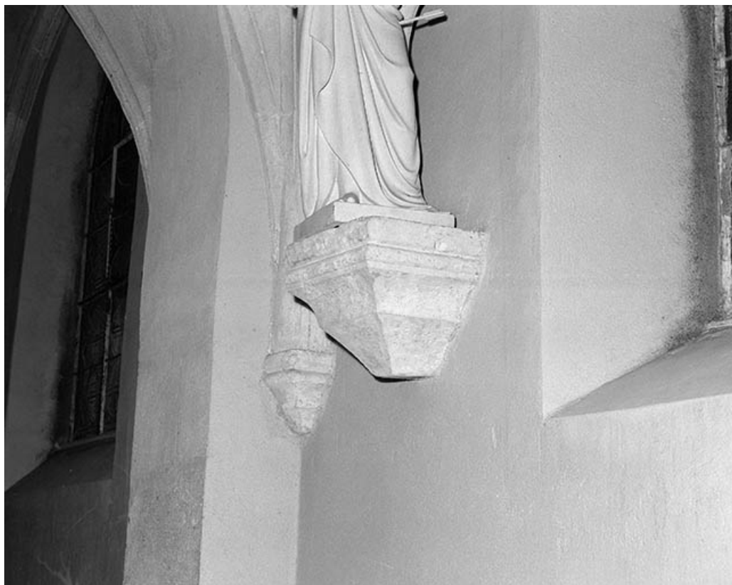
Console dans la 3e travée du collatéral droit.