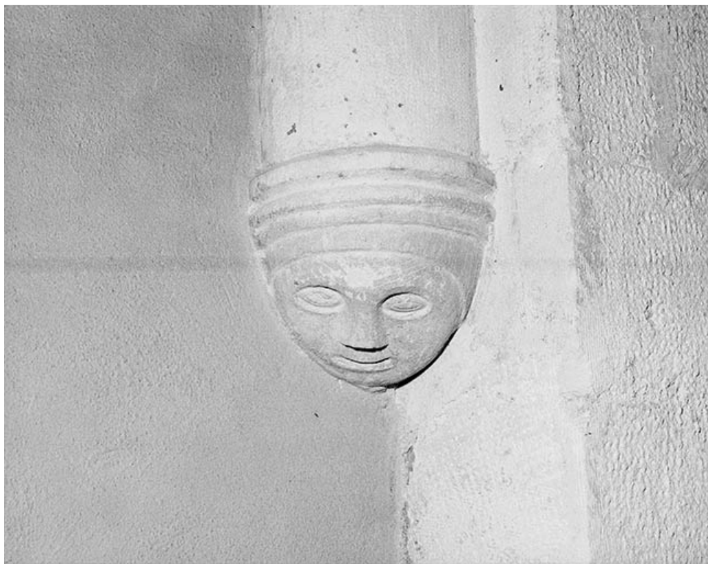
Culot dans la 1ère travée du collatéral gauche.