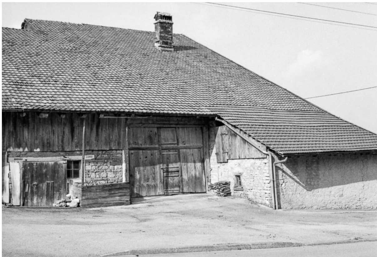
Ferme cadastrée 1962 E 182 : façade latérale droite (?). 25, Sombacour