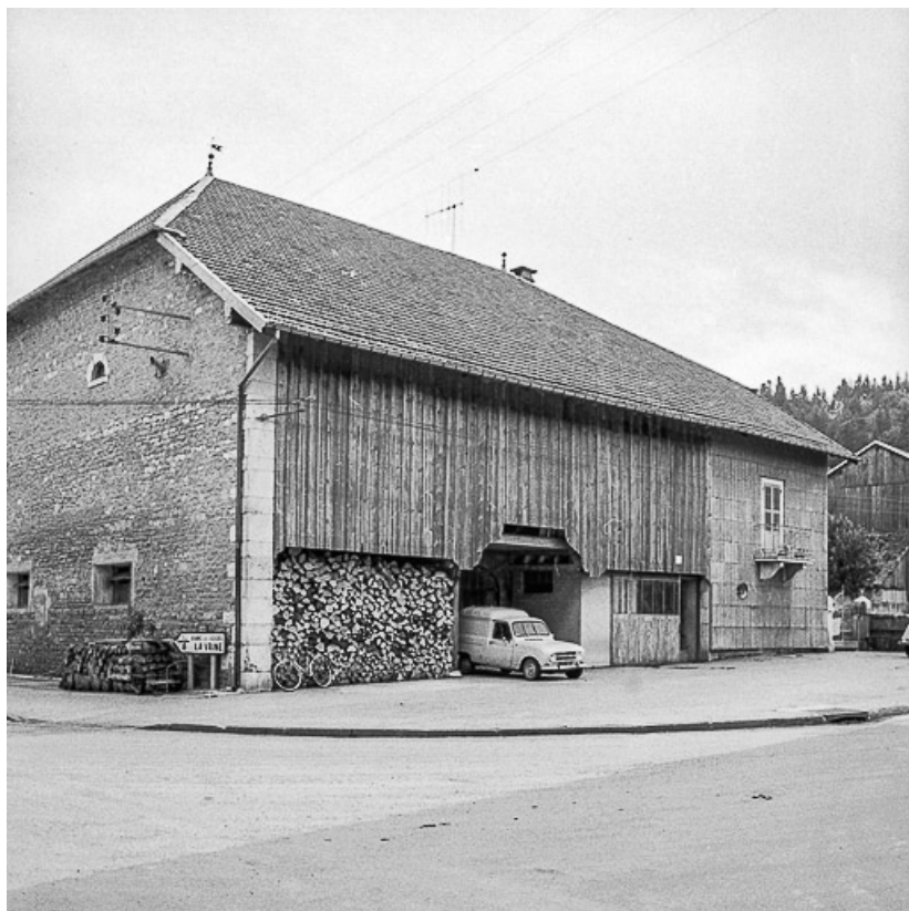
Ferme cadastrée 1962 E 281 bis : façade latérale gauche. 25, Sombacour