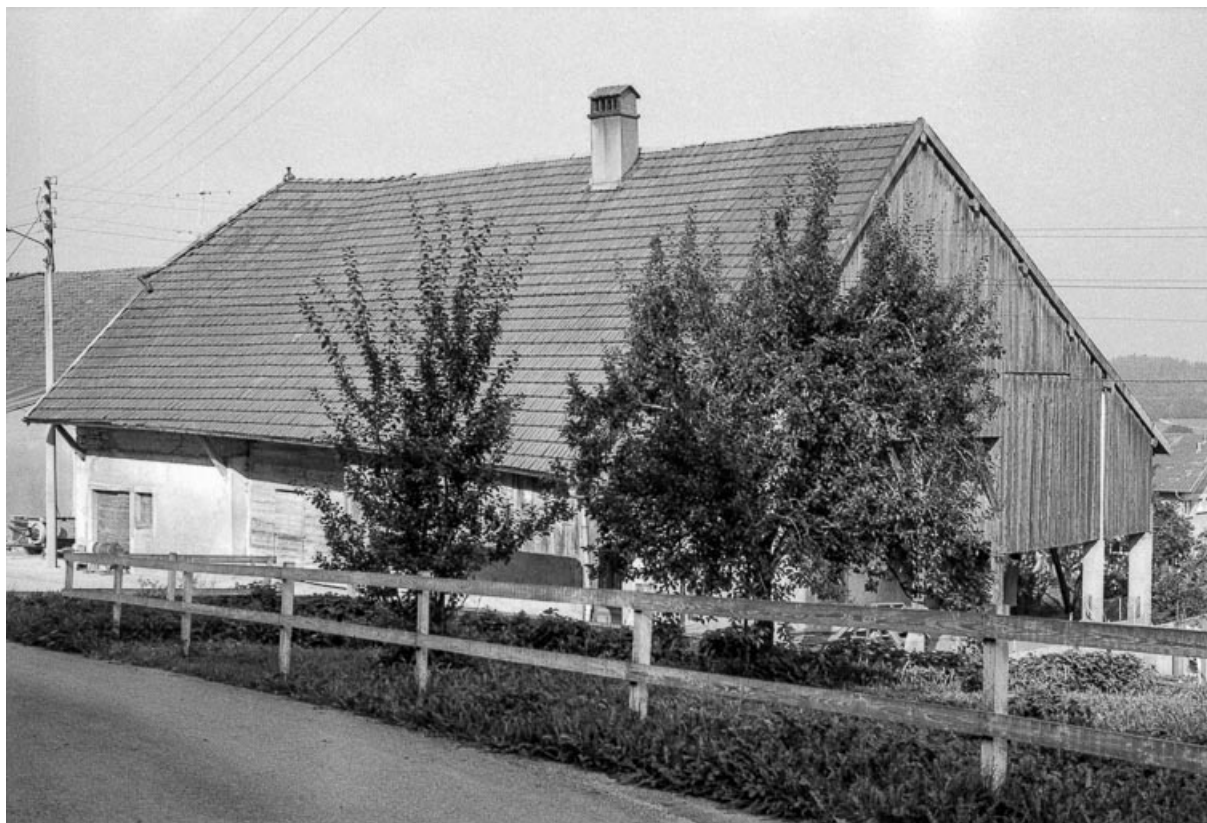
Ferme cadastrée 1962 E 189 : vue d'ensemble. 25, Sombacour