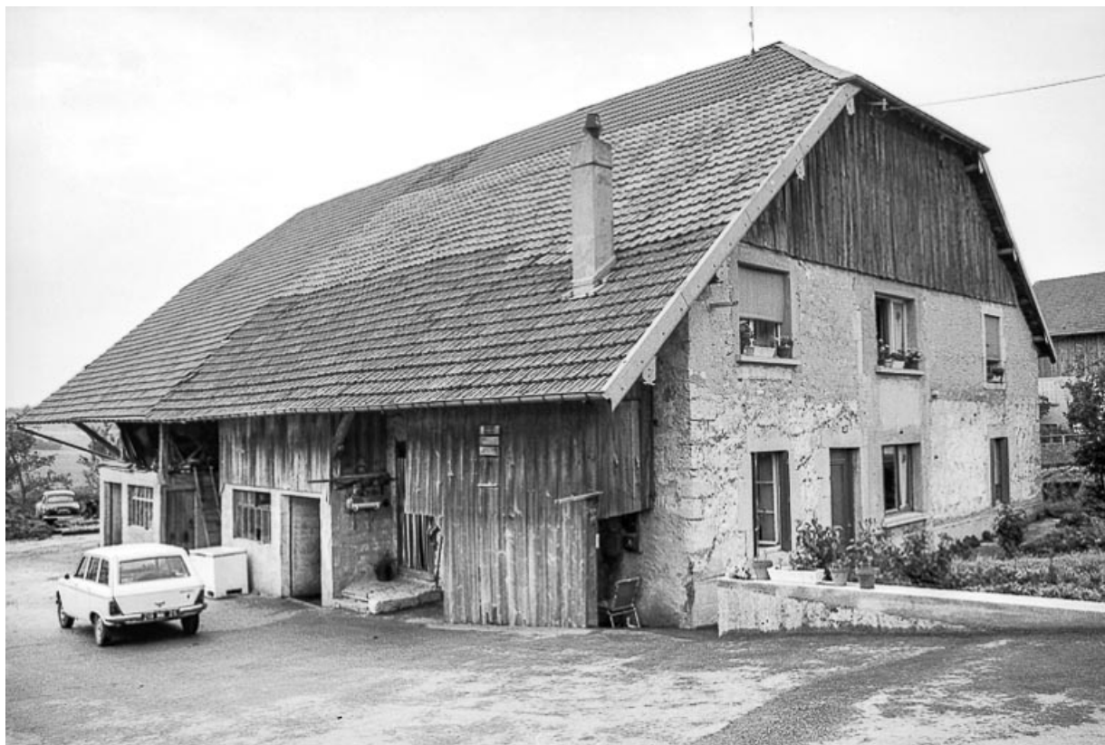
Ferme cadastrée 1962 E 107 : façade antérieure et latérale gauche. 25, Sombacour