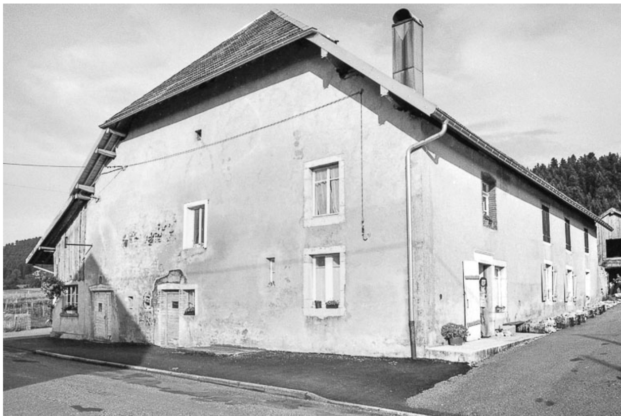
Ferme cadastrée 1962 E 109 : façade sur rue. 25, Sombacour