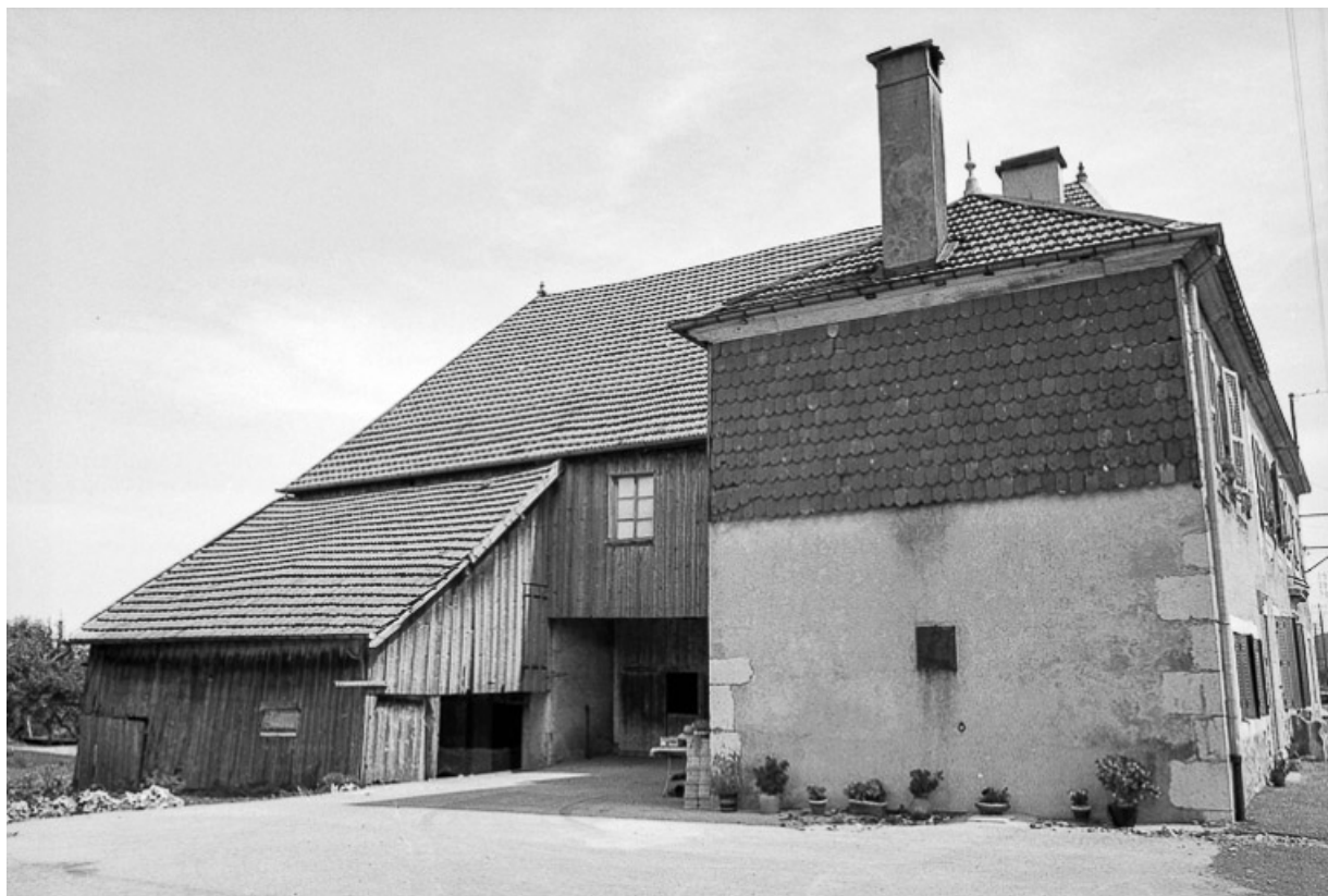
Ferme cadastrée 1962 E 80 : façade postérieure. 25, Sombacour