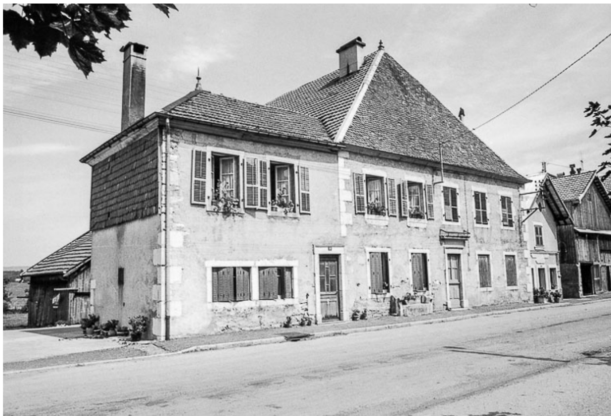
Ferme cadastrée 1962 E 80 : façade sur rue. 25, Sombacour