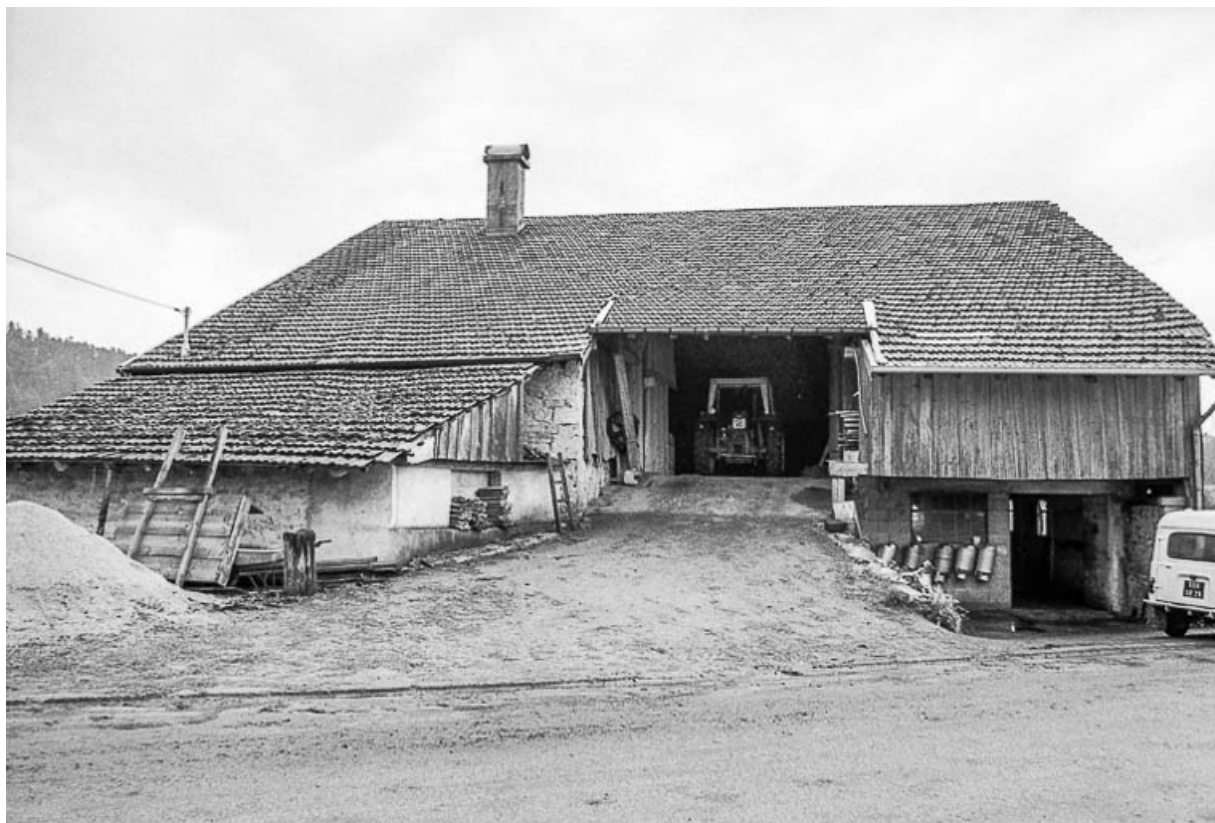
Ferme cadastrée 1962 E 11 : façade sur rue. 25, Sombacour