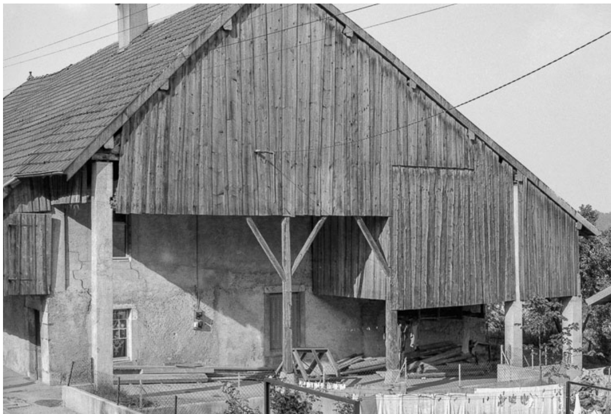
Ferme cadastrée 1962 E 189 : façade latérale droite. 25, Sombacour