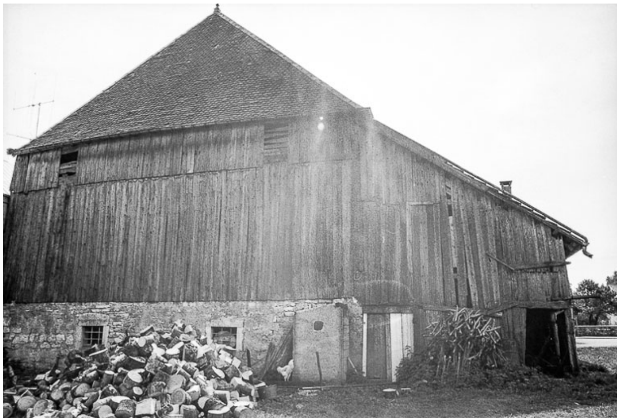
Ferme cadastrée 1962 E 80 : façade latérale (?). 25, Sombacour