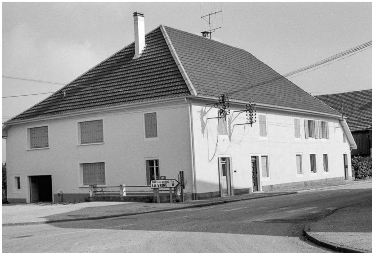
Ferme : façade antérieure et latérale gauche. 25, Sombacour