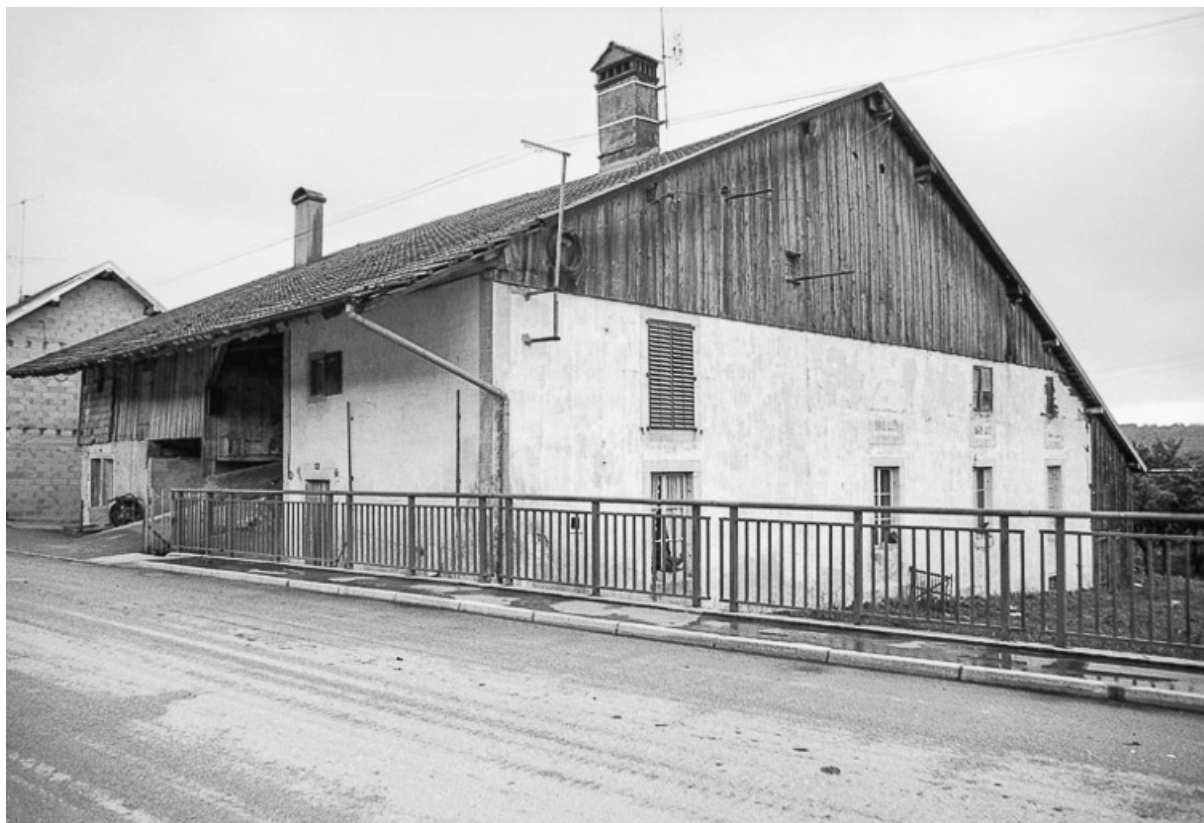
Ferme cadastrée 1962 E 106, 346-347 : façade antérieure et latérale gauche. 25, Sombacour