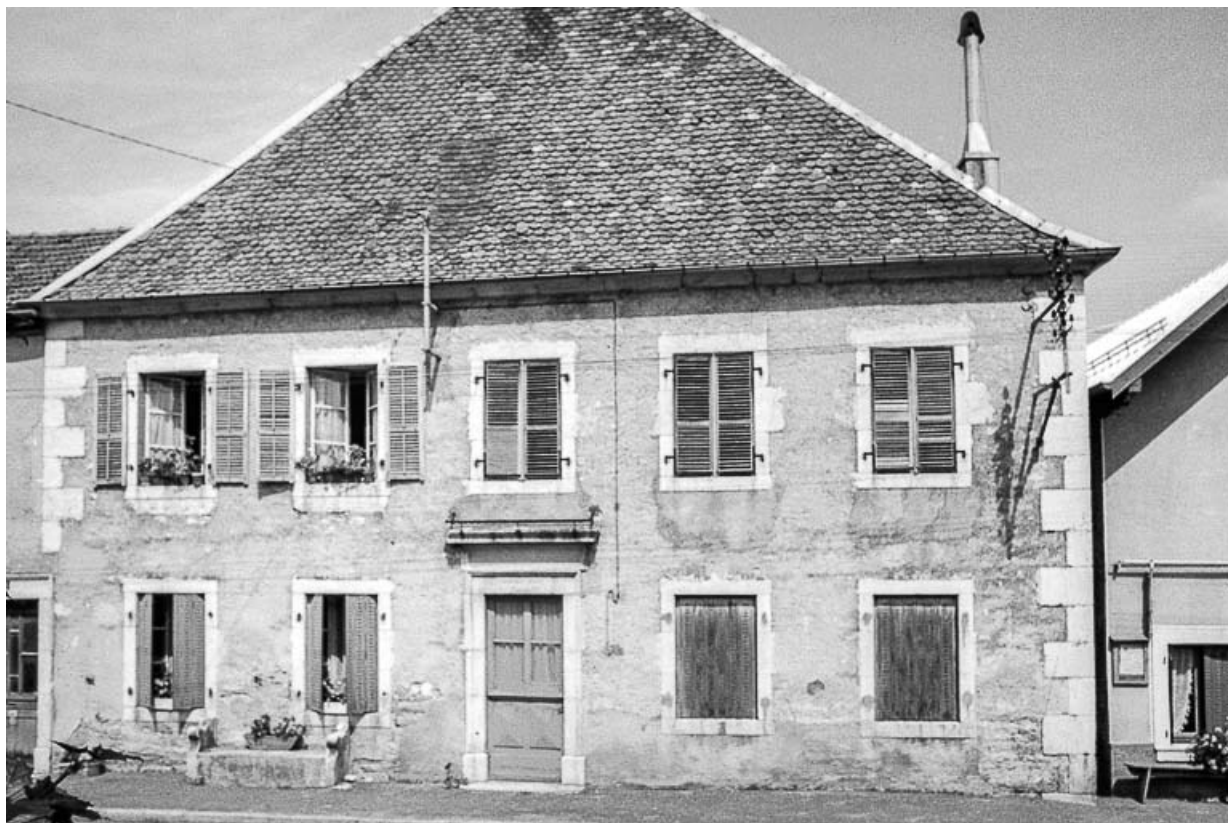
Ferme cadastrée 1962 E 80 : façade antérieure. 25, Sombacour