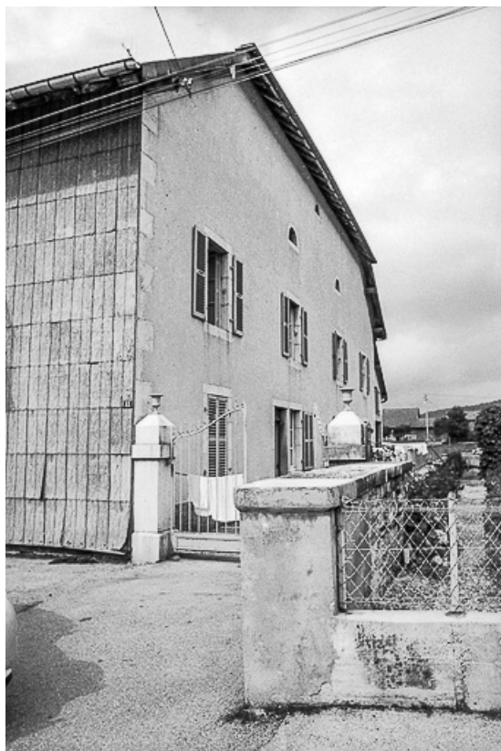
Ferme cadastrée 1962 E 281 bis : façade antérieure. 25, Sombacour