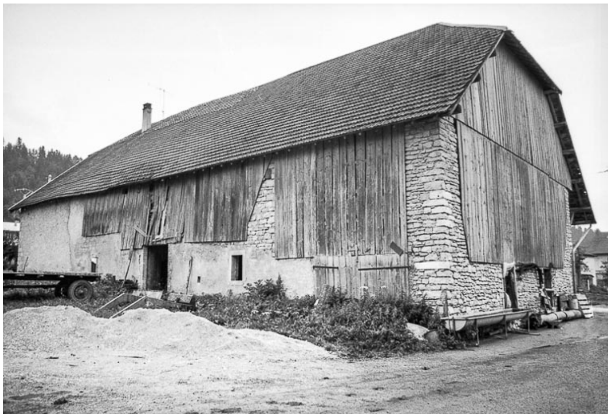
Ferme cadastrée 1962 E 107 : façades postérieure et latérale droite. 25, Sombacour