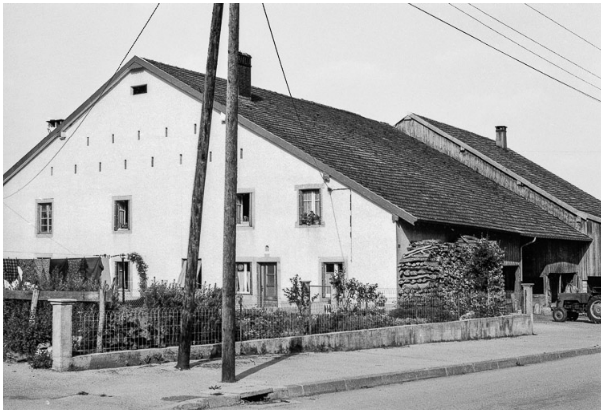
Ferme cadastrée 1962 E 174-175 : façades antérieure et latérale droite. 25, Sombacour