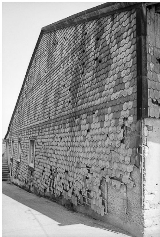
Ferme cadastrée 1962 E 106, 346-347 : façade avec tavaillons. 25, Sombacour