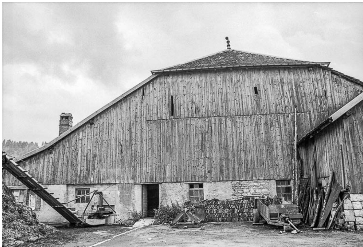
Pignon postérieur. 25, Sombacour