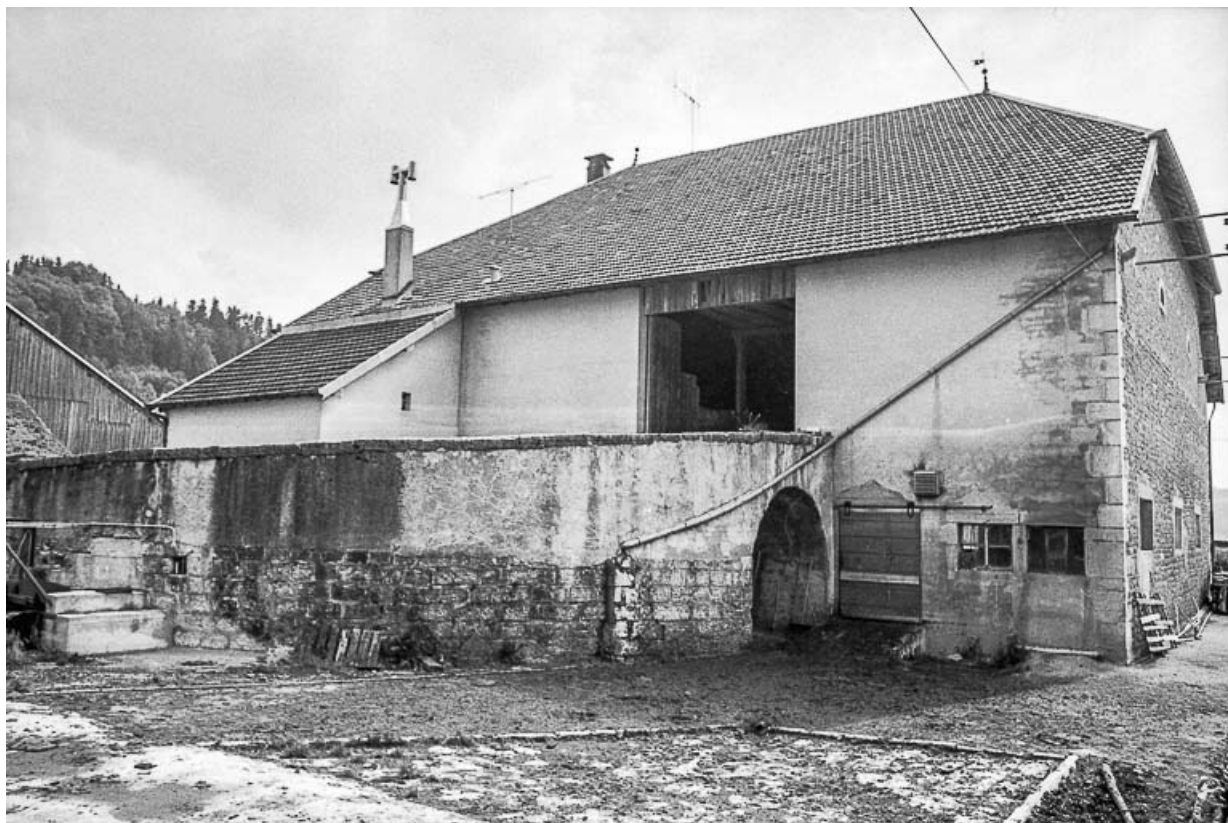
Ferme cadastrée 1962 E 281 bis : façade latérale droite. 25, Sombacour