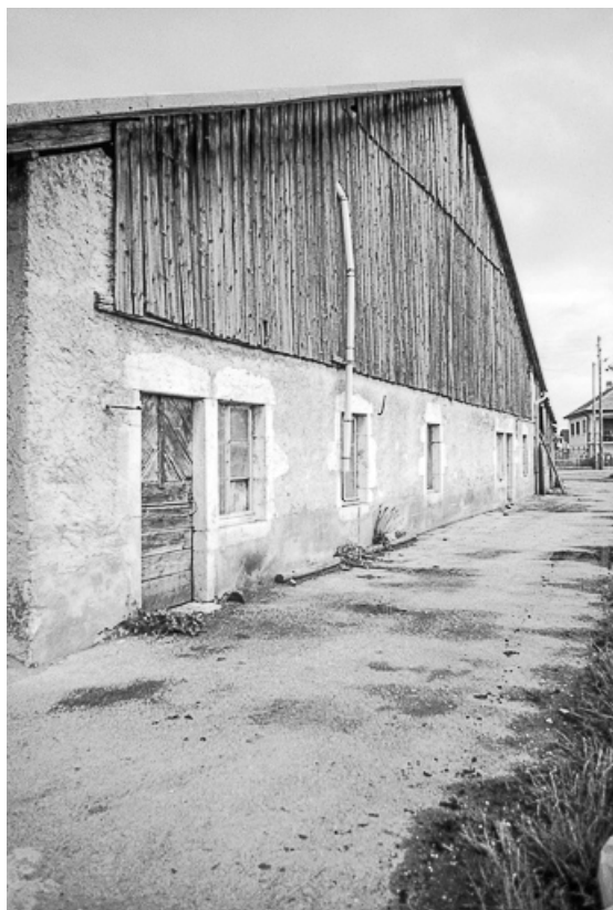
Ferme cadastrée 1962 E 11 : façade antérieure. 25, Sombacour