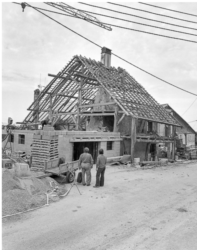
Ferme en cours de rénovation ve de la charpente. 25, Sombacour