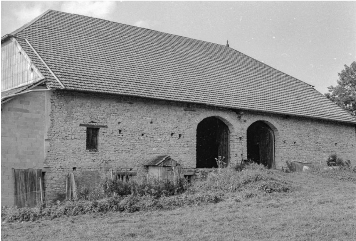
Entrées de granges geminées.