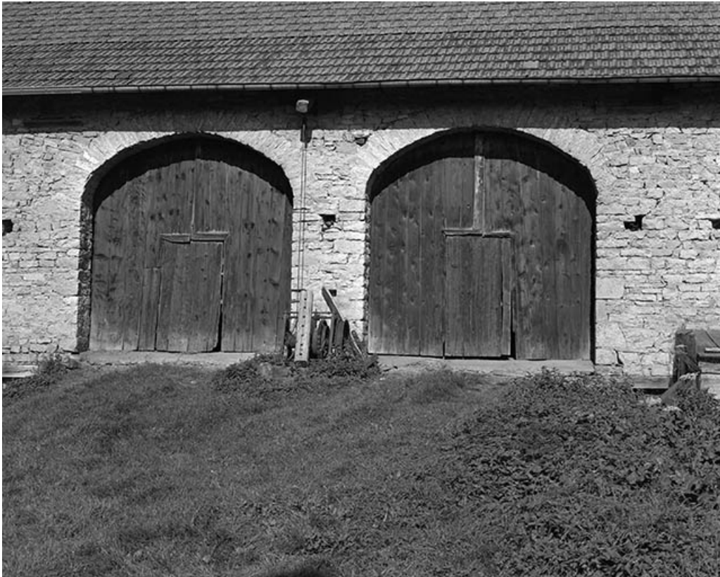
Entrées de granges geminées.