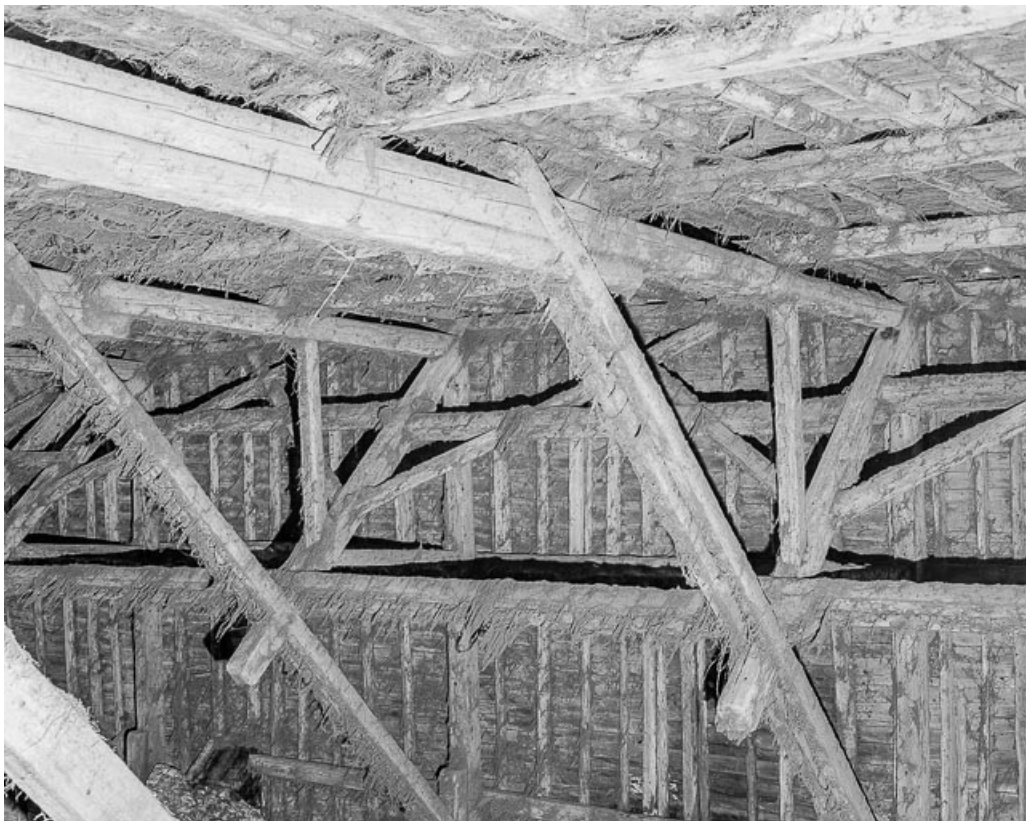
Charpente, partie supérieure.