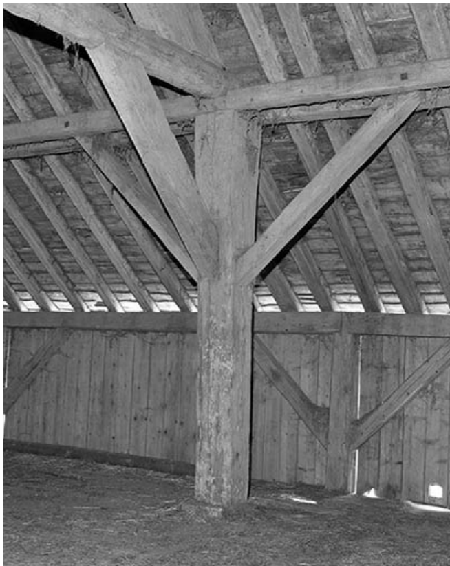
Charpente, partie inférieure au niveau d'une ferme.