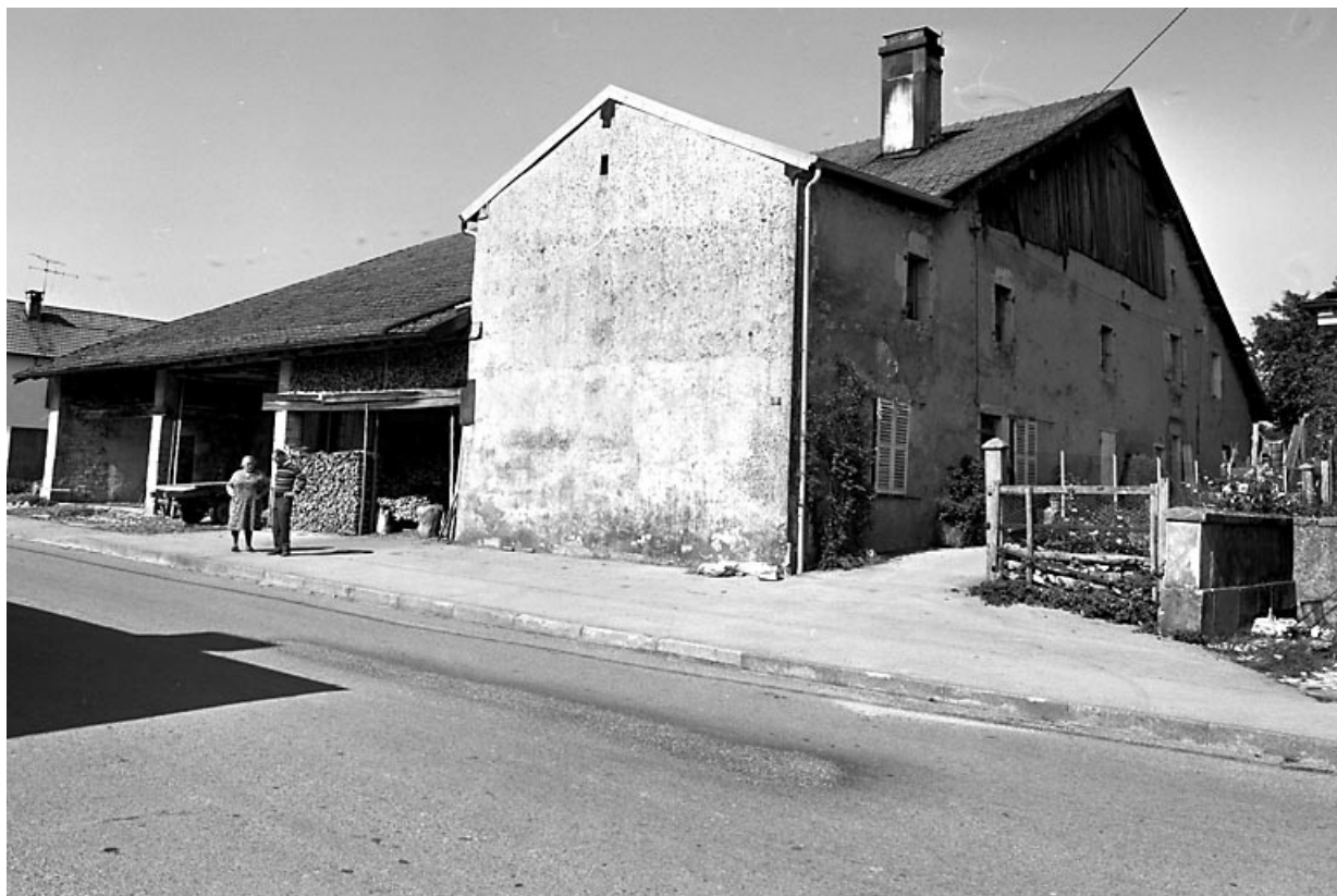
Vue d'ensemble de trois quarts.