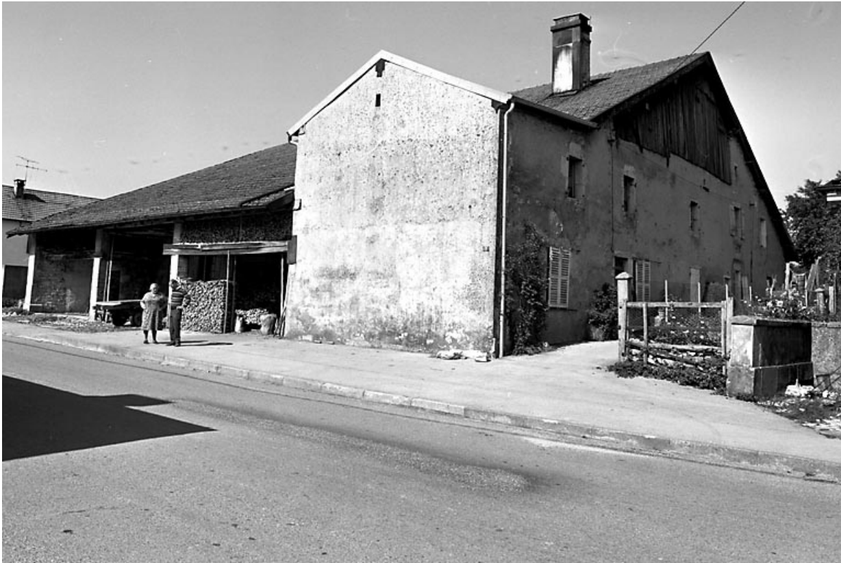
Vue d'ensemble de trois quarts.