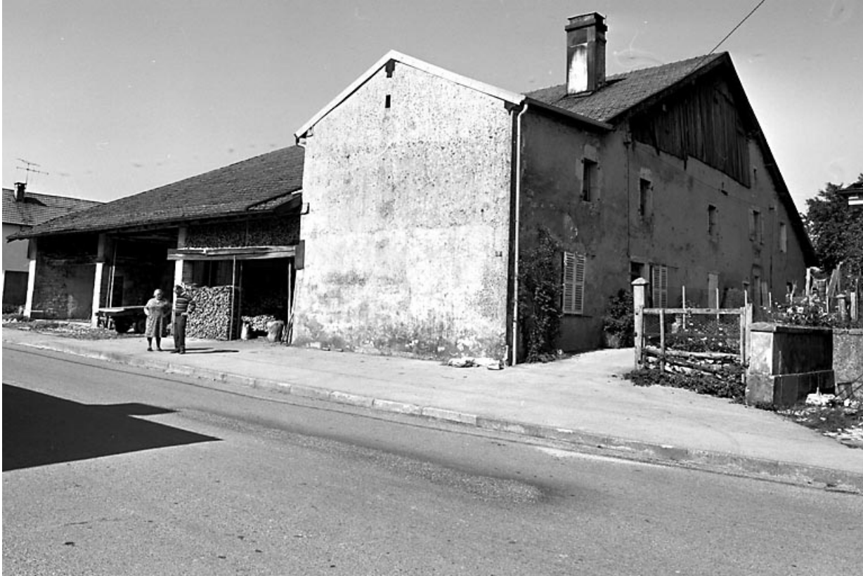
Vue d'ensemble de trois quarts.