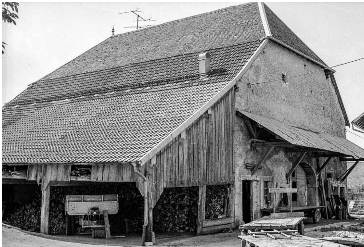
Ferme cadastrée 1972 ZM 62a : façades postérieure et latérale droite 25, Évillers