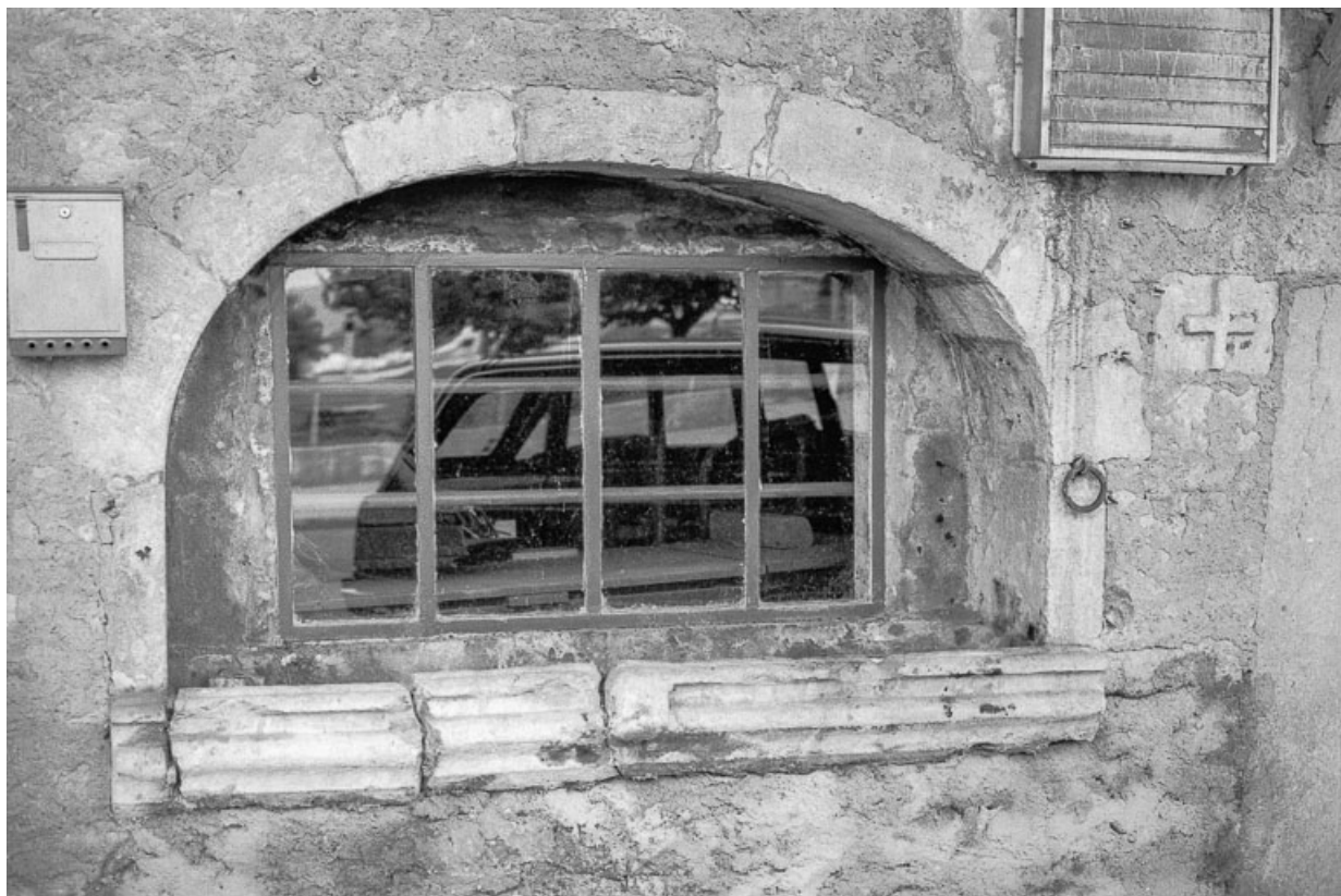
Fenêtre de l'écurie avec mangeoire.