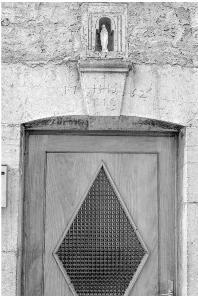
Ferme cadastrée 1945 D 128-129 : inscriptions et dates sur linteau de porte, niche. 25, Septfontaines