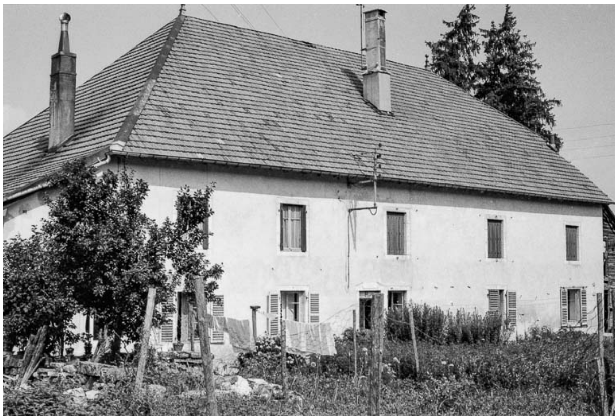
Ferme cadastrée 1964 D 25, 31, 31 bis, 33 : façade antérieure.