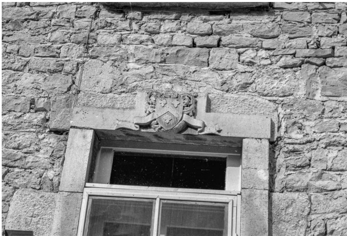
Blason au- dessus de la porte d'entrée.