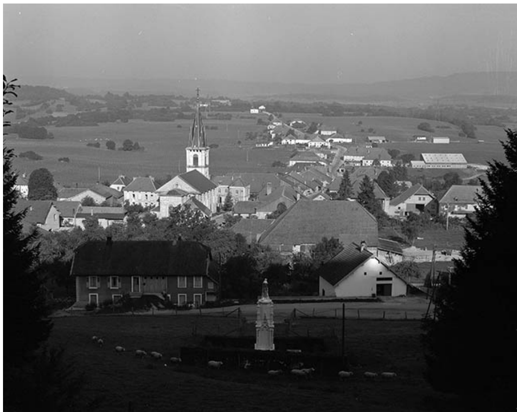
Vue générale du village.