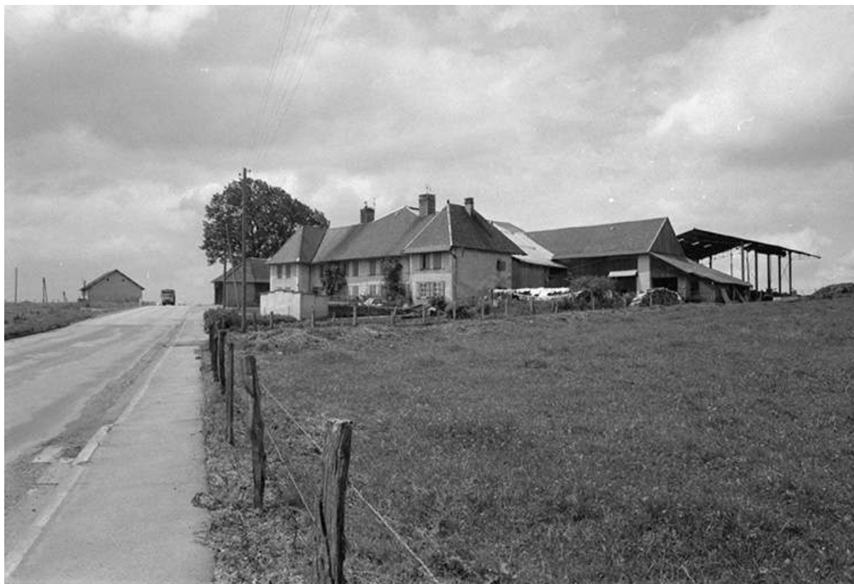
Ferme située 1 Grande Rue : vue d'ensemble.