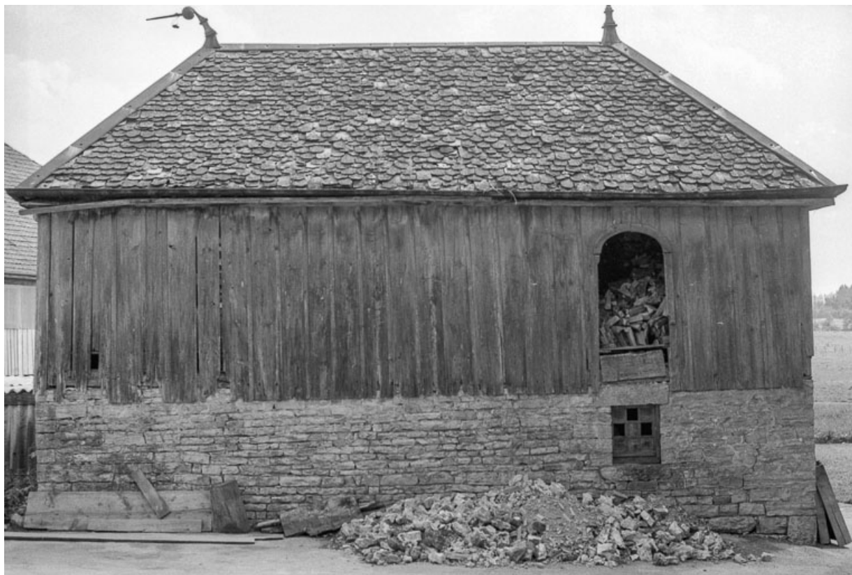
Bûcher isolé, rare dans le canton.