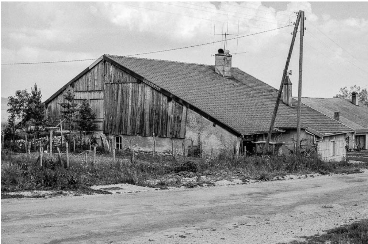
Ferme située 32 rue de Salins : façades latérale et postérieure avec débord de la partie habitation, pignon fermé par des planches et montée de grange.