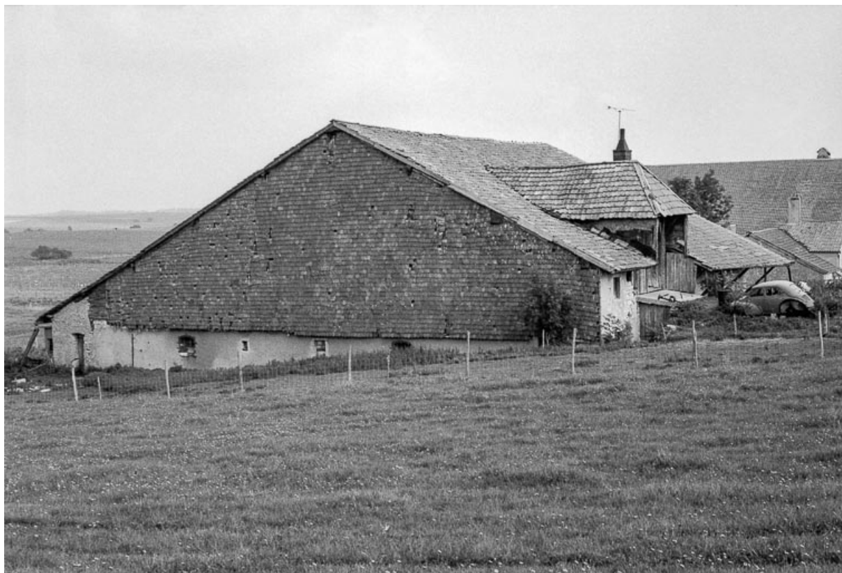
Ferme : pignon essenté de petites tuiles et grange haute.