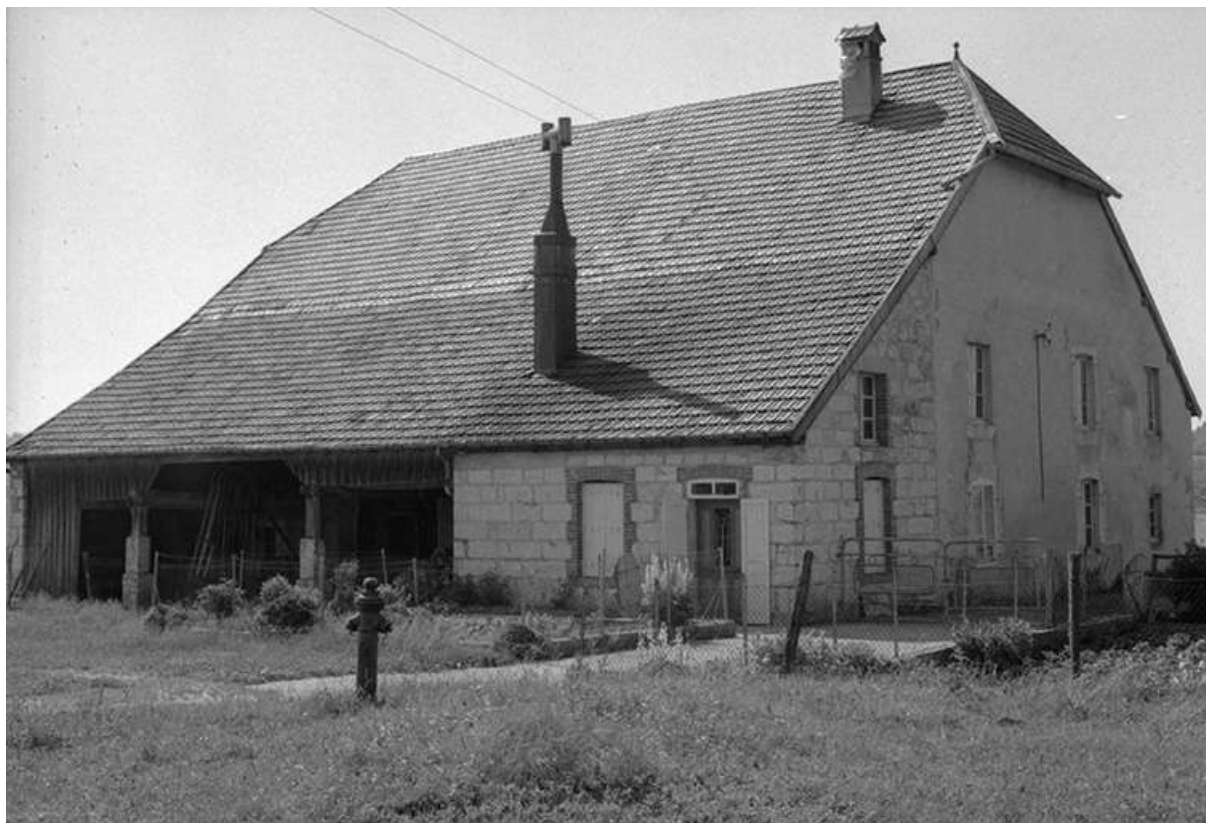
Ferme située rue de Cuvier, cadastrée 1975 ZE 2a, datée du 19e siècle : vue de trois quarts droit.