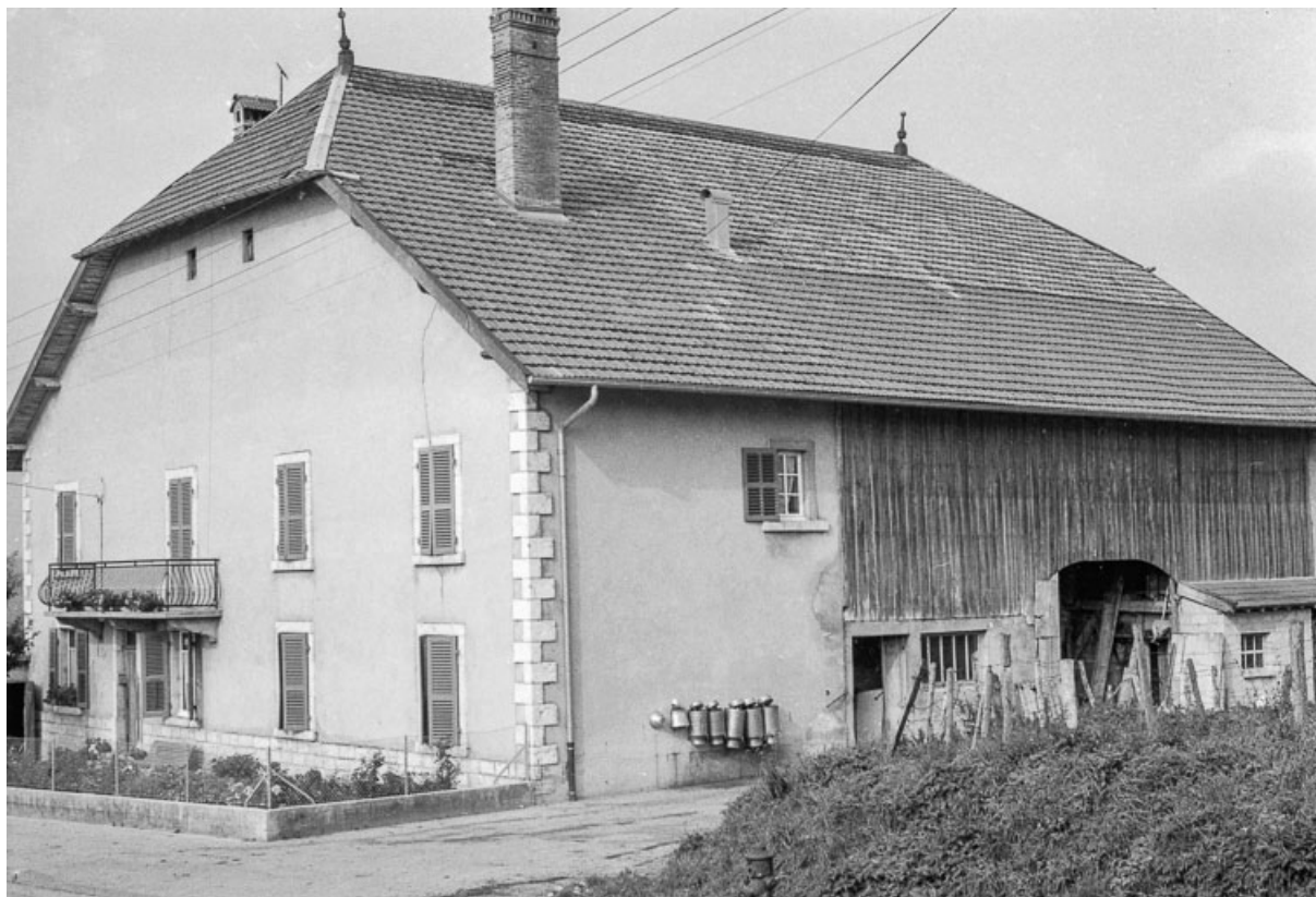
Ferme haute datée de 1814 : vue d'ensemble.