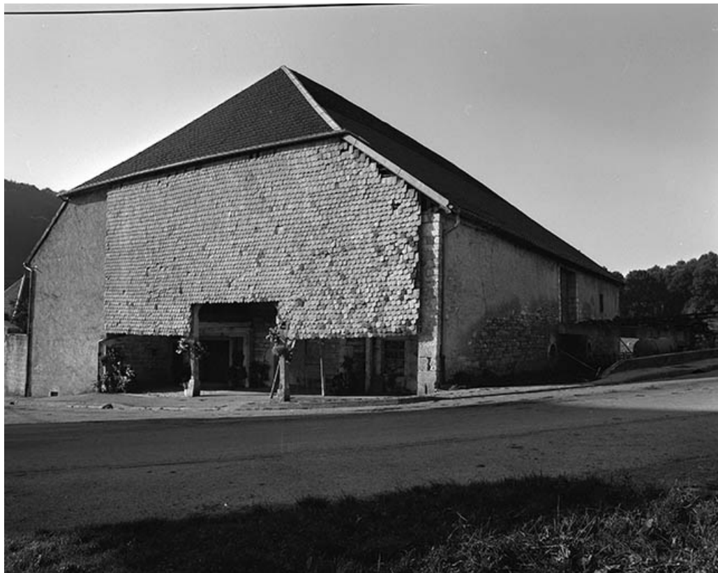
Façade latérale droite sur rue.