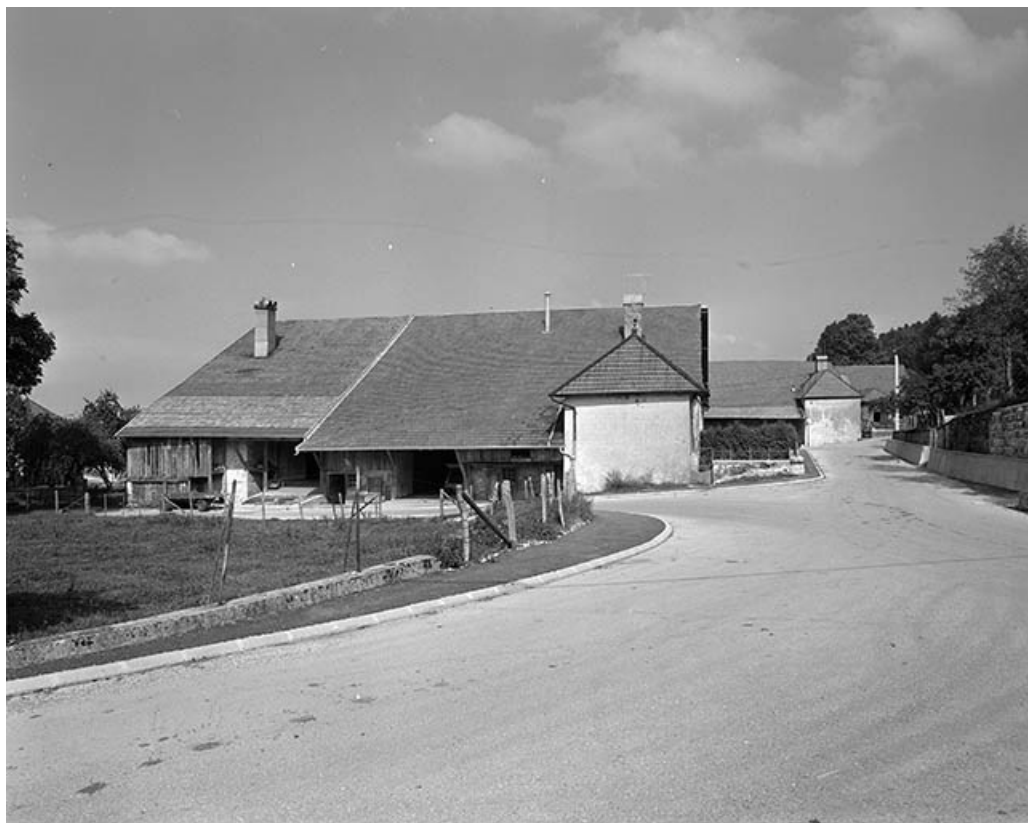
Vue d'ensemble des fermes.