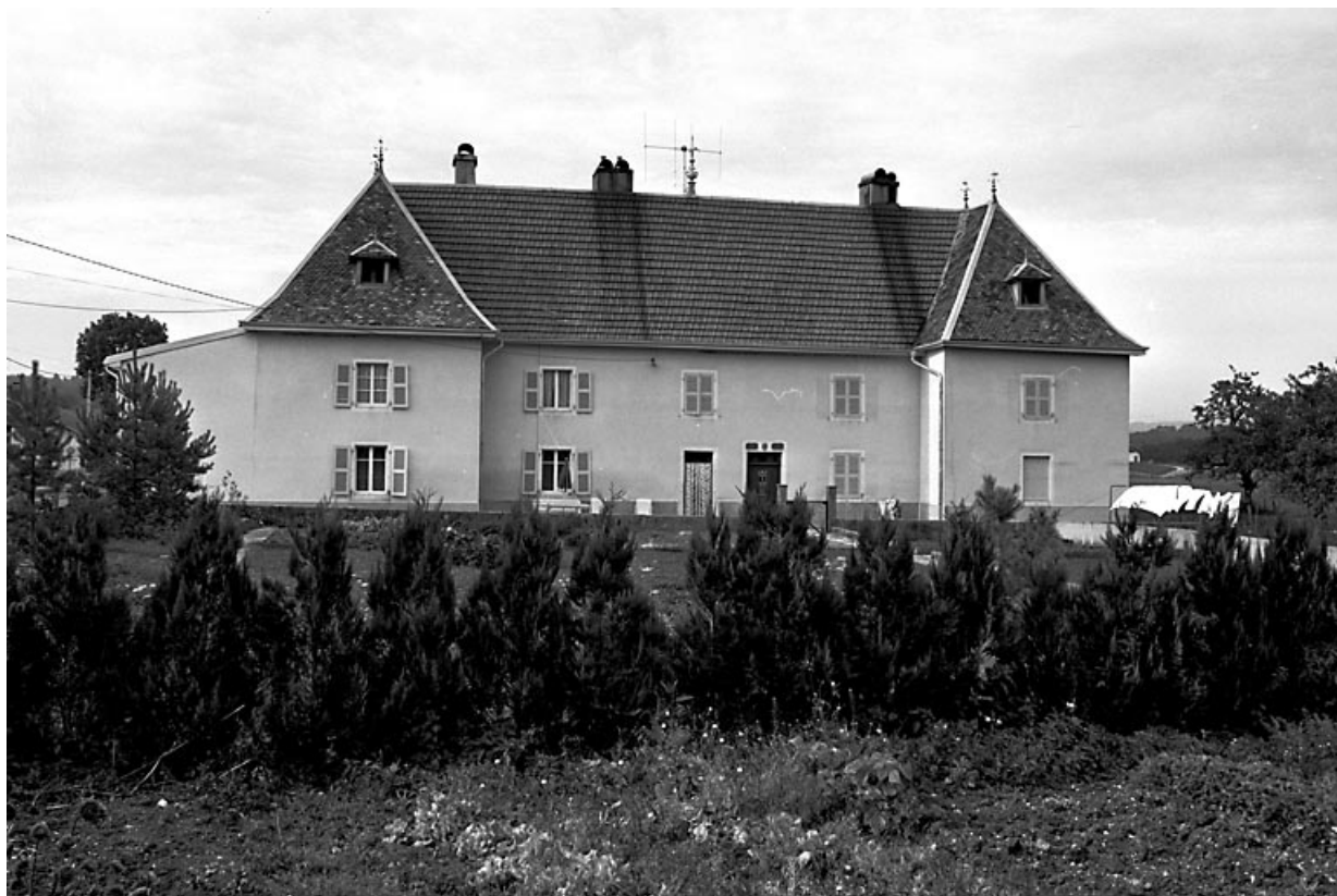
Façade de la partie d'habitation traitée en façade de "château". 25, Sombacour