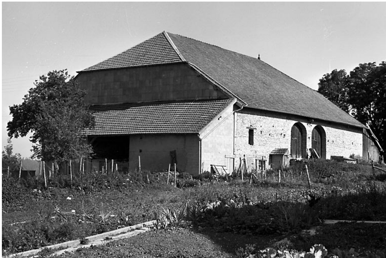
Vue d'ensemble. 25, Septfontaines