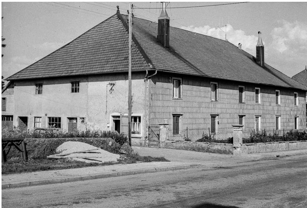
Ferme double datée de 1885, cadastrée 1938 F 140-145 : façades antérieure et latérale gauche.