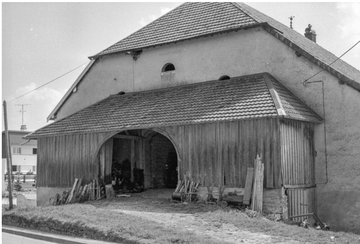
Ferme située 66 Grande Rue : entrée de la grange haute surmontée par une construction en bois. 25, Évillers