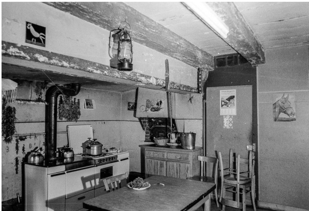
Cuisine : poutre supportant la cheminée.

25, Villers-sous-Chalamont, lieudit : Montorge