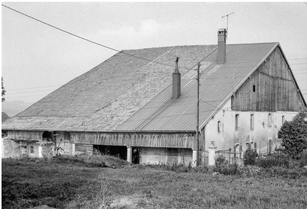
Façades antérieure et latérale gauche sur rue.