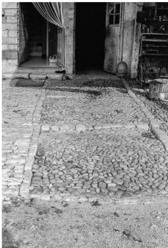
Ferme : entrée pavée de l'allée centrale destinée aux chevaux.