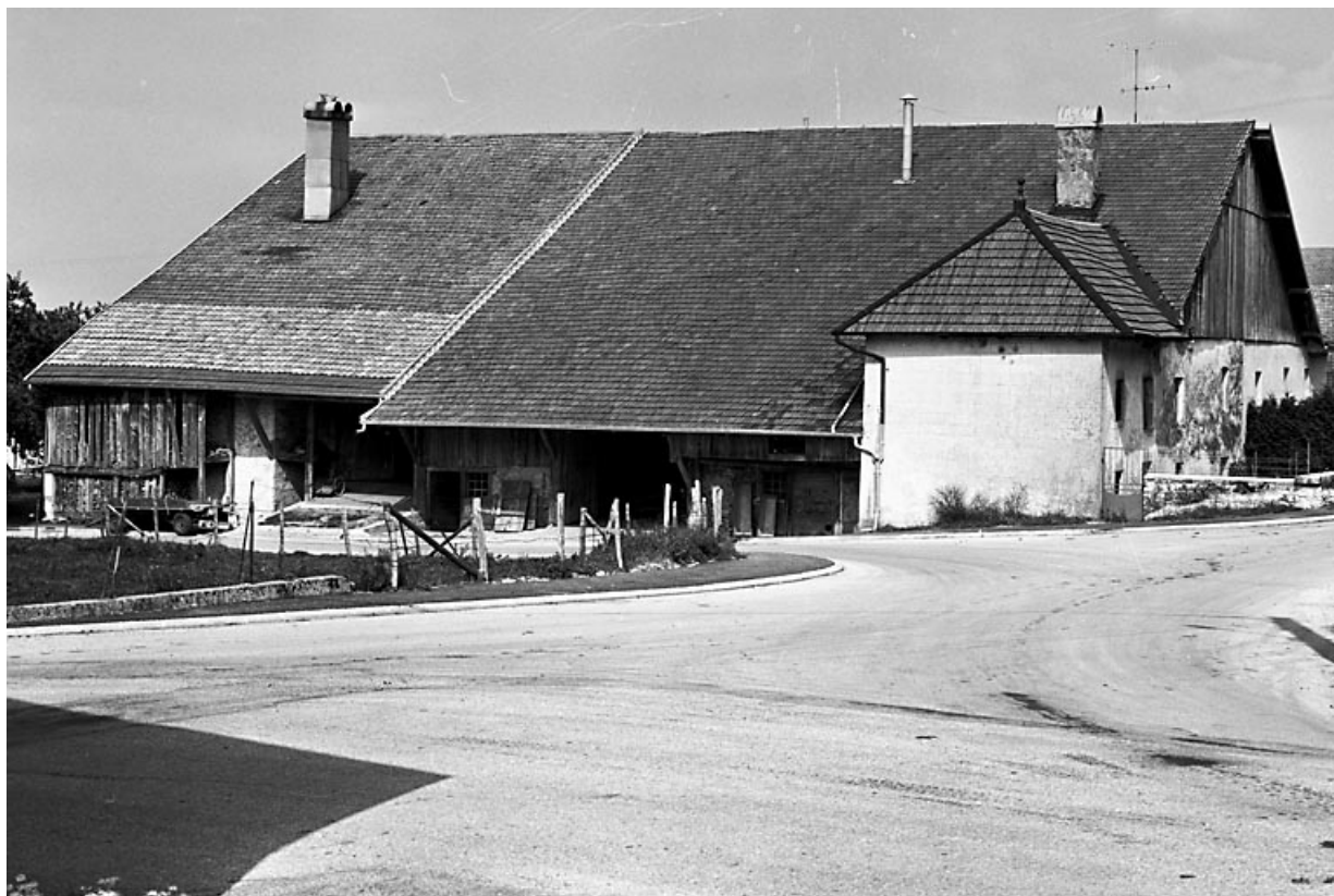
Vue d'ensemble de trois quarts droit. 25, Goux-les-Usiers