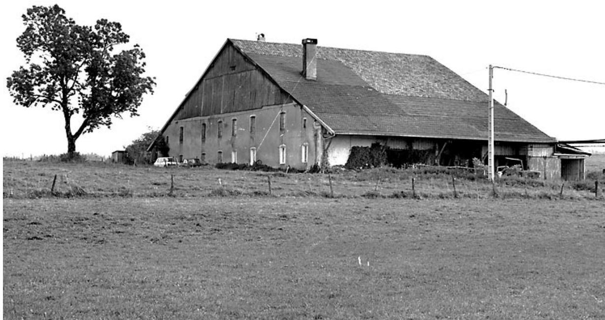
Vue du pignon d'habitation et du mur gouttereau.