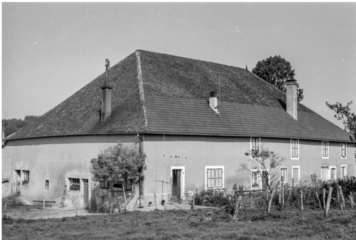
Ferme cadastrée 1961 AC 128 : façades antérieure et latérale gauche. 25, Villeneuve-d'Amont