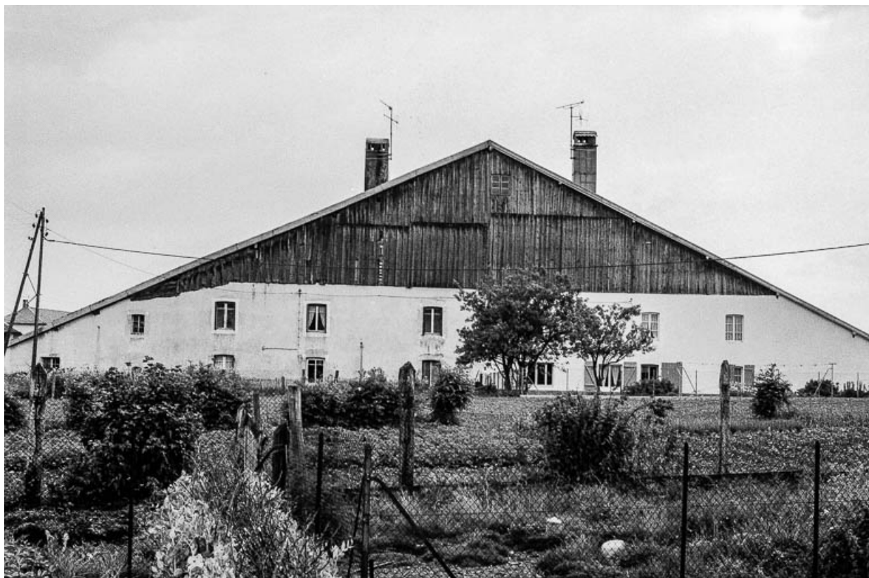
Ferme cadastrée 1975 F1 84-86, datée des 18e et 19e siècles : vue d'ensemble.