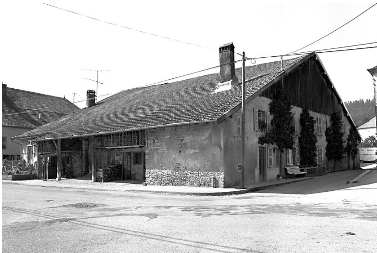
Vue de trois quarts gauche. 25, Évillers