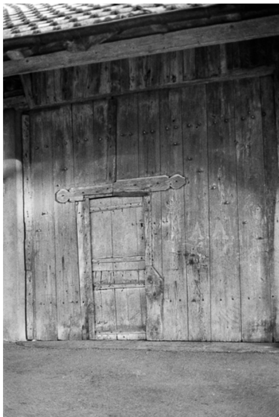
Ferme : porte de grange.