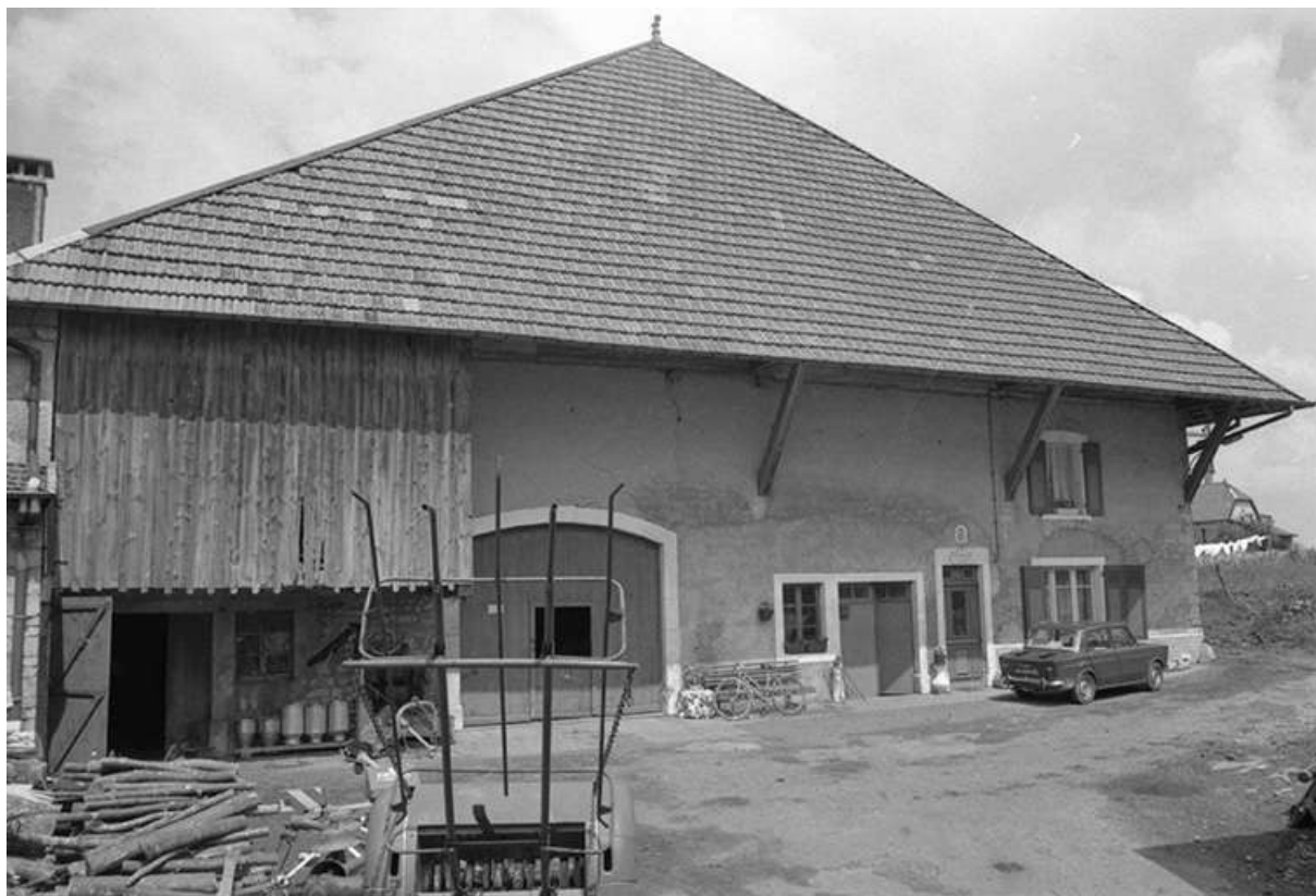
Ferme cadastrée 1934 C 126-127, située rue de la Chapelle, datée de 1748 : façade latérale gauche.