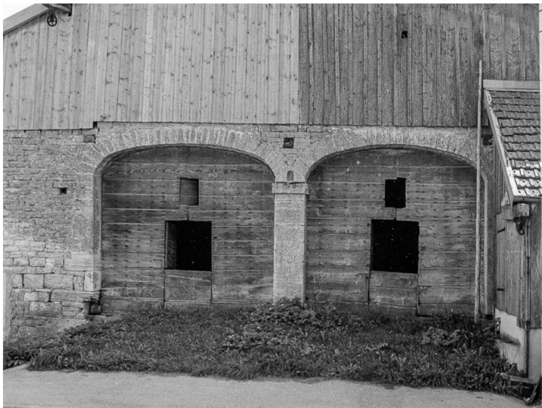
Ferme cadastrée 1972 ZM 90a-91a : entrées des granges jumelées. 25, Évillers