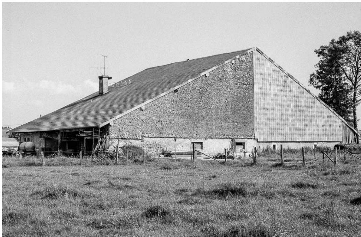
Ferme cadastrée 1938 E 266-267 : façade postérieure.