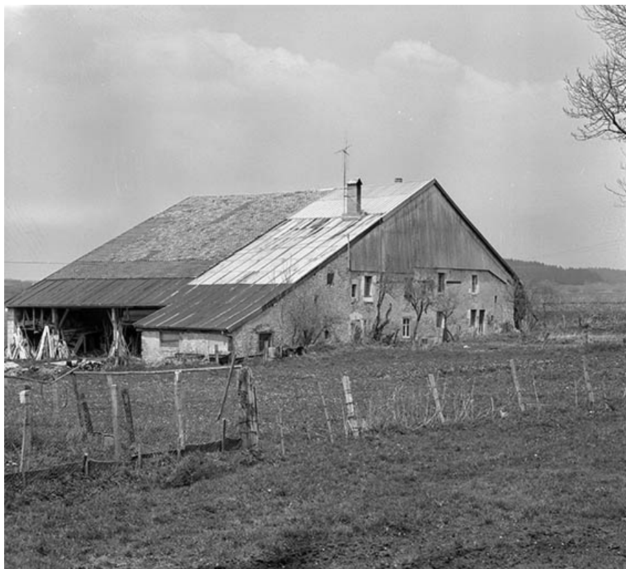
Extérieur : vue d'ensemble.