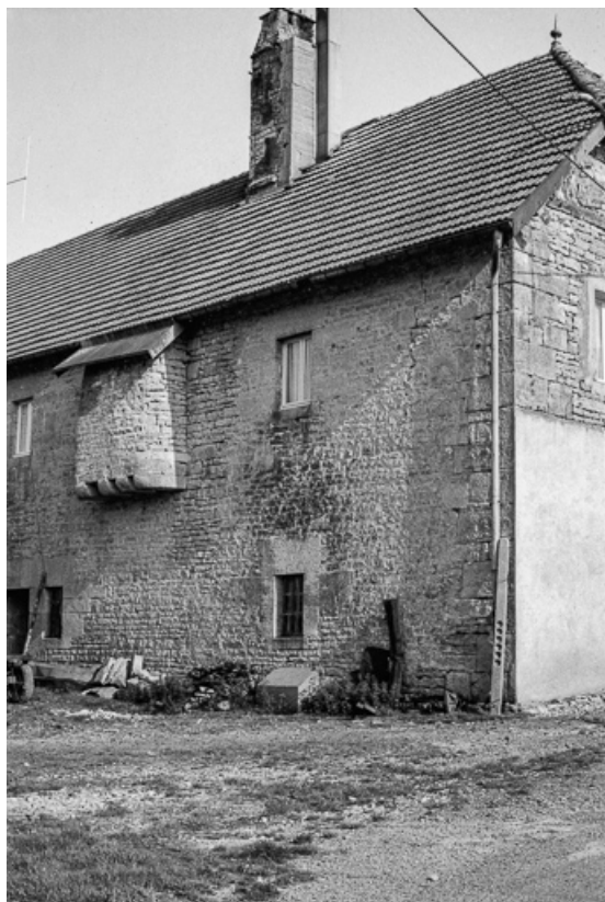
Partie droite de la façade postérieure avec le cul-du-four extérieur suspendu. 25, Villeneuve-d'Amont, lieudit : Lioche