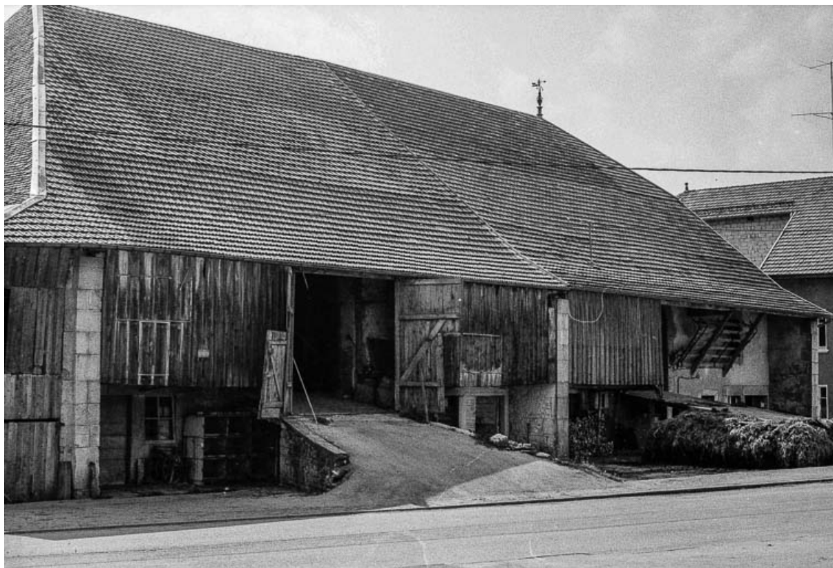
Ferme cadastrée 1972 ZM 63a-64a : façade à long-pan sur rue. 25, Évillers