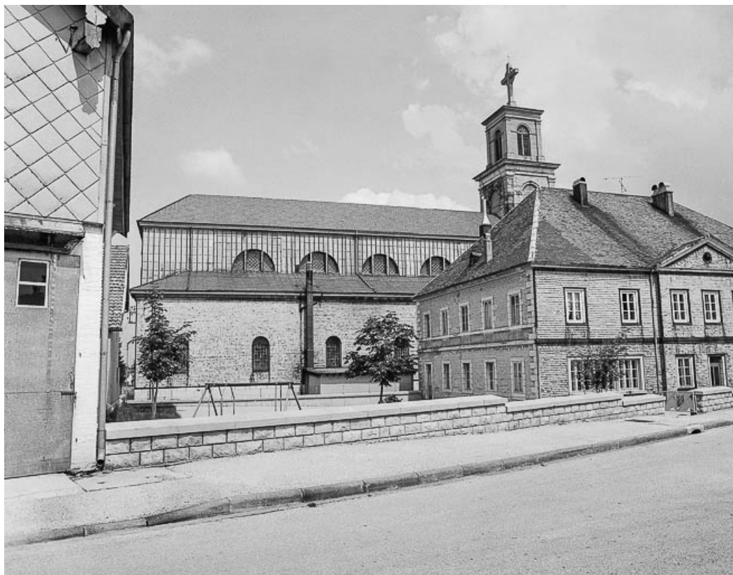
Extérieur : face latérale gauche.

25, Frasne, lieudit : place de l' Eglise