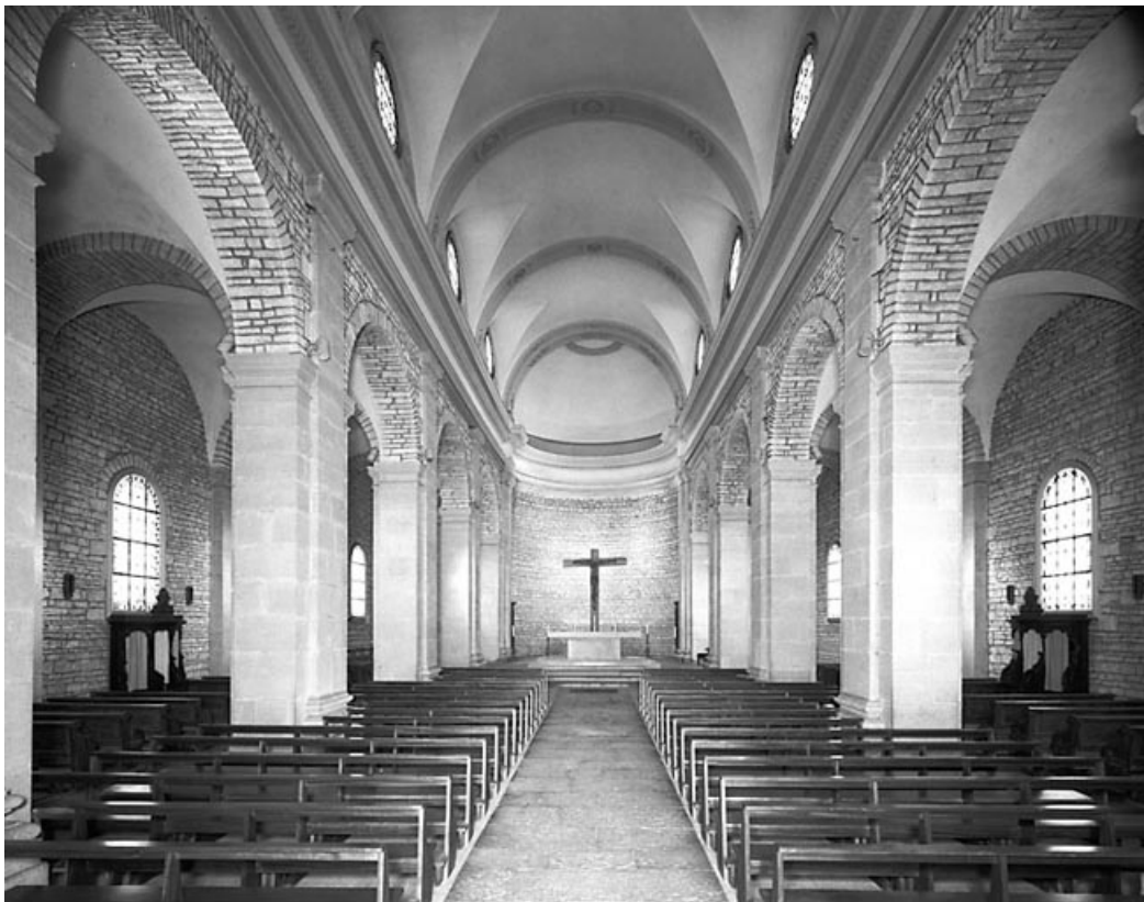
La nef et le chœur vus depuis l'entrée.

25, Frasne, lieudit : place de l' Eglise