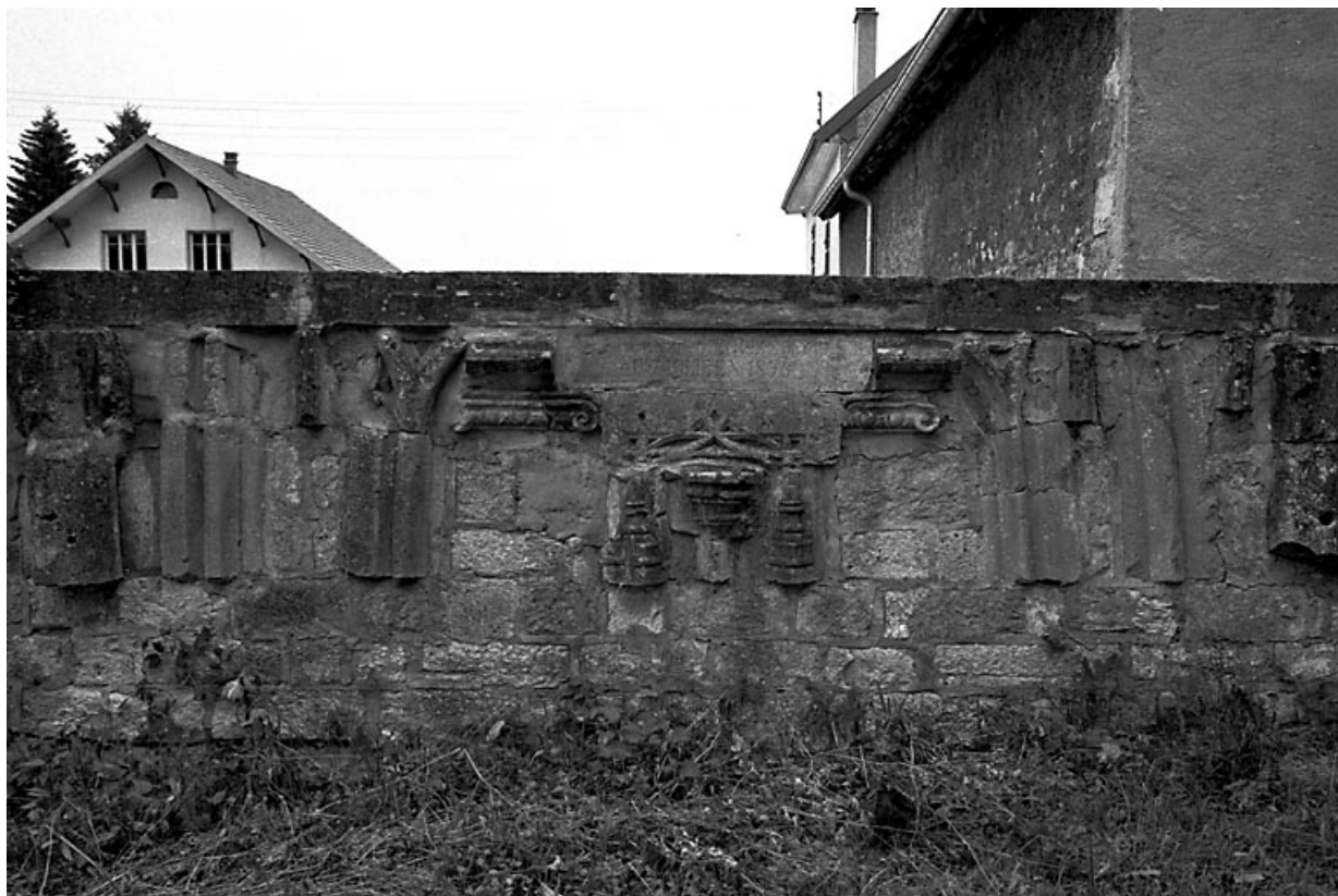
Vestiges de l'ancienne église, insérés dans le mur d'enclos du presbytère.

25, Frasne, lieudit : rue de la Vieille-Eglise