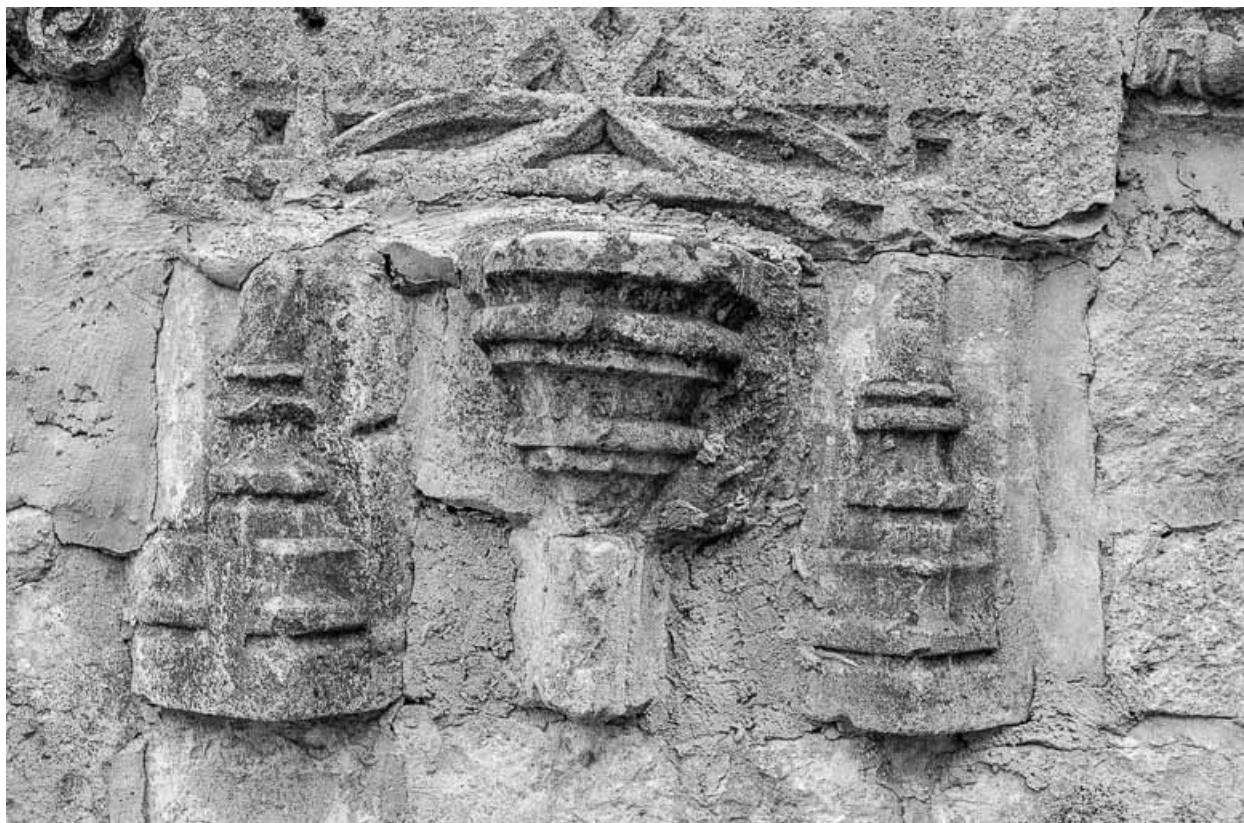
Restes de l'ancienne église : fragments.

25, Frasne, lieudit : rue de la Vieille-Eglise