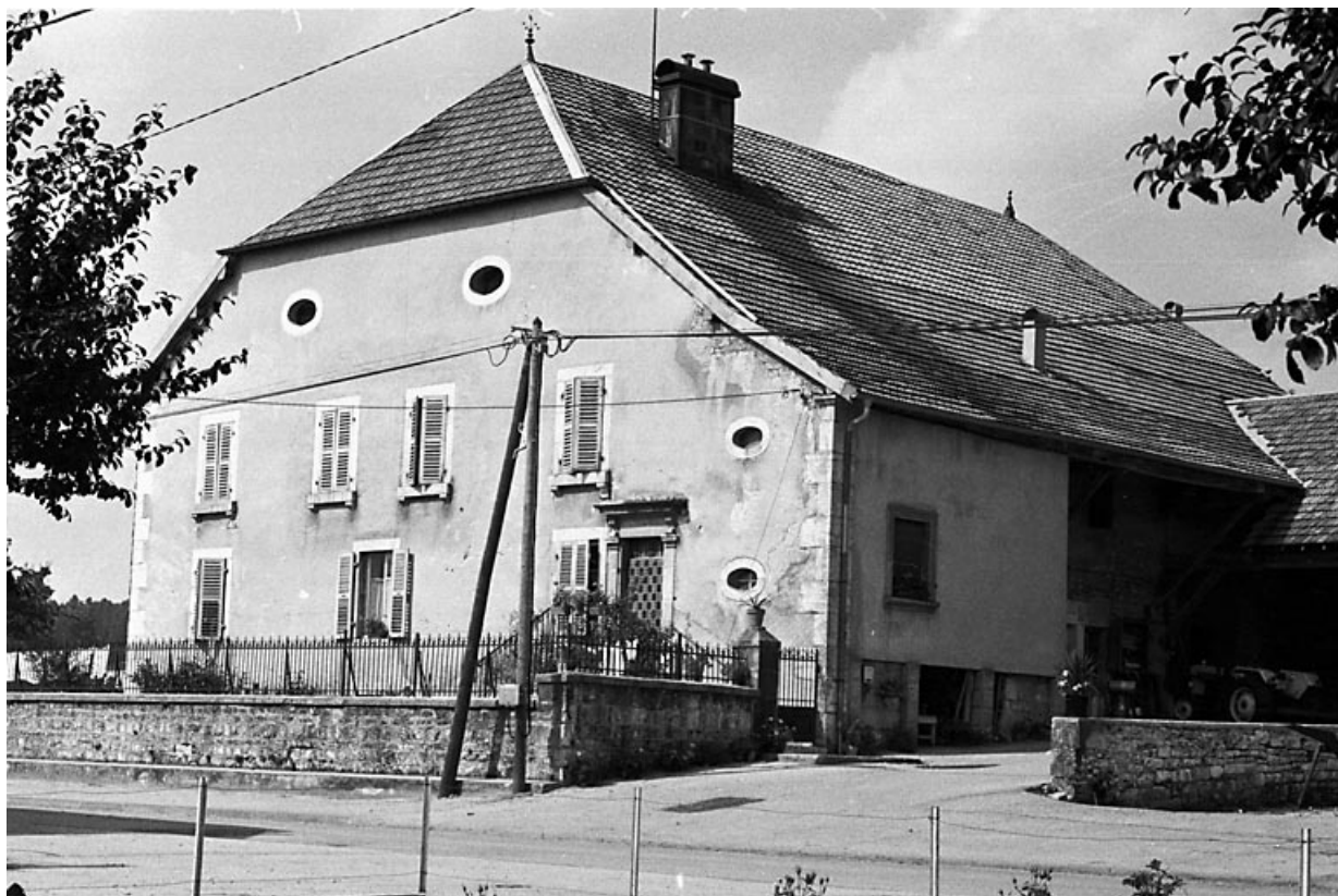
Vue de trois quarts droit. 25, Évillers