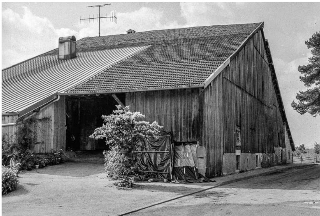
Ferme cadastrée 1972 ZM 112a-113a, située chemin de la Croix des Tolles : façade latérale droite. 25, Évillers