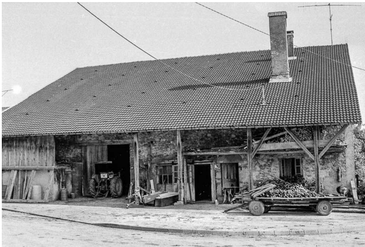
Gouttereau sur rue. 25, Évillers