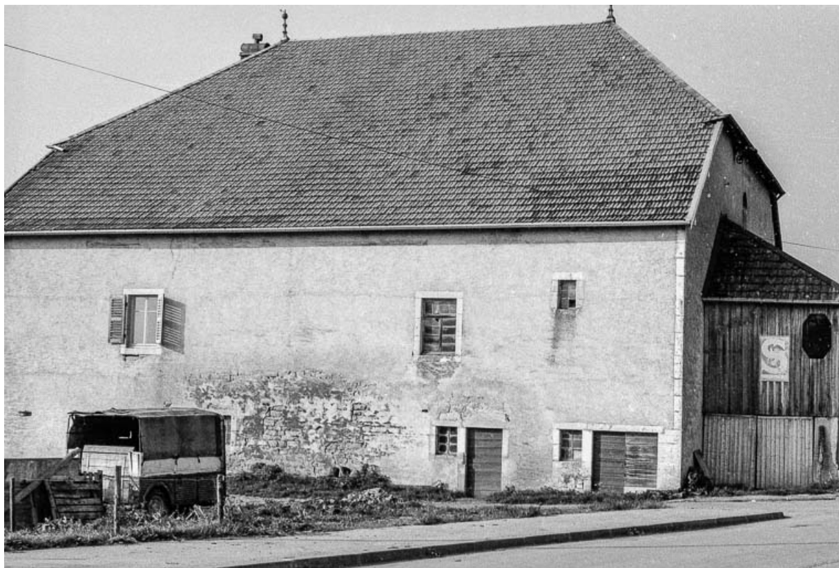
Ferme située 66 Grande Rue : façades postérieure et latérale gauche. 25, Évillers