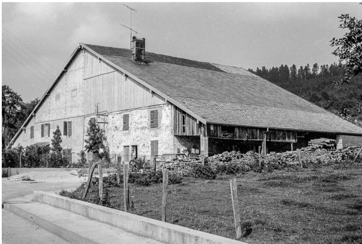
Ferme cadastrée 1972 ZM 5a-6a, située rue du Bois du Désert : façades antérieure et latérale droite. 25, Évillers