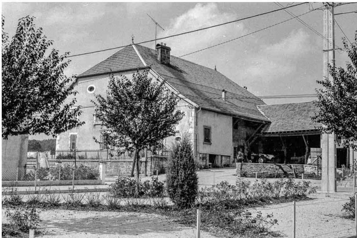
Façades sur cour. 25, Évillers