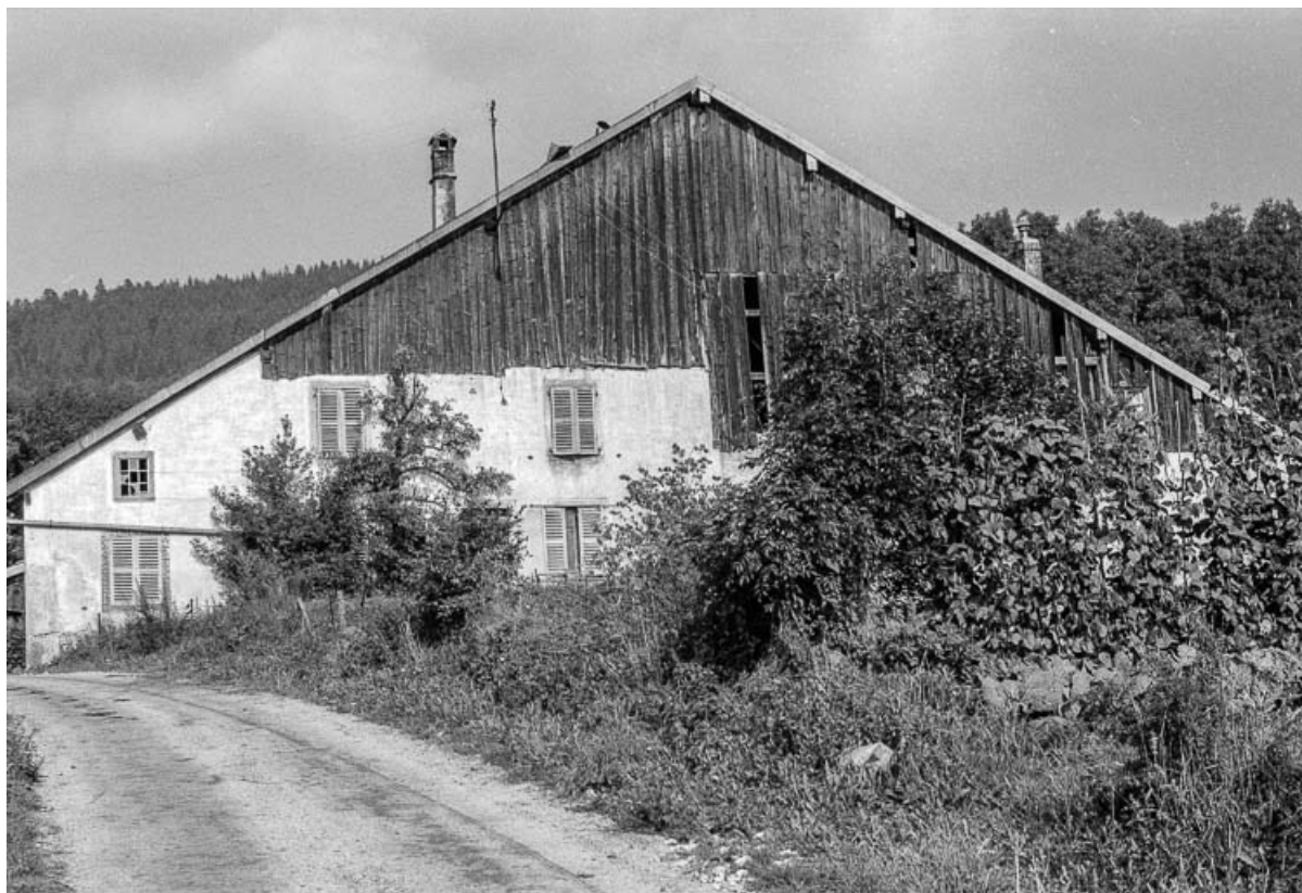
Ferme : vue d'ensemble depuis le chemin. 25, Évillers