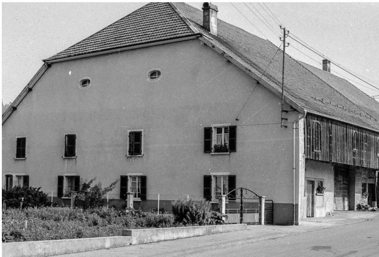
Ferme située 1 rue de Longeville : façades antérieure et latérale gauche. 25, Évillers