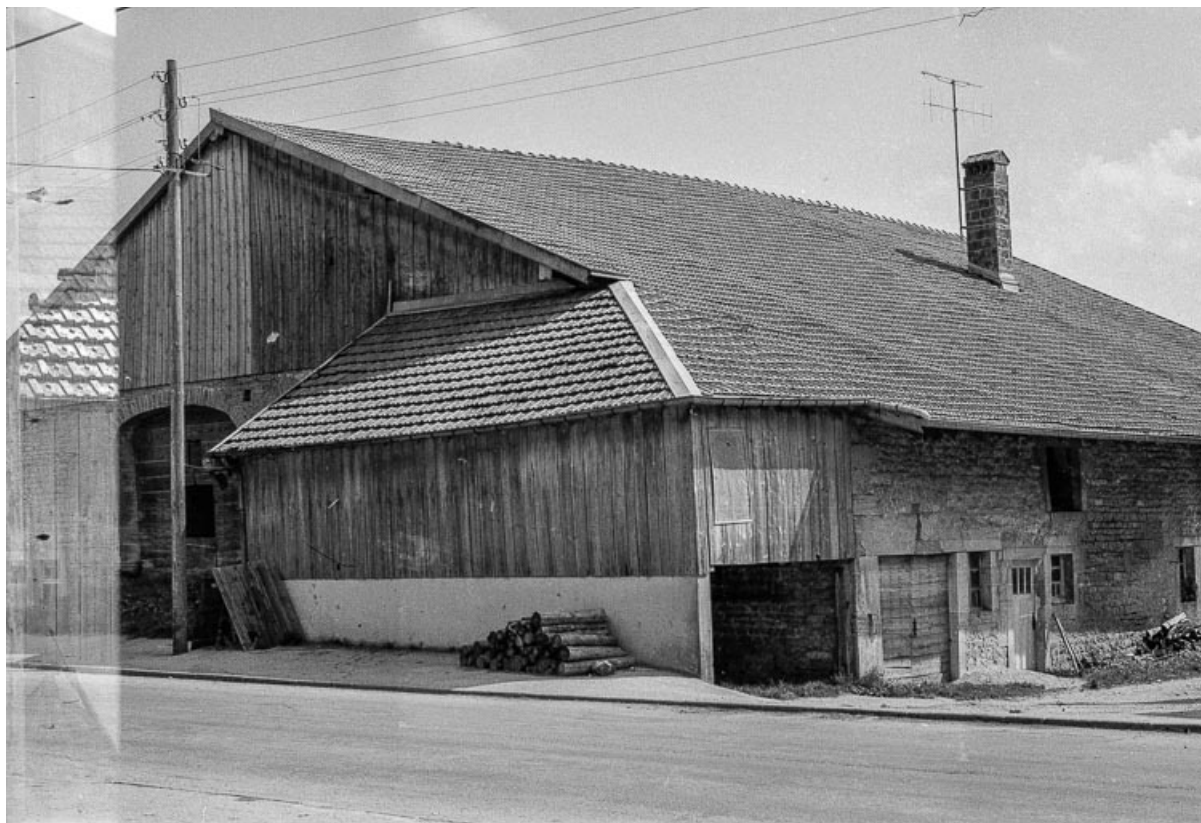
Ferme cadastrée 1972 ZM 90a-91a : façades postérieure et latérale droite. 25, Évillers