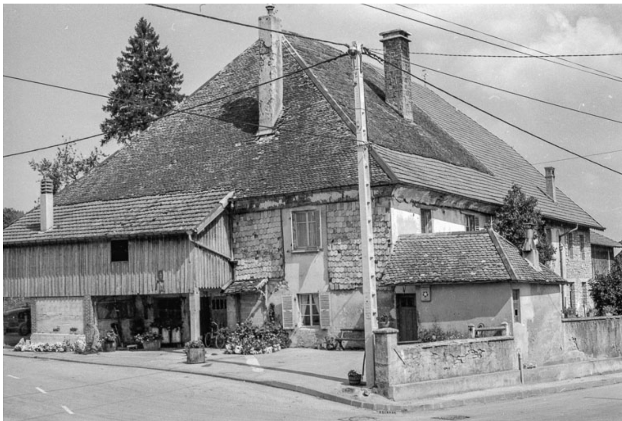
Ferme cadastrée 1972 ZM 40a : vue de trois quarts gauche. 25, Évillers