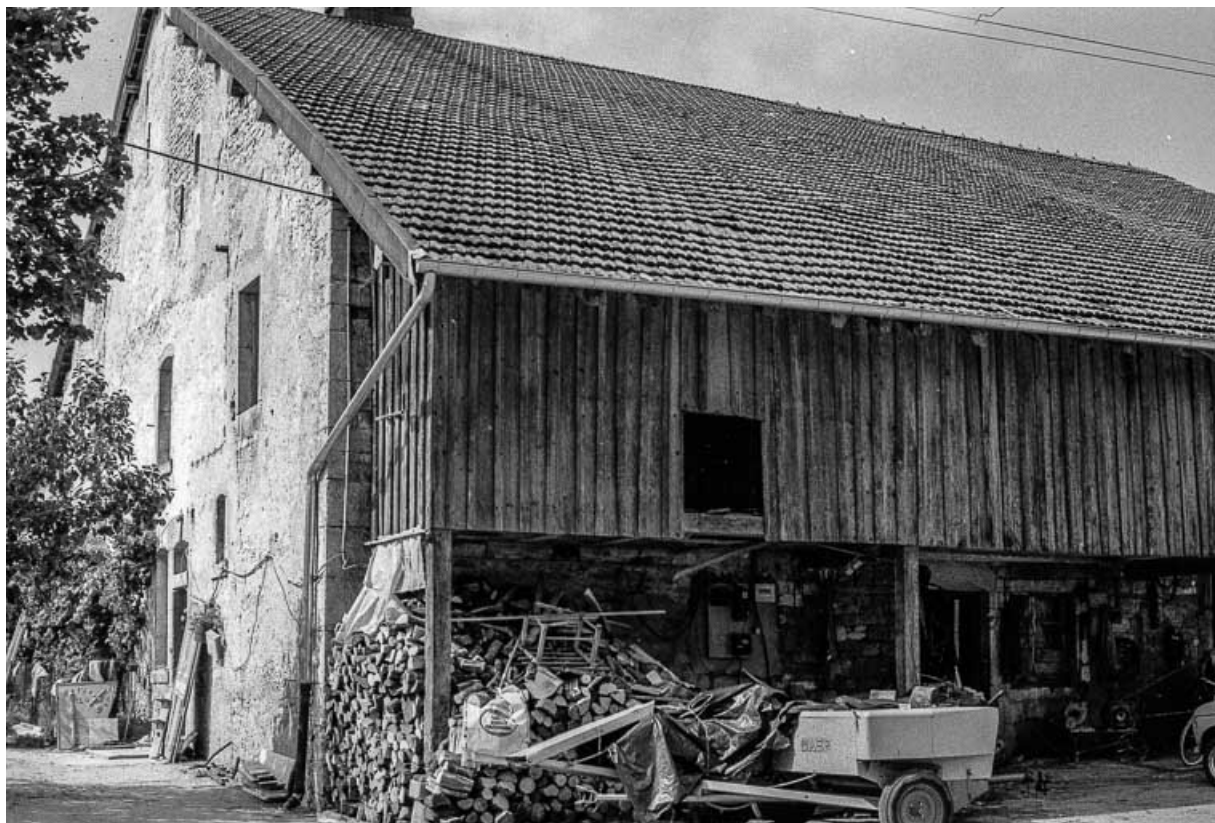
Ferme cadastrée 1972 ZM 73a : façades antérieure et latérale droite. 25, Évillers