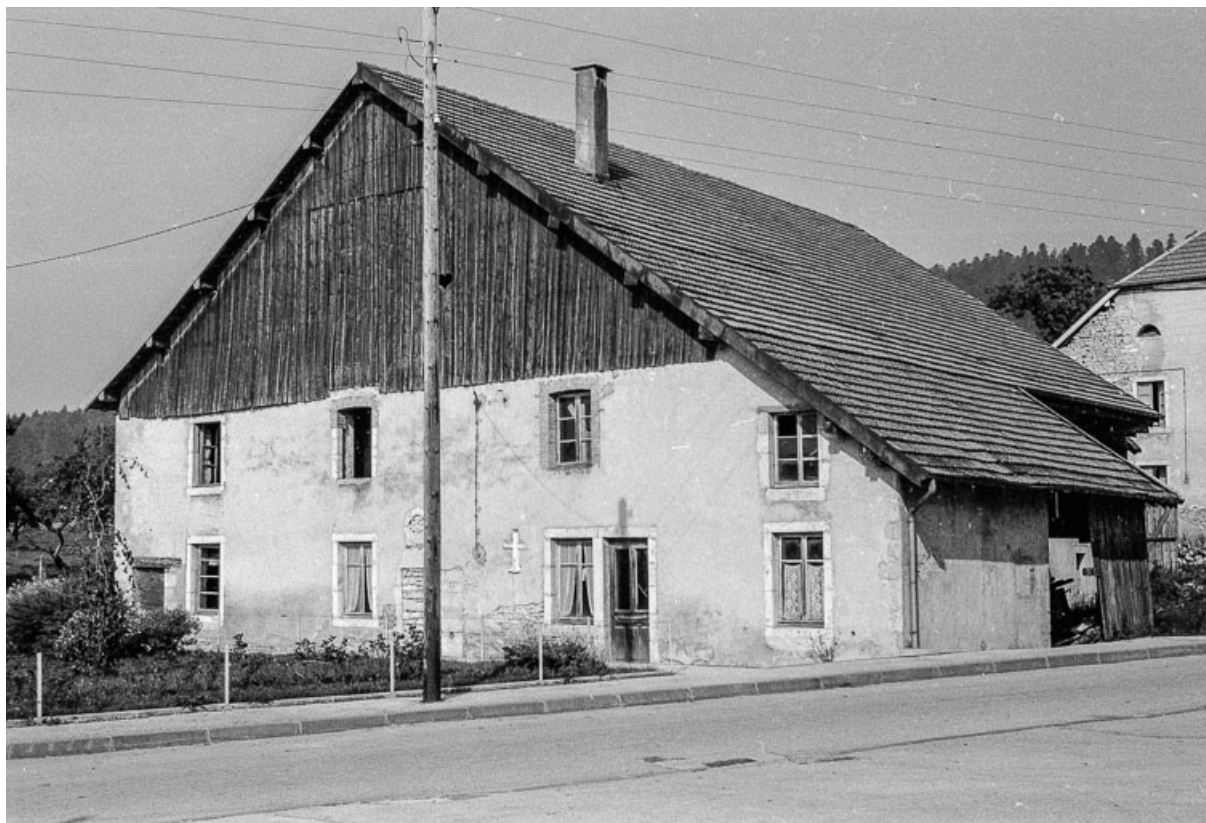
Ferme cadastrée 1972 ZM 27, située rue du Bois du Désert : façades antérieure et latérale droite 25, Évillers