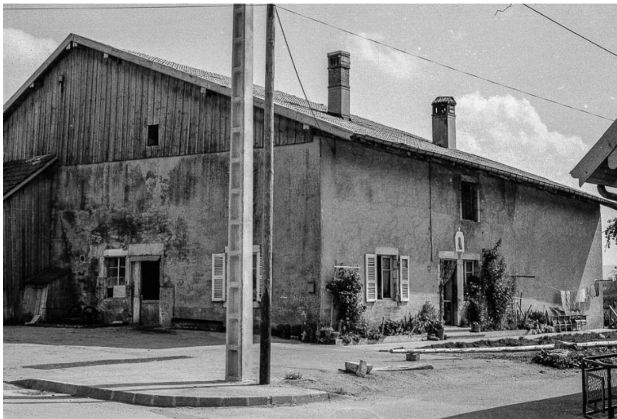
Ferme cadastrée 1972 ZM 82a : façades antérieure et latérale gauche. 25, Évillers