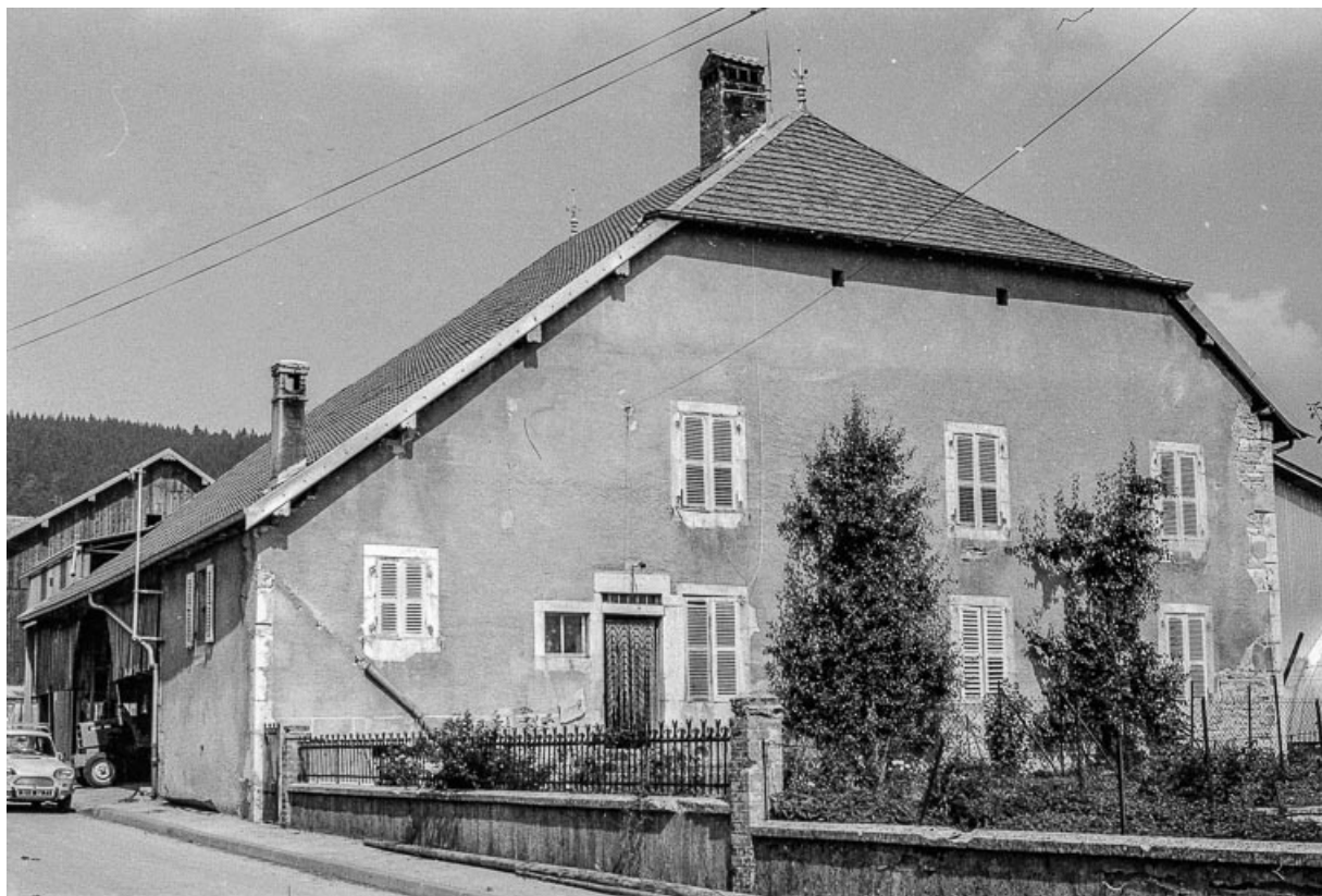
Ferme cadastrée 1972 ZM 67a : façade antérieure et façade sur rue. 25, Évillers