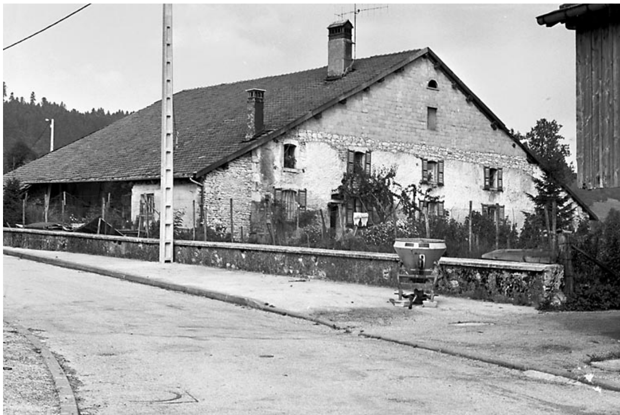
Vue de trois quarts gauche. 25, Évillers