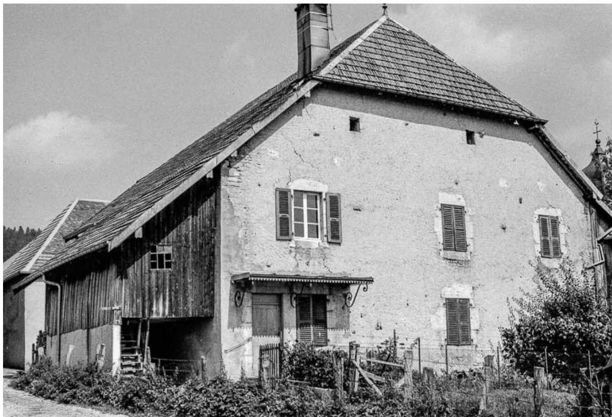
Ferme cadastrée 1972 ZM 62a : façades antérieure et latérale gauche. 25, Évillers