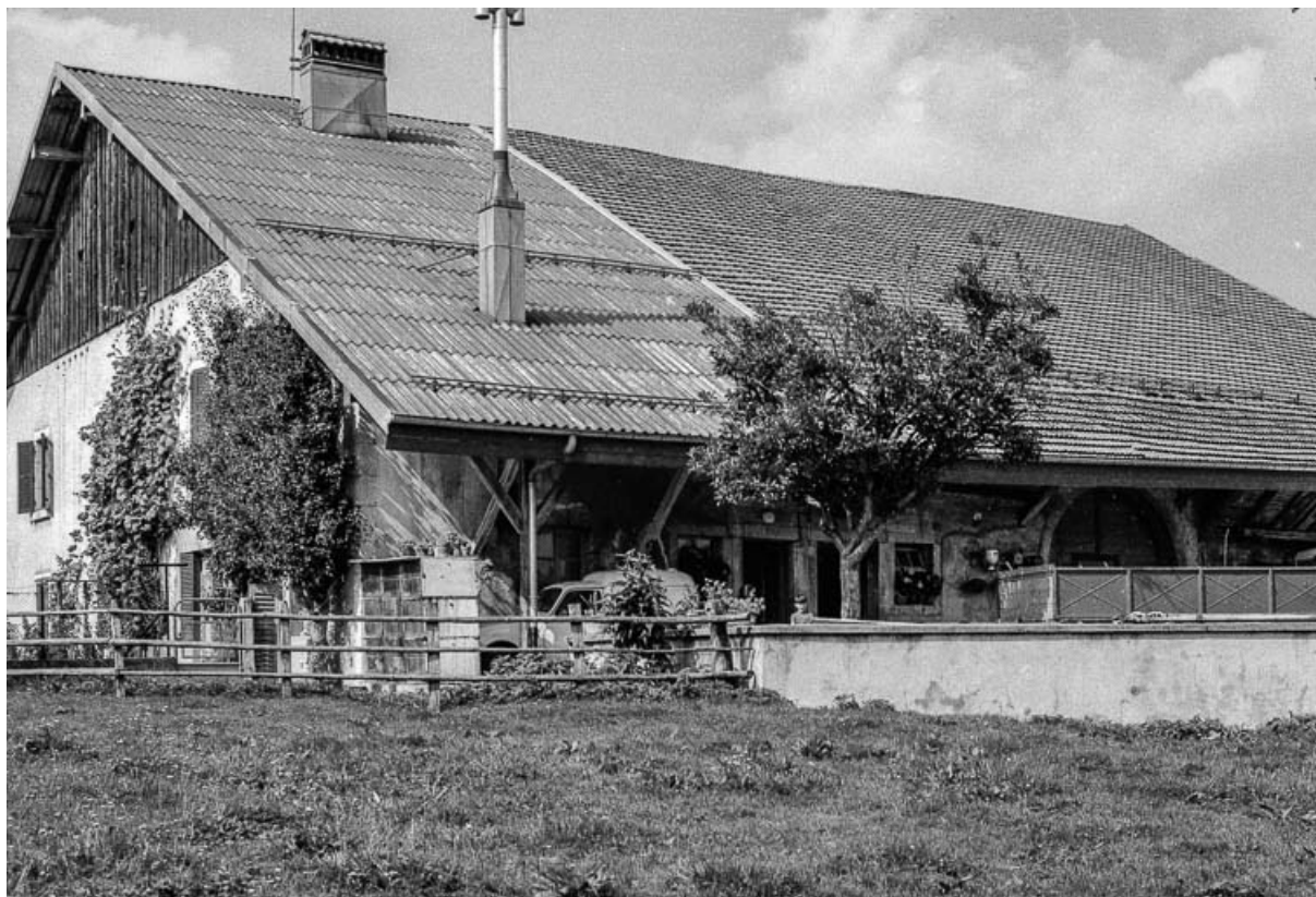
Pignon habitation et gouttereau droit. 25, Évillers