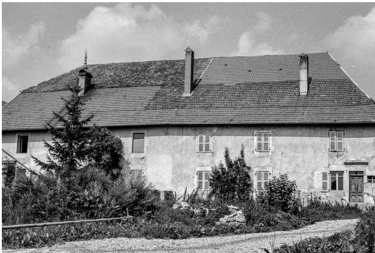
Ferme cadastrée 1972 ZM 63a-64a : façade antérieure. 25, Évillers