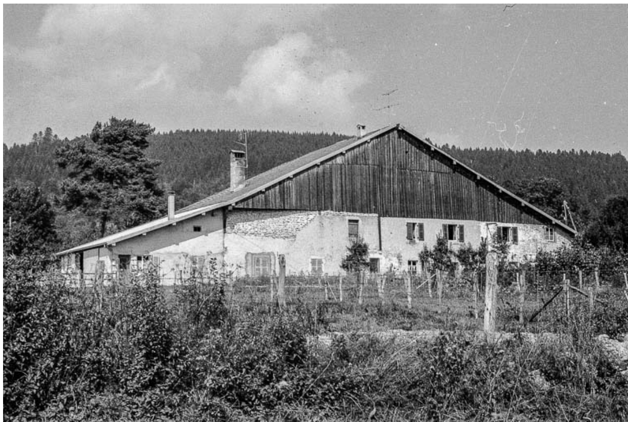
Ferme cadastrée 1972 ZM 112a-113a, située chemin de la Croix des Tolles : façade antérieure. 25, Évillers