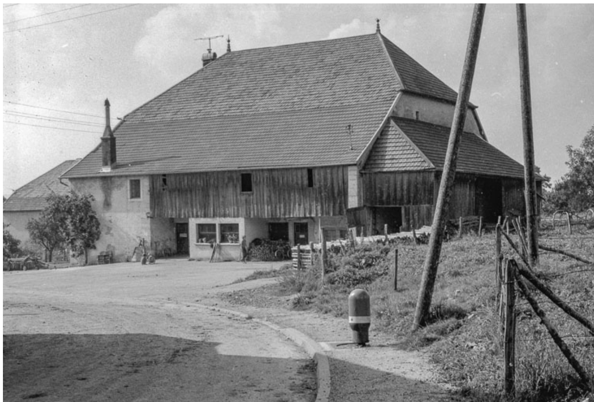
Ferme cadastrée 1972 ZM 9g, située rue du Mont : façade latérale droite. 25, Évillers