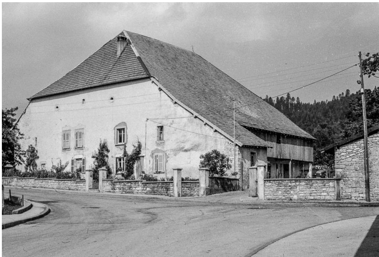
Ferme cadastrée 1972 ZM 7a, située rue du Bois du Désert : vue d'ensemble de trois quarts droit. 25, Évillers