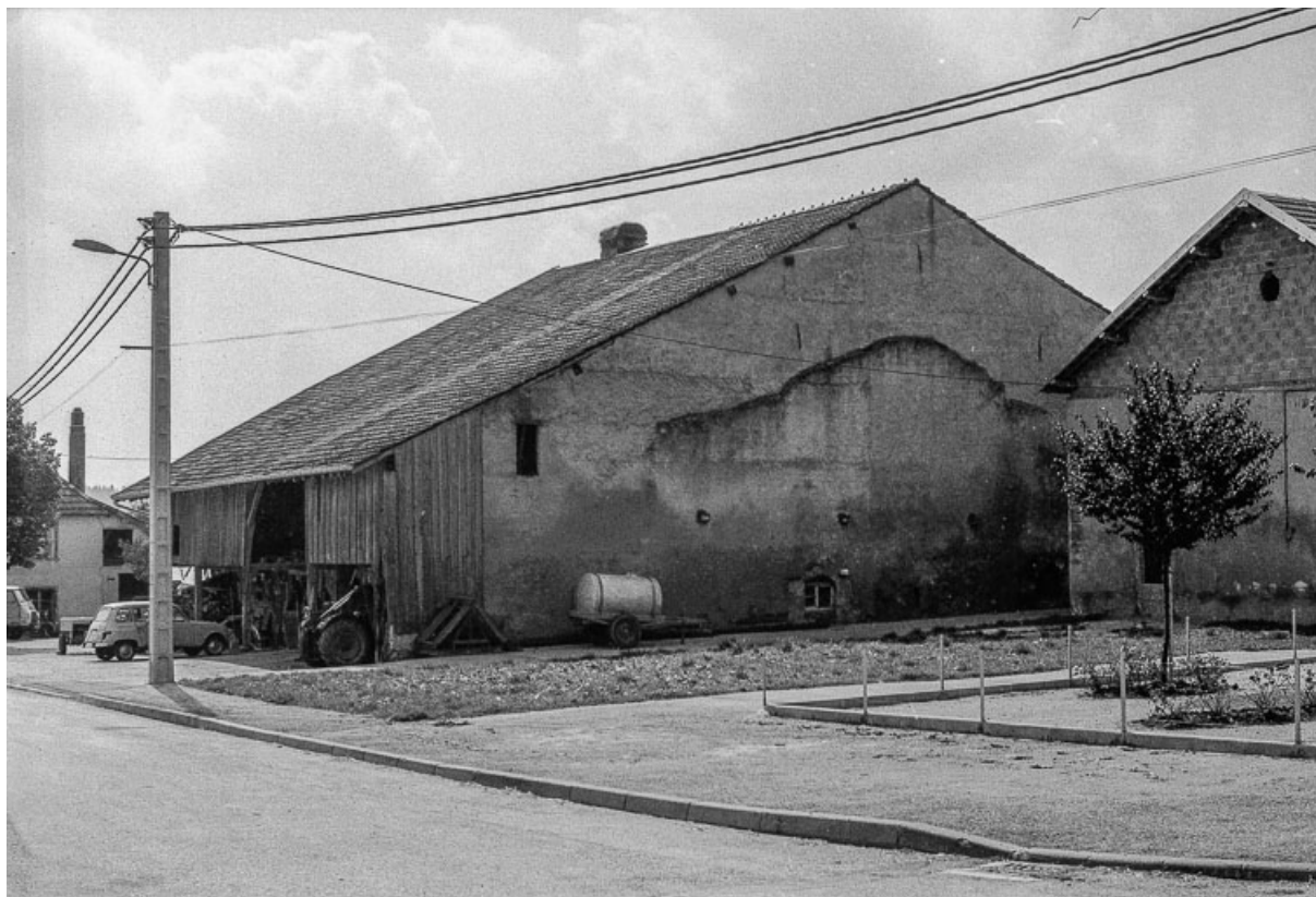
Ferme cadastrée 1972 ZM 73a : façades postérieure et latérale droite 25, Évillers