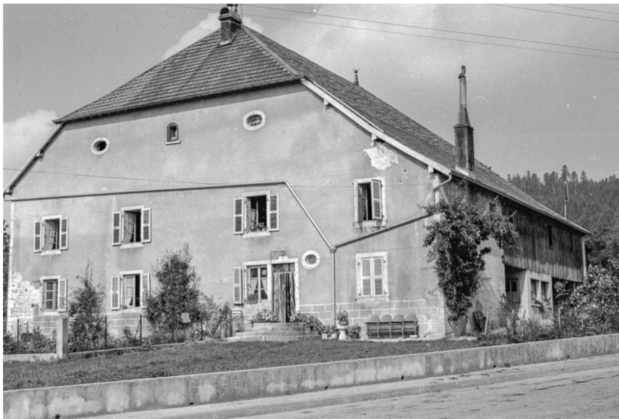
Ferme cadastrée 1972 ZM 9g, située rue du Mont : façades antérieure et latérale droite. 25, Évillers