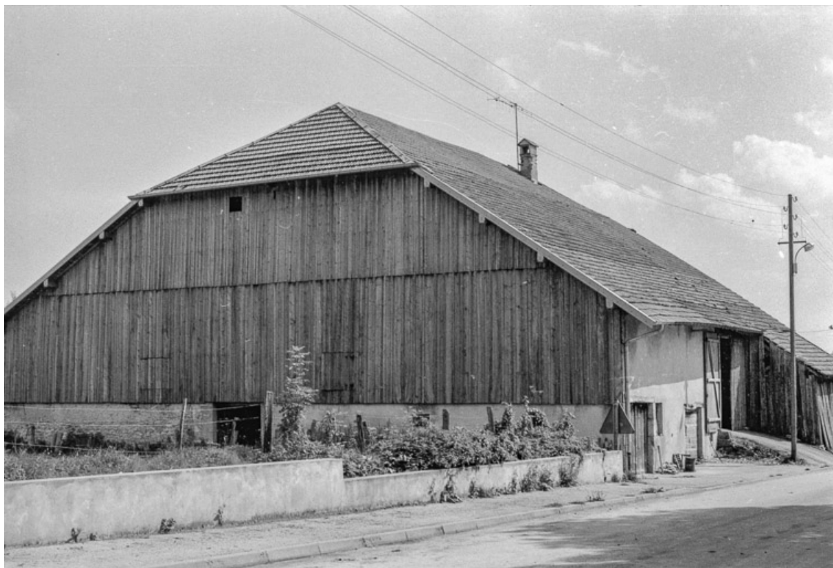
Ferme cadastrée 1972 ZM 93a : façades antérieure et latérale gauche. 25, Évillers