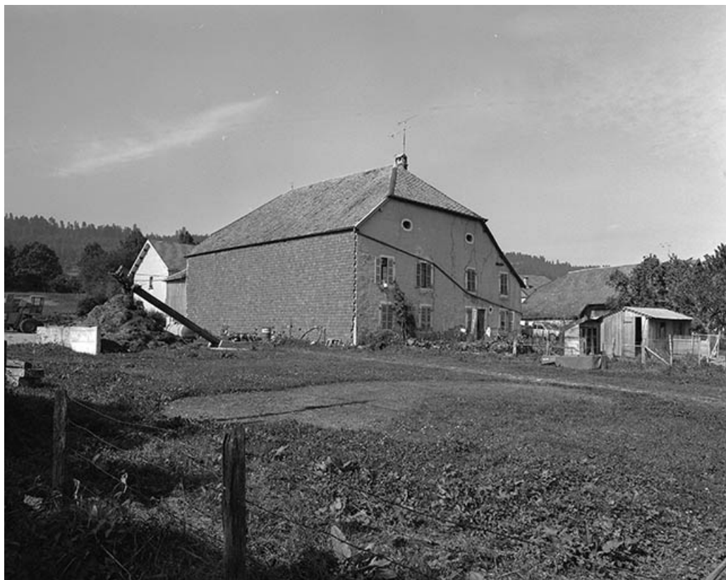
Ferme cadastrée 1972 ZM 94 a, datée de 1878 : façade antérieure et latérale droite essentée de petites tuiles. 25, Évillers