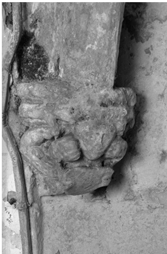
Culot du rez-de-chaussée de la tour-clocher.