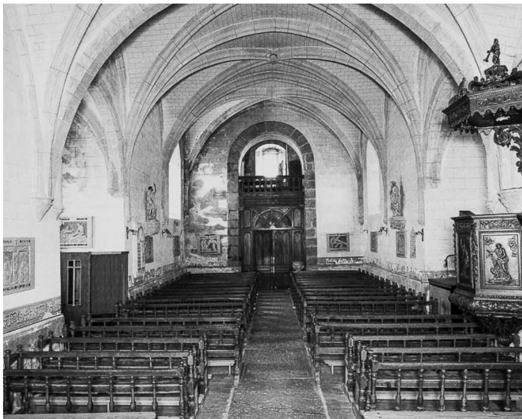
La nef vue depuis le chœur.