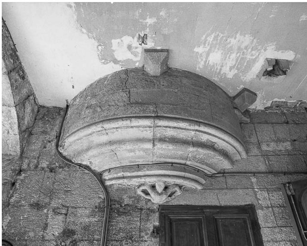
Base de l'escalier de la tour-clocher. 25, Dompierre-les-Tilleuls Grande Rue