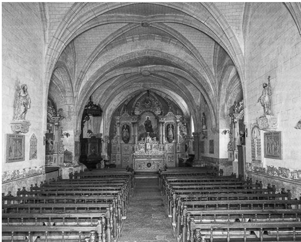
Intérieur : nef et choeur.