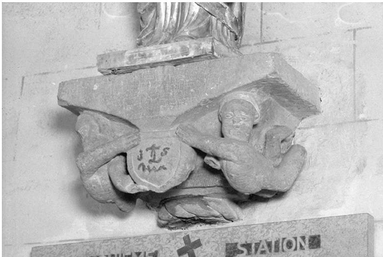
Console, 2ème travée, mur gauche. 25, Dompierre-les-Tilleuls Grande Rue