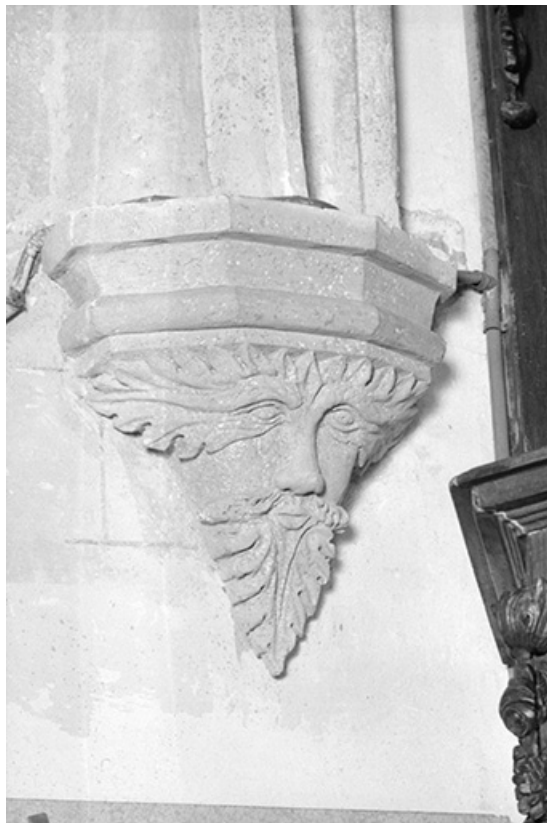
Culot. 1ère travée du chœur. Mur nord. 25, Dompierre-les-Tilleuls Grande Rue