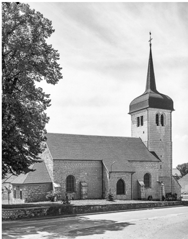
Extérieur : façade latérale gauche.