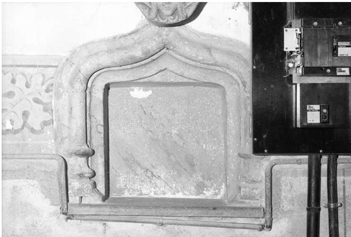
Niche de la chapelle droite.