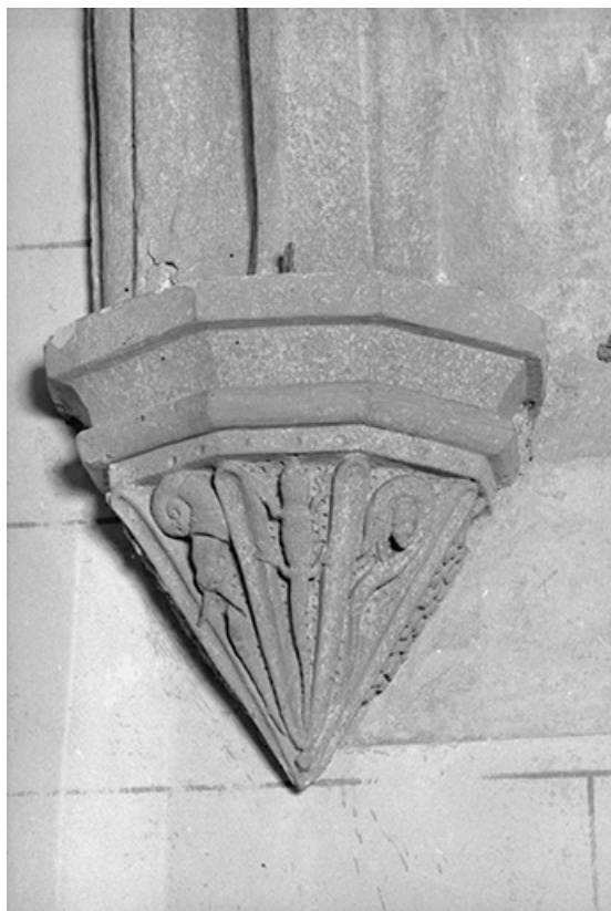
Culot. 1ère travée du chœur. Mur sud. 25, Dompierre-les-Tilleuls Grande Rue