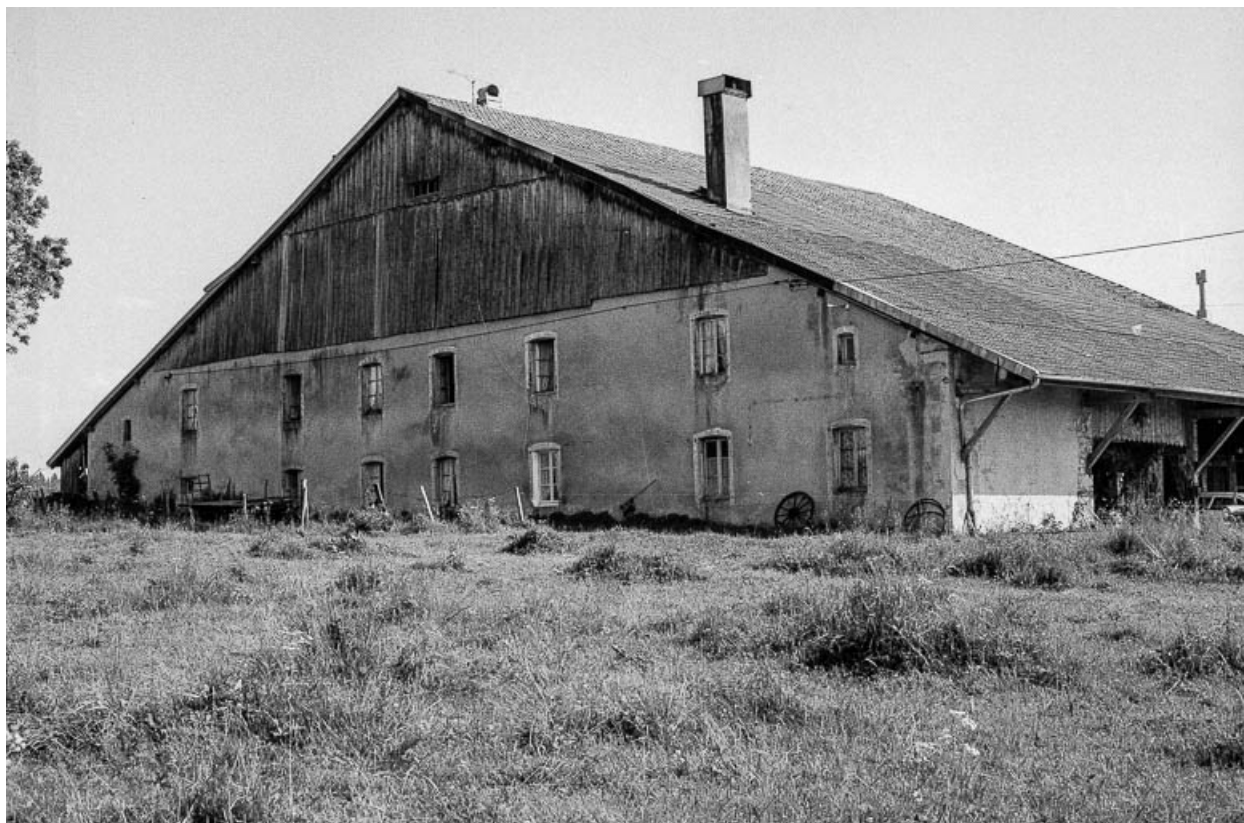
Vue rapprochée du pignon d'habitation et du mur gouttereau.