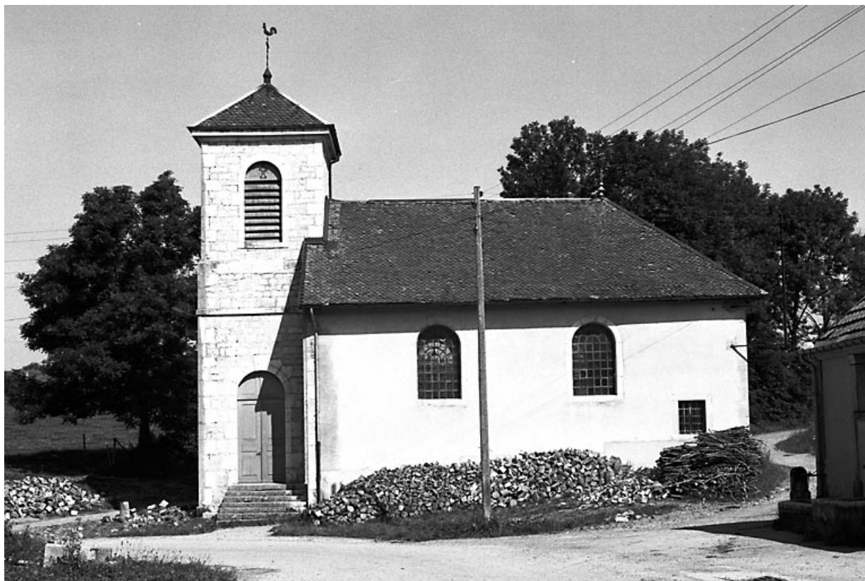
Vue de la façade latérale droite.

25, Bians-les-Usiers, lieudit : Pissenavache