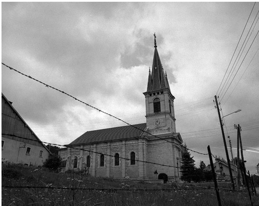
Extérieur : chevet et façade latérale gauche.