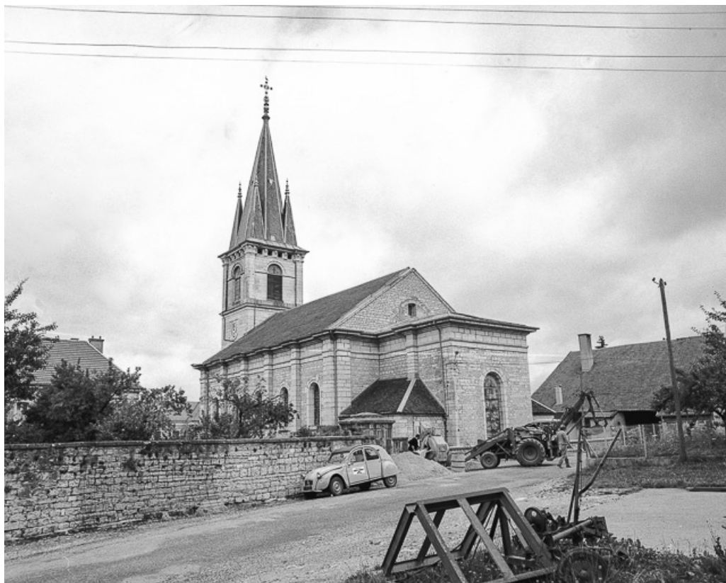
Façade latérale gauche et chevet.