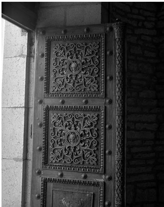
Baie : porte d'entrée.