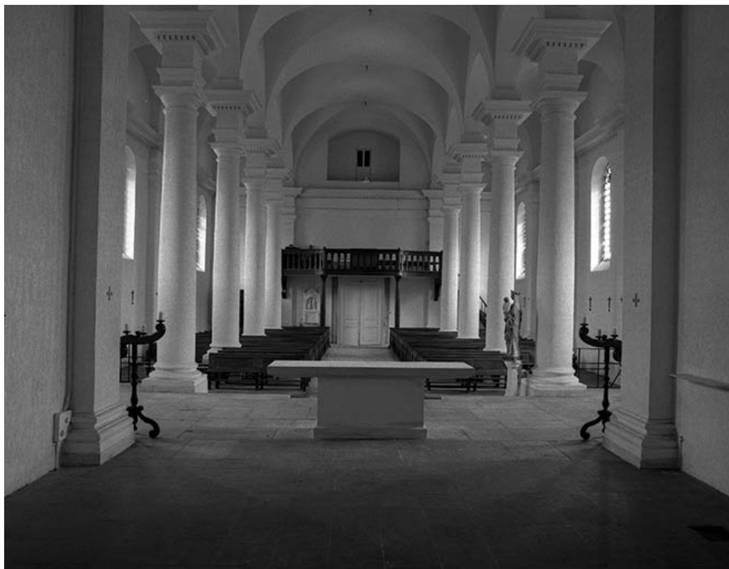
Intérieur : nef vue depuis le chœur.