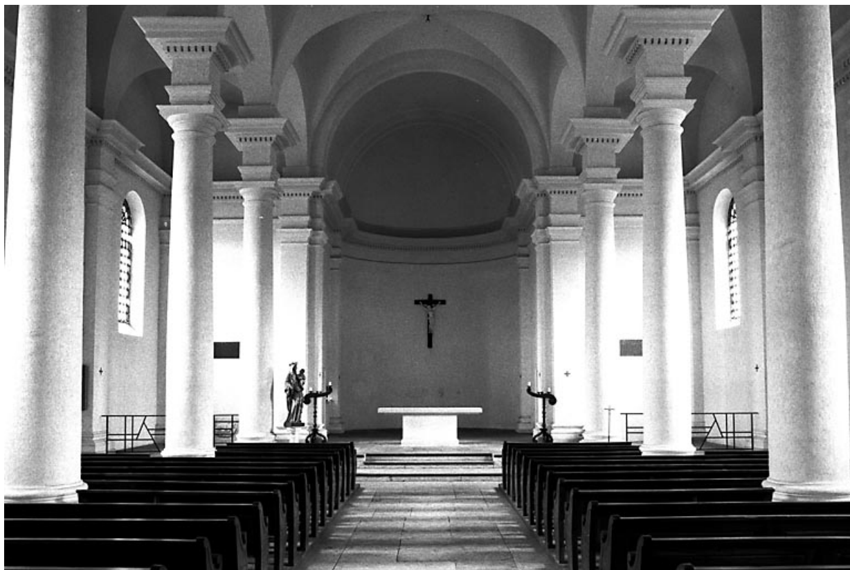
Nef et chœur vus depuis l'entrée.