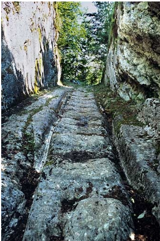
Vue de la voie à ornières entre Villars-sous-Chalamont et Boujailles. 25, Arc-sous-Montenot