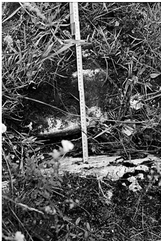
Vue d'une ornière.