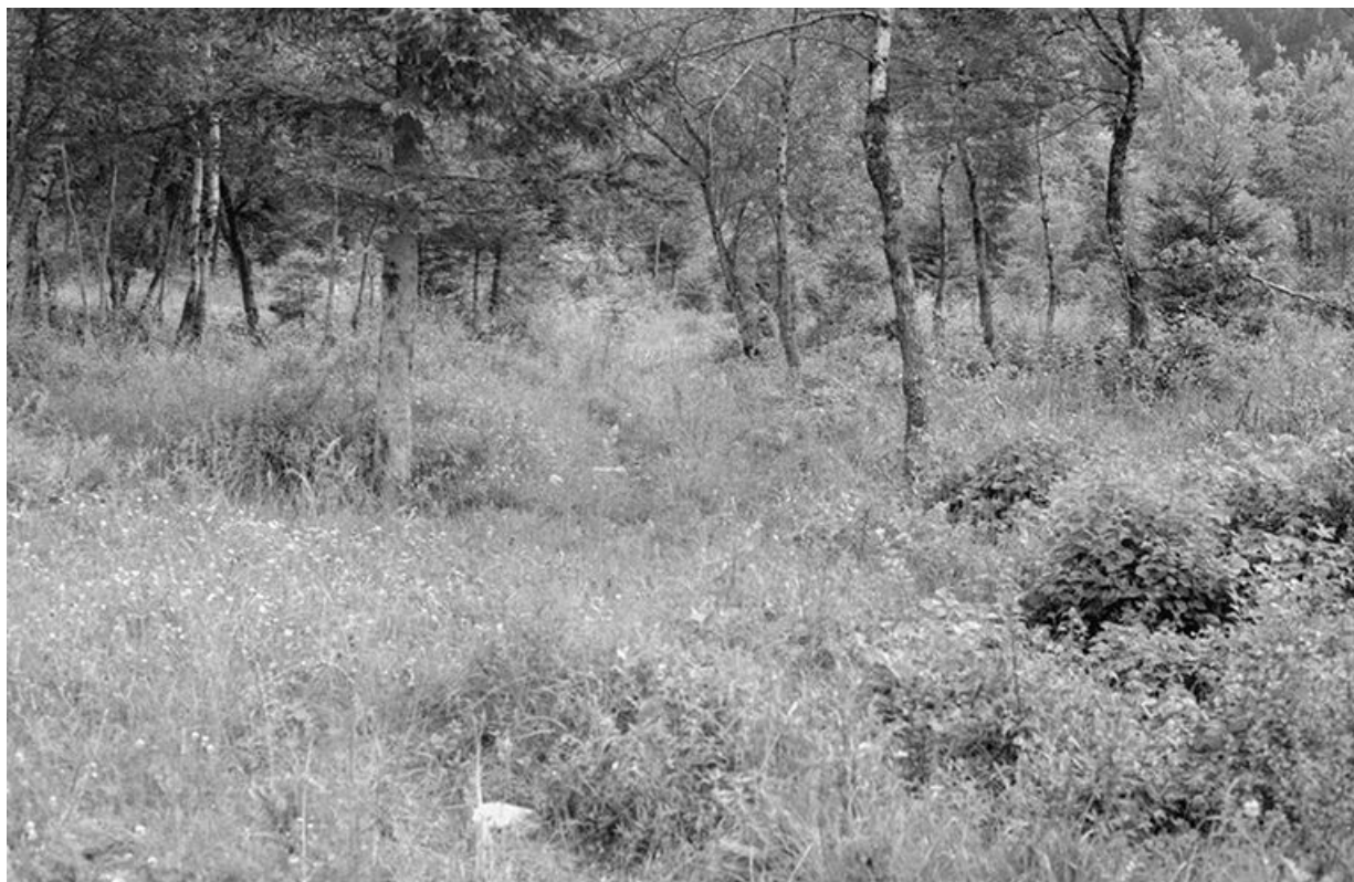
Vue d'une ornière.