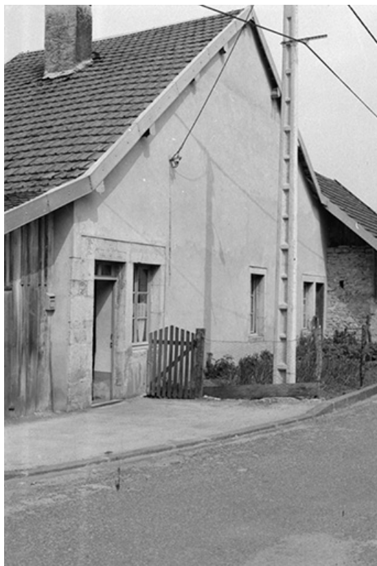
Ferme cadastrée 1961 AB 129-130, située rue du Bois Brûlé : façade antérieure. 25, Arc-sous-Montenot