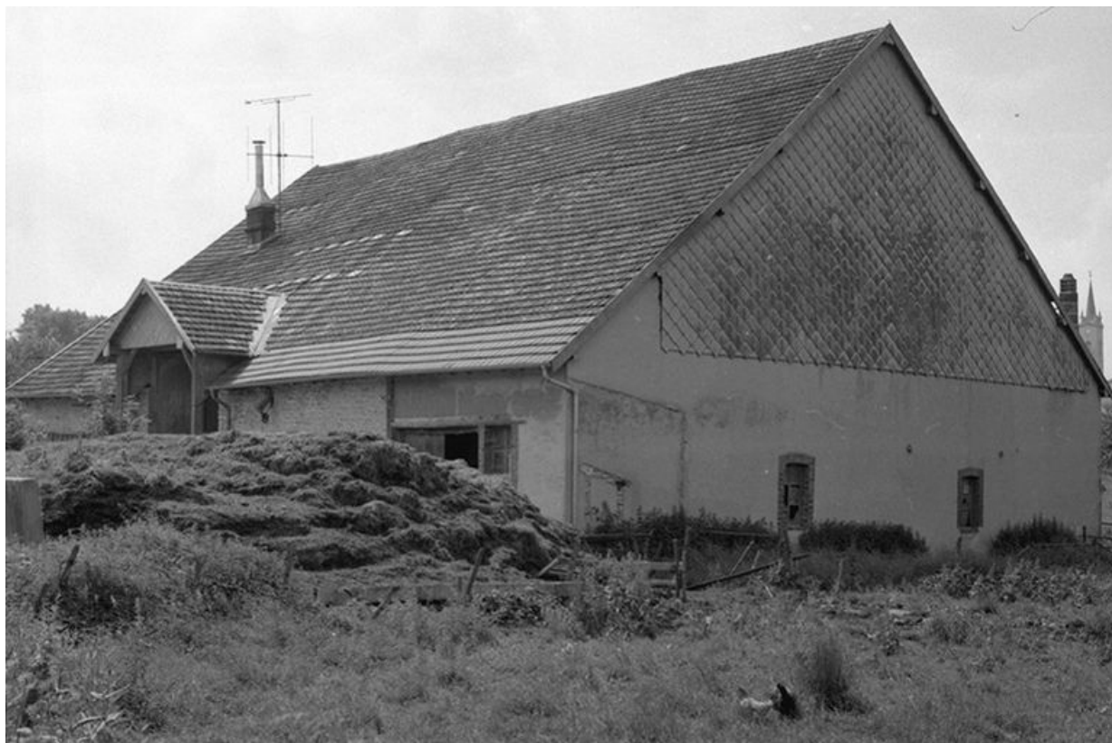
Ferme située route de Villeneuve, cadastrée 1961 AB 14-15 : façades postérieure et latérale droite. La ferme a brûlé après 1975. 25, Arc-sous-Montenot