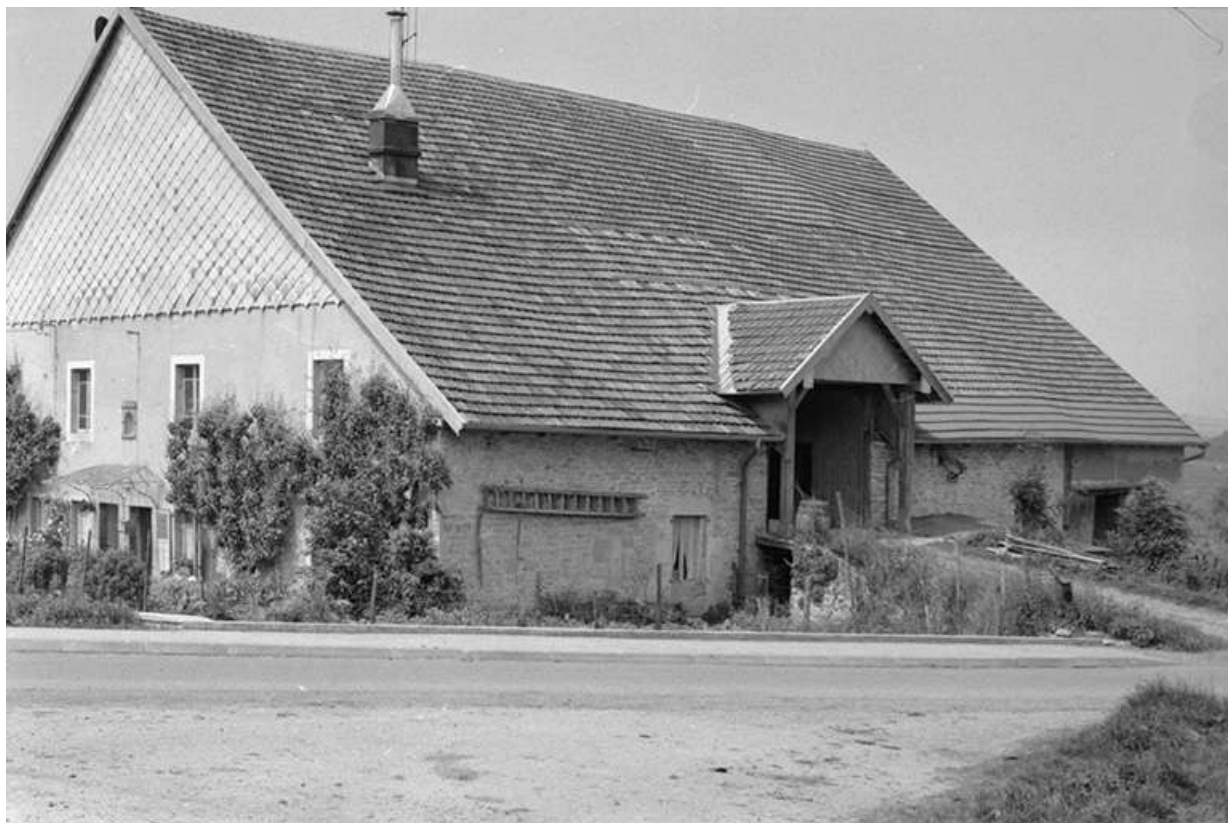
Ferme située route de Villeneuve, cadastrée 1961 AB 14-15 : façades antérieure et latérale droite. La ferme a brûlé après 1975. 25, Arc-sous-Montenot