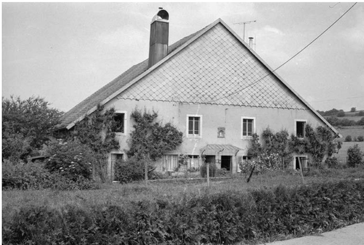
Ferme située route de Villeneuve, cadastrée 1961 AB 14-15 : façade antérieure. La ferme a brûlé après 1975. 25, Arc-sous-Montenot