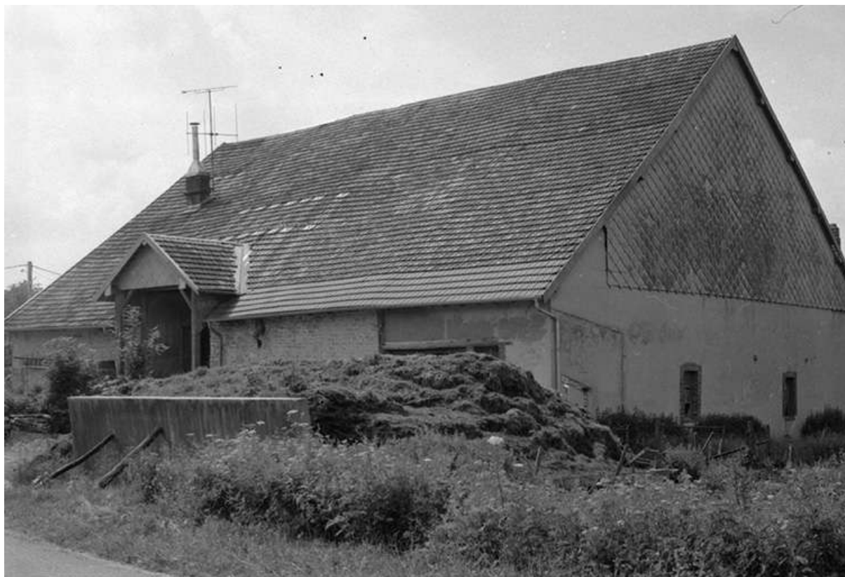
Ferme située route de Villeneuve, cadastrée 1961 AB 14-15 : façades postérieure et latérale droite. La ferme a brûlé après 1975. 25, Arc-sous-Montenot