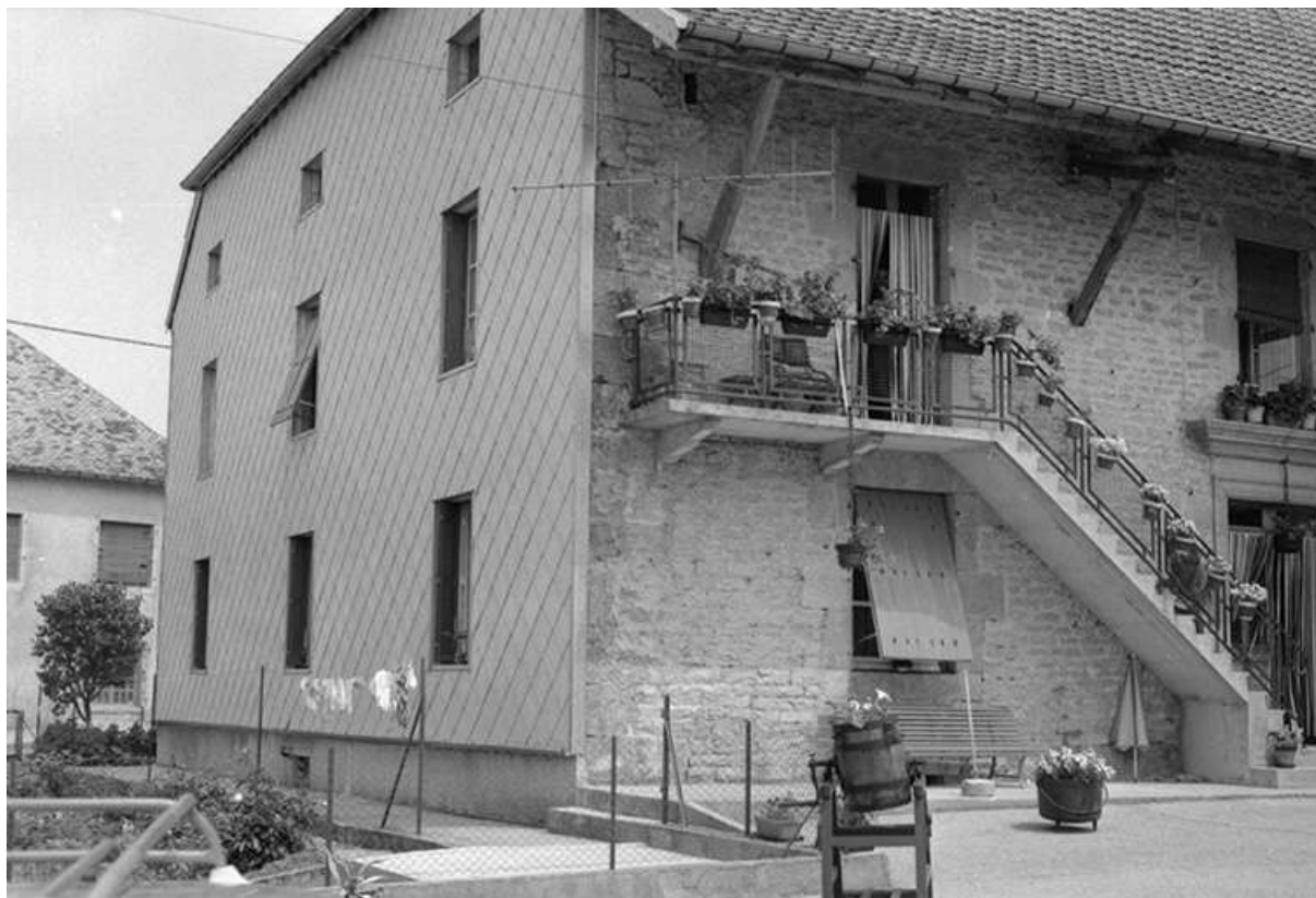
Ferme située 15 rue Anatole Maillard : façade antérieure. La ferme a brûlé dans les années 1980 ; une maison neuve a été construite sur son emplacement.