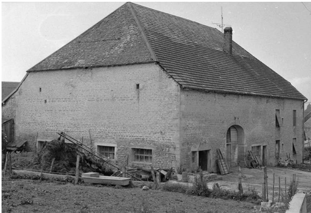
Ferme située 15 rue Anatole Maillard : pignon et face latérale postérieure. La ferme a brûlé dans les années 1980 ; une maison neuve a été construite sur son emplacement.