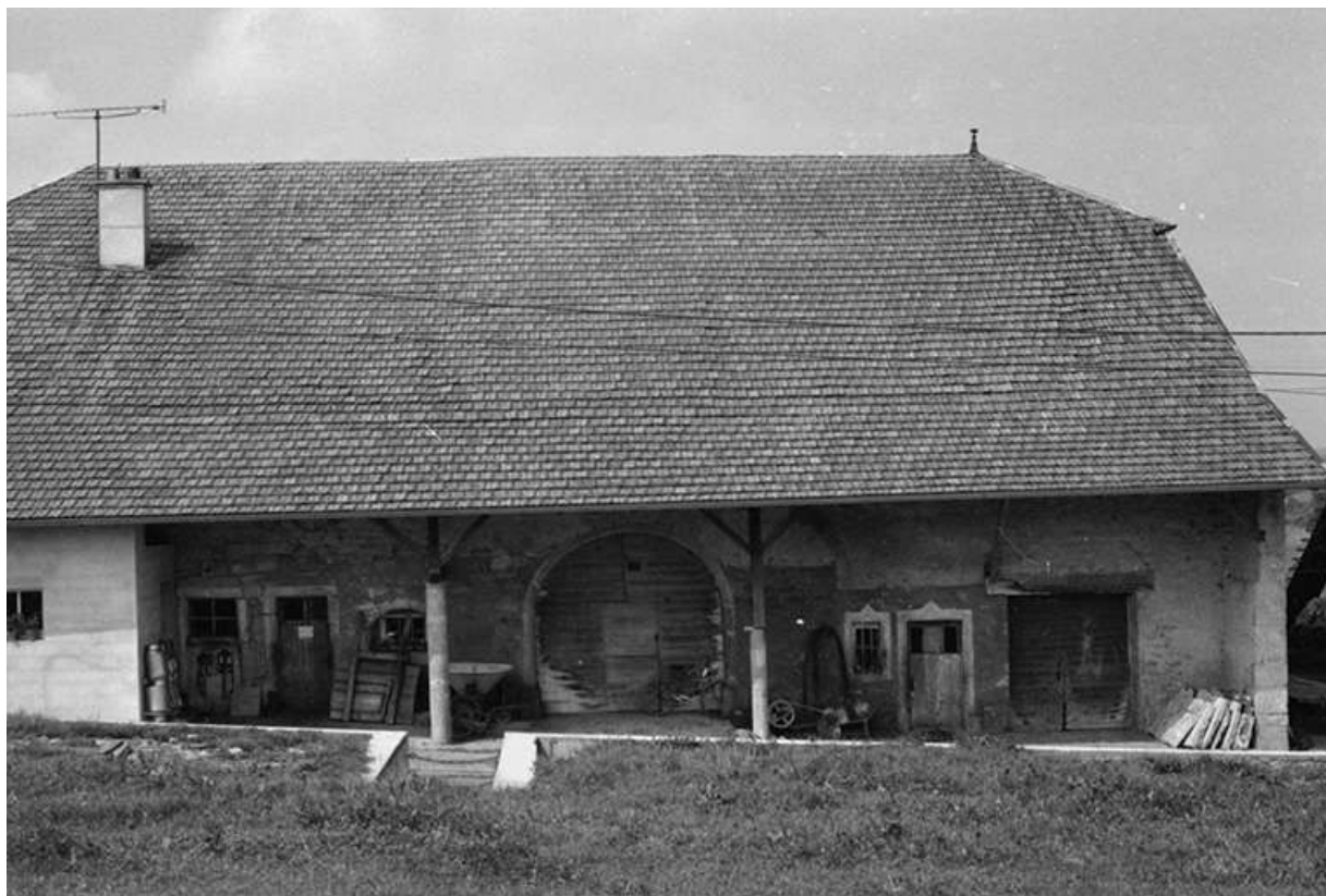
Ferme située route de Villeneuve, cadastrée 1961 AB 64 : façade latérale droite. 25, Arc-sous-Montenot