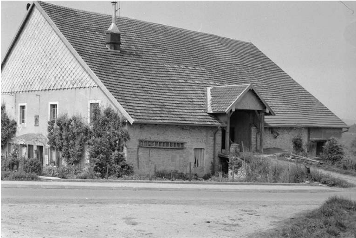
Ferme située route de Villeneuve, cadastrée 1961 AB 14-15 : façades antérieure et latérale droite. La ferme a brûlé après 1975. 25, Arc-sous-Montenot