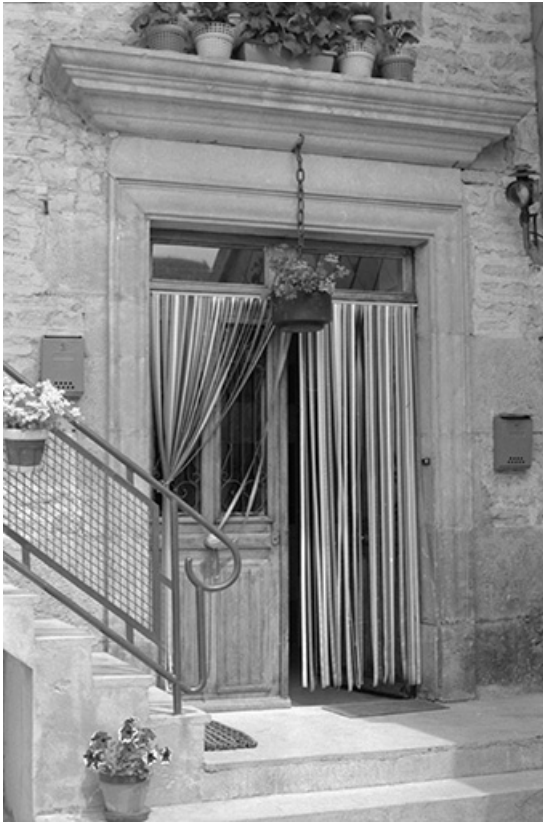
Ferme située 15 rue Anatole Maillard : porte d'entrée. La ferme a brûlé dans les années 1980 ; une maison neuve a été construite sur son emplacement.