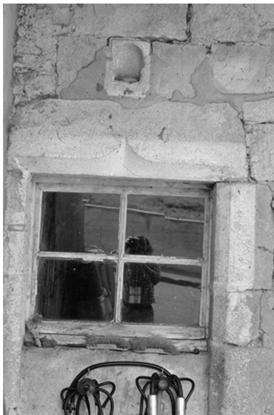
Ferme située route de Villeneuve, cadastrée 1961 AB 64 : fenêtre et niche. 25, Arc-sous-Montenot