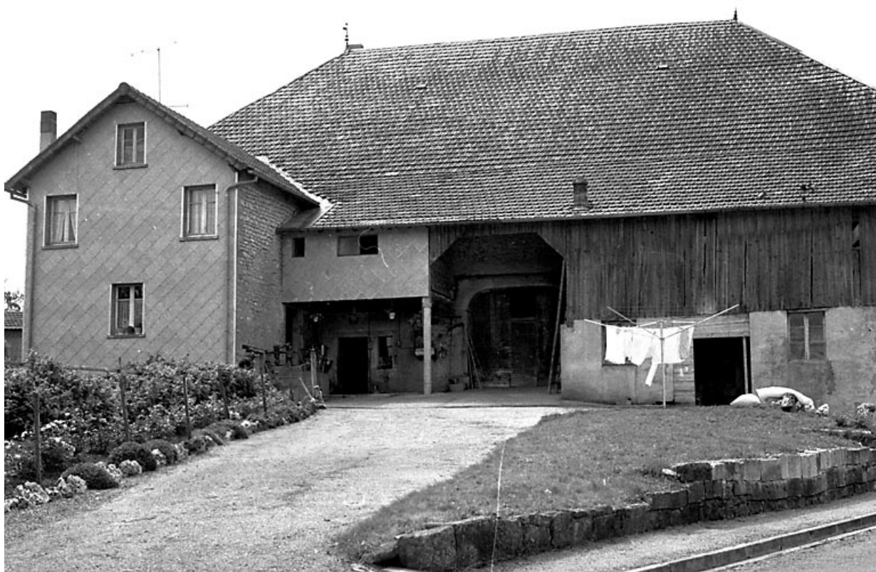
Vue du mur goutterot. 25, Arc-sous-Montenot