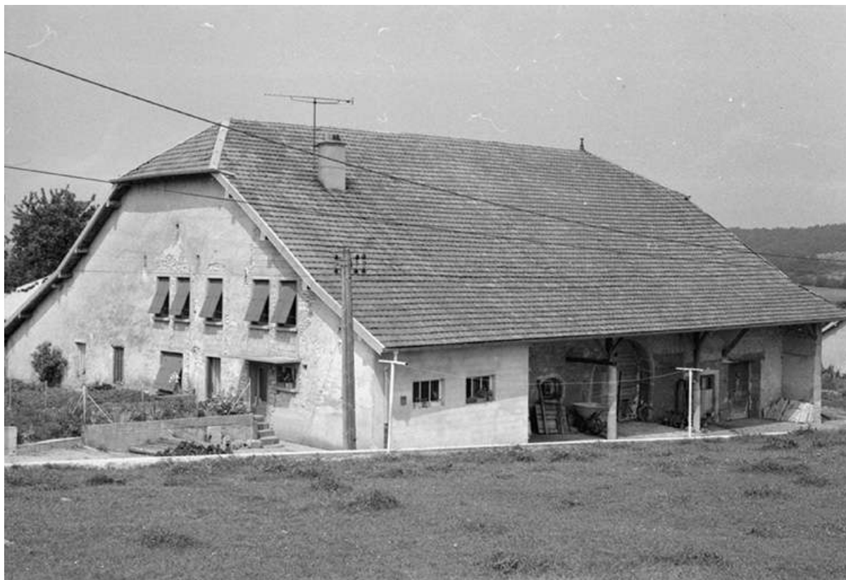
Ferme située route de Villeneuve, cadastrée 1961 AB 64 : façades antérieure et latérale droite. 25, Arc-sous-Montenot