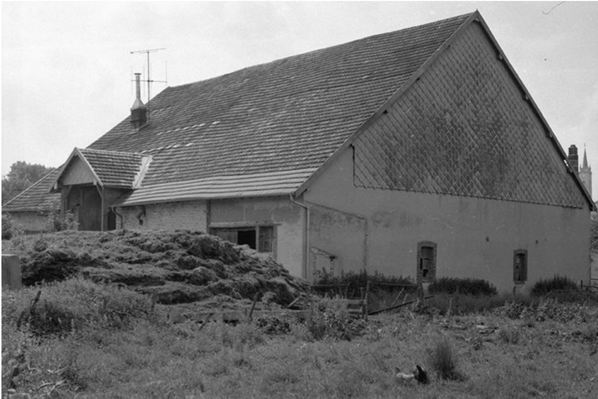
Ferme située route de Villeneuve, cadastrée 1961 AB 14-15 : façades postérieure et latérale droite. La ferme a brûlé après 1975. 25, Arc-sous-Montenot