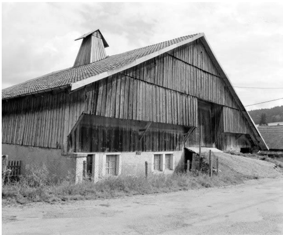
Façade sur rue, vue de trois quarts gauche.