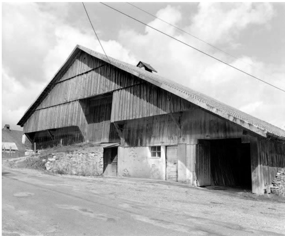
Façade sur rue, vue de trois quarts droit.

25, Ville-du-Pont 1ère ferme, lieudit : les Jarrons