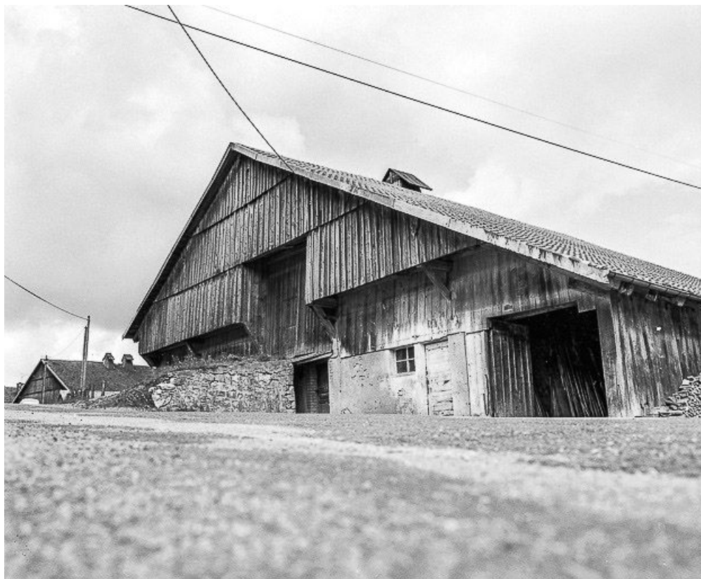
Façade sur rue, vue de trois quarts droit.

25, Ville-du-Pont 1ère ferme, lieudit : les Jarrons