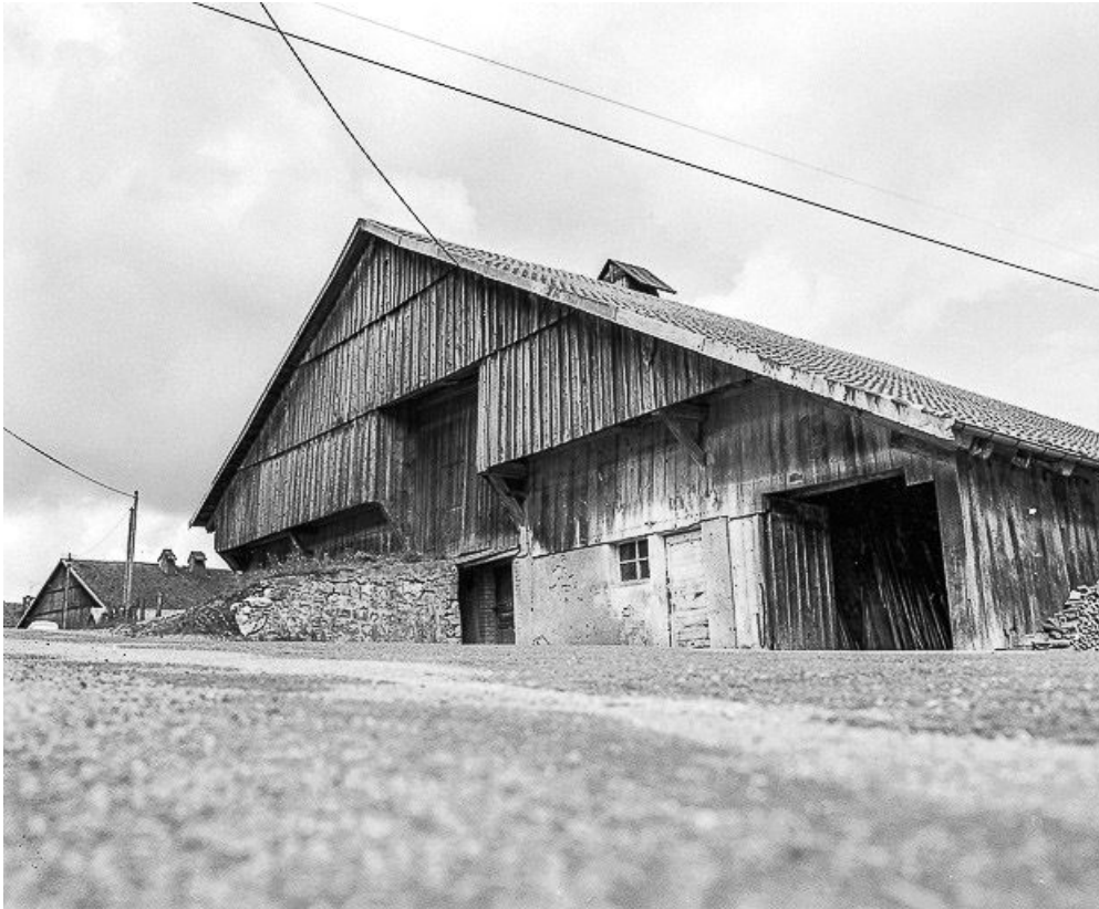
Façade sur rue, vue de trois quarts droit.

25, Ville-du-Pont 1ère ferme, lieudit : les Jarrons