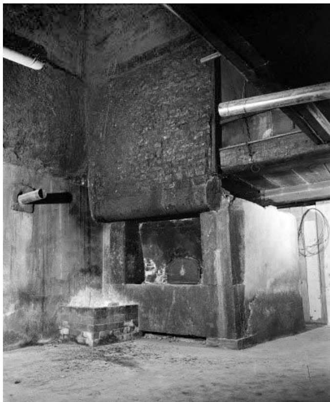
Intérieur :base du "tué" et four.

25, Ville-du-Pont 1ère ferme, lieudit : les Jarrons