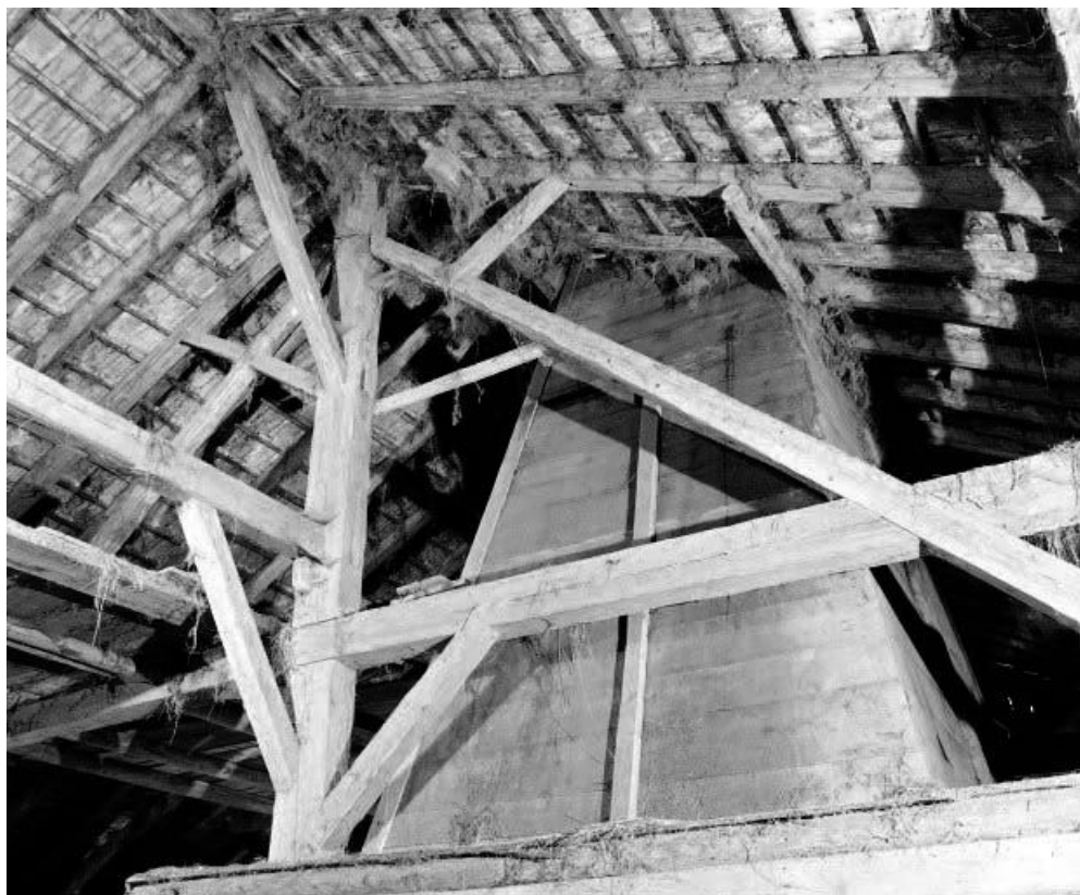
Intérieur : charpente et conduit du "tué".

25, Ville-du-Pont 1ère ferme, lieudit : les Jarrons