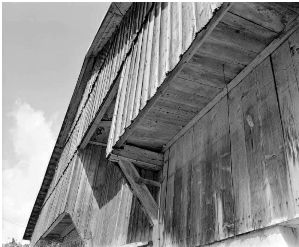
Détail : débord de la "lambrechure" sur le pignon antérieur.

25, Ville-du-Pont 1ère ferme, lieudit : les Jarrons