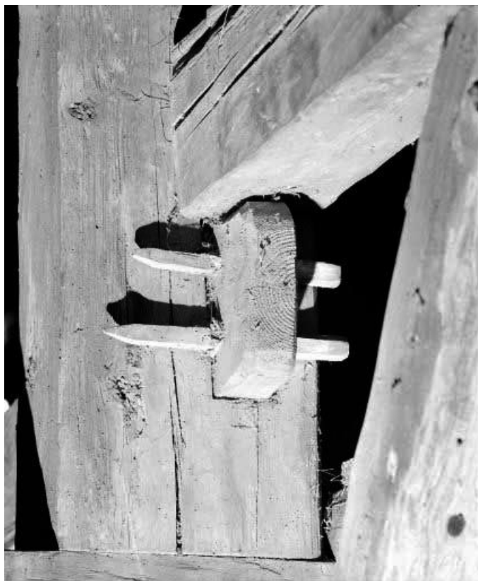
Détail : assemblage de charpente.

25, Ville-du-Pont 1ère ferme, lieudit : les Jarrons