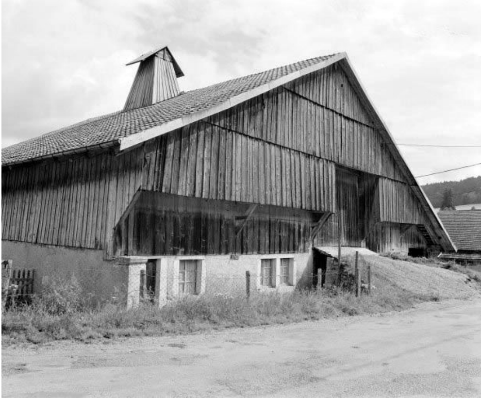
Façade sur rue, vue de trois quarts gauche.