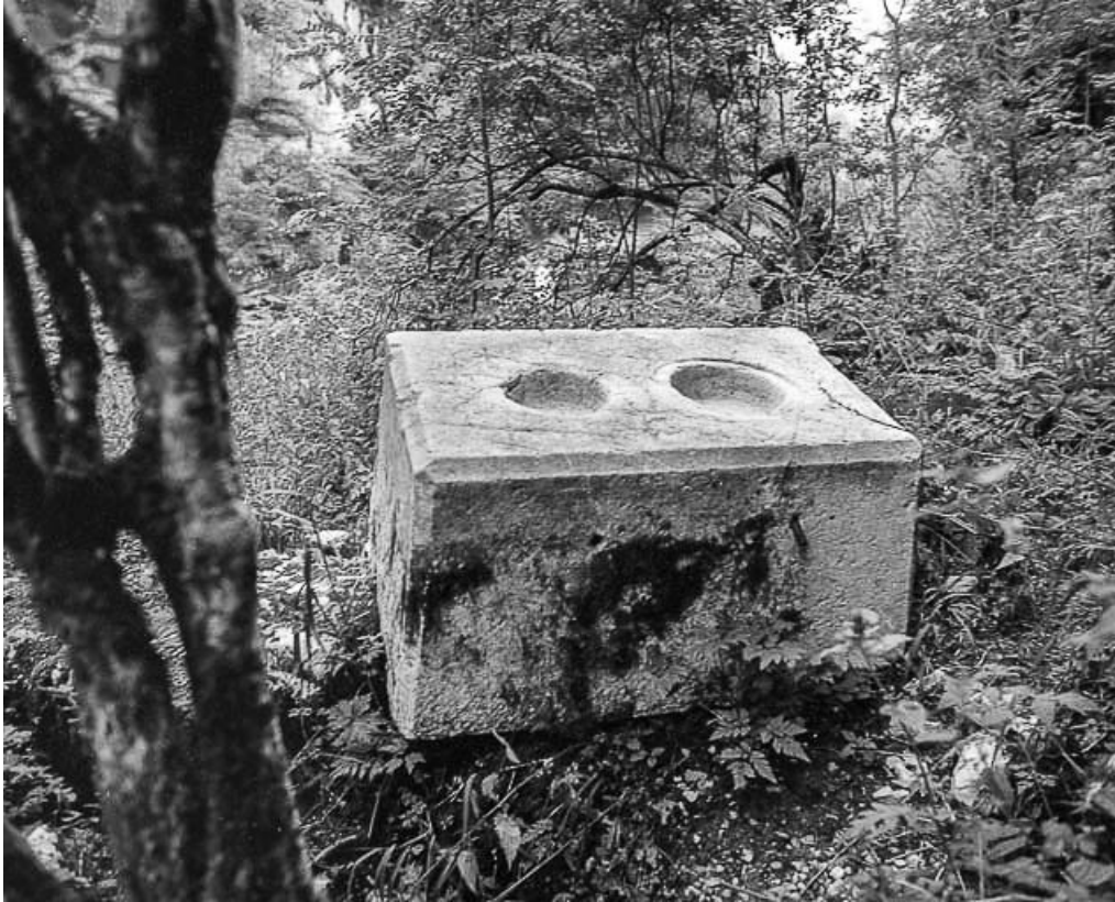
Pierre destinée à recevoir les axes.

25, Villers-le-Lac, lieudit : le Pissoux