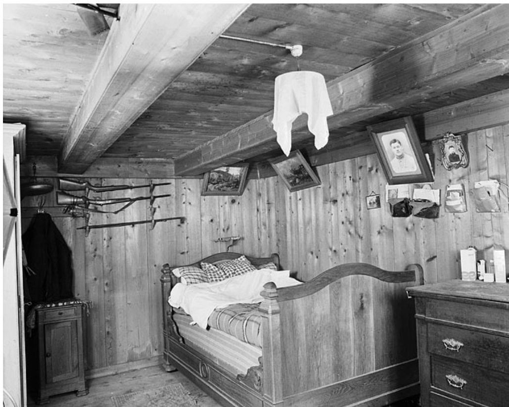
Intérieur : chambre droite au rez-de-chaussée.