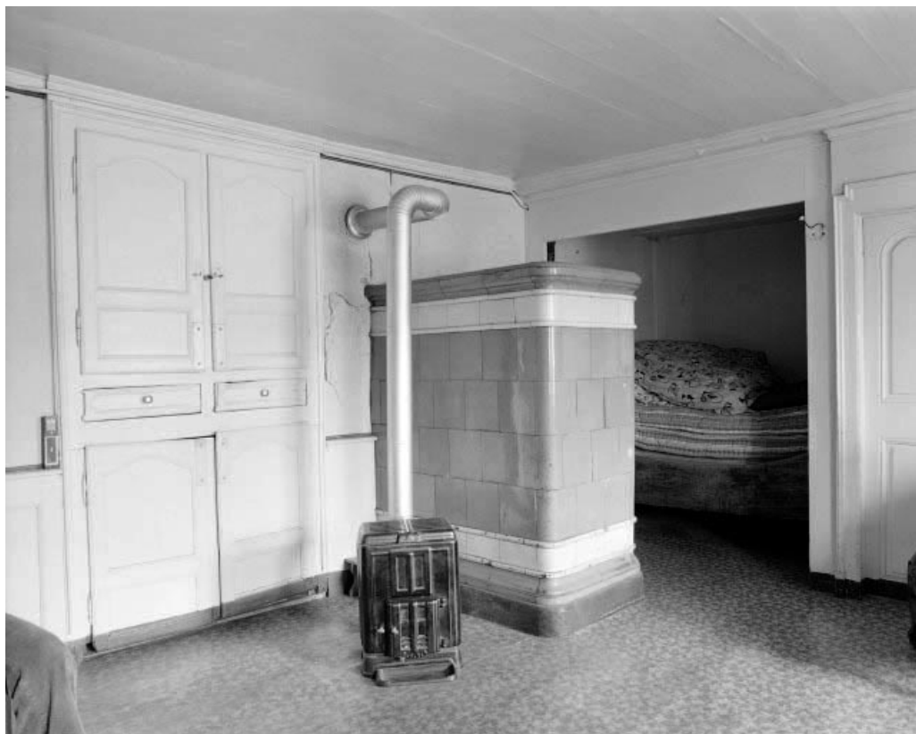
Intérieur : poêle gauche.