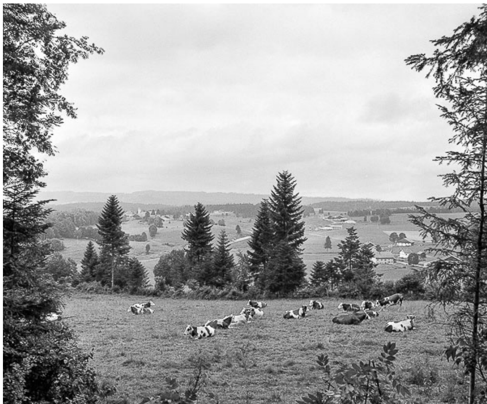
Les Combes : vue d'ensemble du village de la Motte et des hameaux du Bas de la Motte et des Paquets.