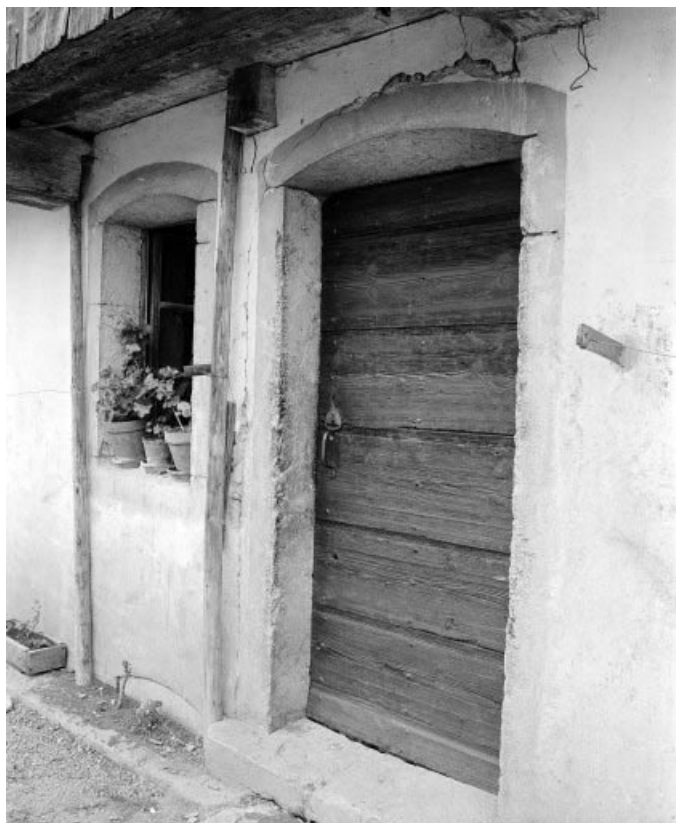
1ère ferme : : porte d'entrée