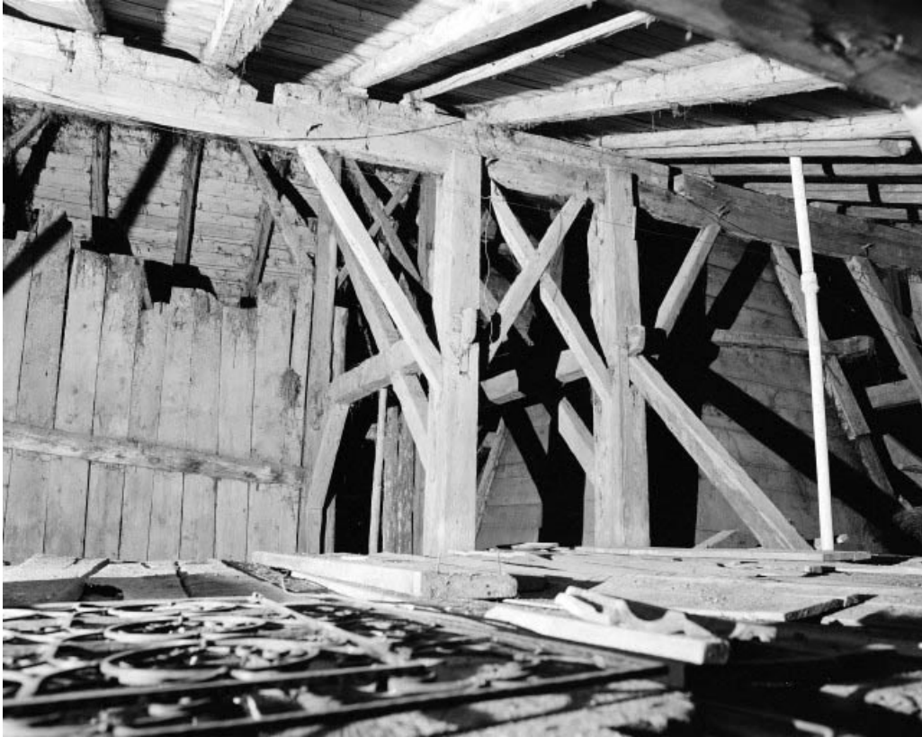
Intérieur : combles, fermes de charpente jumelées en arrière des "tués" au niveau d'une panne. 25, Grand'Combe-Châteleu, lieudit : Bas de Grand-Combe