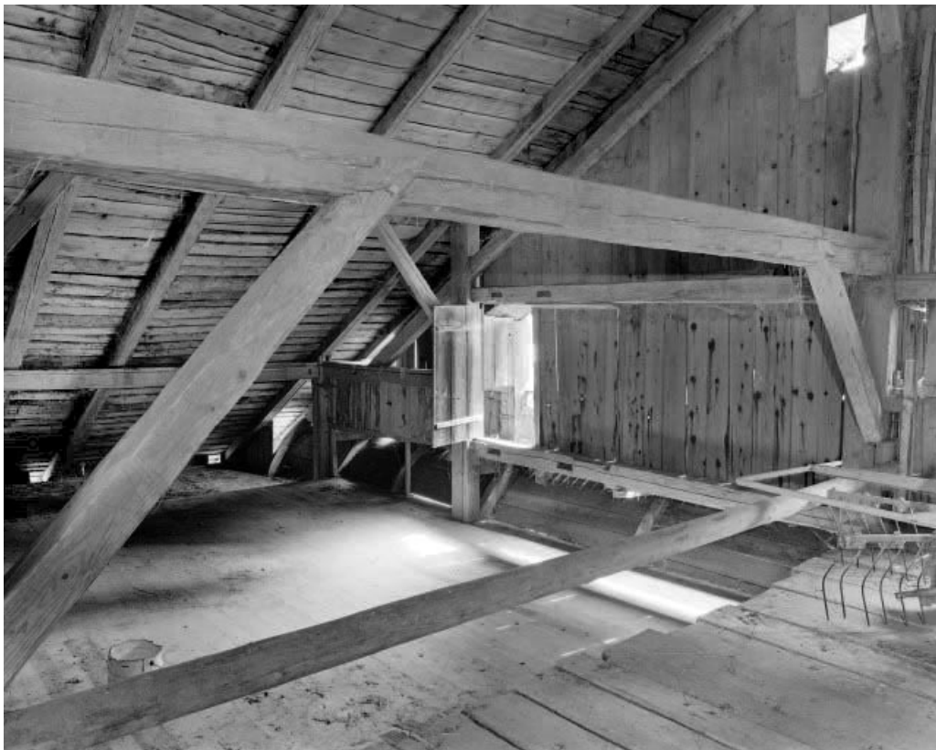
Charpente et lambrequer antérieure à surplomb cintré.