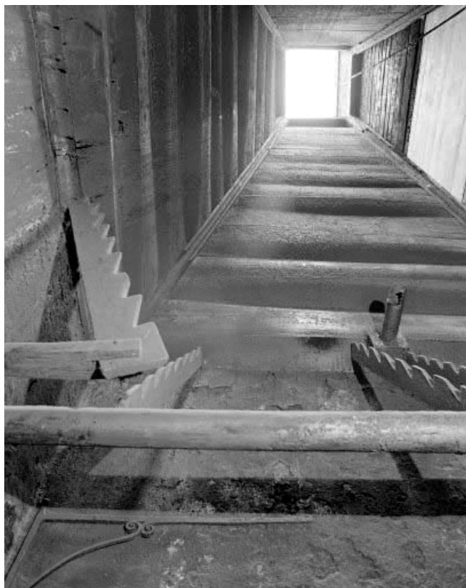
Intérieur : le grand "tué" vu depuis le bas.

25, Les Gras, 3 rue le Dessus de la Fin, lieudit : le Dessus de la Fin