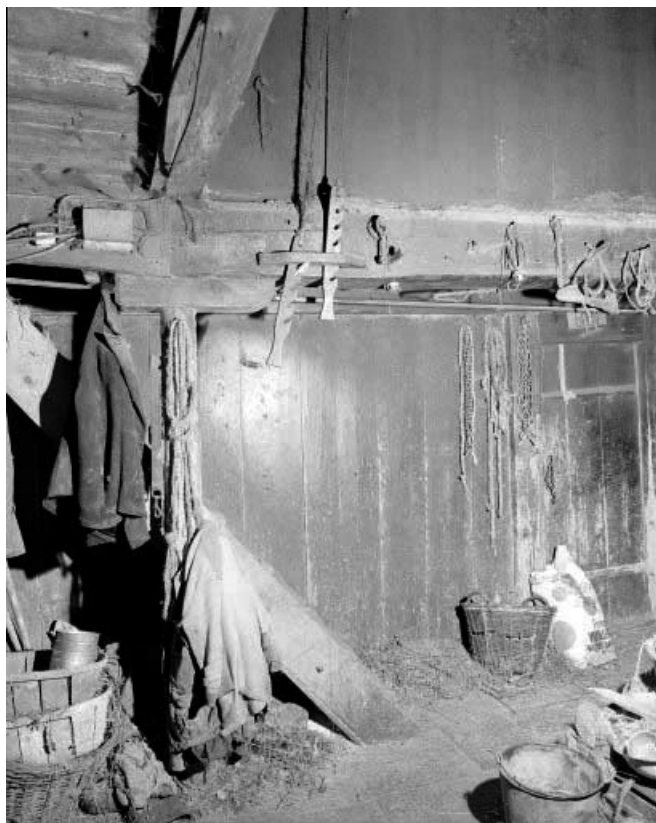
Pièce du "tué" : escalier de la grange et crémaillère des "manteaux" du "tué". 25, Les Gras, 1 chemin de la Grande Raie, lieudit : les Epaisses