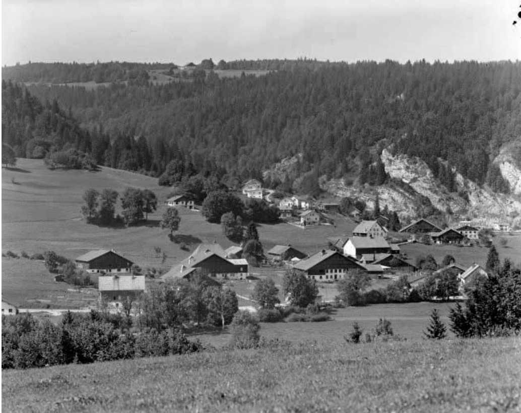
Les Cordiers et le Bois du Four : vue depuis Morestans.