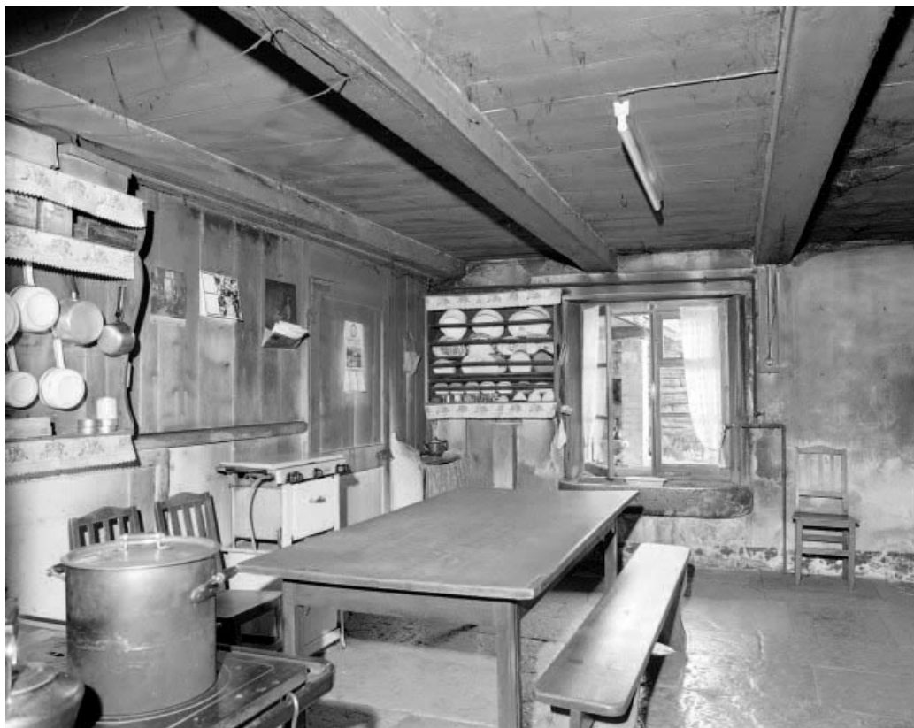
Intérieur : cuisine droite, vue depuis le "tué".