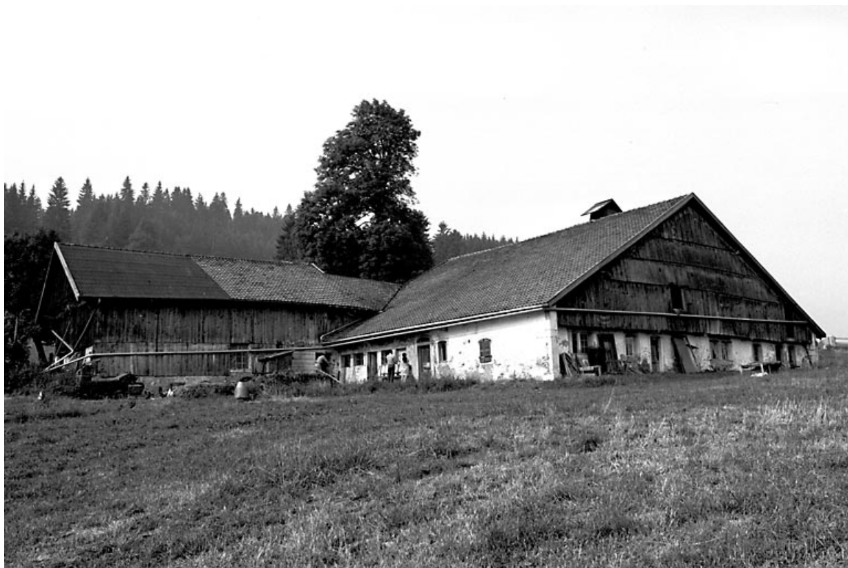
Vue d'ensemble, face nord.