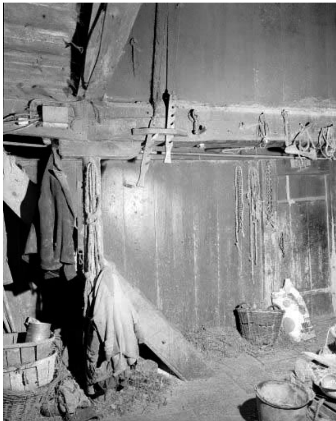
Pièce du "tué" : escalier de la grange et crémaillère des "manteaux" du "tué". 25, Les Gras, 1 chemin de la Grande Raie, lieudit : les Epaisses