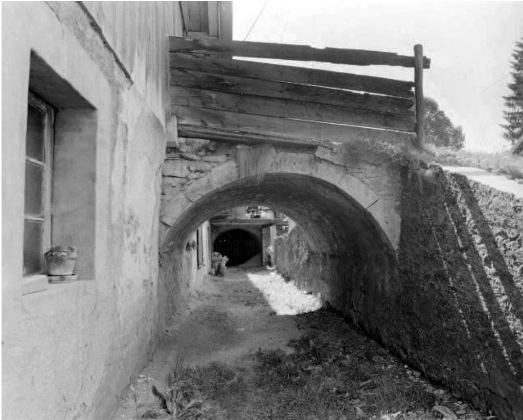
Façade antérieure : ponts de granges.