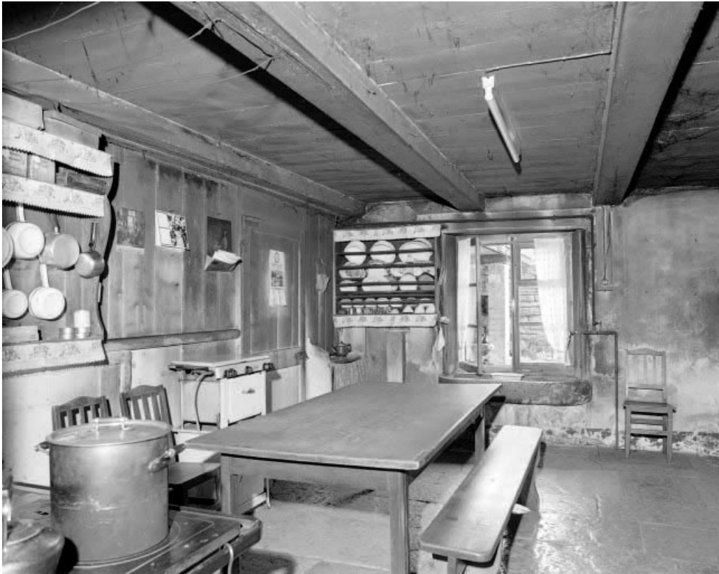
Intérieur : cuisine droite, vue depuis le "tué".