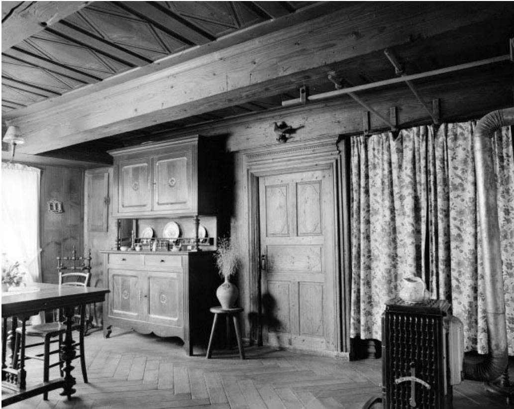
Intérieur : le "poêle".

25, Grand'Combe-Château, lieudit : Morestans