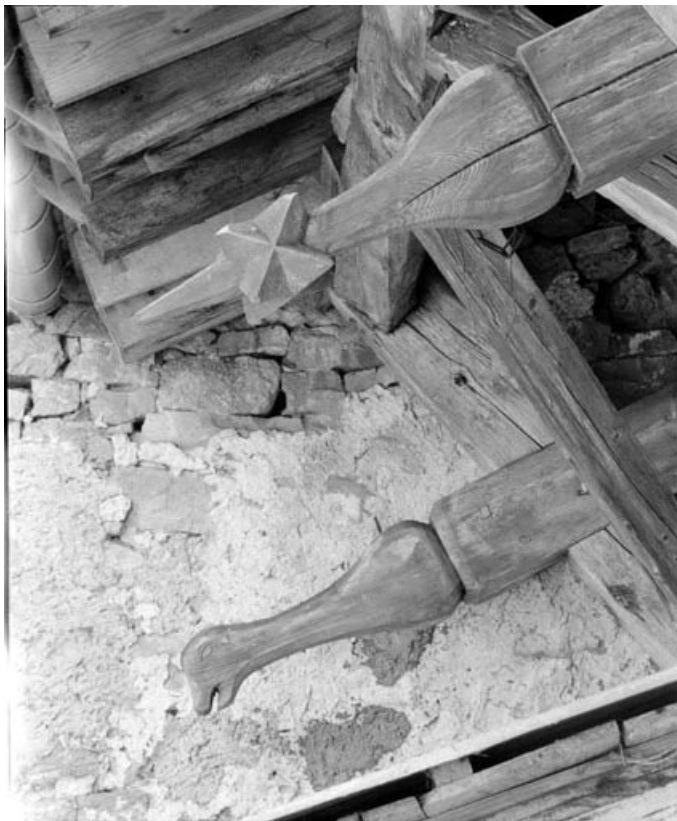
Détail : extrémité d'arbalétriers sculptés.