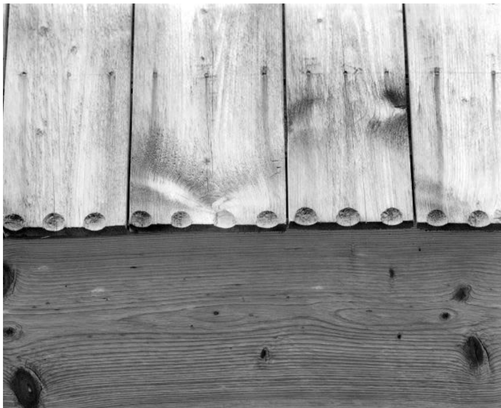
Détail : extrémité inférieure des planches de la lambrequre de la façade.

25, Les Fins 2e ferme, lieudit : le Bas de la Chaux