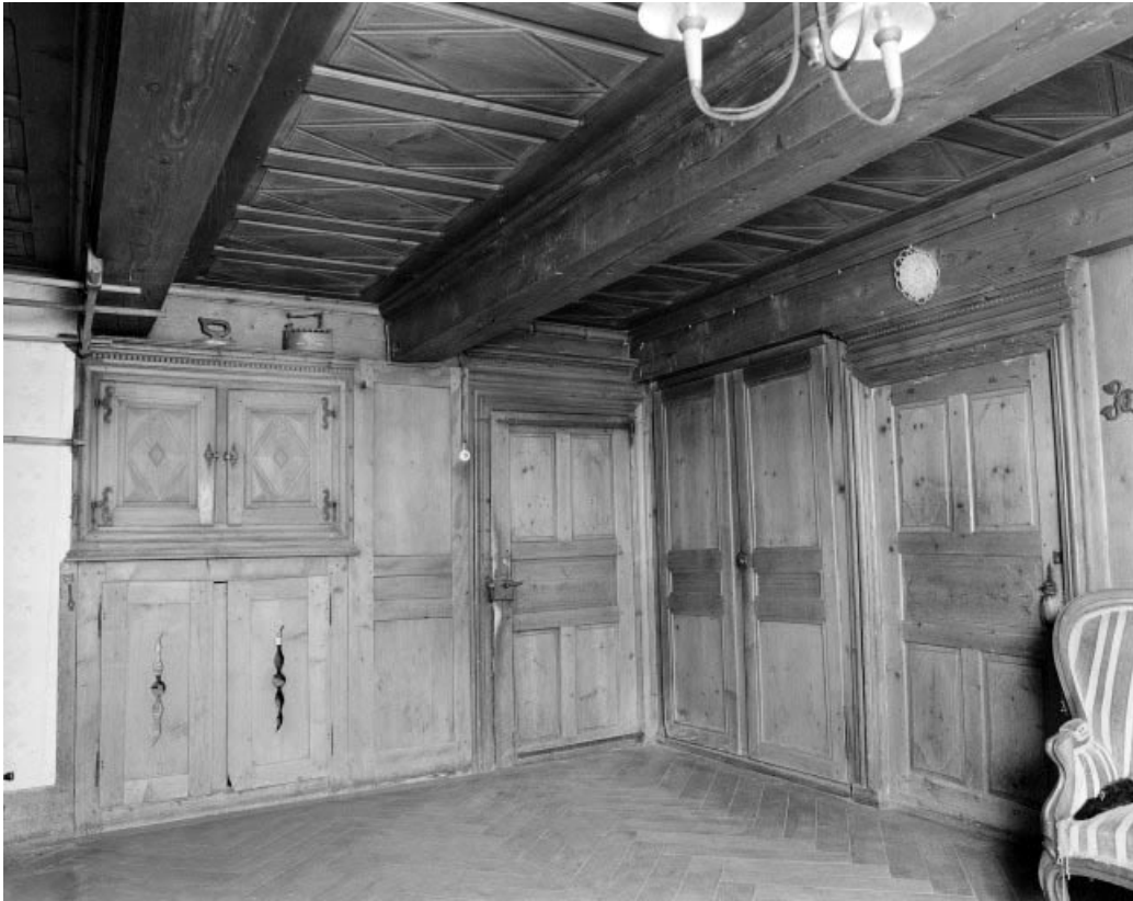
Intérieur : le "poêle", placards et boiseries.

25, Grand'Combe-Château, lieudit : Morestans