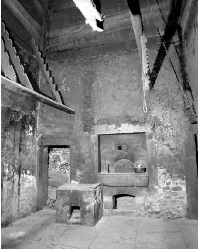
Intérieur : base du grand "tué" , four et bûcher.

25, Les Gras, 3 rue le Dessus de la Fin, lieudit : le Dessus de la Fin