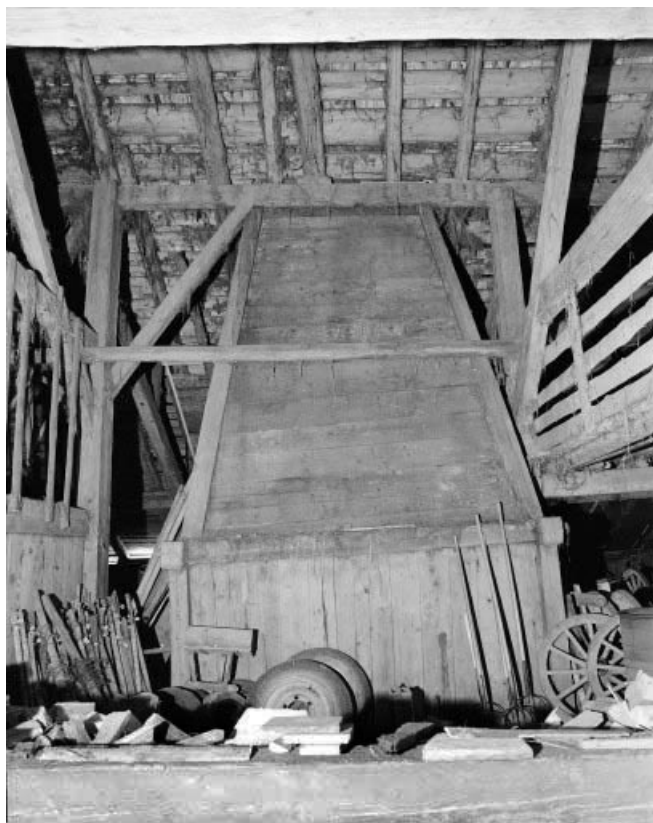
Intérieur : le petit "tué" vu depuis la grange.

25, Les Gras, 3 rue le Dessus de la Fin, lieudit : le Dessus de la Fin