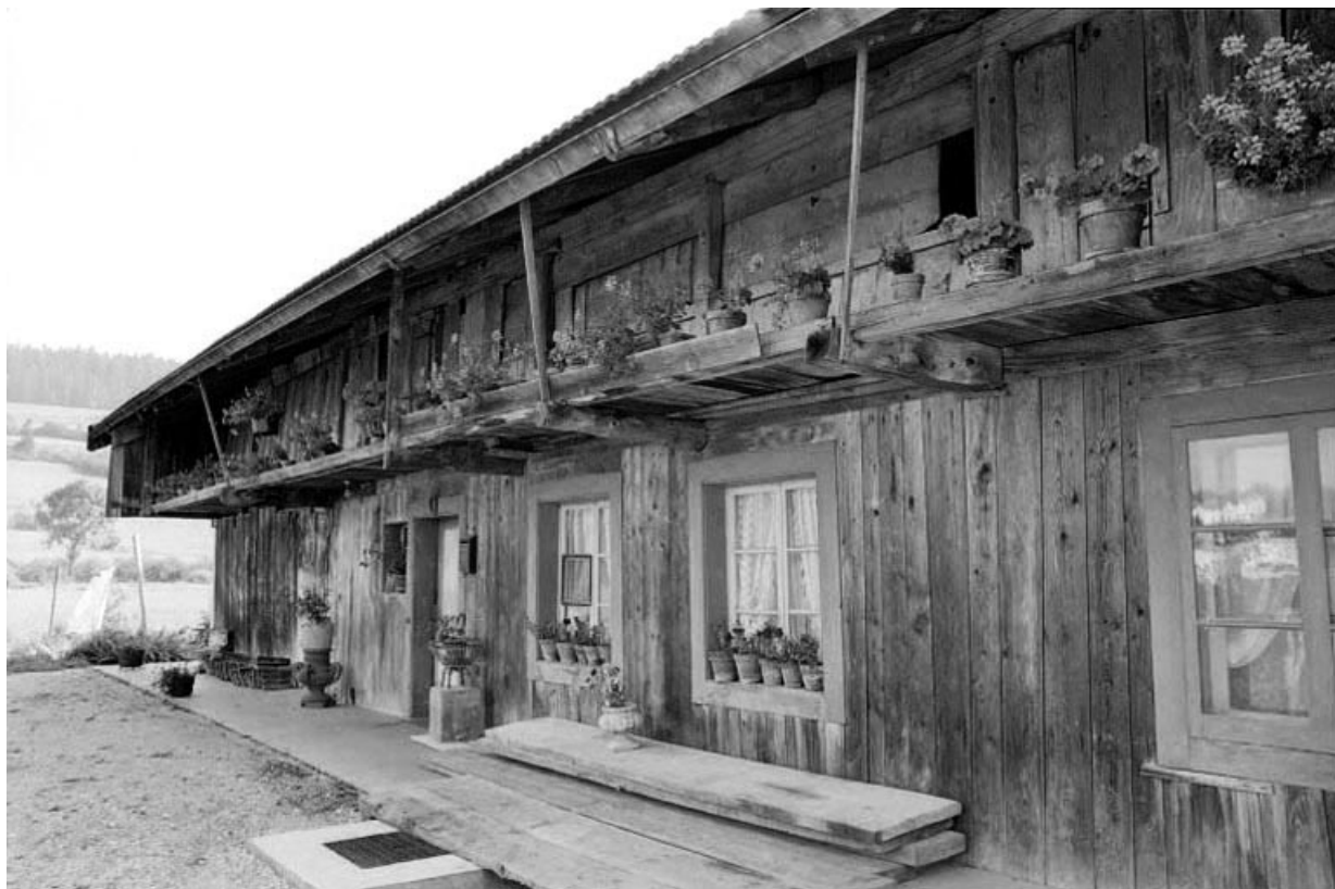
Ferme 5 : façade latérale.