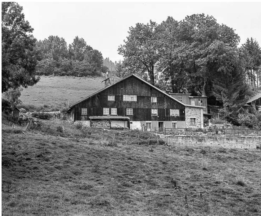
Grand'Combe Châteleur : façade antérieure.