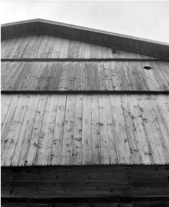
Lambrechure de la façade antérieure.

25, Les Fins 2e ferme, lieudit : le Bas de la Chaux