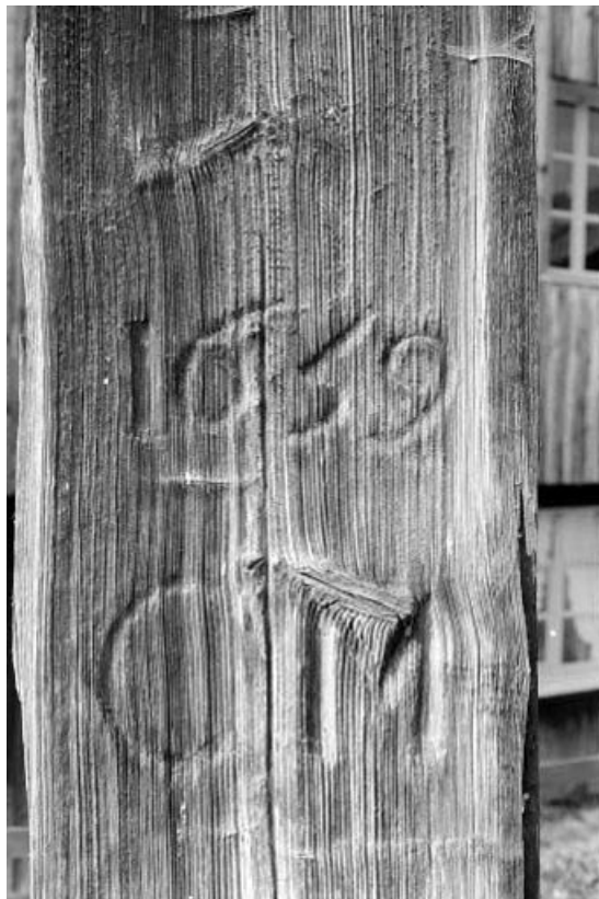
Ferme 4 : date et initiales sur la lambrechure.