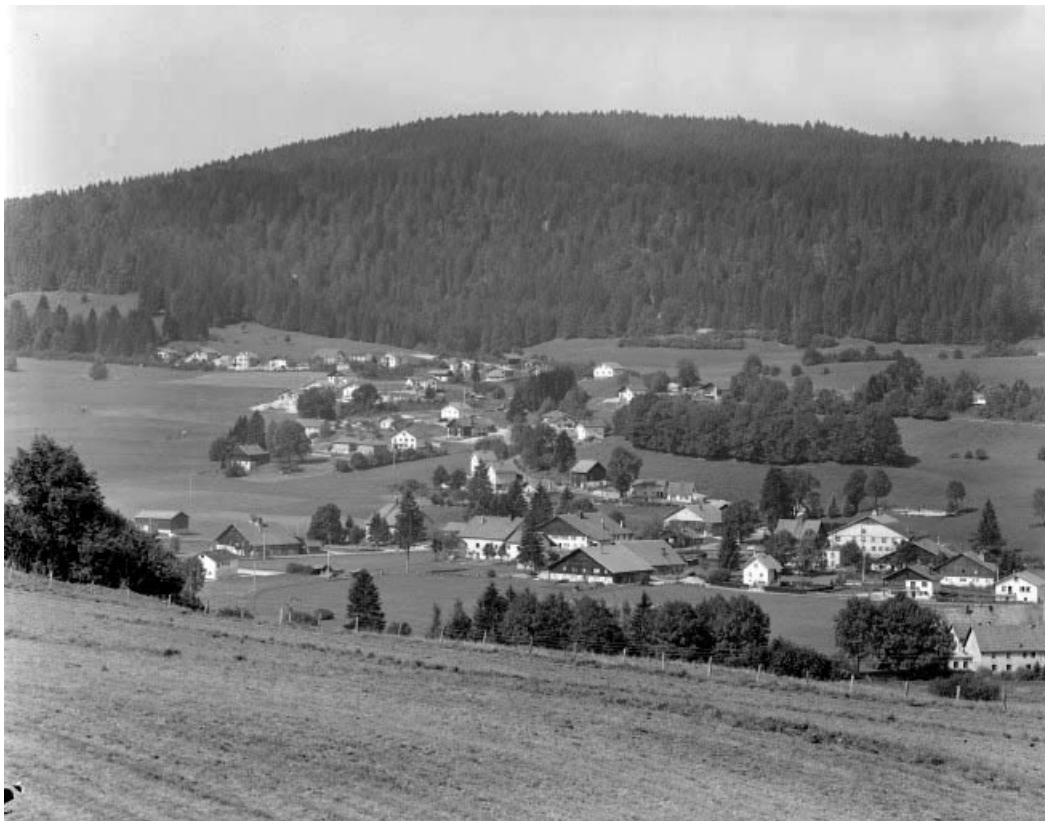
Le village en direction du village des Gras.