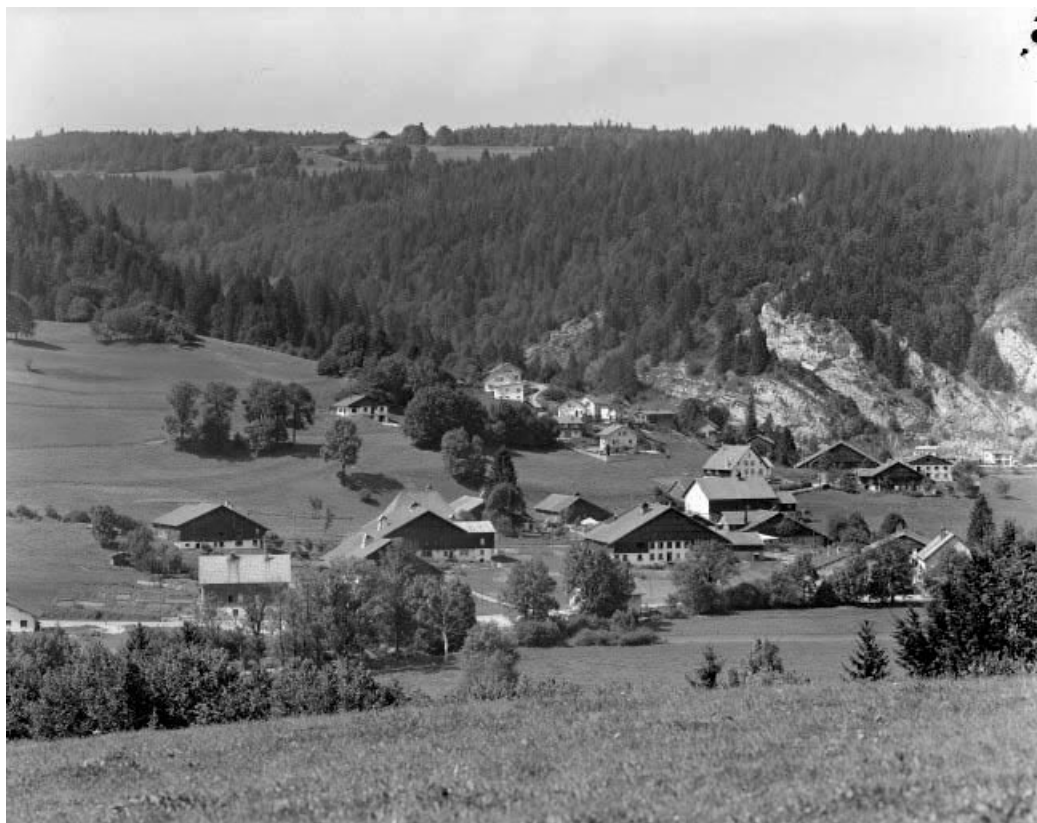
Les Cordiers et le Bois du Four : vue depuis Morestans.