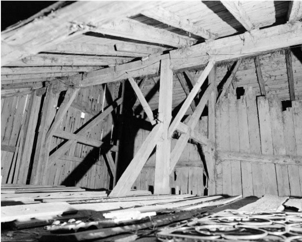
Intérieur : comble, fermes de charpente postérieures. 25, Grand'Combe-Châteleu, lieudit : Bas de Grand-Combe