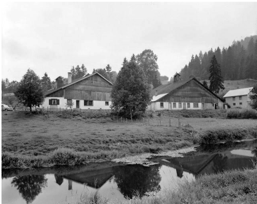
Ferme 1 et 2: façades antérieures.