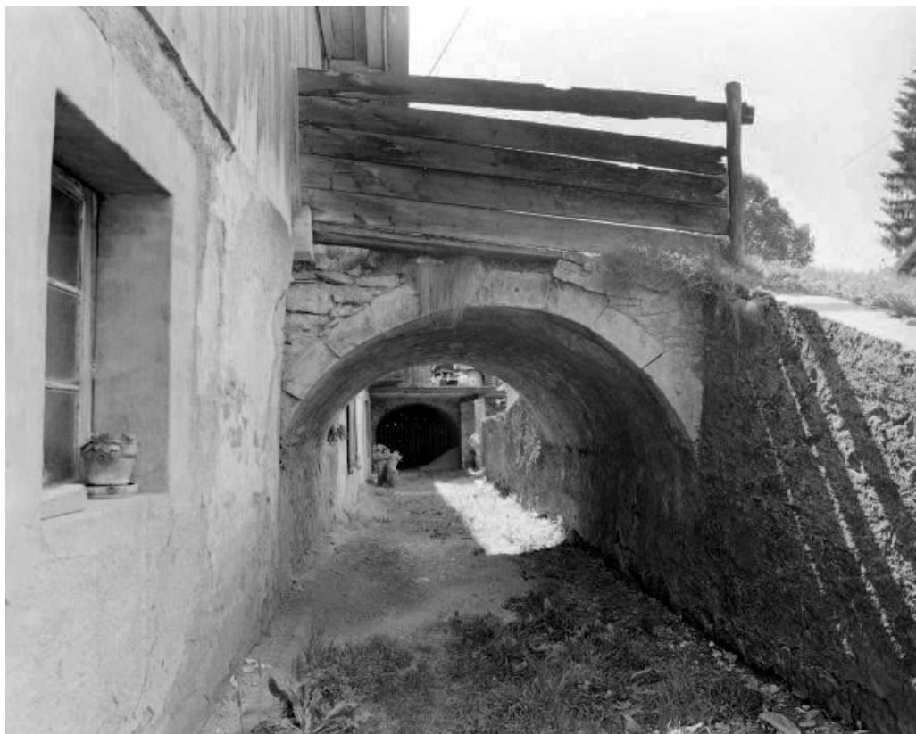
Façade antérieure : ponts de granges.