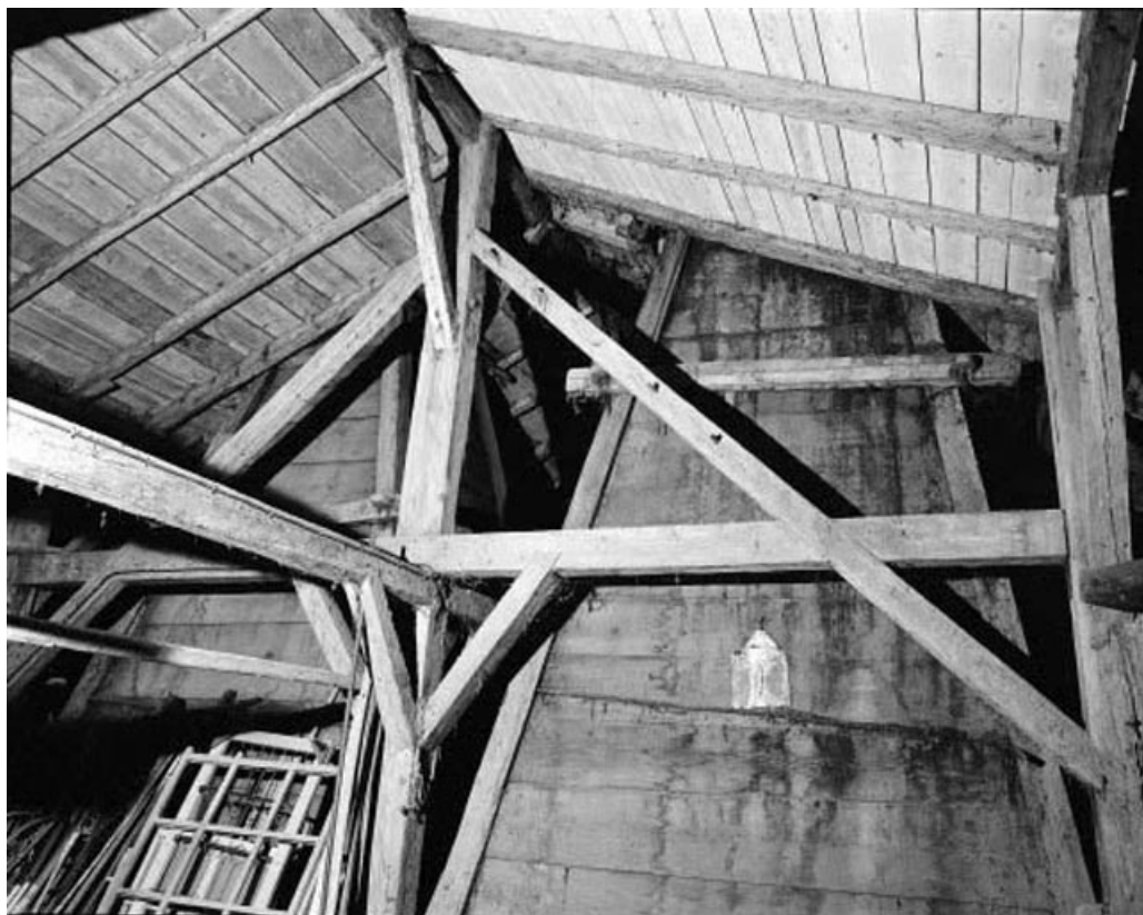
Intérieur : combes, fermes, charpente, hottes des "tués".