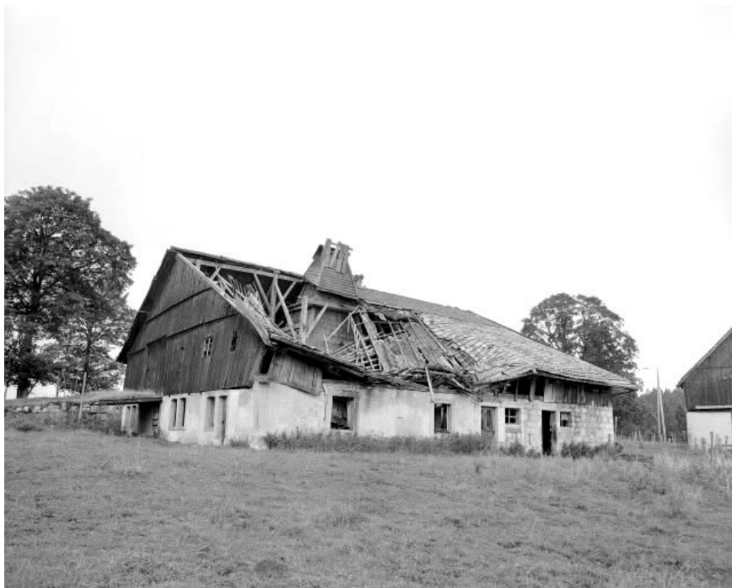
Ferme 1 : vue d'ensemble.