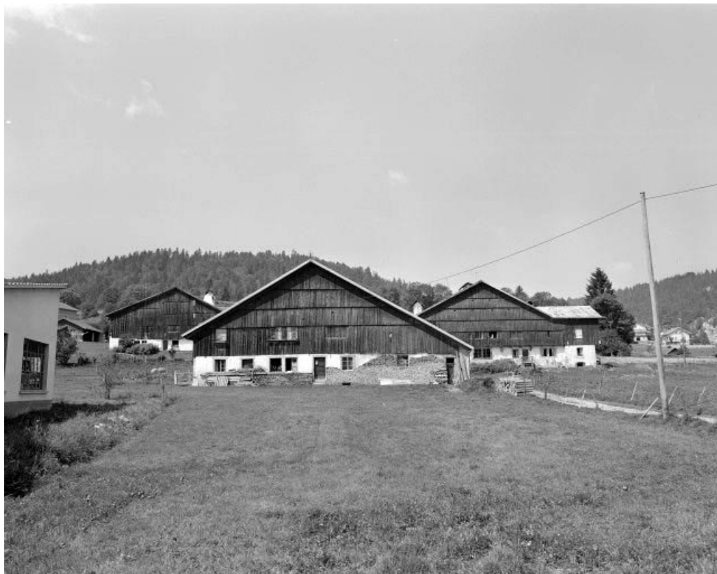
Les Cordiers, fermes 7-8-9 : vue depuis le Sud Est.