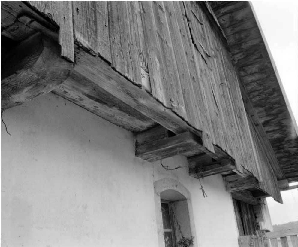
Surplomb de la lambrechure antérieure : rang de planches.

25, Les Combes rue du 8 Mai 1945, lieudit : la Motte