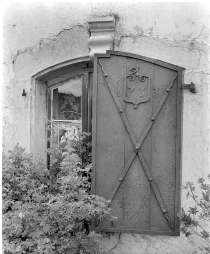
Fenêtre du "carré" : volet fermé.

25, Les Fins 2e ferme, lieudit : le Bas de la Chaux