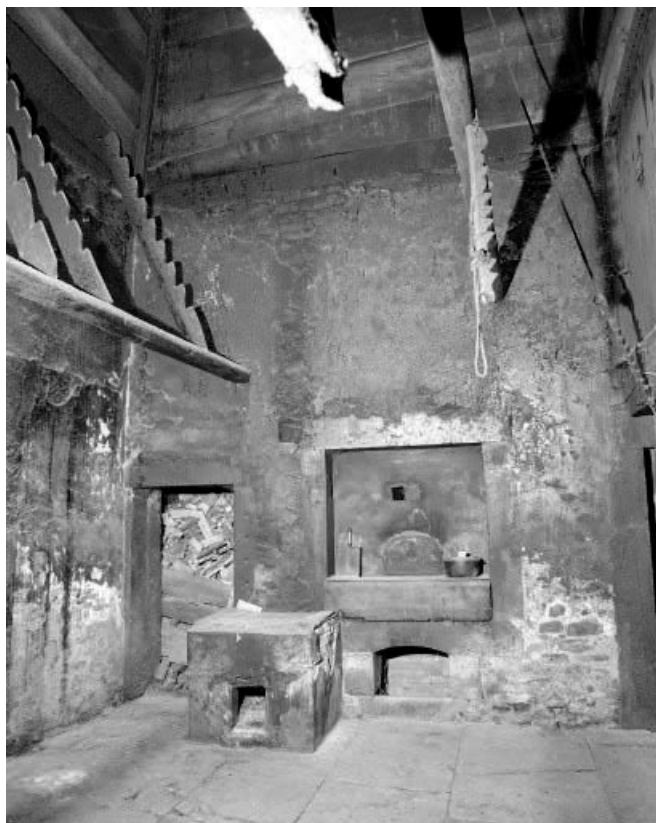
Intérieur : base du grand "tué" , four et bûcher.

25, Les Gras, 3 rue le Dessus de la Fin, lieudit : le Dessus de la Fin