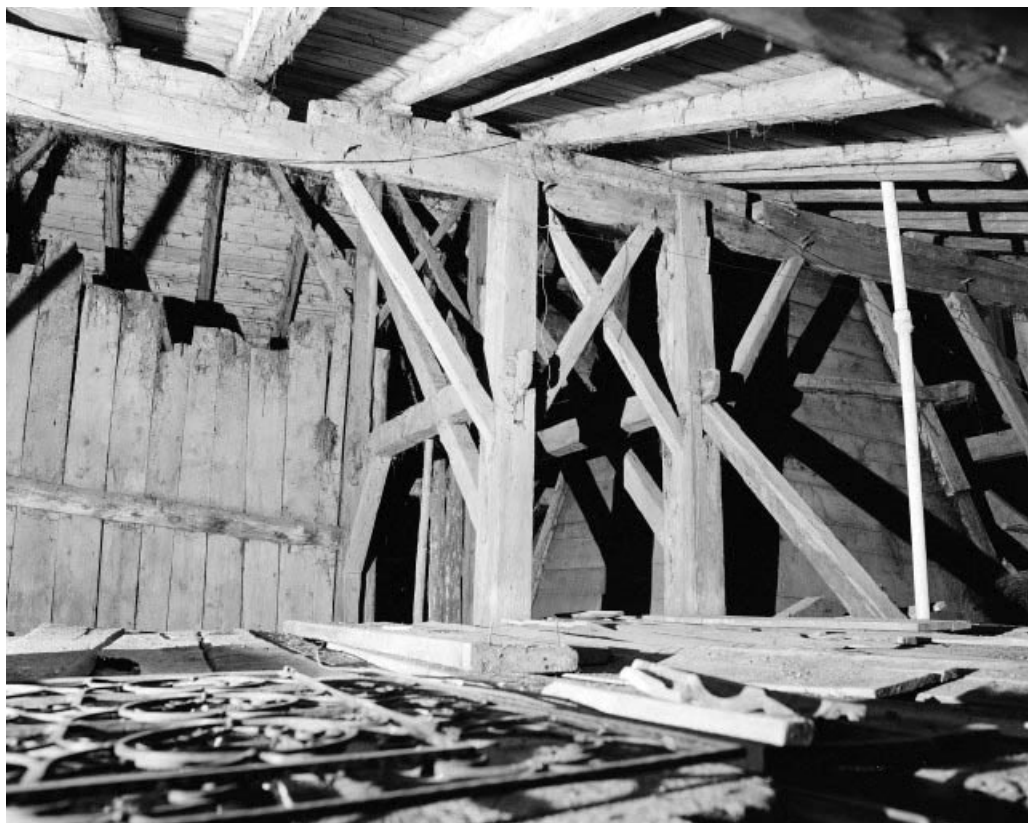
Intérieur : comble, fermes de charpente jumelées en arrière des "tués" au niveau d'une panne.