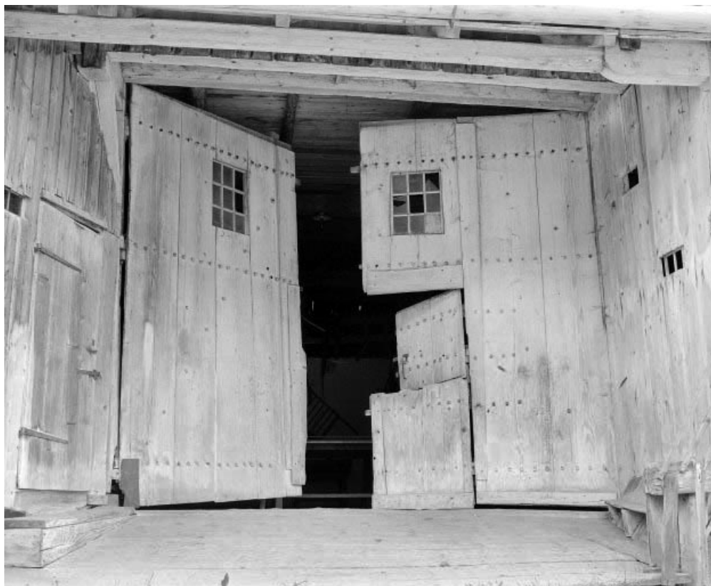
Détail : porte de grange droite, entrouverte.