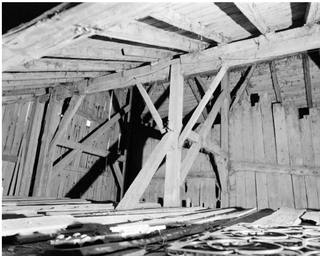
Intérieur : combles, fermes de charpente postérieures.