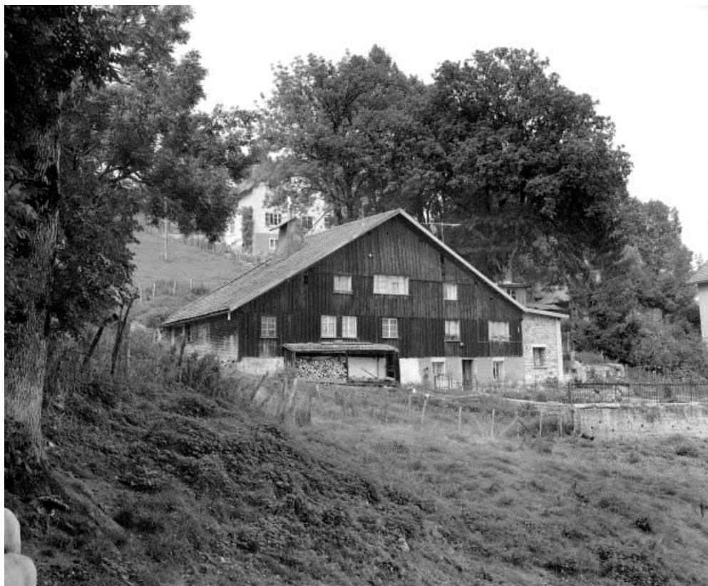
Les Cordiers : vue depuis le Nord Ouest.