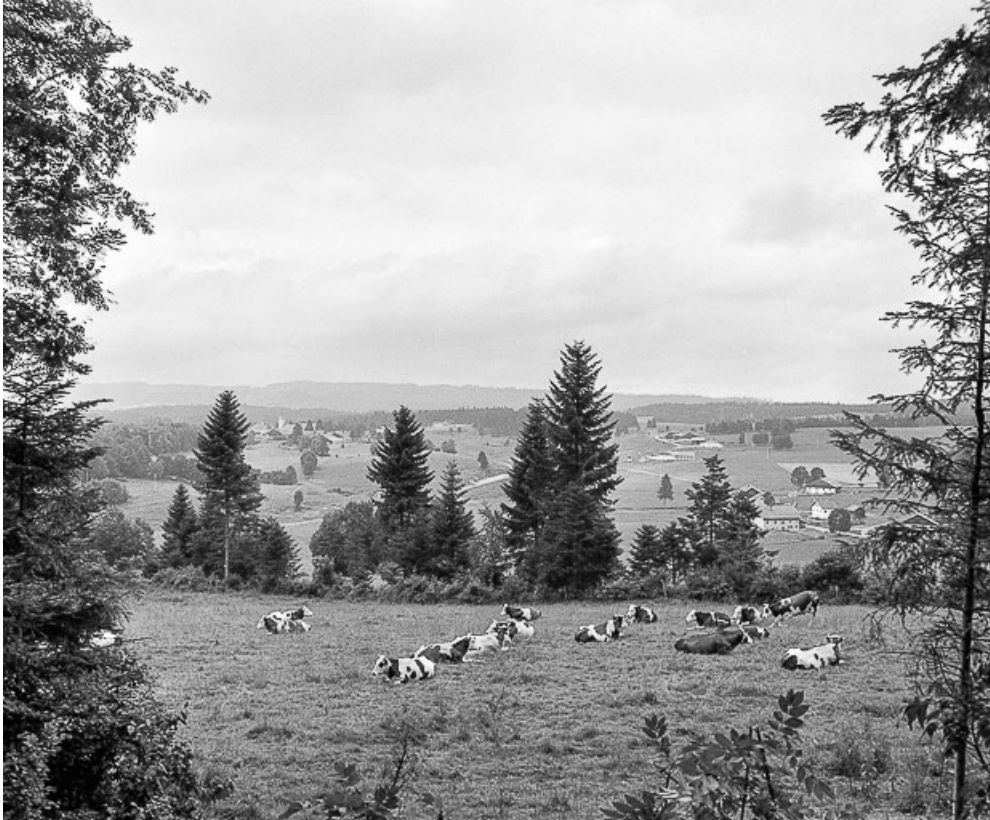
Les Combes : vue d'ensemble du village de la Motte et des hameaux du Bas de la Motte et des Paquets.