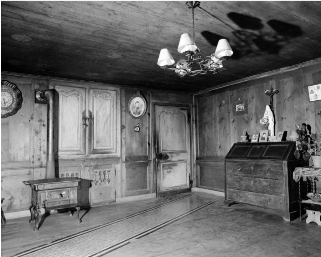
Intérieur : "poêle" droit.