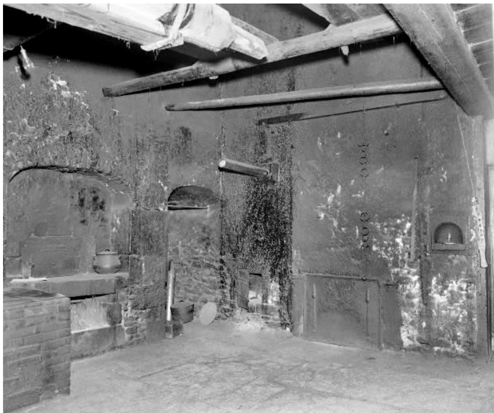
Intérieur : "tué" gauche.