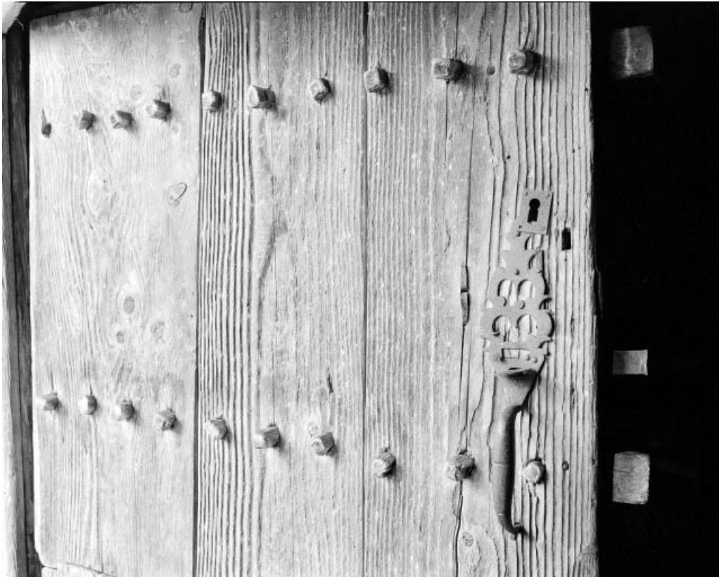
Détail : porte de grange gauche, poignée de porte.

25, Grand'Combe-Château, lieudit : Bas de Grand-Combe