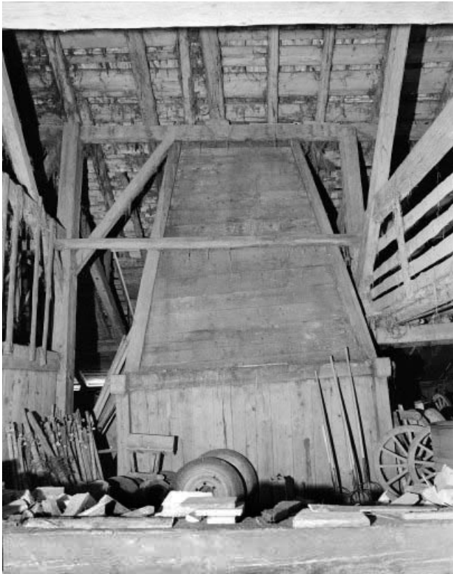
Intérieur : le petit "tué" vu depuis la grange.

25, Les Gras, 3 rue le Dessus de la Fin, lieudit : le Dessus de la Fin