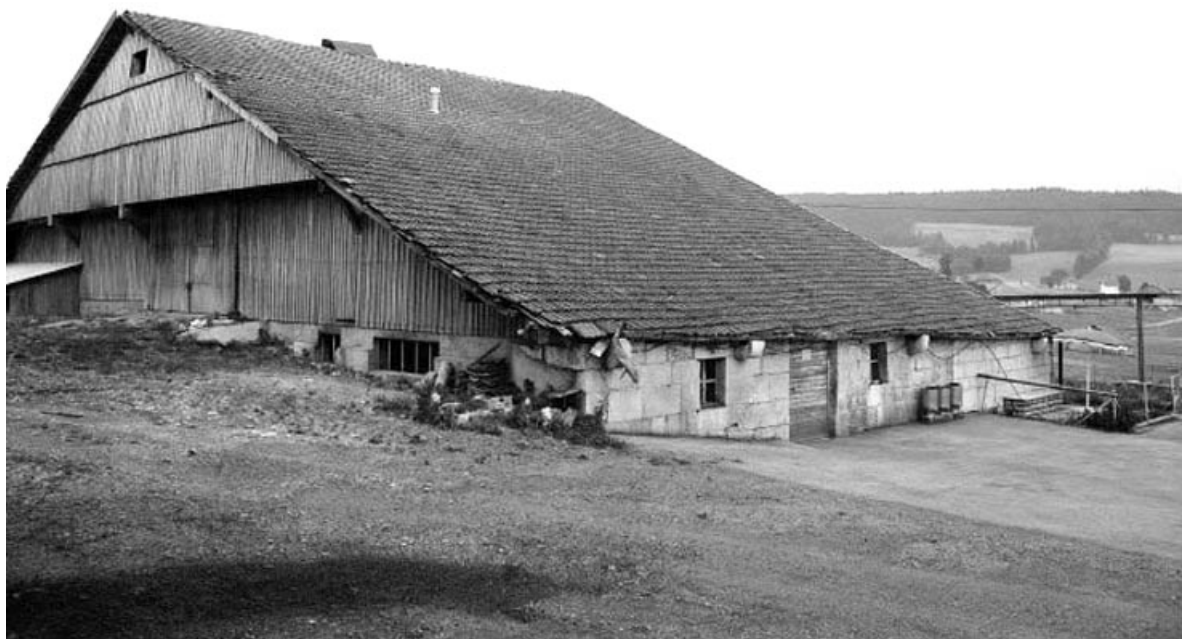
Facades postérieure et latérale gauche.