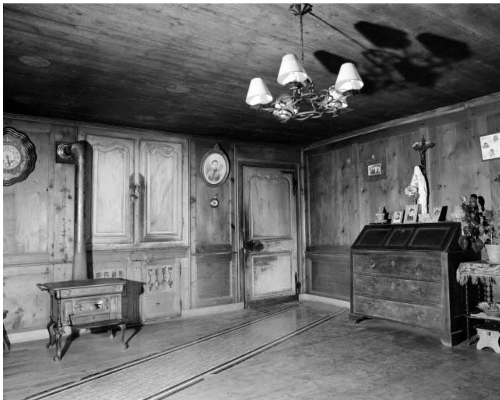
Intérieur : "poêle" droit.