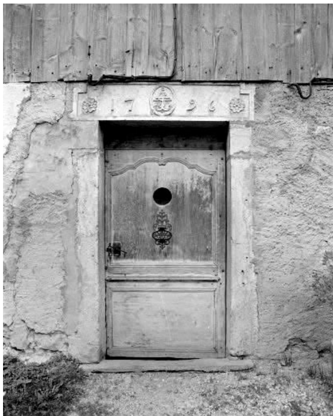
Façade antérieure : porte d'entrée.