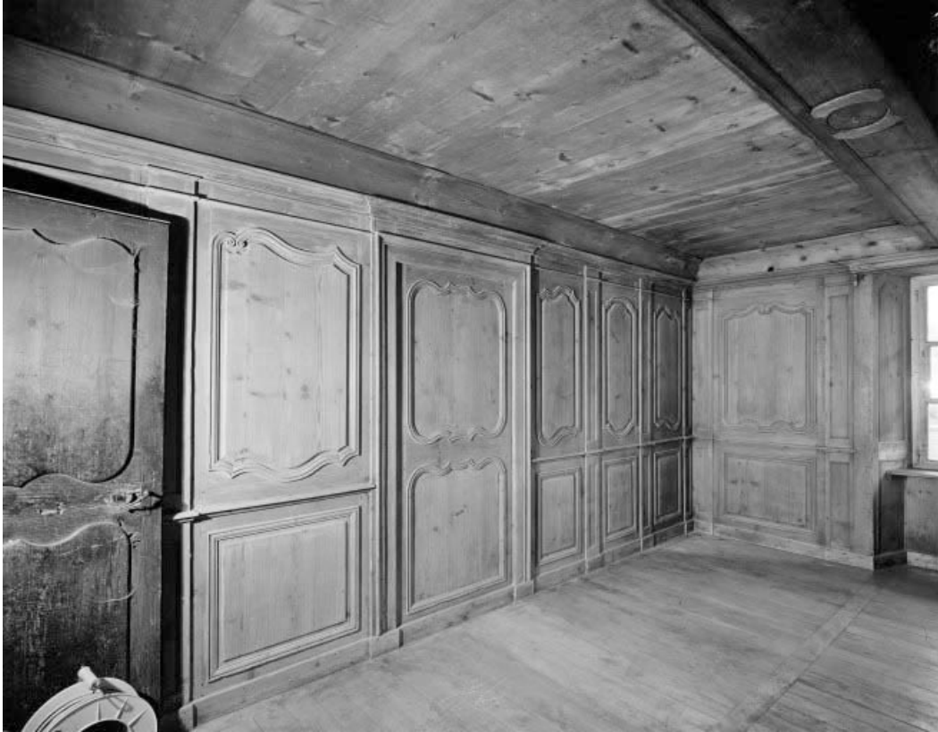
Intérieur : le "poêle".

25, Grand'Combe-Châteleu 3e ferme, lieudit : les Cordiers