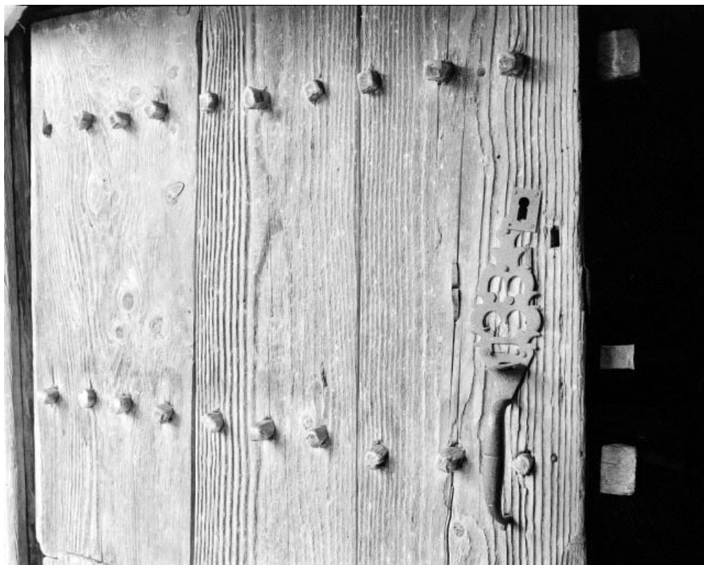
Détail : porte de grange gauche, poignée de porte.