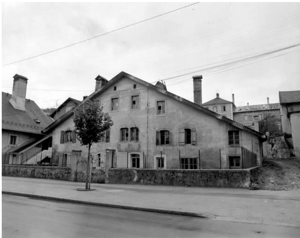
Ferme : façade antérieure.