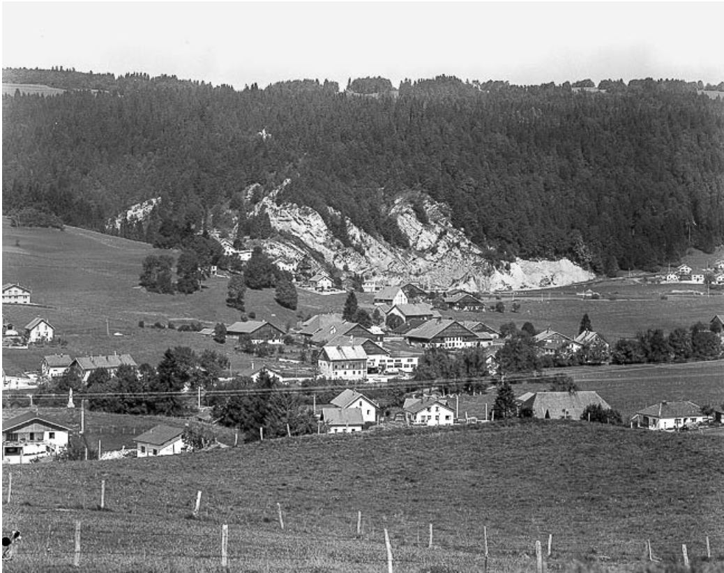
Grand'Combe Châteleu, lieux-dits Les Cordiers et Les Bois du Fourg : vue depuis Morestans.