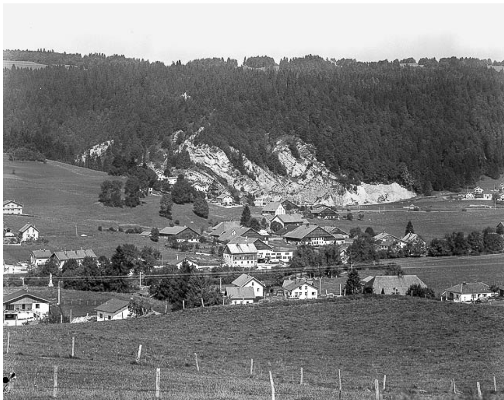
Grand'Combe Châteleu, lieux-dits Les Cordiers et Les Bois du Fourg : vue depuis Morestans.