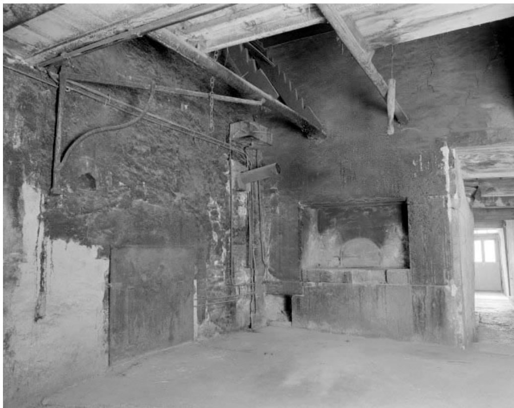
Intérieur : pièce du tué.