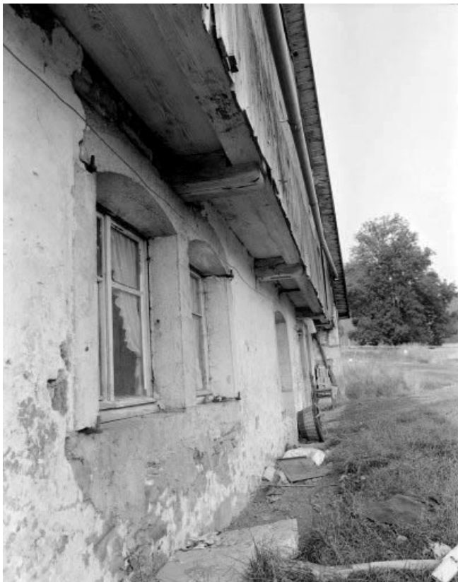
Extérieur : façade antérieure, détail : surplomb de la lambrechure.