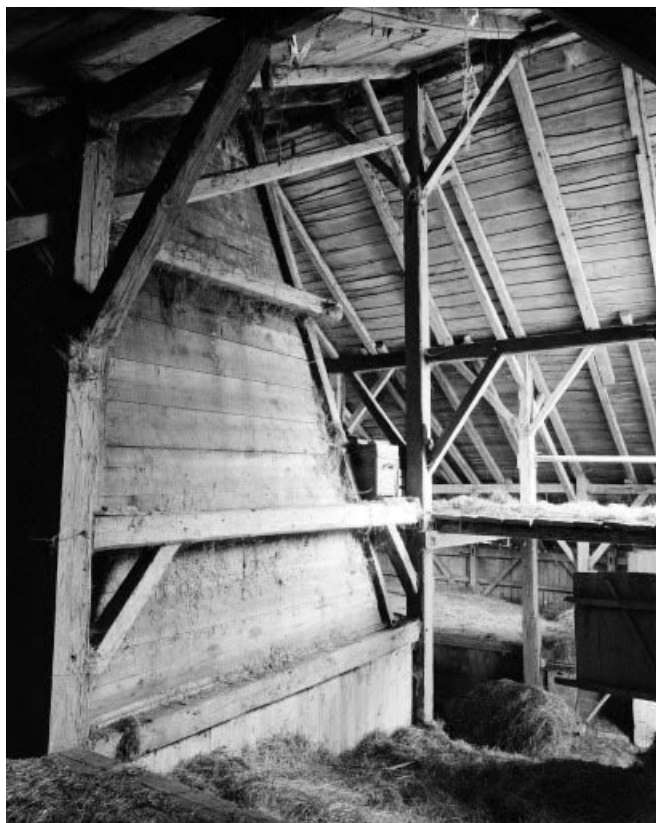
Charpente et tué.