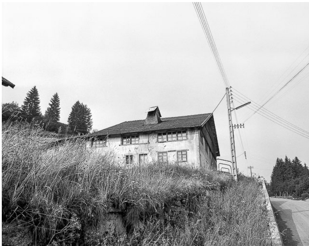
Ferme située 3 rue du Moulin : façades antérieure et latérale gauche 25, Les Gras