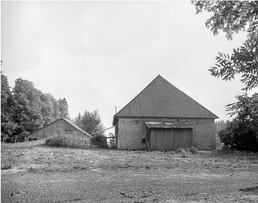
Ferme située au lieu-dit Champagne-Dessus, cadastrée ZL 1 : façade postérieure. 25, Les Gras