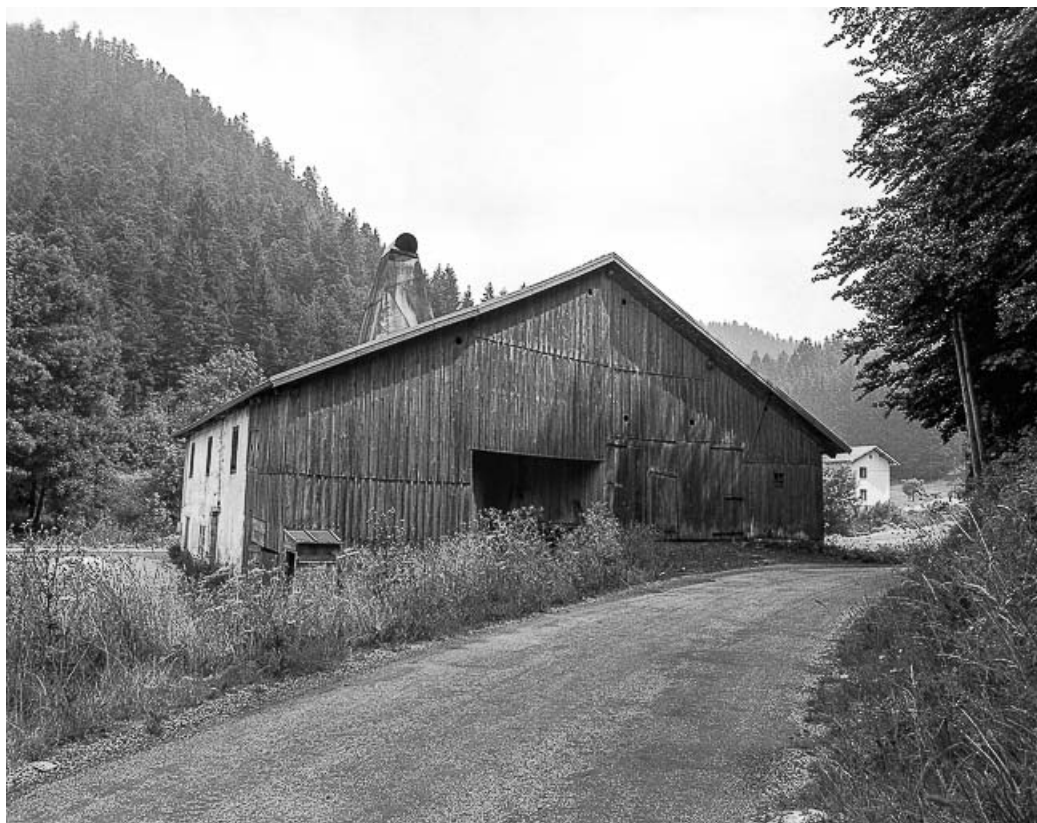
Ferme située au lieu-dit Le Dessus de la Fin, cadastrée A1 115 : facade latérale droite. 25, Les Gras