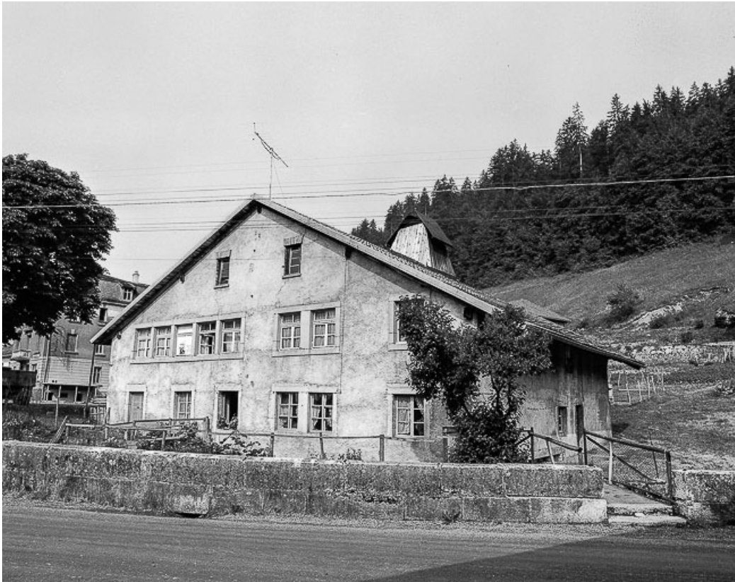
Ferme située1 Grande Rue : façades antérieure et latérale droite. 25, Les Gras