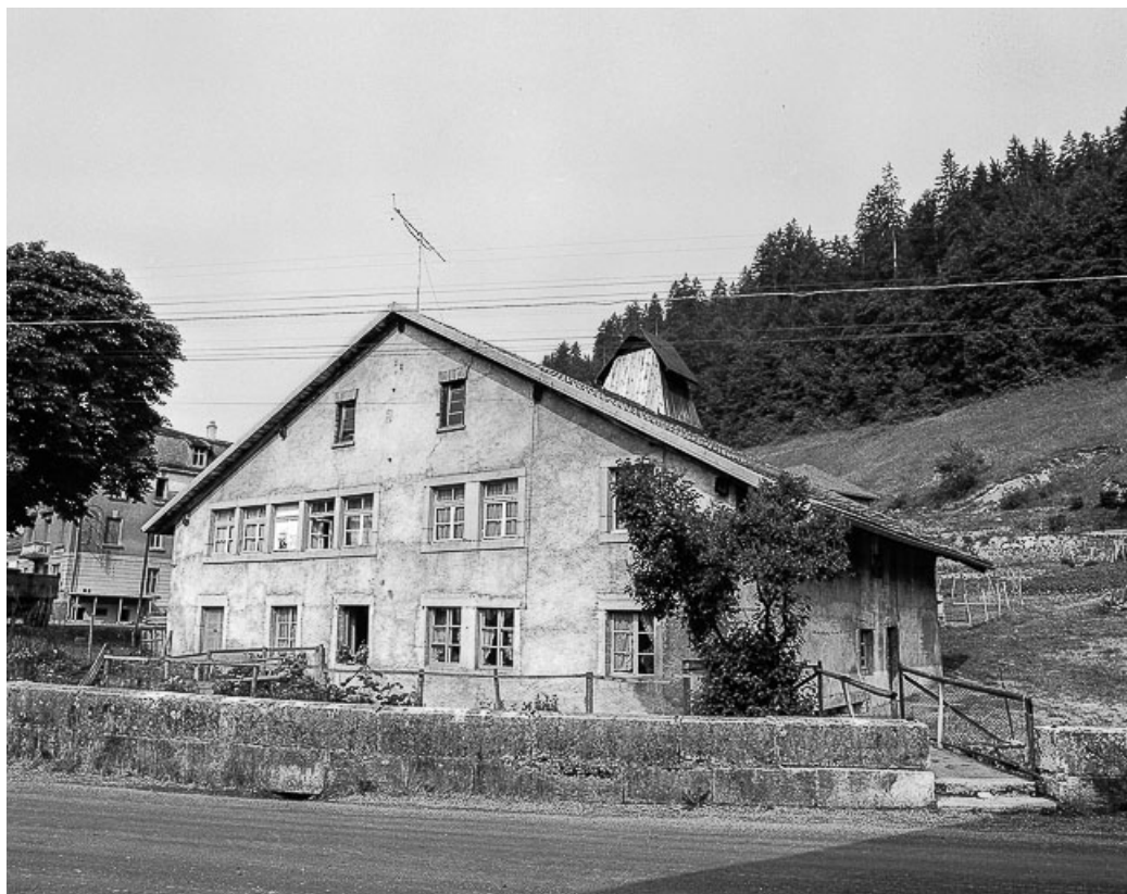
Ferme située1 Grande Rue : façades antérieure et latérale droite. 25, Les Gras