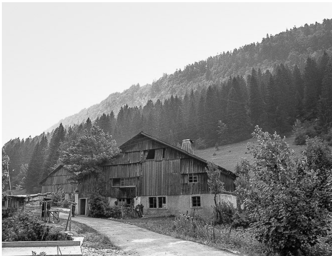
Ferme située au lieu-dit Le Theverot, cadastrée ZL 28 : vue d'ensemble. 25, Les Gras