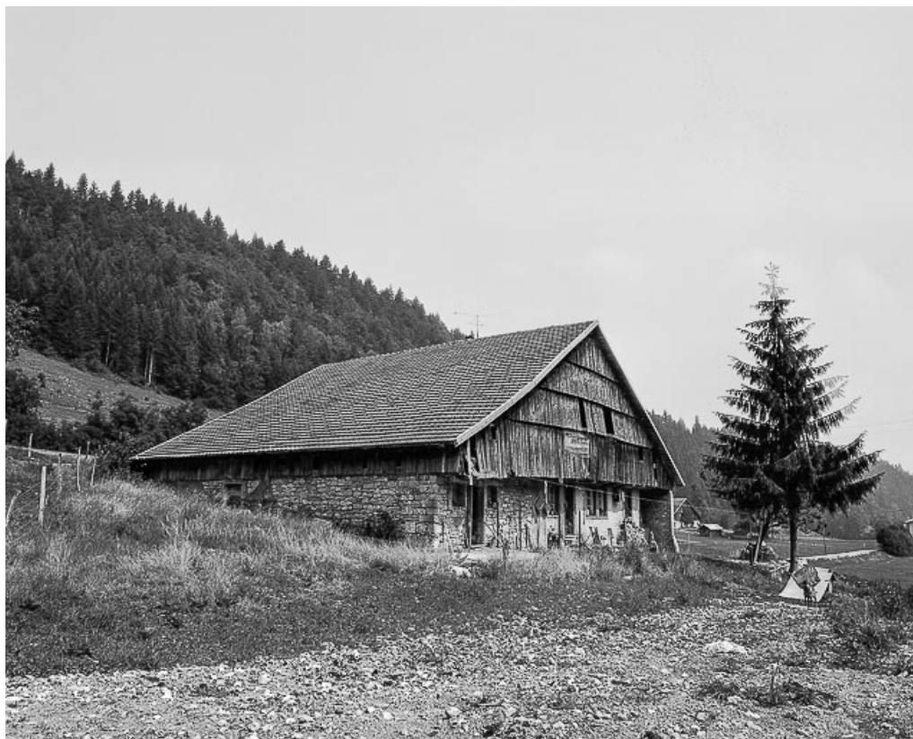
Ferme située au lieu-dit Champagne-Dessous, cadastrée ZA 2 : façades antérieure et latérale gauche. 25, Les Gras