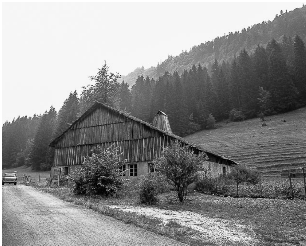
Ferme située au lieu-dit Le Theverot, cadastrée ZL 26 : vue d'ensemble. 25, Les Gras