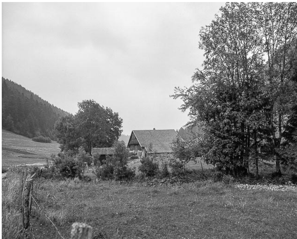
Ferme située au lieu-dit Le Theverot, cadastrée ZL 9 : vue d'ensemble. 25, Les Gras