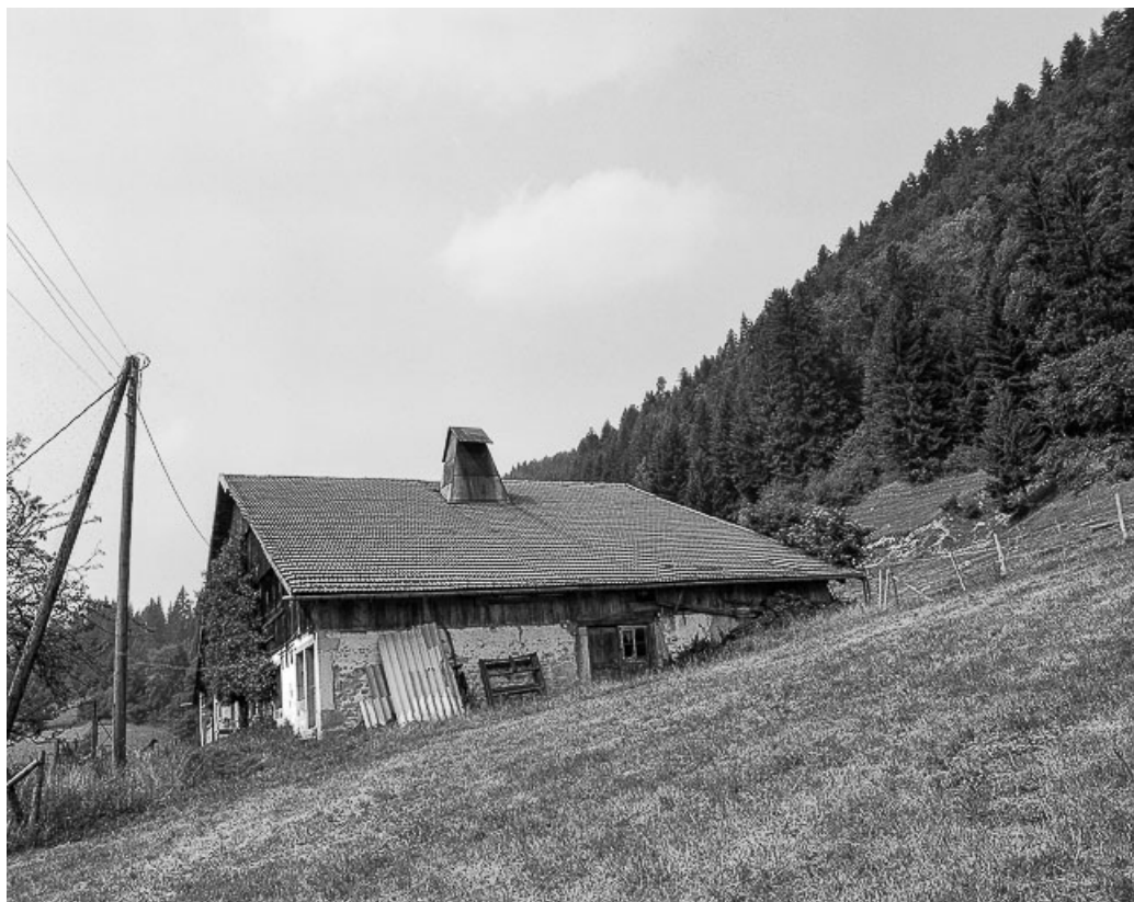
Ferme située au lieu-dit Champagne-Dessous, cadastrée ZA 4 : façades antérieure et latérale droite. 25, Les Gras