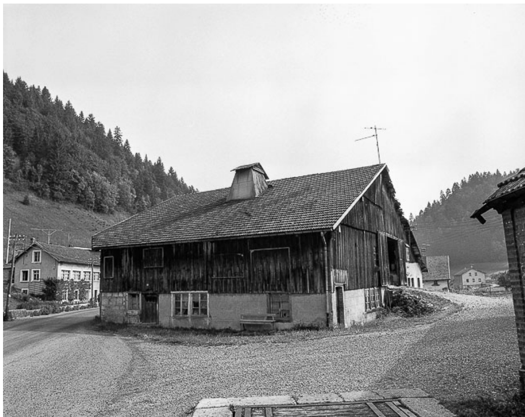
Ferme situé 6-8 Grande Rue : façades postérieure et latérale droite. 25, Les Gras