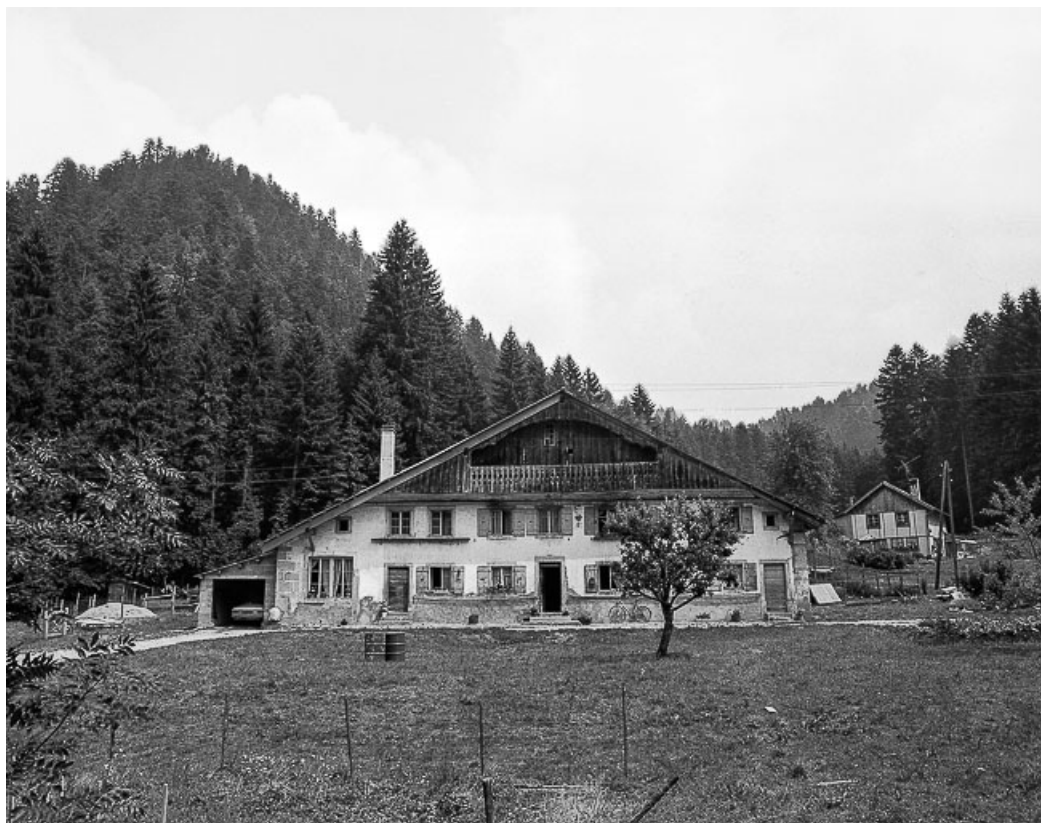
Ferme située au lieu-dit Le Dessus de la Fin, cadastrée B 1-6 : façade antérieure. 25, Les Gras, 6 rue le Dessus de la Fin, lieudit : le Dessus de la Fin