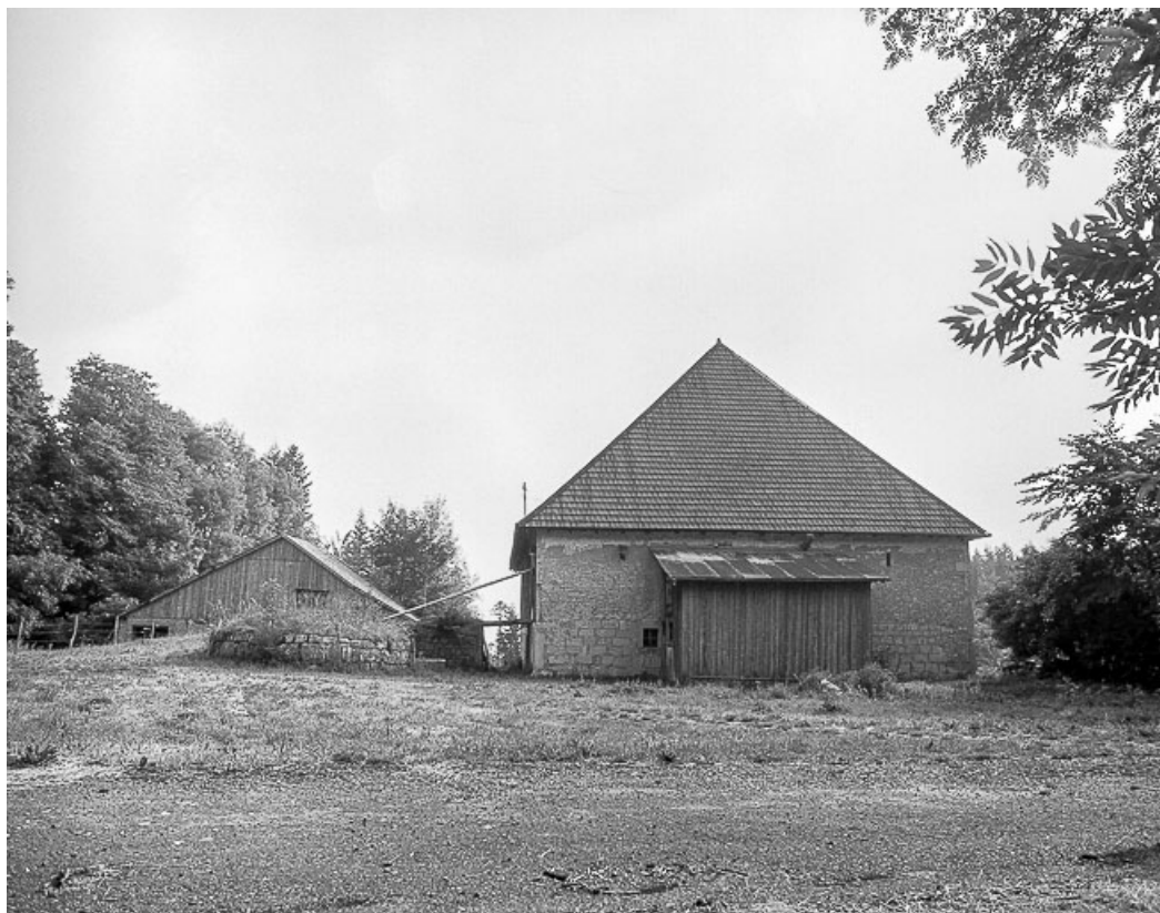
Ferme située au lieu-dit Champagne-Dessus, cadastrée ZL 1 : façade postérieure. 25, Les Gras