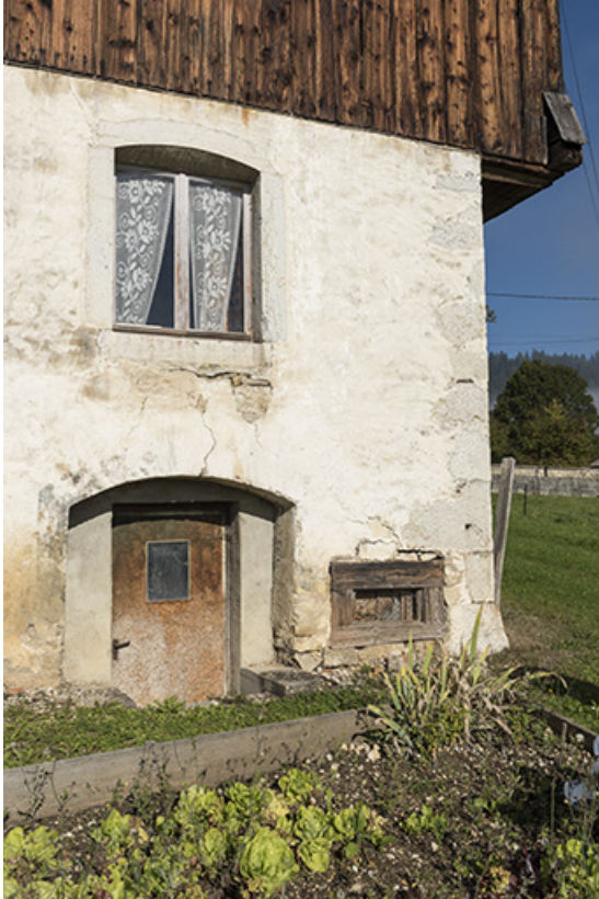
Façade est : accès au sous-sol (extension nord-est).

25, Grand'Combe-Châteleu 3e ferme, lieudit : les Cordiers