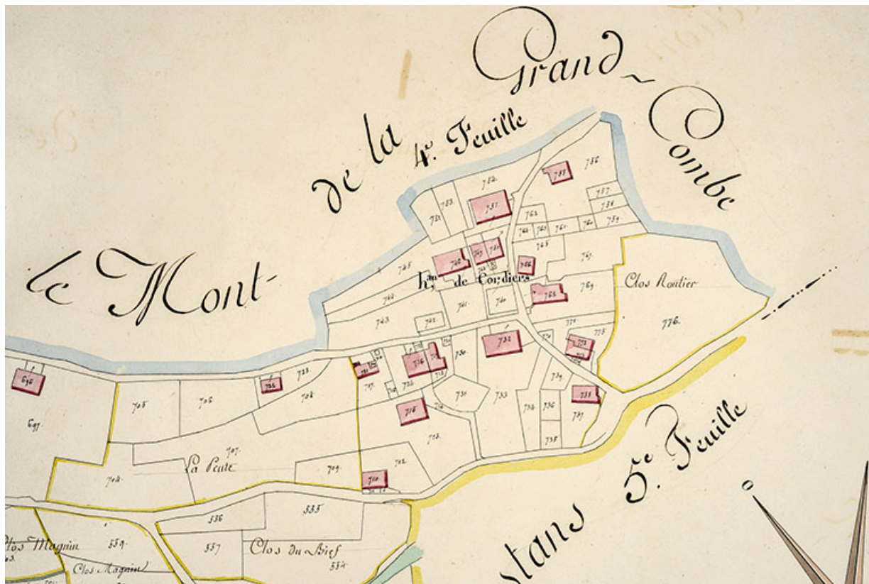
Cadastre de la commune de Grand'Combe-Châteleu. Atlas parcellaire, 1816, section B 4e feuille [détail : hameau des Cordiers], 1/2 500.

25, Grand'Combe-Châteleu 3e ferme, lieudit : les Cordiers