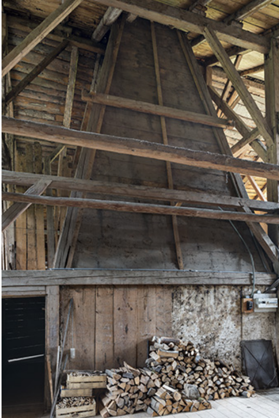
Intérieur, grange : hotte du "tué" central.

25, Grand'Combe-Châteleu 3e ferme, lieudit : les Cordiers