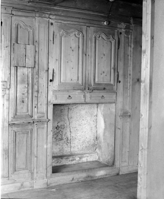
Intérieur : le "poêle", placards derrière la cheminée.

25, Grand'Combe-Châtelet 3e ferme, lieudit : les Cordiers