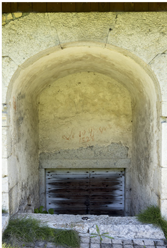
Façade sud : descente de cave et inscriptions.

25, Grand'Combe-Châteleu 3e ferme, lieudit : les Cordiers