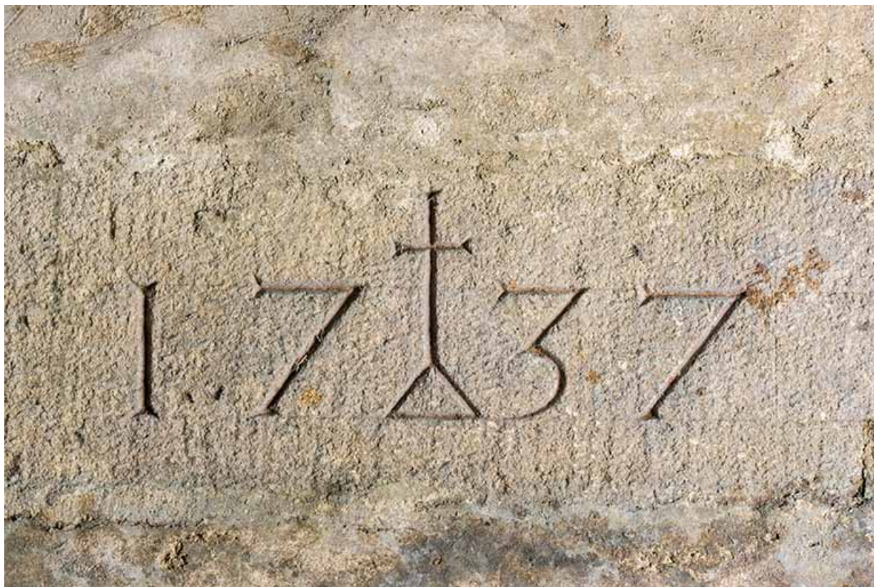
Intérieur, cave sous le corps sud-est : date 1737 gravée sur une pierre (en remploi ?). 25, Grand'Combe-Châteleu 3e ferme, lieudit : les Cordiers