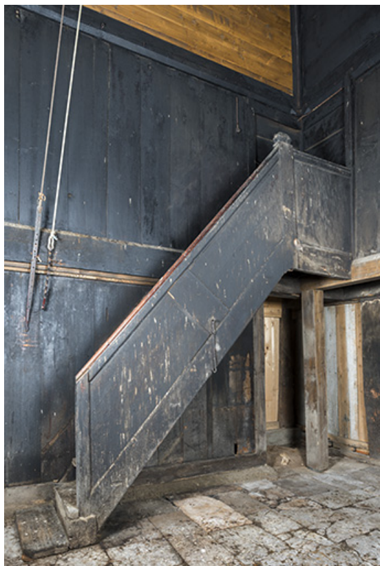
Intérieur, "tué" central : escalier et porte d'accès à la grange.

25, Grand'Combe-Châteleu 3e ferme, lieudit : les Cordiers