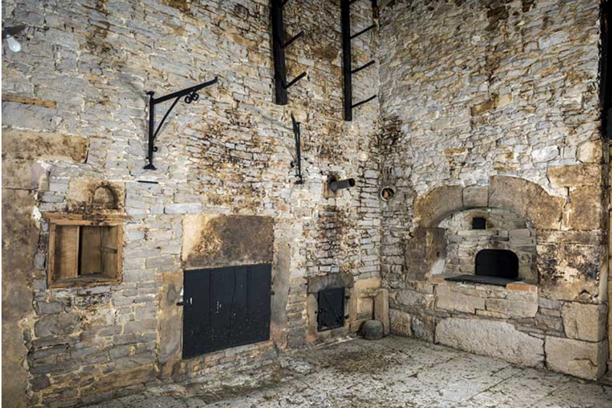
Intérieur, "tué" central : plaque de cheminée (commune au "poêle" voisin) et trappe du poêle en faïence à gauche, four à pain à droite.

25, Grand'Combe-Châteleu 3e ferme, lieudit : les Cordiers