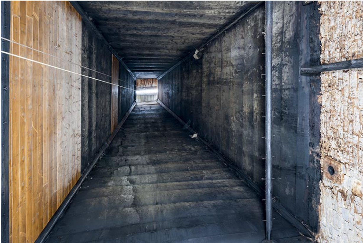
Intérieur, "tué" central : la hotte.

25, Grand'Combe-Châteleu 3e ferme, lieudit : les Cordiers