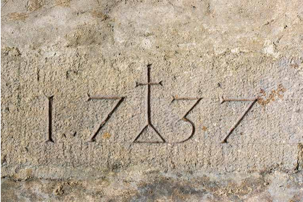
Intérieur, cave sous le corps sud-est : date 1737 gravée sur une pierre (en remploi ?).

25, Grand'Combe-Châteleu 3e ferme, lieudit : les Cordiers