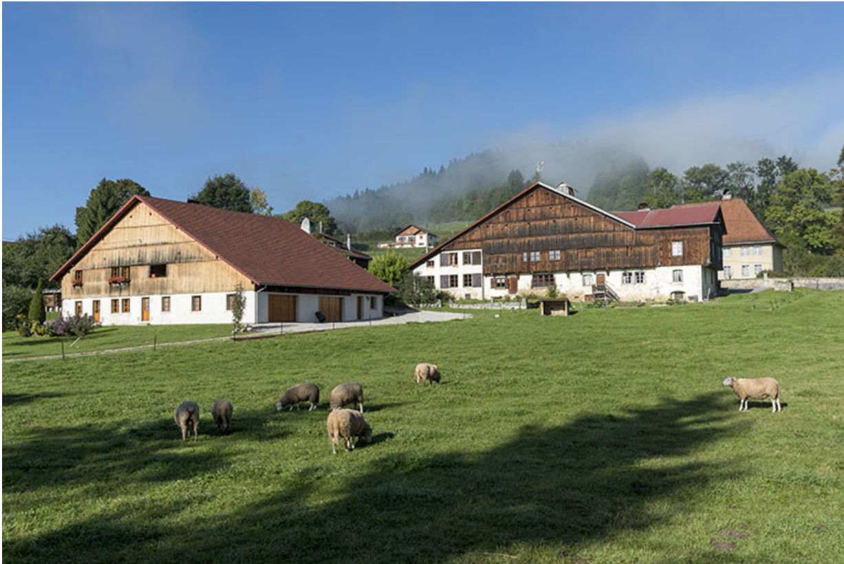
Vue d'ensemble éloignée, depuis l'est.

25, Grand'Combe-Châteleu 3e ferme, lieudit : les Cordiers