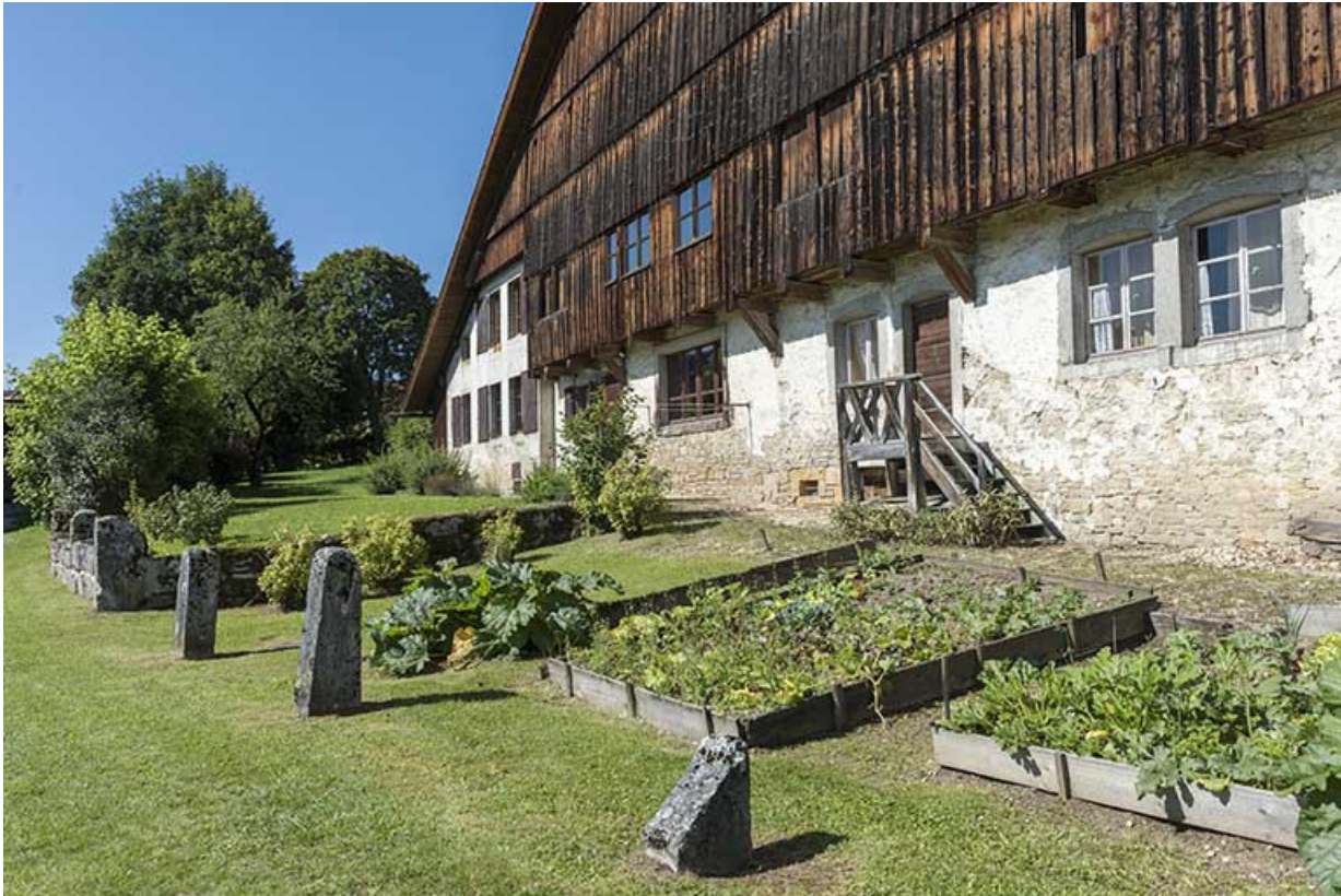
Façade est, vue en enfilade.

25, Grand'Combe-Châteleu 3e ferme, lieudit : les Cordiers