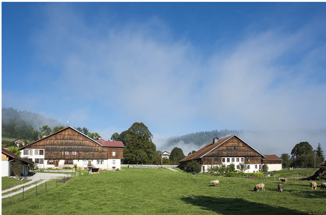
Vue d'ensemble éloignée depuis l'est (avec la 3e ferme des Cordiers).

25, Grand'Combe-Châteleu 3e ferme, lieudit : les Cordiers