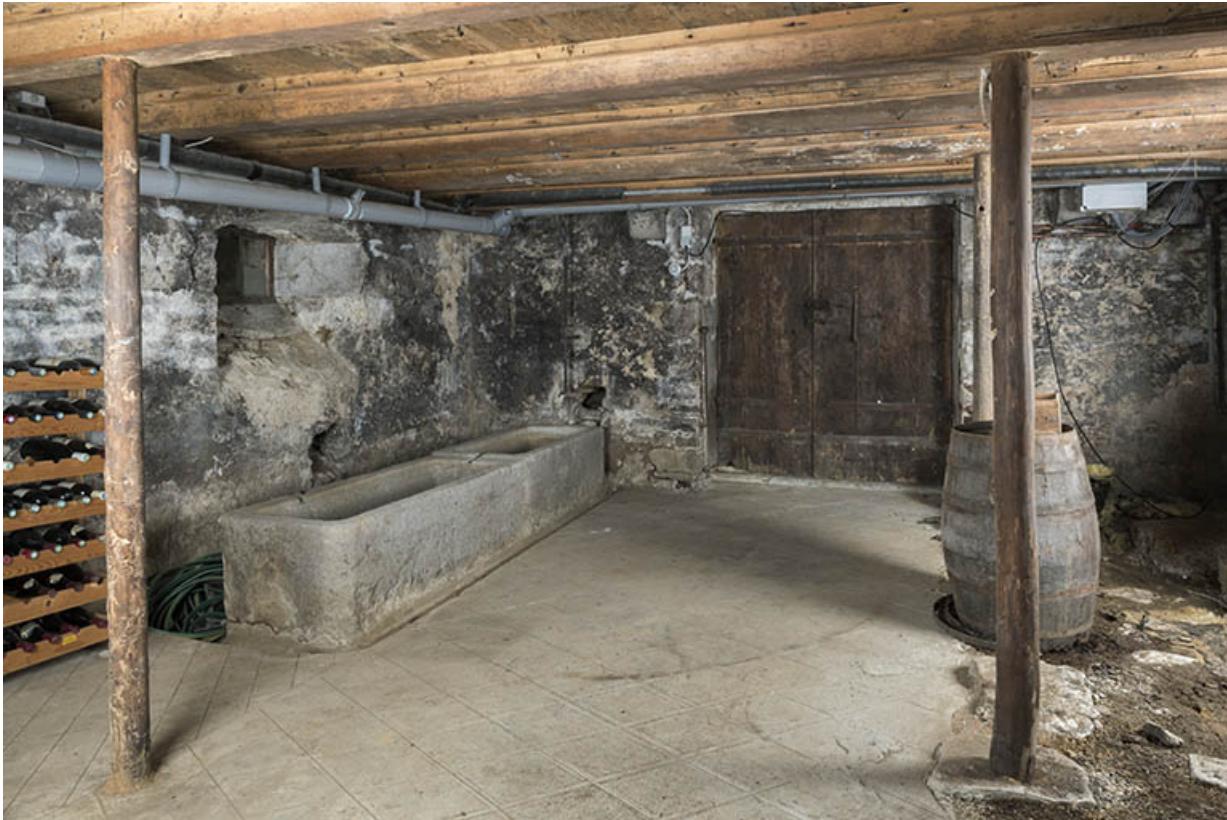
Intérieur : cave sous le corps sud-est.

25, Grand'Combe-Châteleu 3e ferme, lieudit : les Cordiers