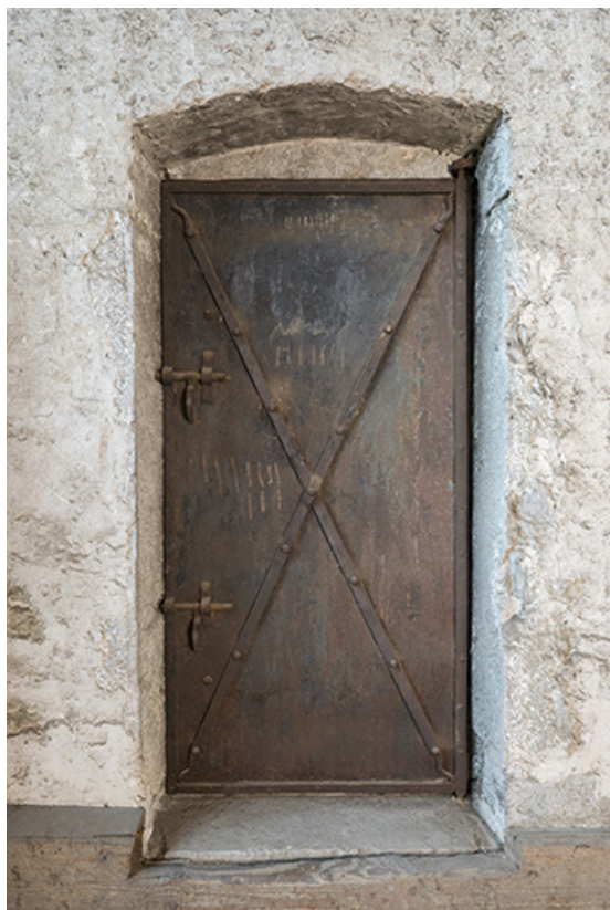
Intérieur, grange : porte métallique de la pièce à l'étage du corps sud-est. 25, Grand'Combe-Châteleu 3e ferme, lieudit : les Cordiers