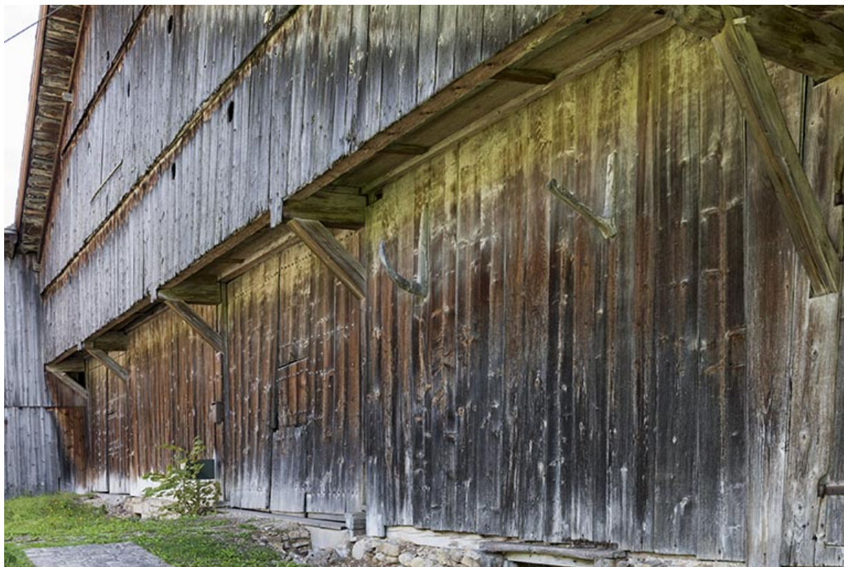
Façade ouest, vue en enfilade.

25, Grand'Combe-Châteleu 3e ferme, lieudit : les Cordiers