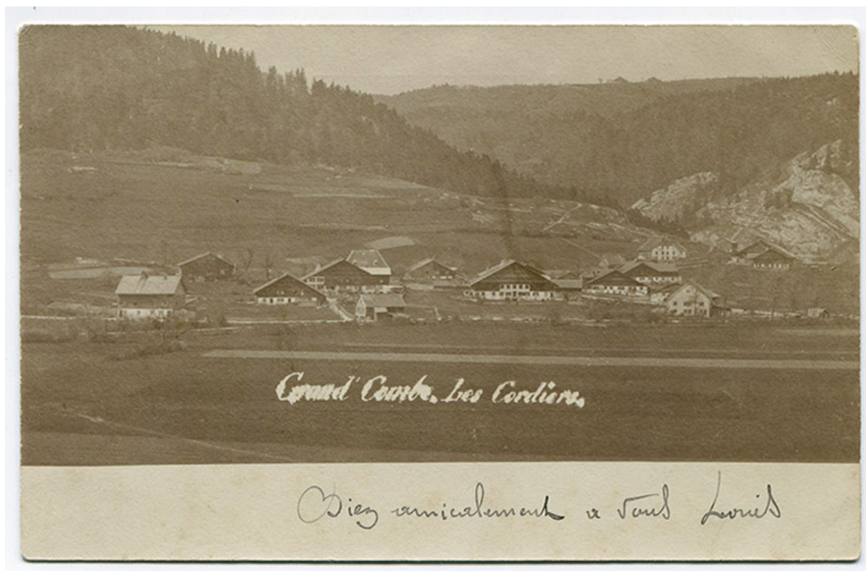
Grand'Combe. Les Cordiers [vue d'ensemble du hameau depuis l'est], 4e quart 19e siècle [avant 1902].

25, Grand'Combe-Châtelet 3e ferme, lieudit : les Cordiers