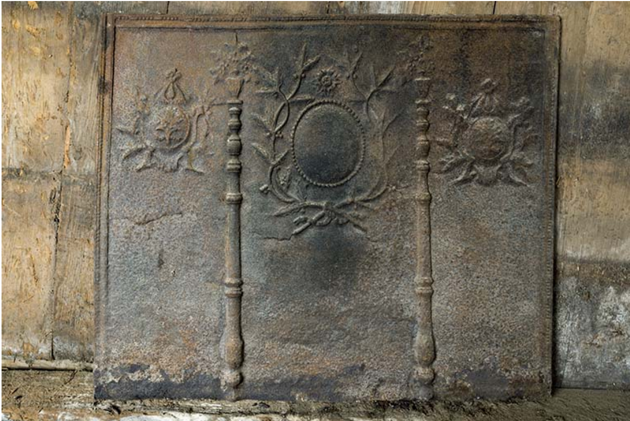
Intérieur, "tué" central : plaque de cheminée.

25, Grand'Combe-Châteleu 3e ferme, lieudit : les Cordiers