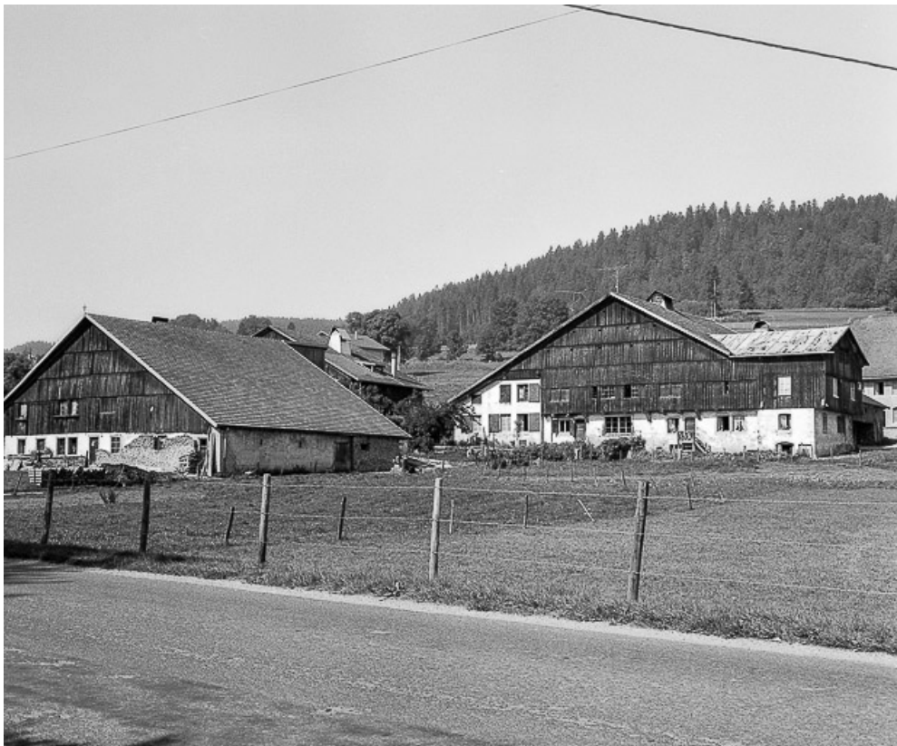
Vue de trois quarts, depuis l'est.

25, Grand'Combe-Châteleu 3e ferme, lieudit : les Cordiers