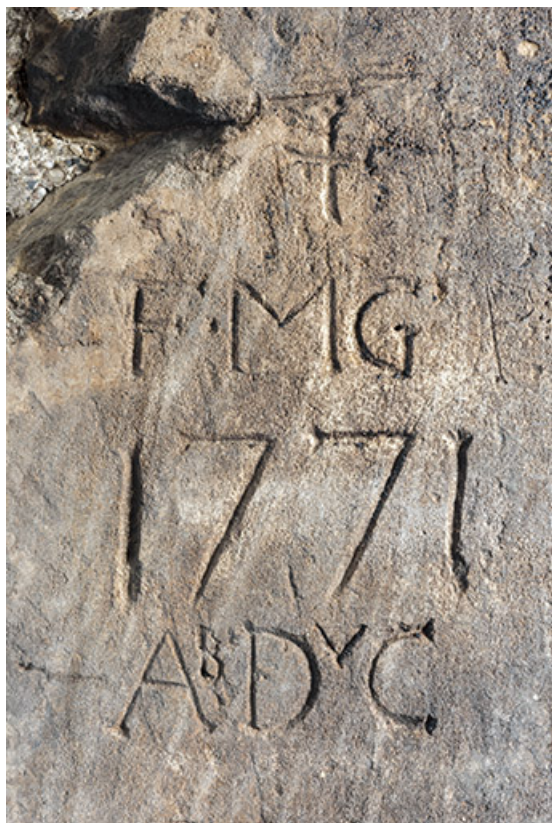
Intérieur, "tué" central : inscriptions et date 1771 gravée sur le piédroit de gauche du four à pain. 25, Grand'Combe-Châteleu 3e ferme, lieudit : les Cordiers