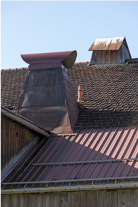
Pan de toiture nord, avec deux "tués".

25, Grand'Combe-Châteleu 3e ferme, lieudit : les Cordiers