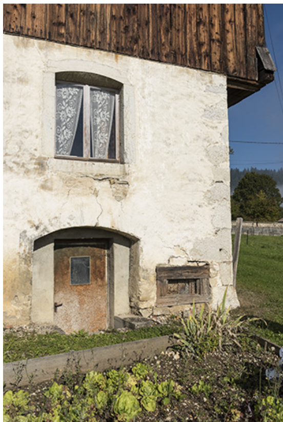
Façade est : accès au sous-sol (extension nord-est). 25, Grand'Combe-Châteleu 3e ferme, lieudit : les Cordiers