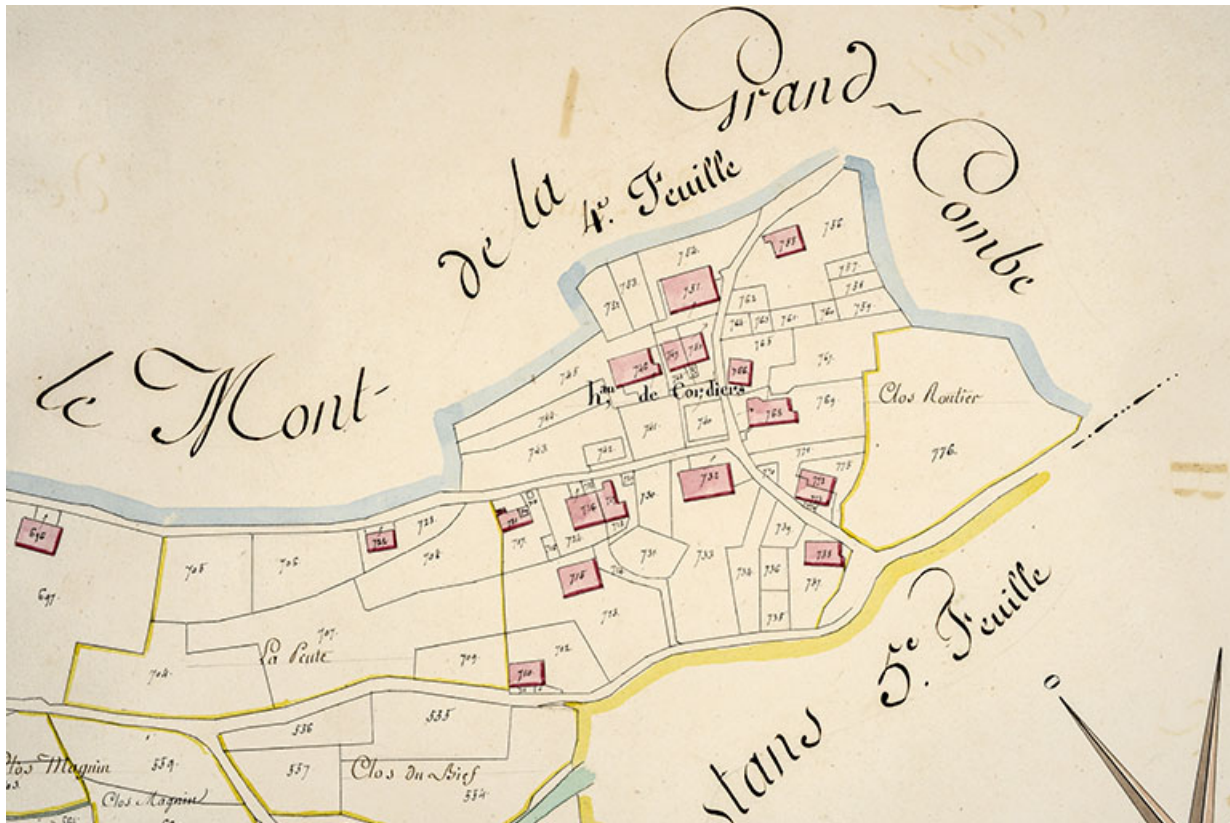
Cadastre de la commune de Grand'Combe-Châteleu. Atlas parcellaire, 1816, section B 4e feuille [détail : hameau des Cordiers], 1/2 500.

25, Grand'Combe-Châteleu 3e ferme, lieudit : les Cordiers