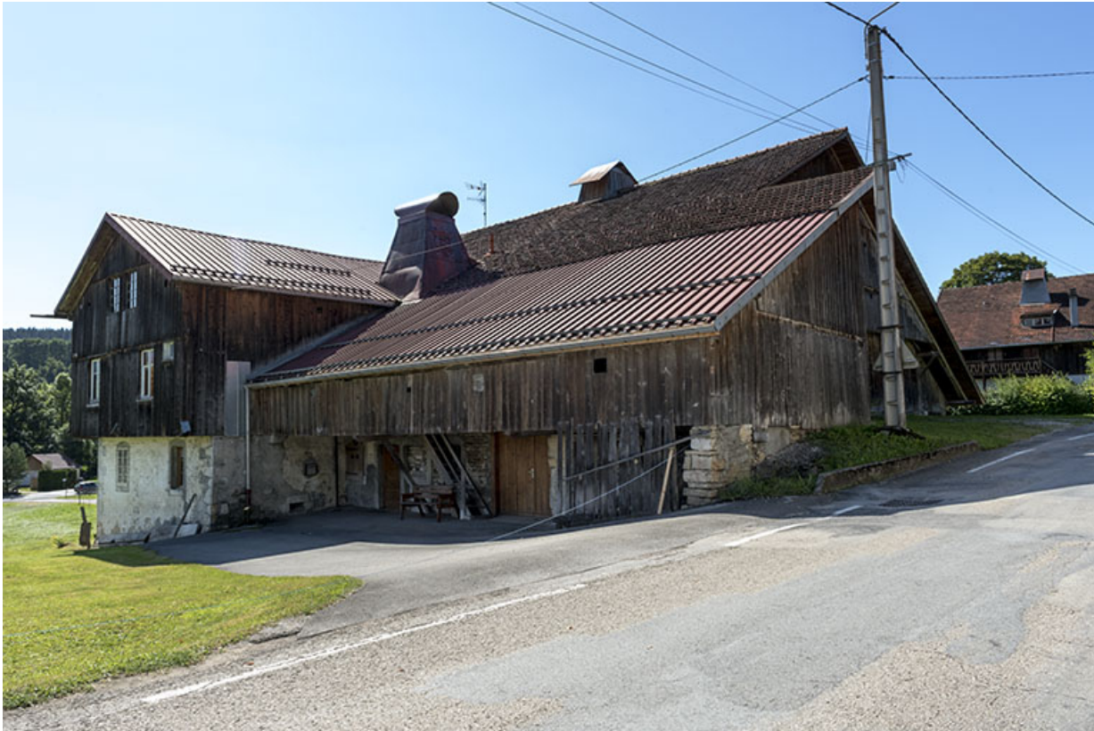
Façade nord, de trois quarts droite.

25, Grand'Combe-Châteleu 3e ferme, lieudit : les Cordiers