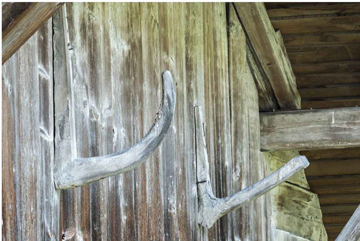
Façade ouest : crochets en bois (support d'échelle ou de faux ?).

25, Grand'Combe-Châteleu 3e ferme, lieudit : les Cordiers