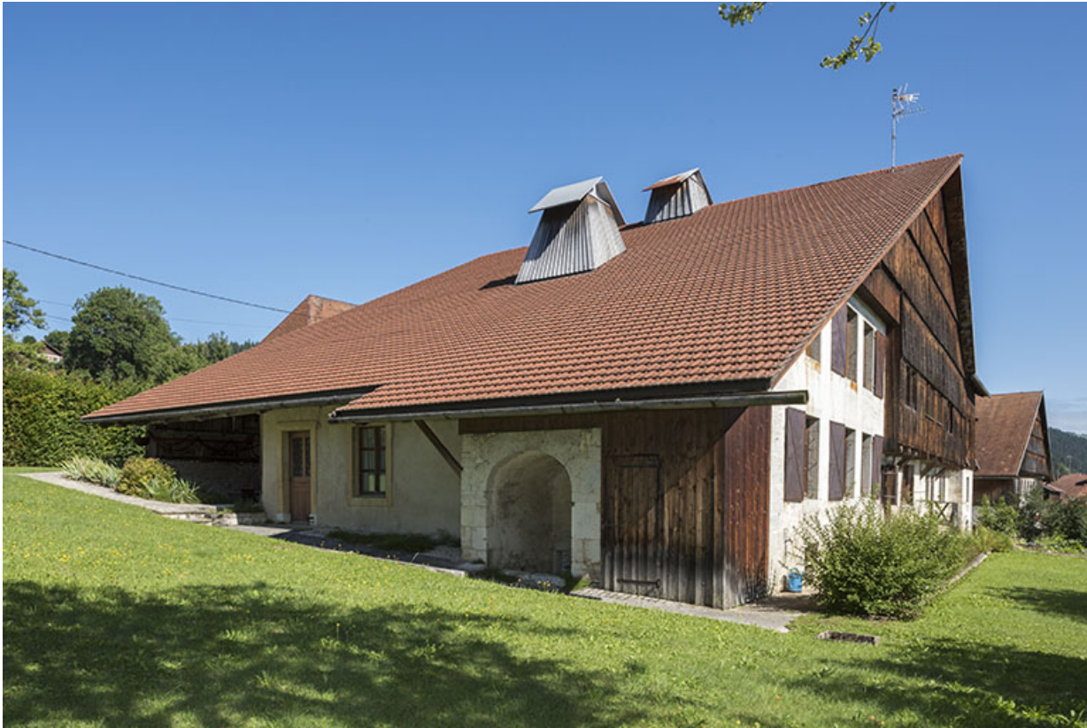
Façade sud, de trois quarts droite.

25, Grand'Combe-Châteleu 3e ferme, lieudit : les Cordiers