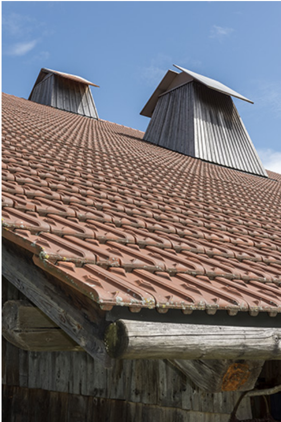
Pan de toiture sud, avec deux "tués".

25, Grand'Combe-Châteleu 3e ferme, lieudit : les Cordiers