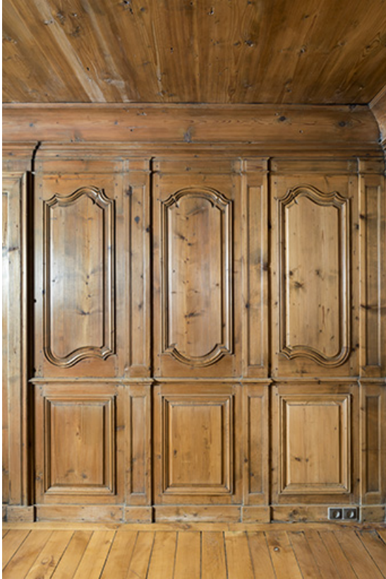
Intérieur, "poêle" : lambris.

25, Grand'Combe-Châteleu 3e ferme, lieudit : les Cordiers