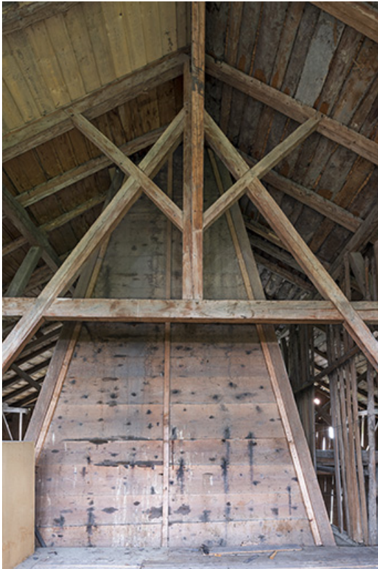
Intérieur, grange : hotte du "tué" central et charpente. 25, Grand'Combe-Châteleu 3e ferme, lieudit : les Cordiers