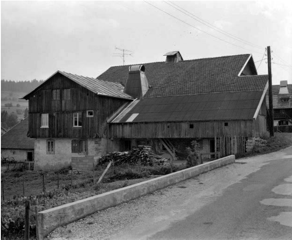
Extérieur : gouttereau nord-est.

25, Grand'Combe-Châteleu 3e ferme, lieudit : les Cordiers