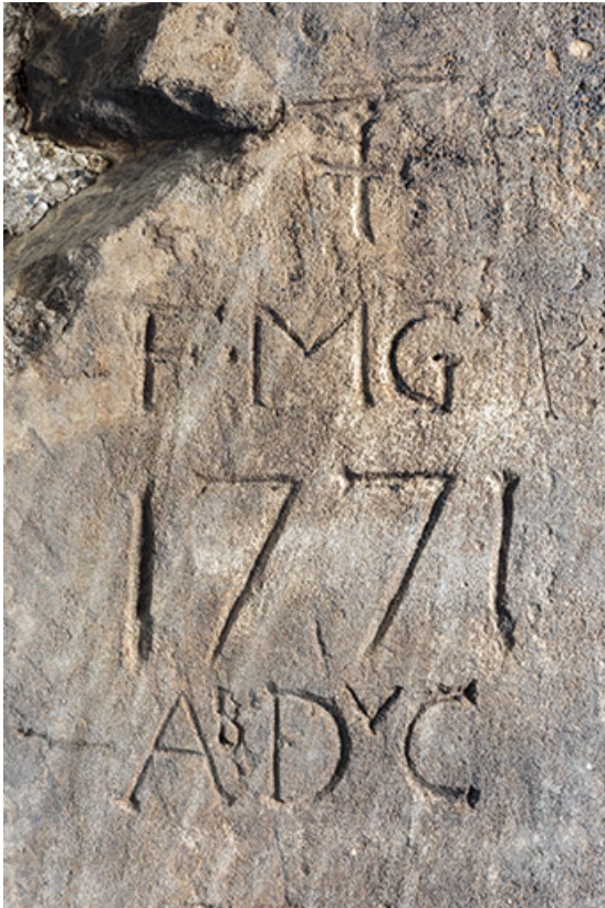
Intérieur, "tué" central : inscriptions et date 1771 gravée sur le piédroit de gauche du four à pain. 25, Grand'Combe-Châteleu 3e ferme, lieudit : les Cordiers