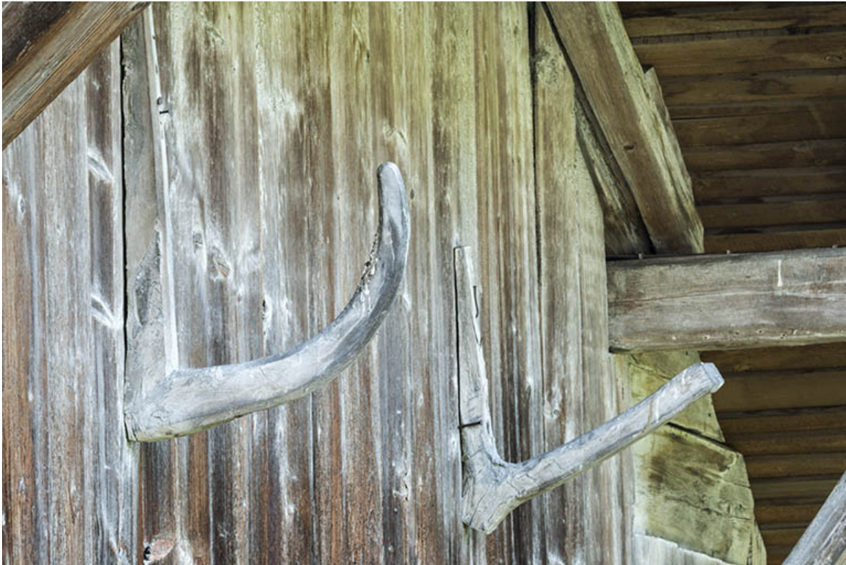
Façade ouest : crochets en bois (support d'échelle ou de faux ?).

25, Grand'Combe-Châteleu 3e ferme, lieudit : les Cordiers