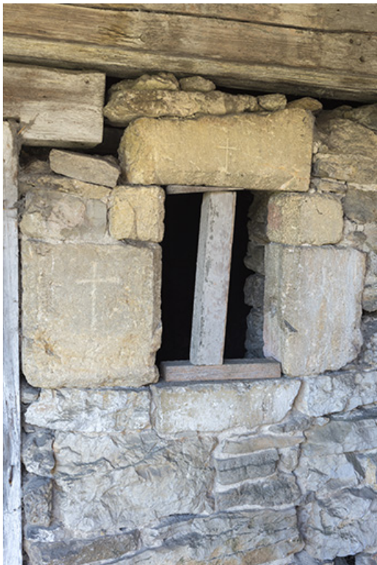
Façade nord : baie avec pierres gravées d'une croix. 25, Grand'Combe-Châteleu 3e ferme, lieudit : les Cordiers