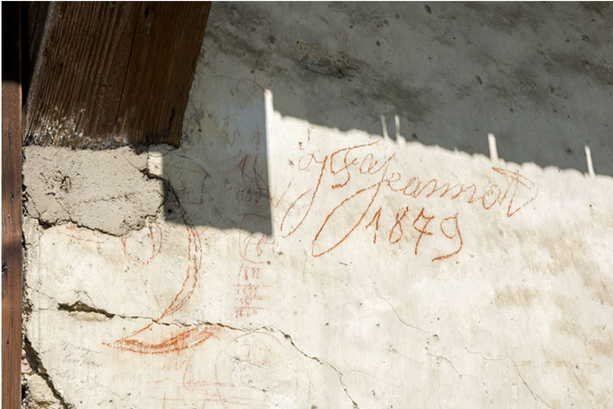
Façade est : inscriptions au crayon (J.F. Jeannot 1879).

25, Grand'Combe-Châteleu 3e ferme, lieudit : les Cordiers