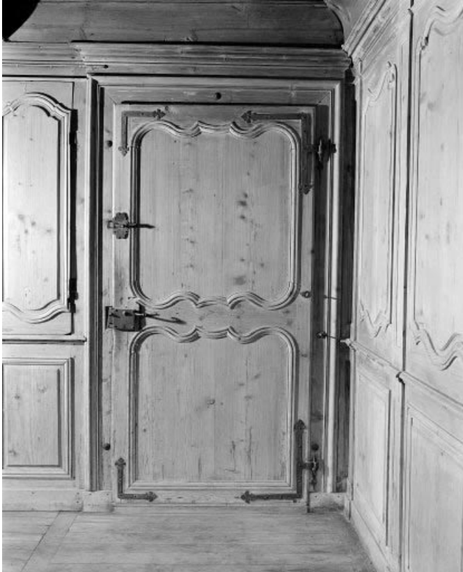
Intérieur : le "poêle", détail : une porte.

25, Grand'Combe-Châtelet 3e ferme, lieudit : les Cordiers