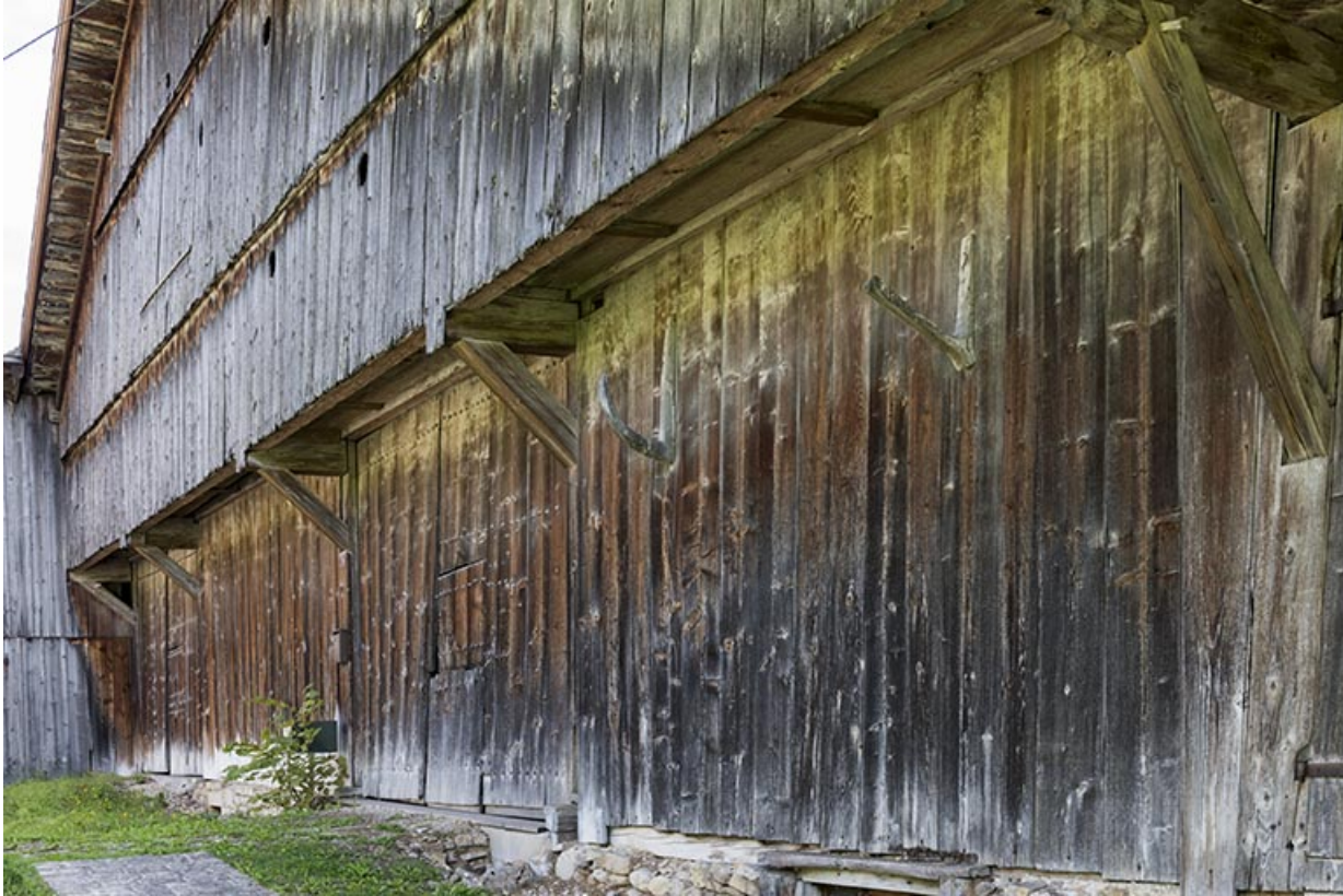
Façade ouest, vue en enfilade.

25, Grand'Combe-Châteleu 3e ferme, lieudit : les Cordiers