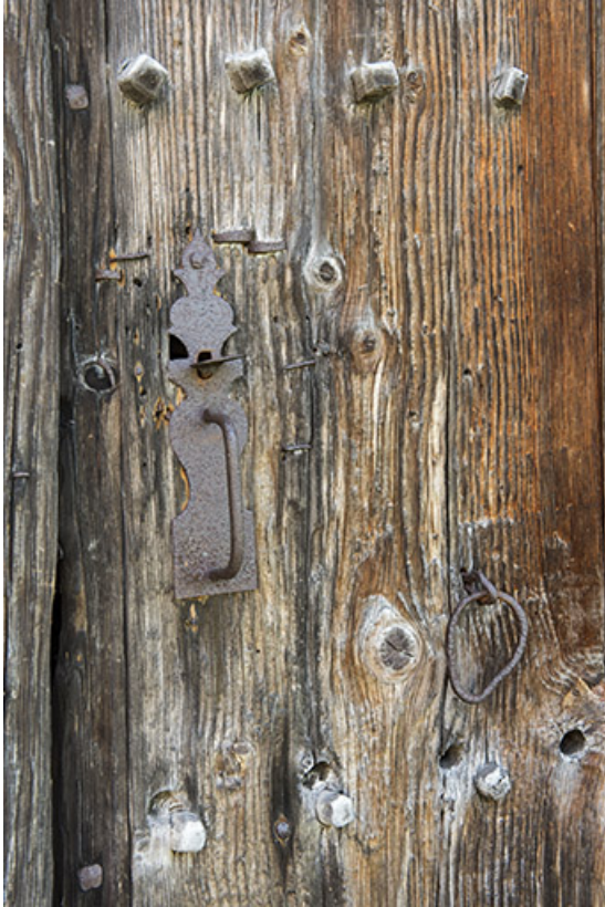
Façade ouest : détail d'une porte de grange.

25, Grand'Combe-Châteleu 3e ferme, lieudit : les Cordiers