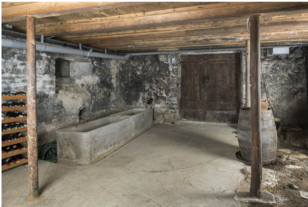
Intérieur : cave sous le corps sud-est.

25, Grand'Combe-Châteleu 3e ferme, lieudit : les Cordiers