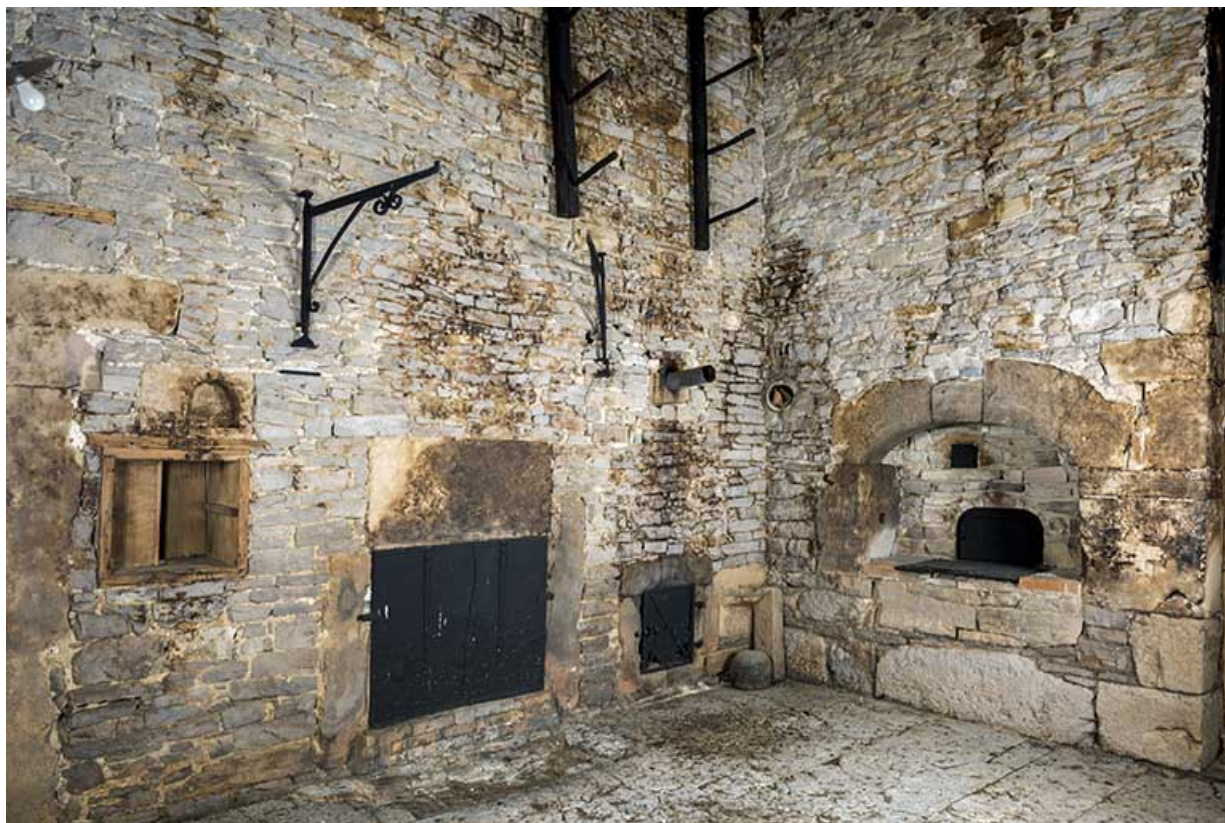
Intérieur, "tué" central : plaque de cheminée (commune au "poêle" voisin) et trappe du poêle en faïence à gauche, four à pain à droite.

25, Grand'Combe-Châteleu 3e ferme, lieudit : les Cordiers