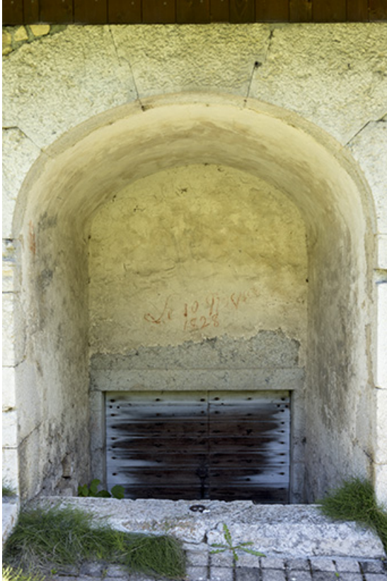
Façade sud : descente de cave et inscriptions.

25, Grand'Combe-Château 3e ferme, lieudit : les Cordiers