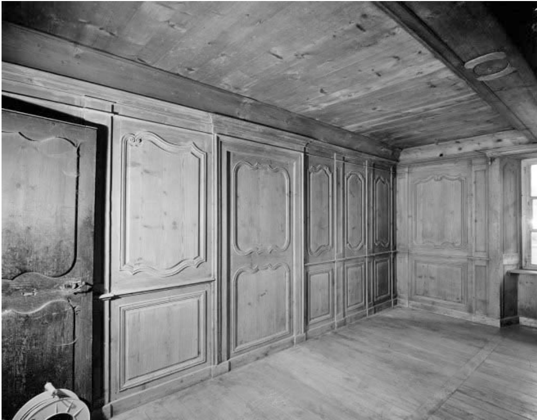
Intérieur : le "poêle".

25, Grand'Combe-Châtelet 3e ferme, lieudit : les Cordiers