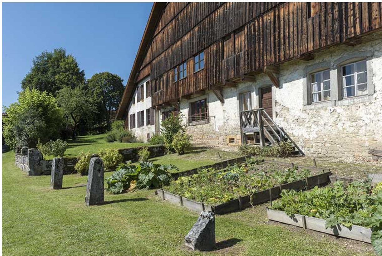
Façade est, vue en enfilade.

25, Grand'Combe-Châteleu 3e ferme, lieudit : les Cordiers