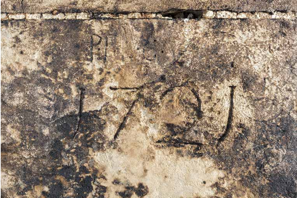
Intérieur, "tué" central : date 1721 gravée sur le piédroit de droite du four à pain. 25, Grand'Combe-Châteleu 3e ferme, lieudit : les Cordiers