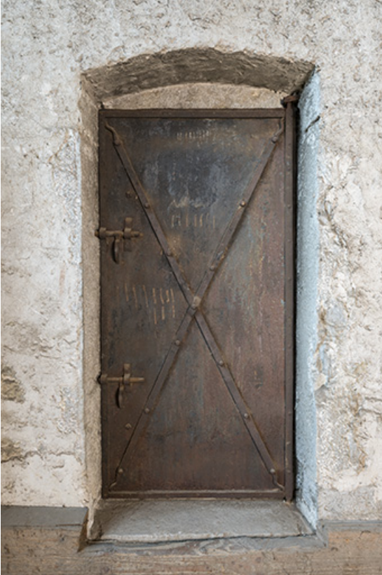
Intérieur, grange : porte métallique de la pièce à l'étage du corps sud-est. 25, Grand'Combe-Châteleu 3e ferme, lieudit : les Cordiers