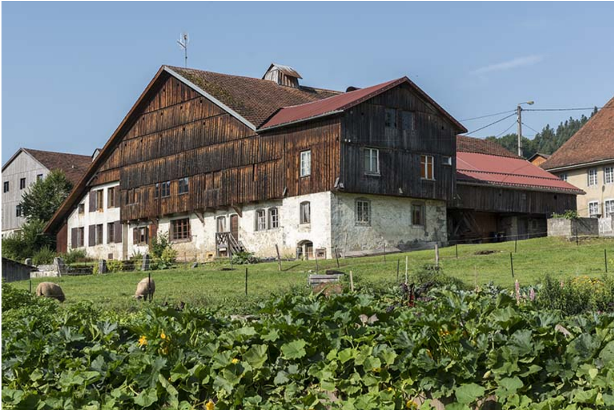
Vue d'ensemble, depuis le nord-est.

25, Grand'Combe-Châteleu 3e ferme, lieudit : les Cordiers