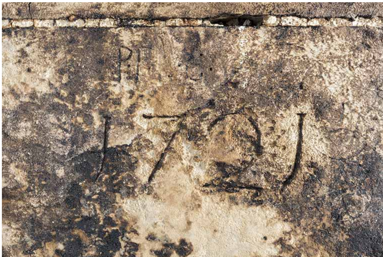
Intérieur, "tué" central : date 1721 gravée sur le piédroit de droite du four à pain. 25, Grand'Combe-Châteleu 3e ferme, lieudit : les Cordiers