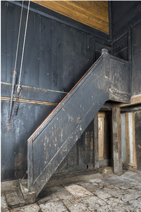
Intérieur, "tué" central : escalier et porte d'accès à la grange.

25, Grand'Combe-Châteleu 3e ferme, lieudit : les Cordiers