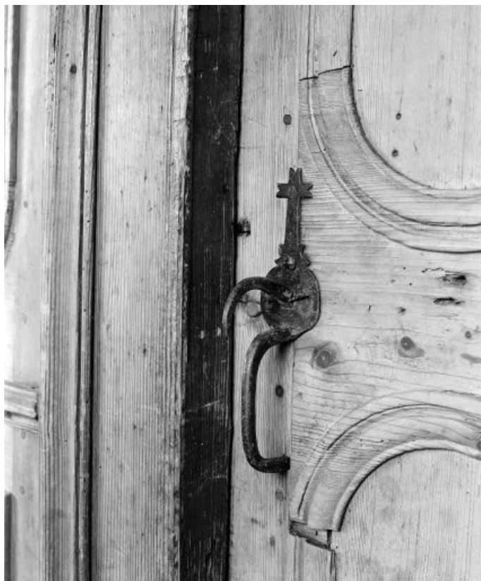
Intérieur : le "poêle", poignée de porte.

25, Grand'Combe-Châteleu 3e ferme, lieudit : les Cordiers