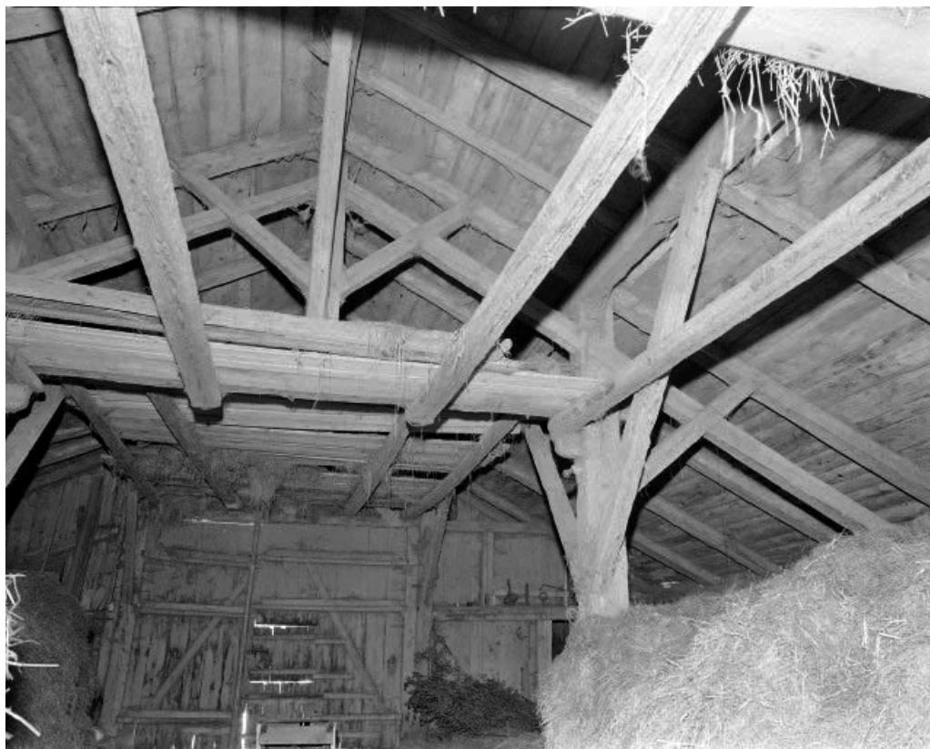
Intérieur : charpente du bâtiment annexe.

25, Grand'Combe-Châteleu, lieudit : Chauveresche