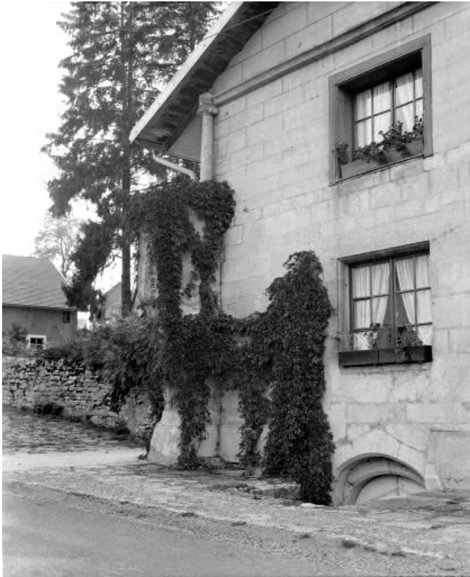
Façade antérieure : partie gauche avec contrefort et entrée de cave.

25, Grand'Combe-Château, 10 Bas de Grand Combe