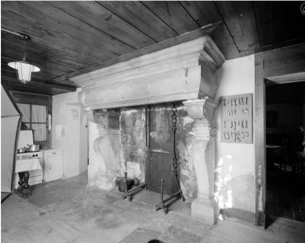
l'intérieur : cheminée en pierre.

25, Grand'Combe-Châteleu, 10 Bas de Grand Combe