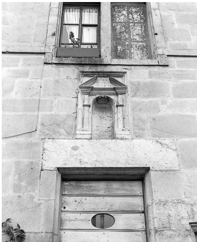
Détail : niche sur la façade antérieure.

25, Grand'Combe-Châteleu, 10 Bas de Grand Combe