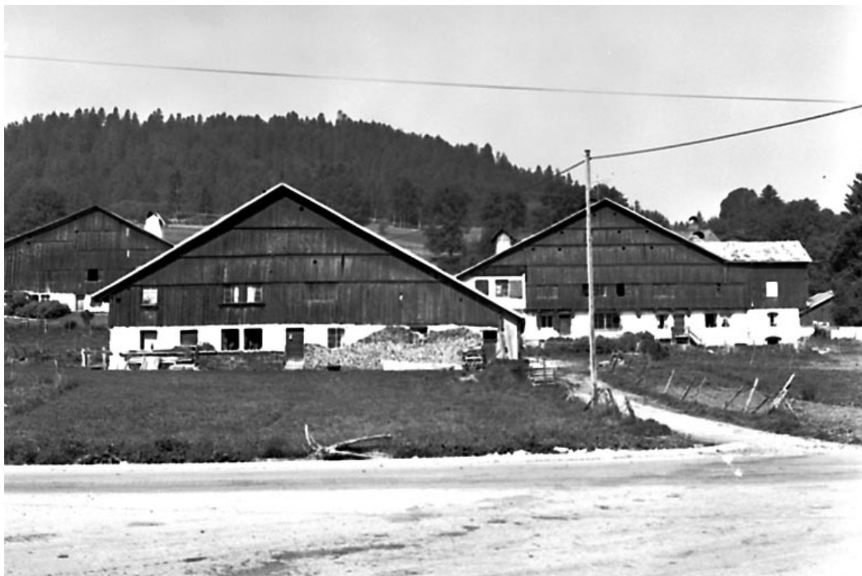
Vue de face, depuis l'est. 25, Grand'Combe-Châteleu