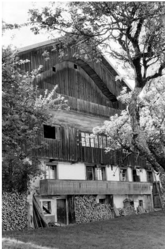
Extérieur : façade antérieure.