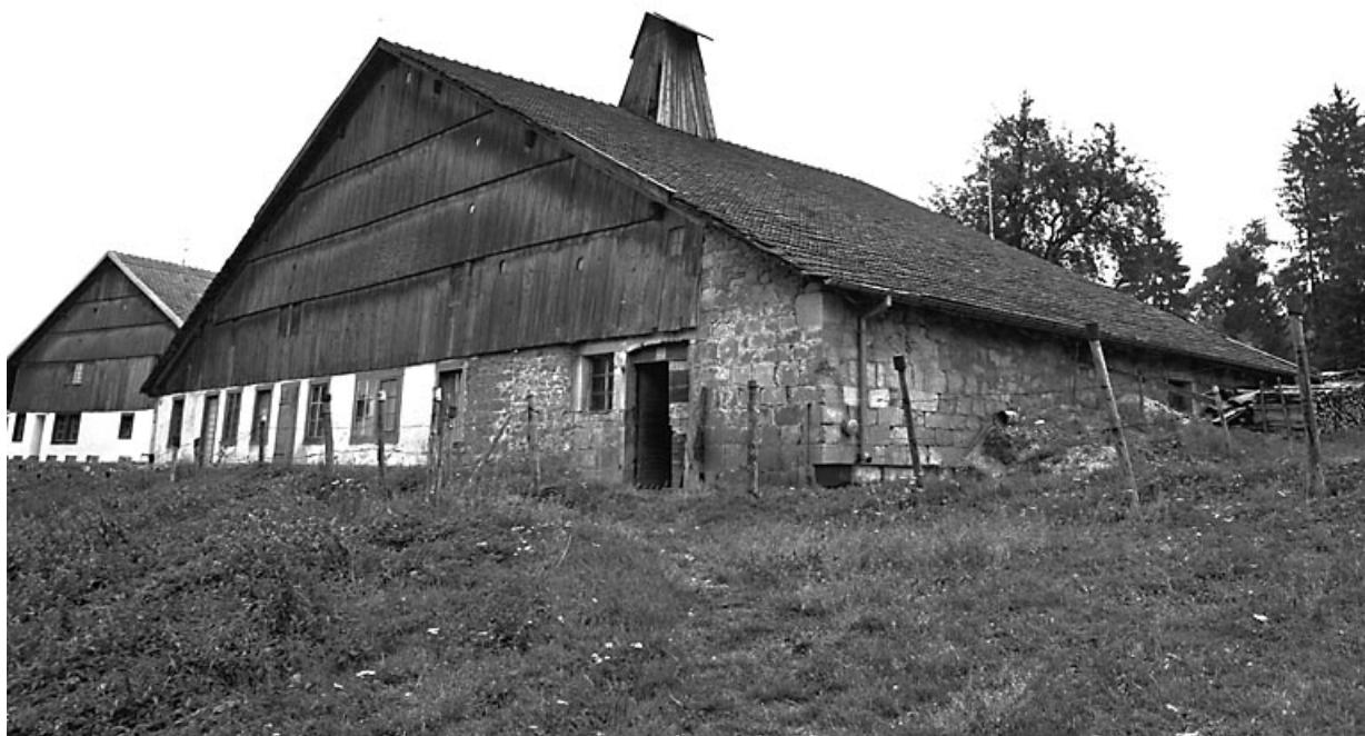
Vue d'ensemble de trois quarts droit.

25, Grand'Combe-Châteleu, lieudit : le Bois du Four