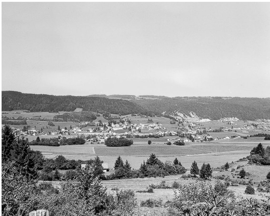
Village vu depuis la route de Chauveresche. 25, Grand'Combe-Châteleu