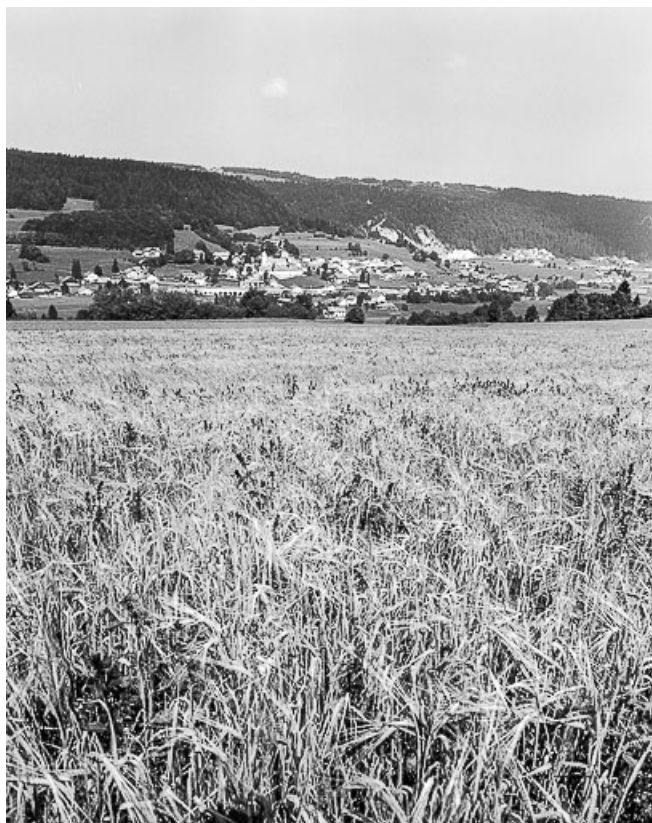
Village vu depuis la route de Chauveresche.