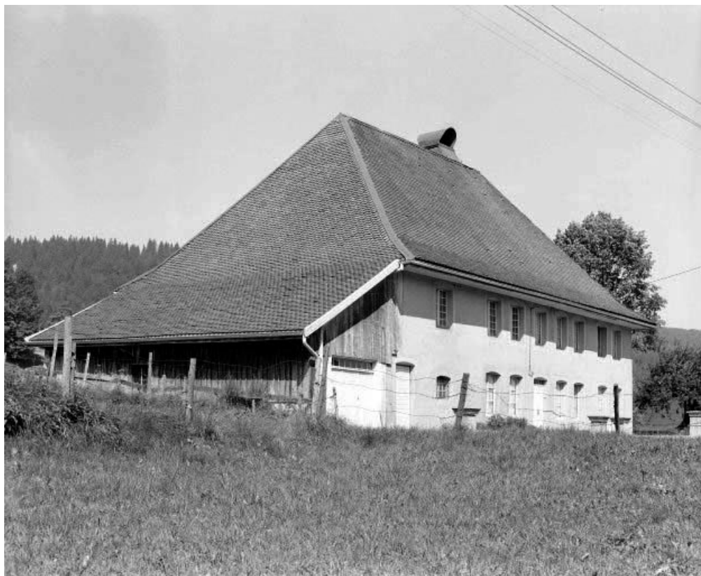
Chevet et façade latérale gauche.