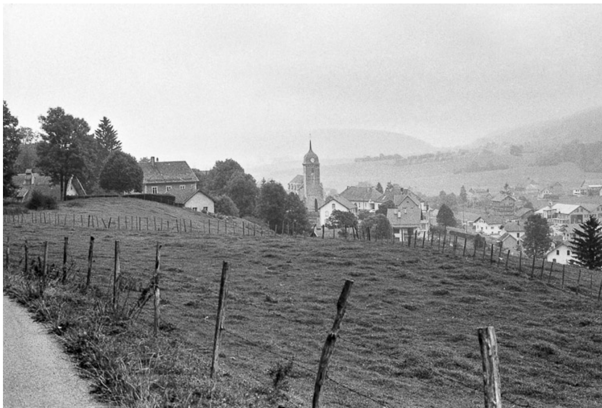
Village vu du sud-ouest.