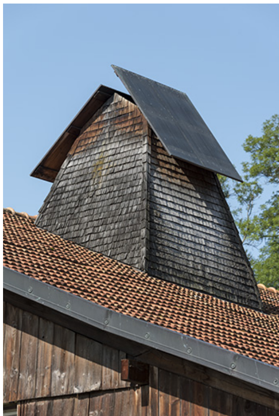
Ferme située au lieu-dit Les Cordiers (cadastre 2018 AD 49) : souche de tué. 25, Grand'Combe-Châteleu