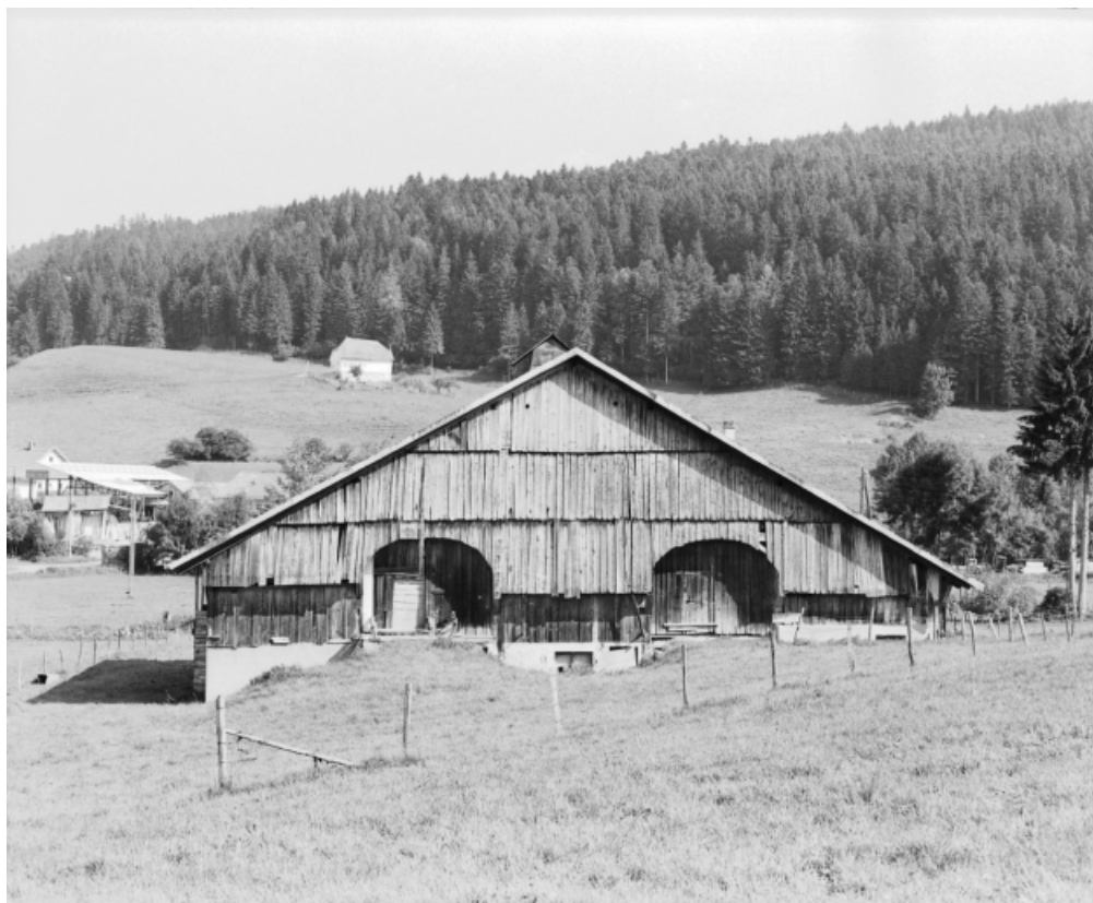
Façade postérieure : deux " levées de grange " et " lambréchure ". 25, Grand'Combe-Châteleu