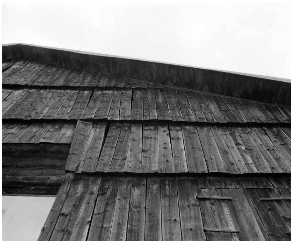
Détail de la lambrequure antérieure : rang de planches.

25, Les Combes rue du 8 Mai 1945, lieudit : la Motte