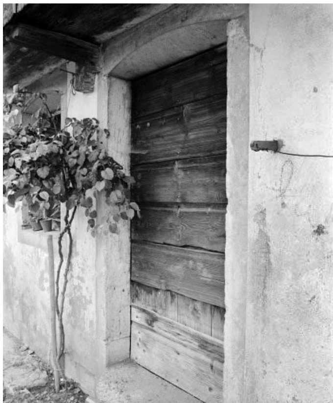
Détail de la porte d'entrée sur la facade antérieure.

25, Les Combes rue du 8 Mai 1945, lieudit : la Motte