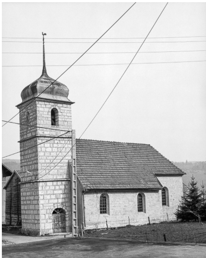
Face sud vue depuis le sud-ouest.

25, Villers-le-Lac, lieudit : les Bassots