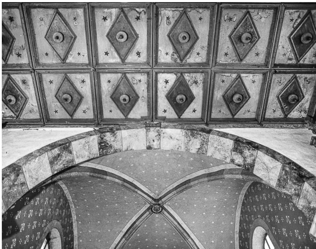
Plafond de la nef, arc triomphal, voûte du chœur.

25, Villers-le-Lac, lieudit : les Bassots