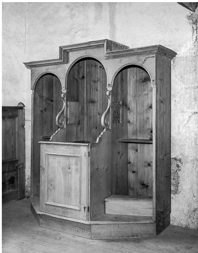
La nef vue depuis le chœur.

25, Villers-le-Lac, lieudit : les Bassots