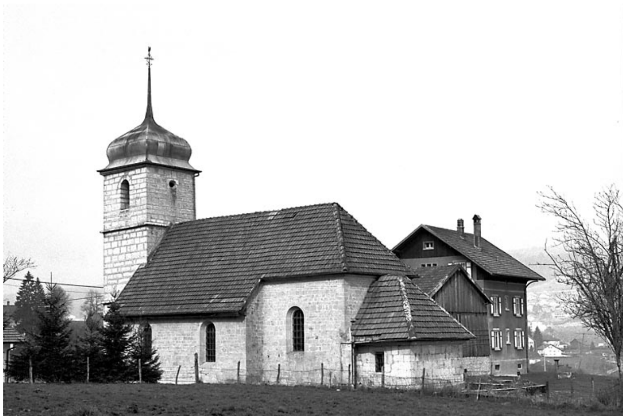
Face latérale droite vue depuis le sud-est.

25, Villers-le-Lac, lieudit : les Bassots