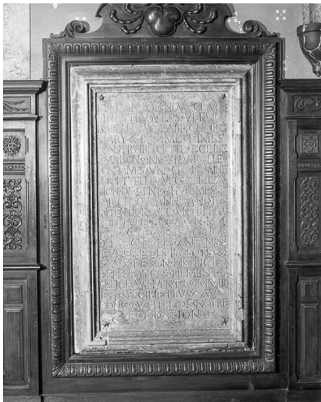
Intérieur : inscription de fondation de la chapelle.

25, Villers-le-Lac, lieudit : les Bassots