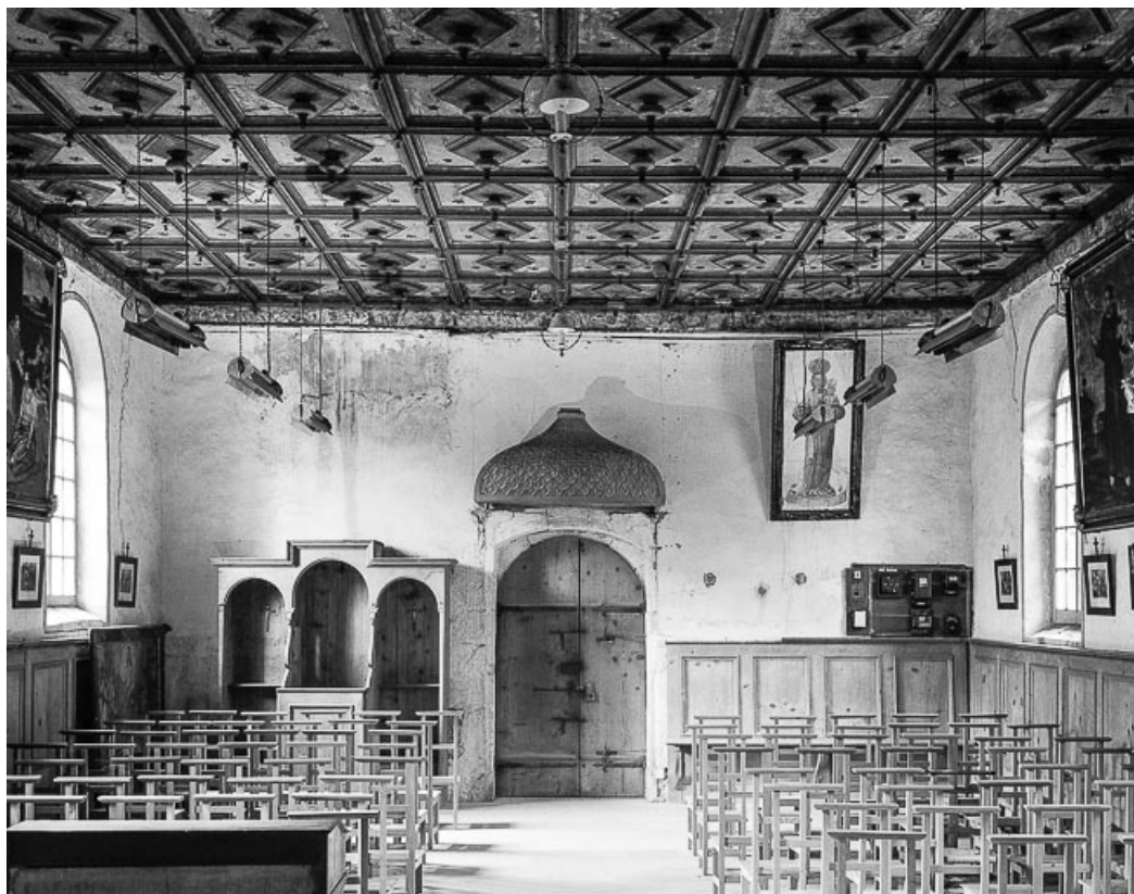
La nef vue depuis le chœur.

25, Villers-le-Lac, lieudit : les Bassots