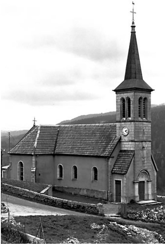
Vue générale de trois quarts.

25, Villers-le-Lac, lieudit : le Pissoux