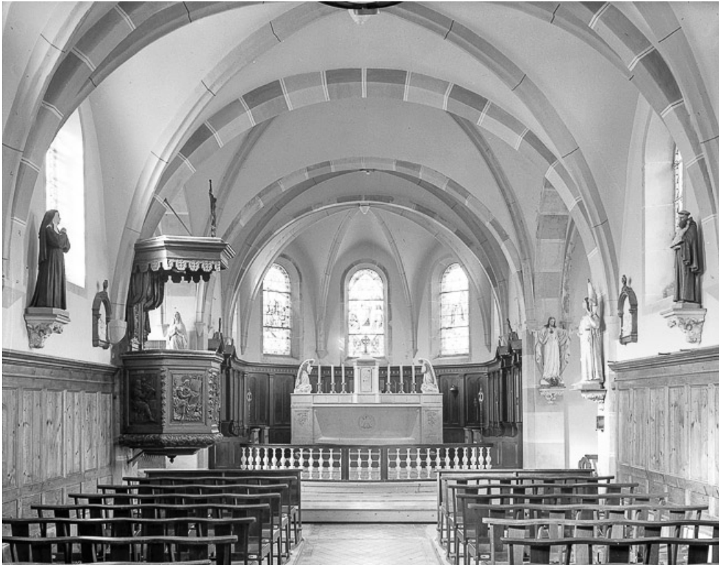
Intérieur vu depuis l'entrée.

25, Villers-le-Lac, lieudit : le Pissoux