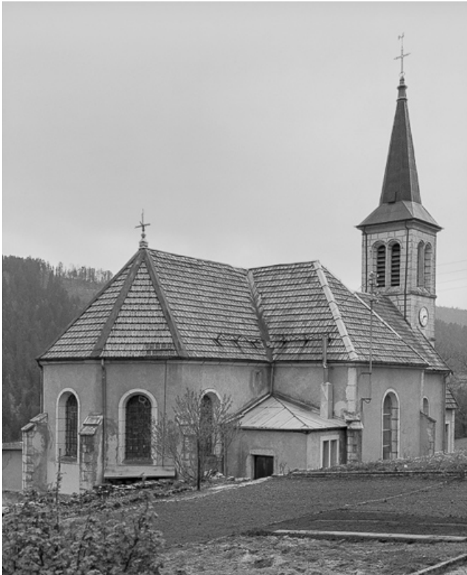
Façades postérieure et face latérale gauche.

25, Villers-le-Lac, lieudit : le Pissoux