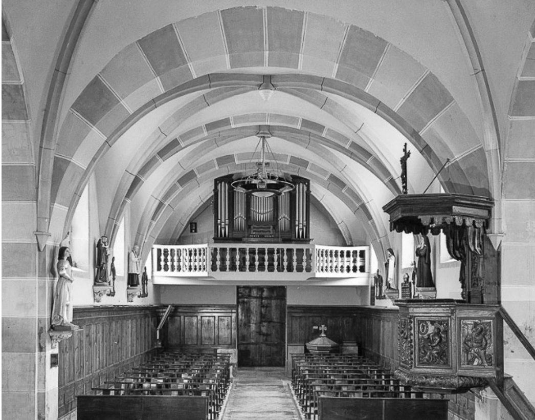
Intérieur vu depuis le chœur.

25, Villers-le-Lac, lieudit : le Pissoux