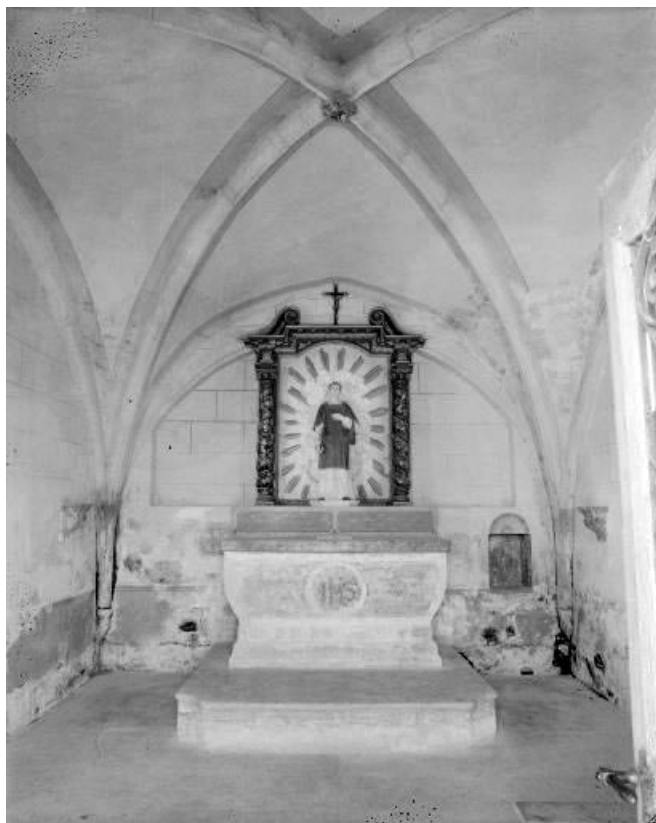
Intérieur : vue d'ensemble.