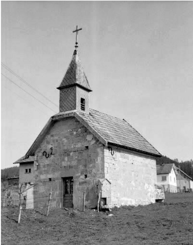
Extérieur : face antérieure et face latérale droite.