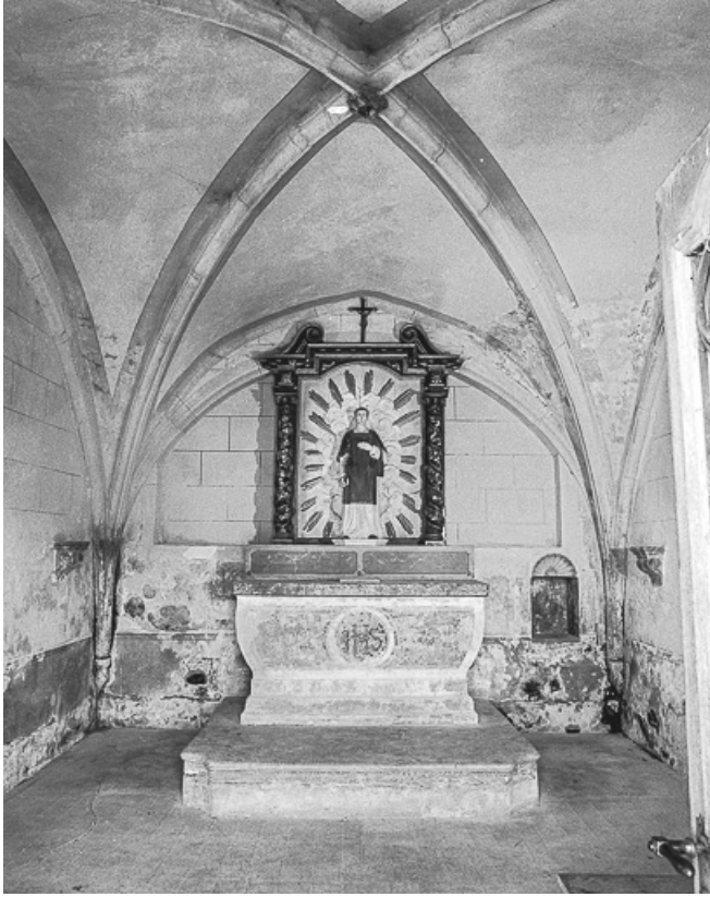
Intérieur : la nef vue depuis l'entrée.