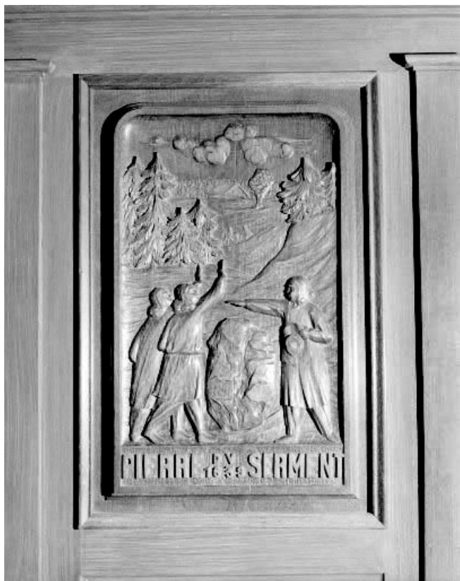
Intérieur : boiseries du choeur, panneau relatif à l'histoire de l'église.

25, Montlebon, lieudit : les Fontenottes