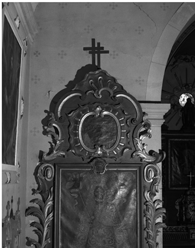
Autel retable gauche : détail.

25, Montlebon, lieudit : les Fontenottes