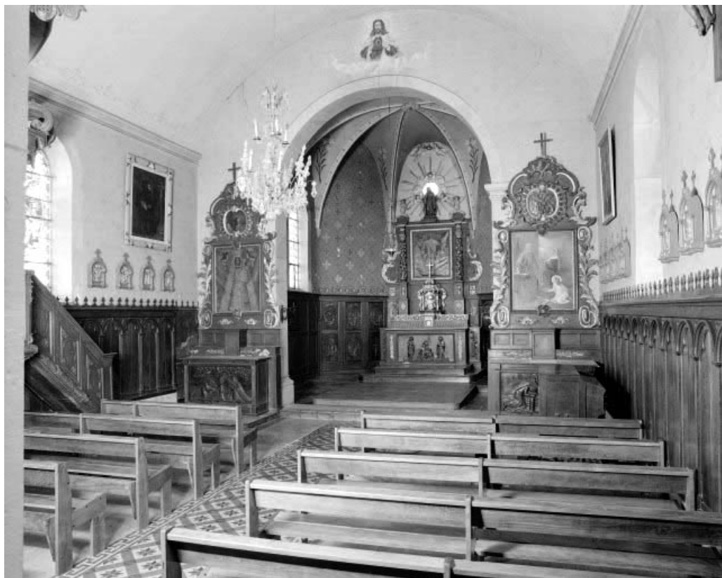
Intérieur vu depuis l'entrée.

25, Montlebon, lieudit : les Fontenottes