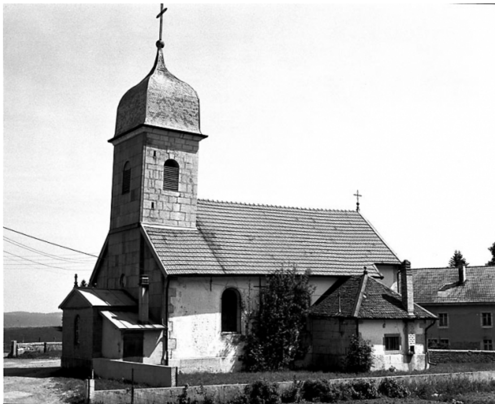
Vue de trois quarts.

25, Montlebon, lieudit : les Fontenottes