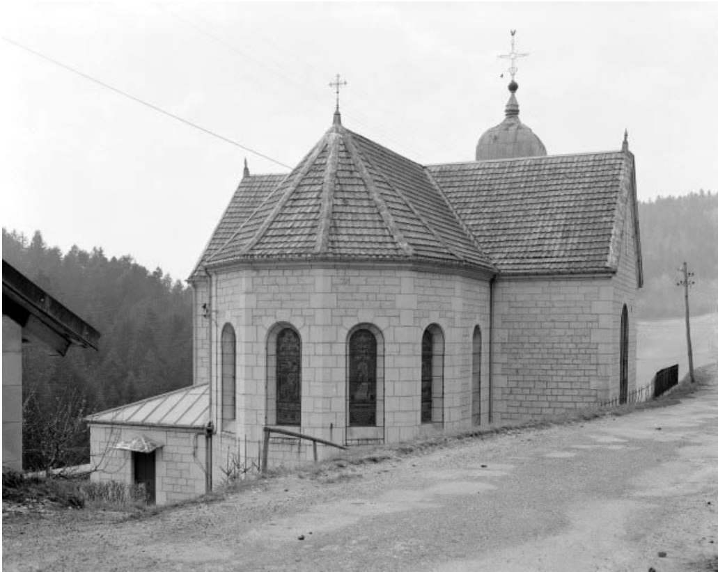
Extérieur : façade postérieure.

25, Montlebon, lieudit : Derrière le Mont