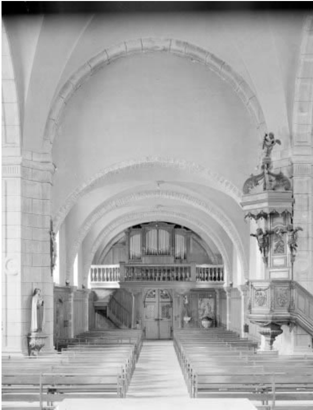
Intérieur vu depuis le chœur.

25, Montlebon, lieudit : Derrière le Mont