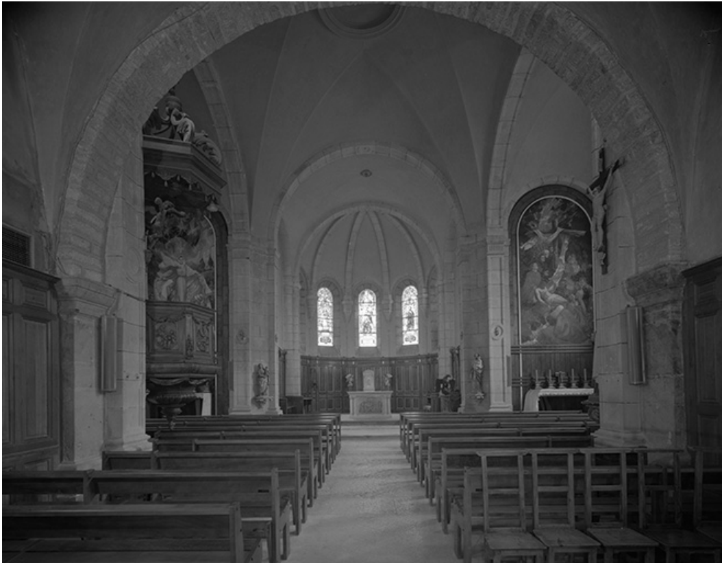
Nef vue depuis l'entrée.

25, Montlebon, lieudit : Derrière le Mont