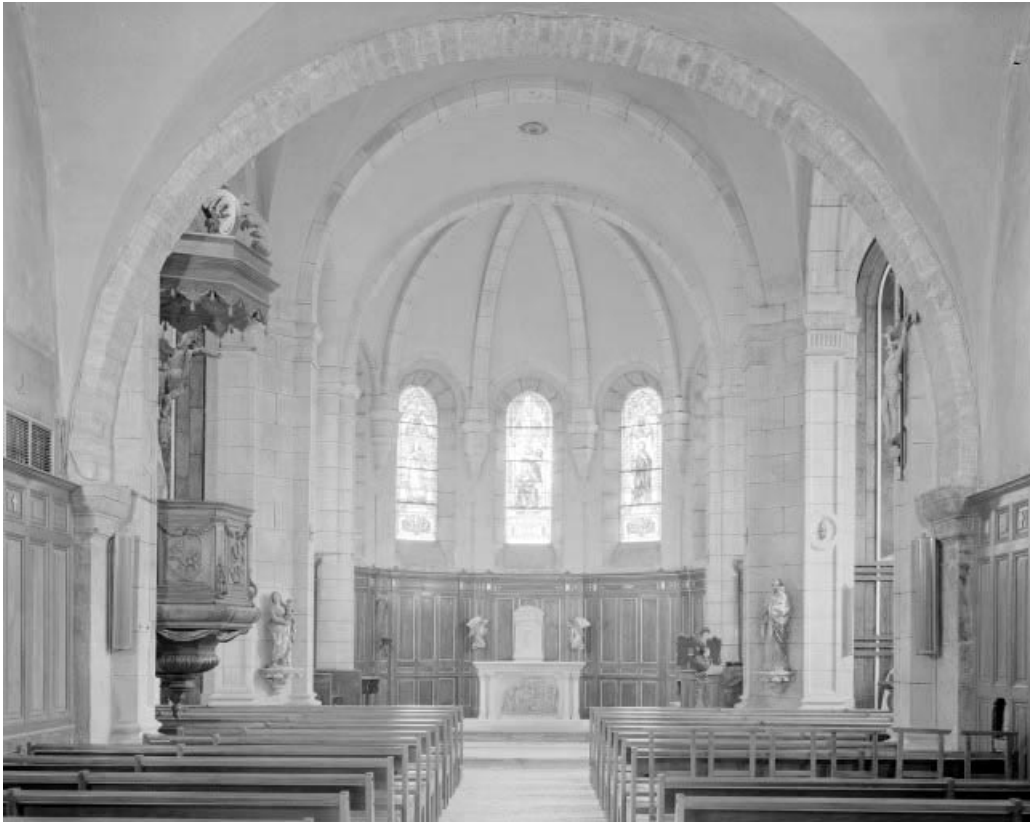
Intérieur vu depuis l'entrée.

25, Montlebon, lieudit : Derrière le Mont