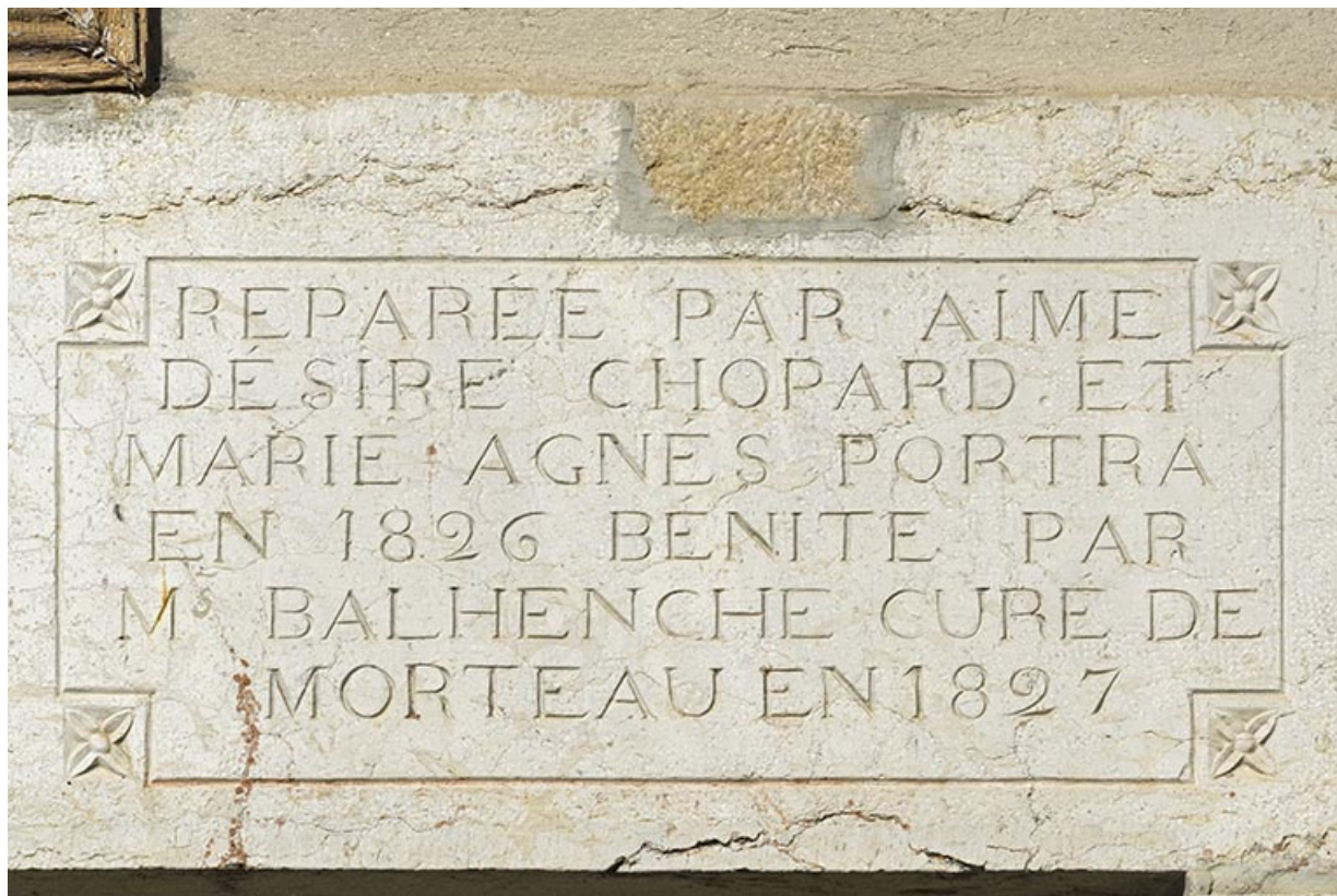
Linteau : inscription sur la partie droite.