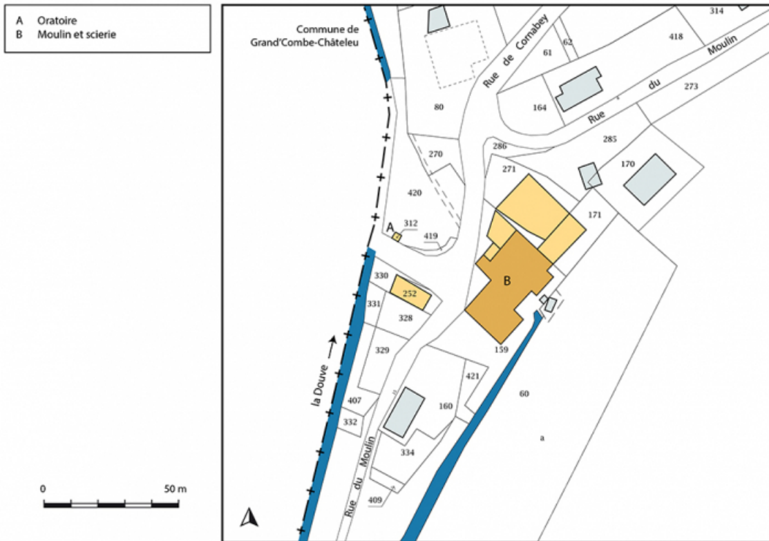
Plan-masse et de situation. Extrait du plan cadastral, 2017, section A, 1/1 000. 25, Montlebon, lieudit : Cornabey