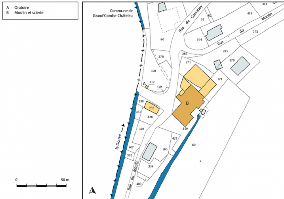
Plan-masse et de situation. Extrait du plan cadastral, 2017, section A, 1/1 000. 25, Montlebon, lieudit : Cornabey