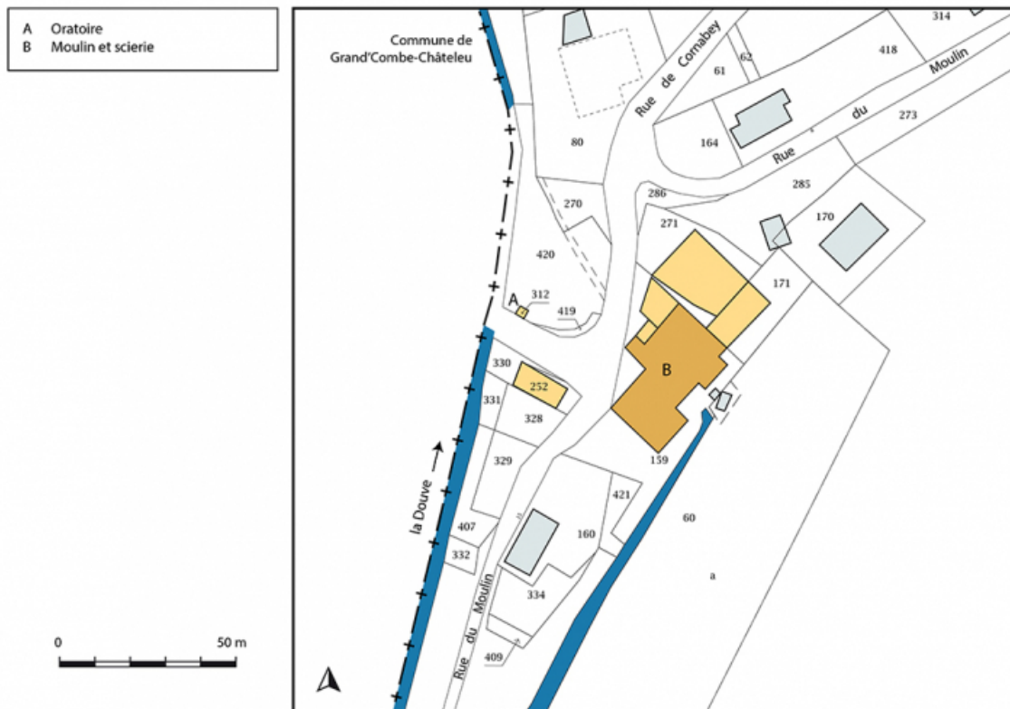
Plan-masse et de situation. Extrait du plan cadastral, 2017, section A, 1/1 000. 25, Montlebon, lieu-dit : Cornabey