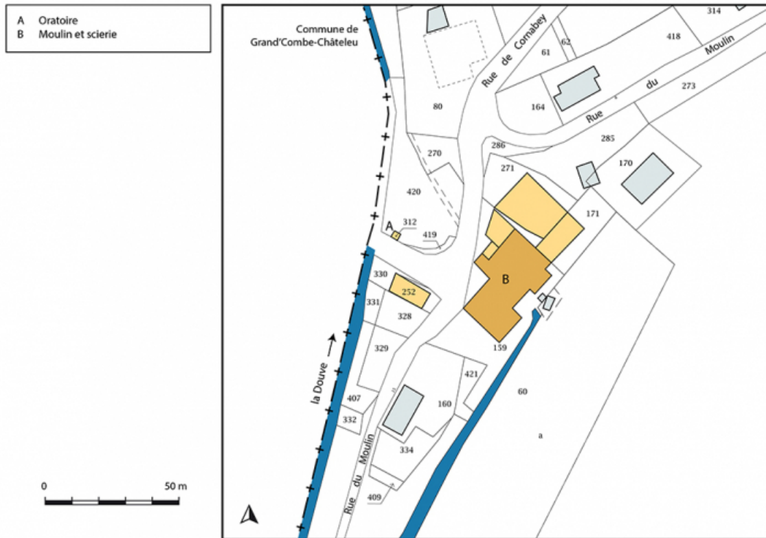
Plan-masse et de situation. Extrait du plan cadastral, 2017, section A, 1/1 000. 25, Montlebon, lieu-dit : Cornabey