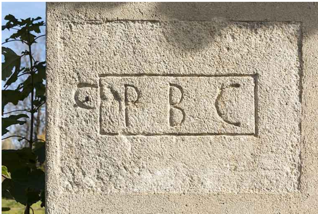
Initiales sur la façade latérale gauche.