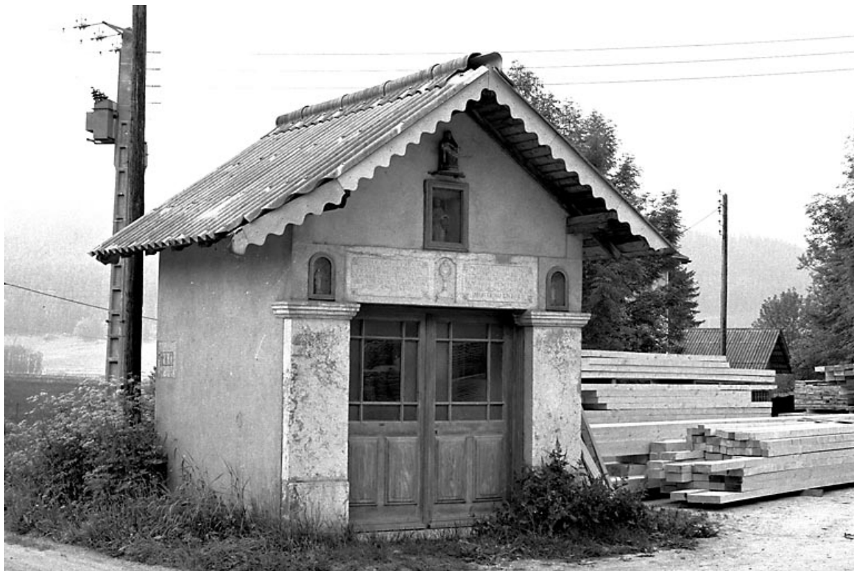
Vue de trois quarts gauche.