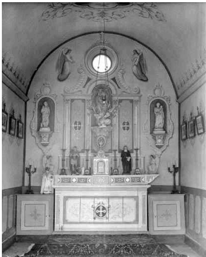
Intérieur vu depuis l'entrée.