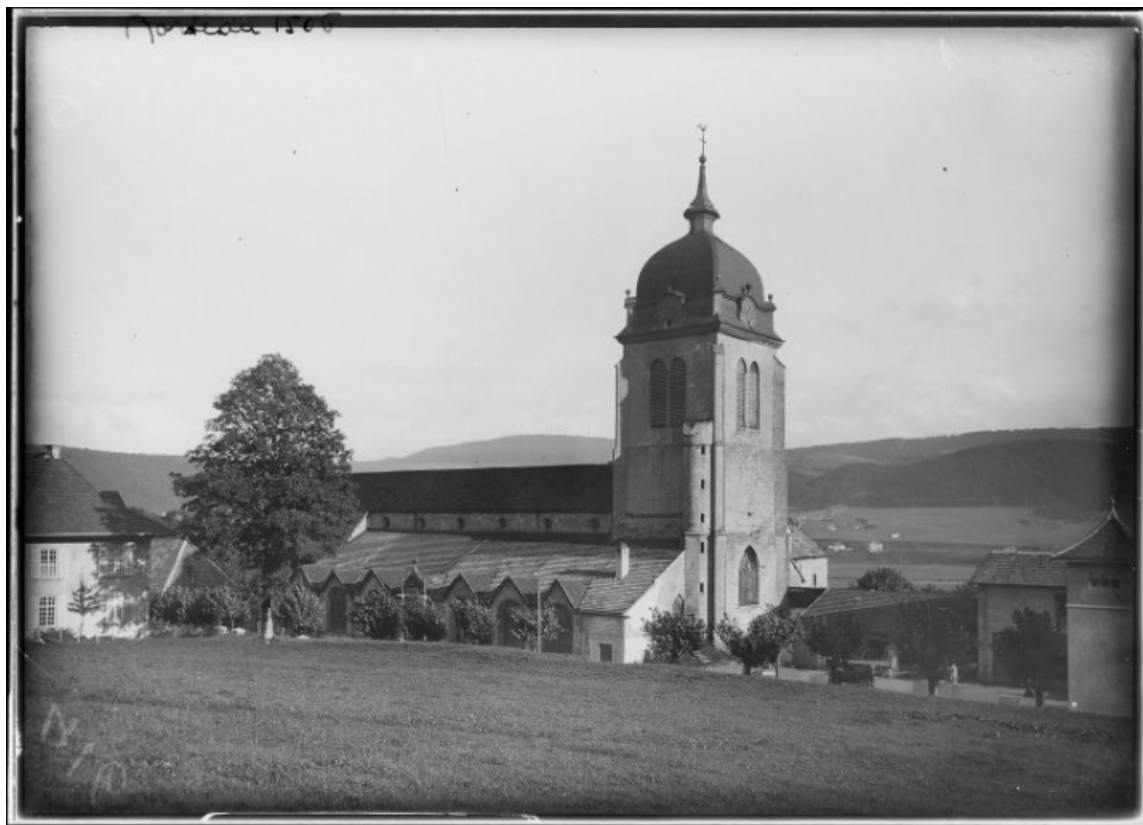
Façade latérale gauche et clocher de l'église [1re moitié 20e siècle]. 25, Montlebon, lieudit : Sur-la-Seigne