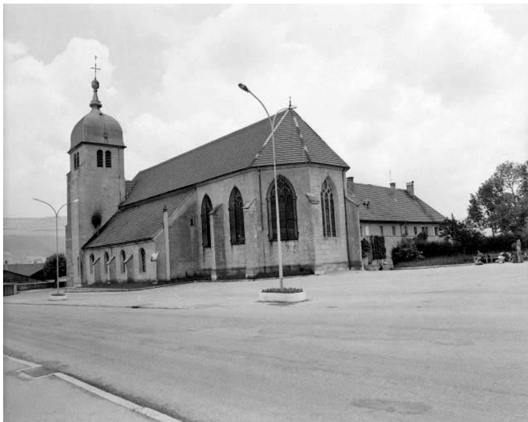
Chevet et façade latérale droite.