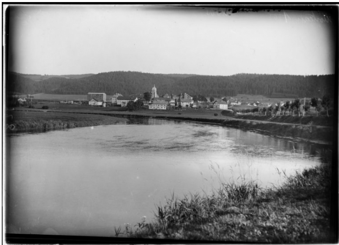
Le village et l'église paroissiale de l'Assomption vus depuis une rive du Doubs [1re moitié 20e siècle]. 25, Montlebon, Doubs rue du 8