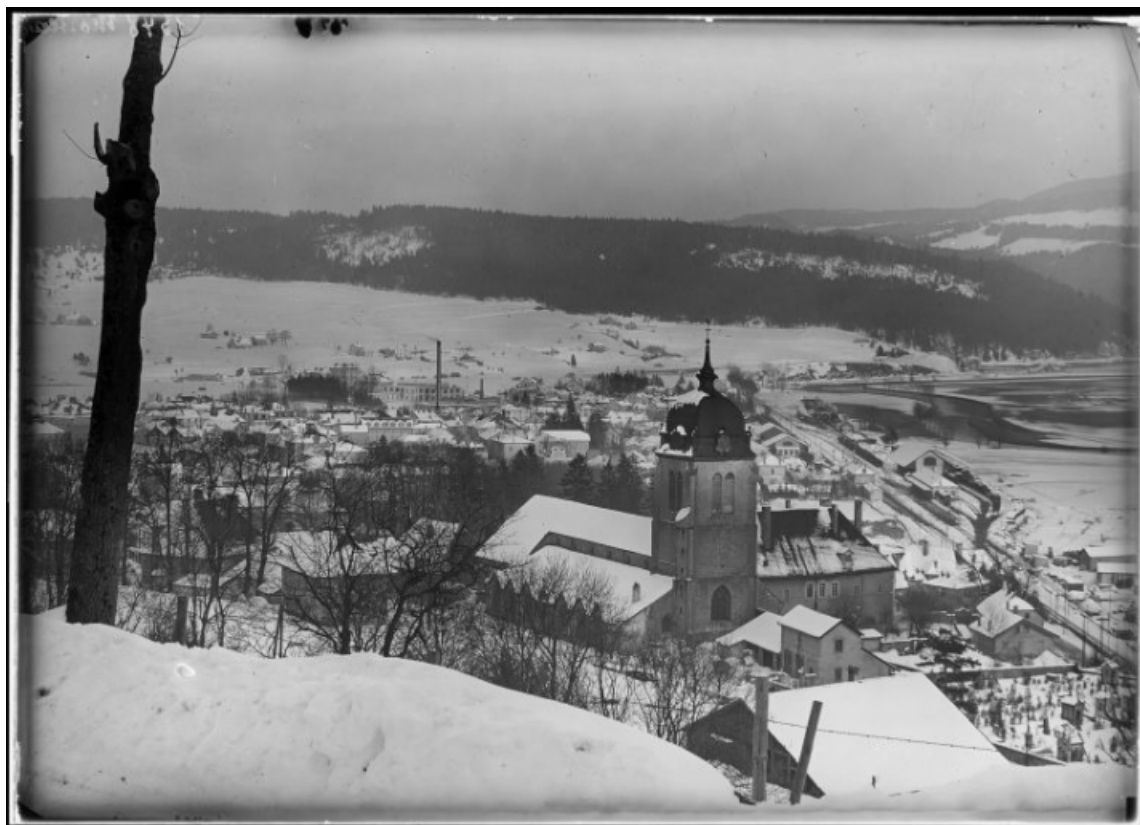
Vue de situation [1re moitié 20e siècle].