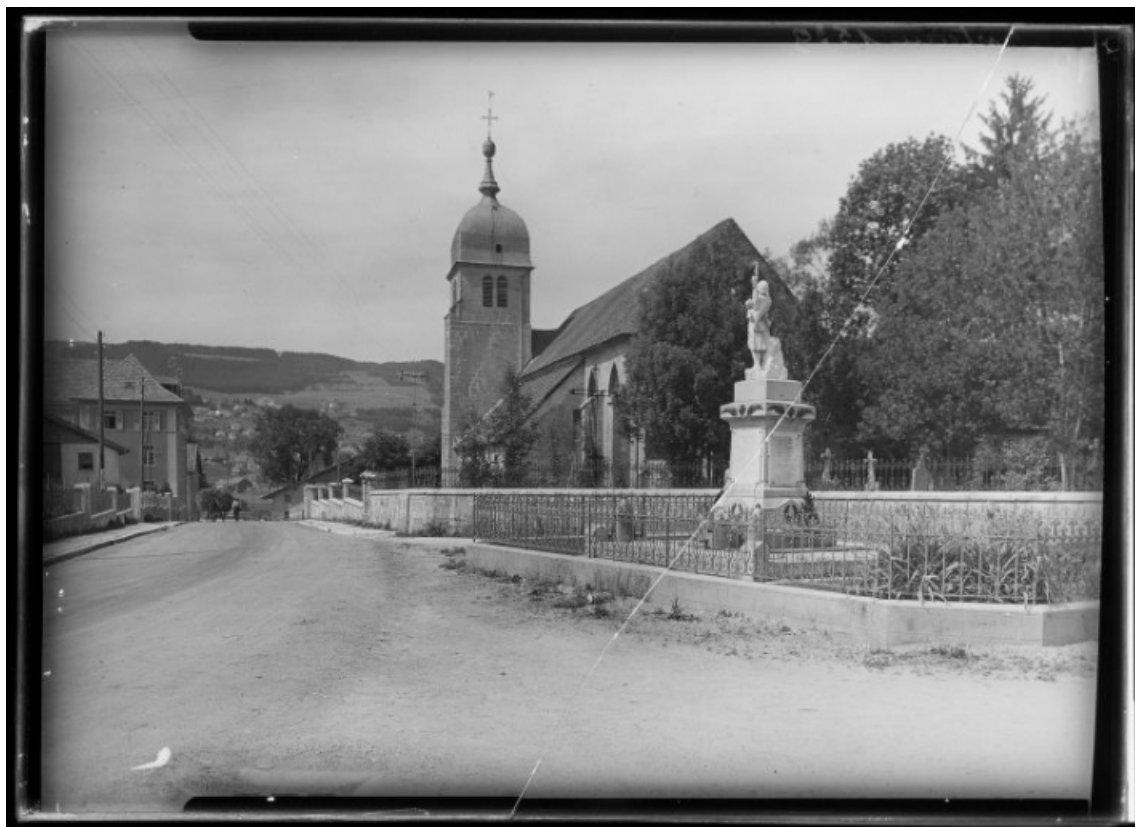
Eglise paroissiale de l'Assomption et monument aux morts [1re moitié 20e siècle]. 25, Montlebon, lieudit : Sur-la-Seigne