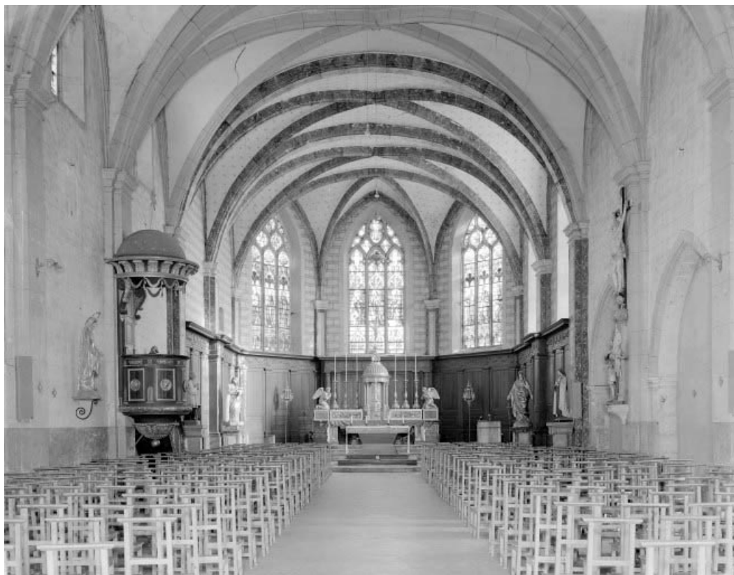
Intérieur vu de puis l'entrée.