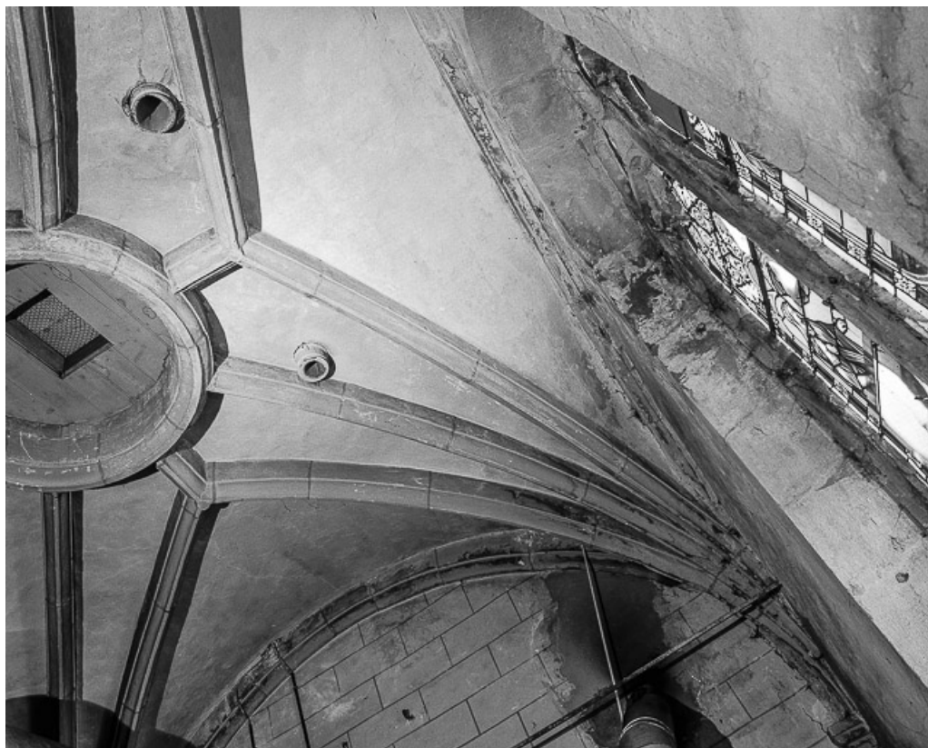
Détail d'une branche d'ogive.