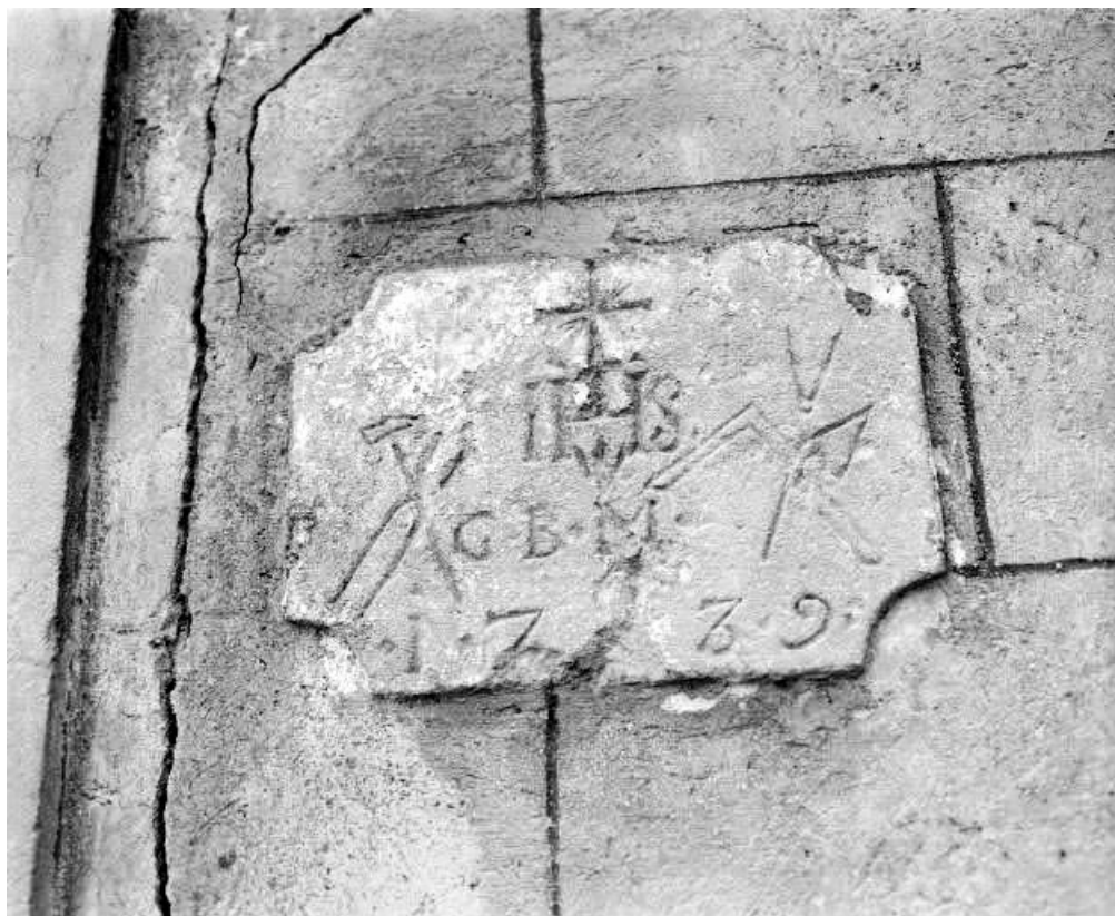
Détail : pierre datée de 1739.