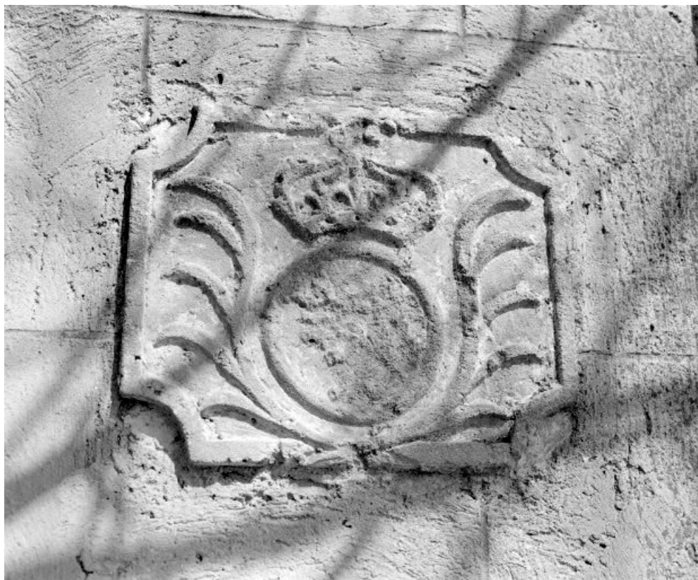
Détail : pierre avec blason aux armes de France.