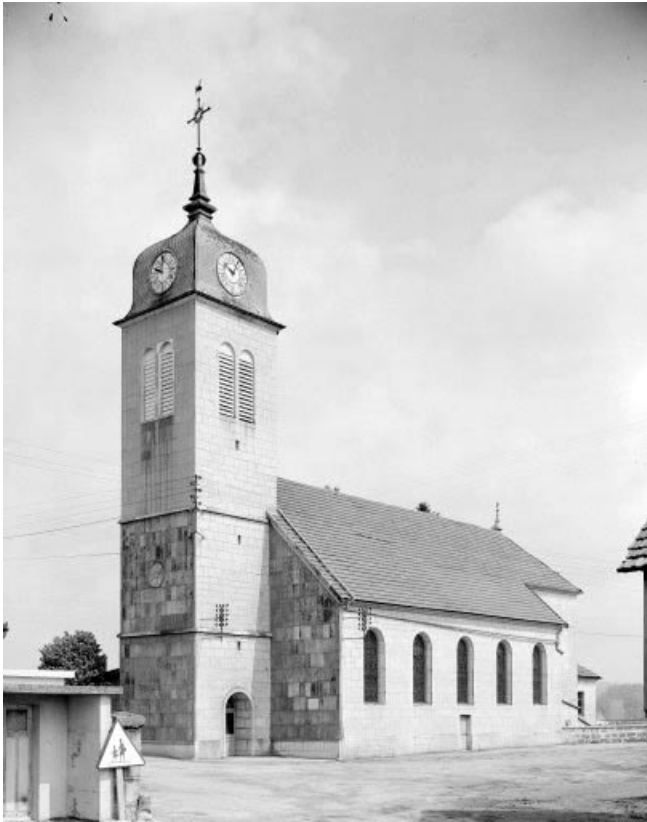
Façade latérale droite.