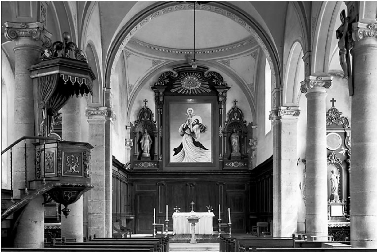
Vue d'ensemble depuis l'entrée.