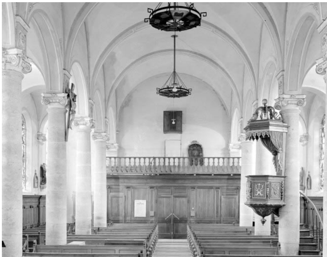
Vue d'ensemble depuis le chœur.