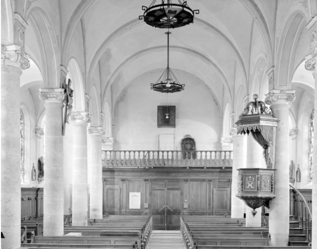
Vue d'ensemble depuis le chœur.