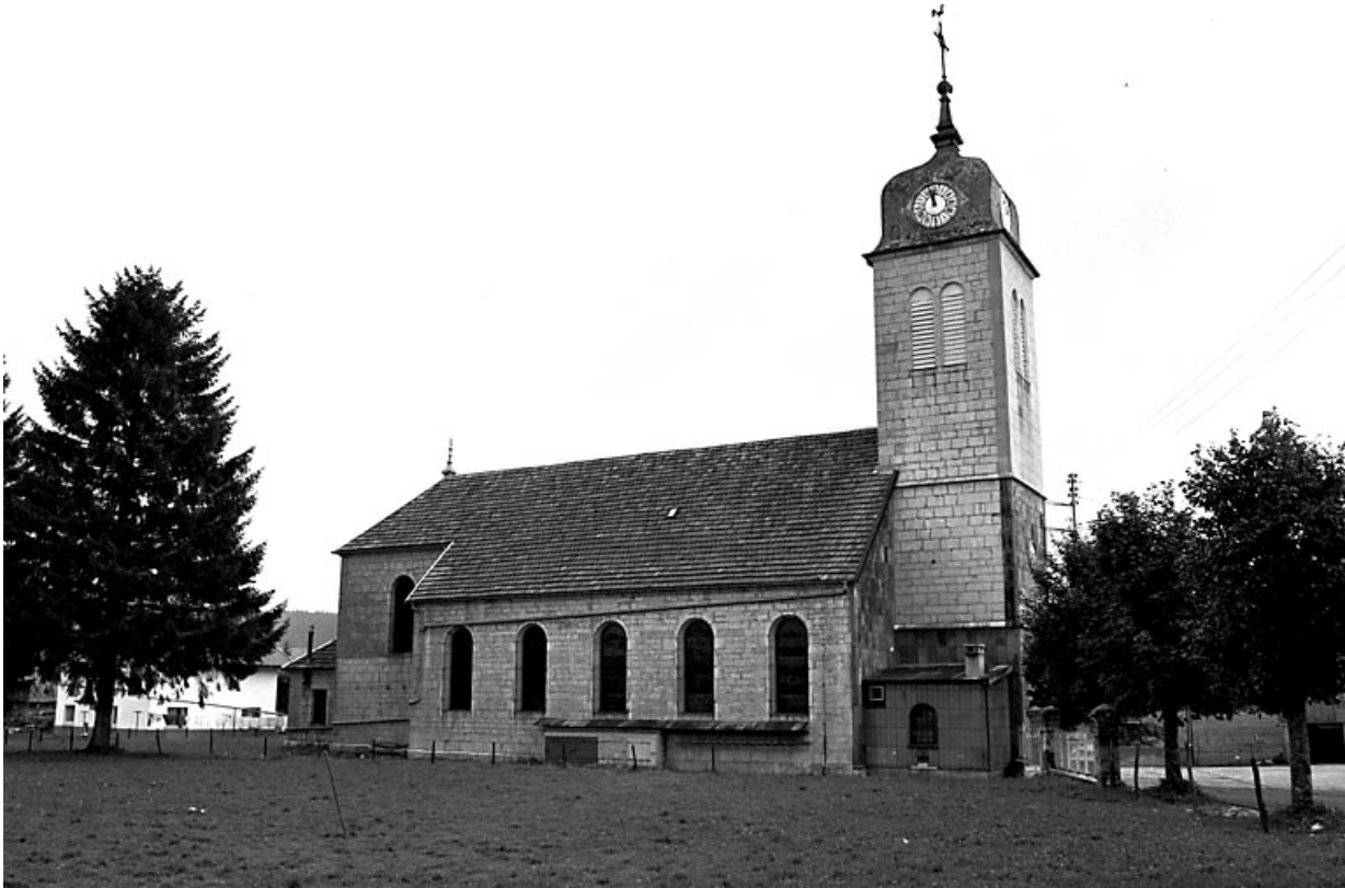
Façade latérale gauche.