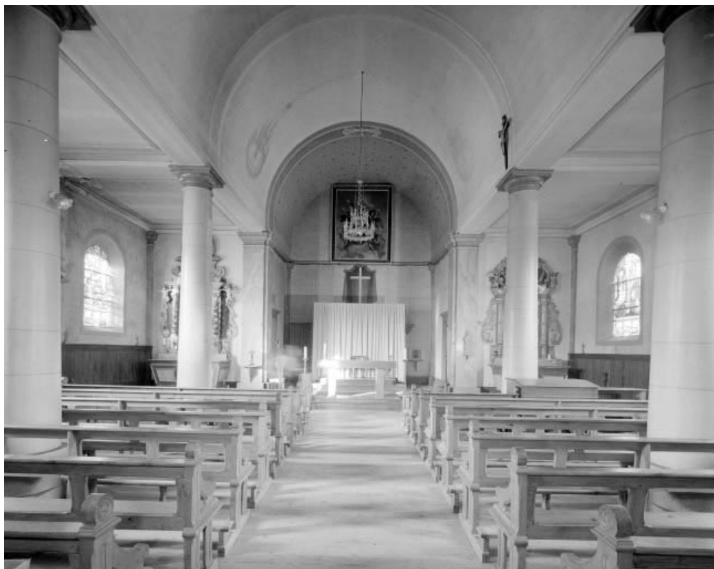
Intérieur : vue d'ensemble depuis l'entrée.