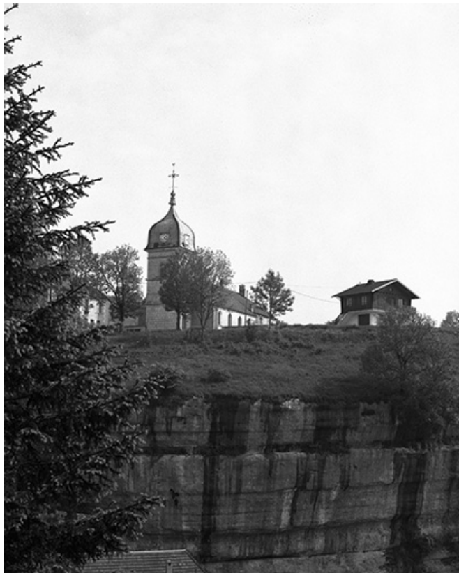
Façade antérieure et face latérale droite.