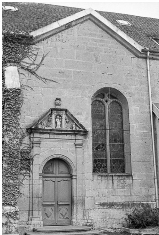
Face latérale droite, troisième travée de la nef. 25, Grand'Combe-Châteleu