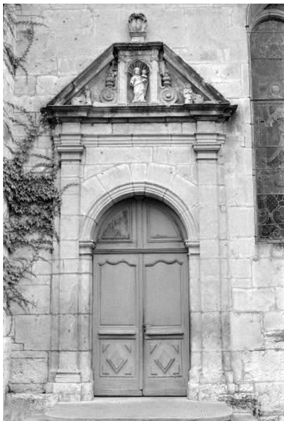
Portail latéral de la nef.