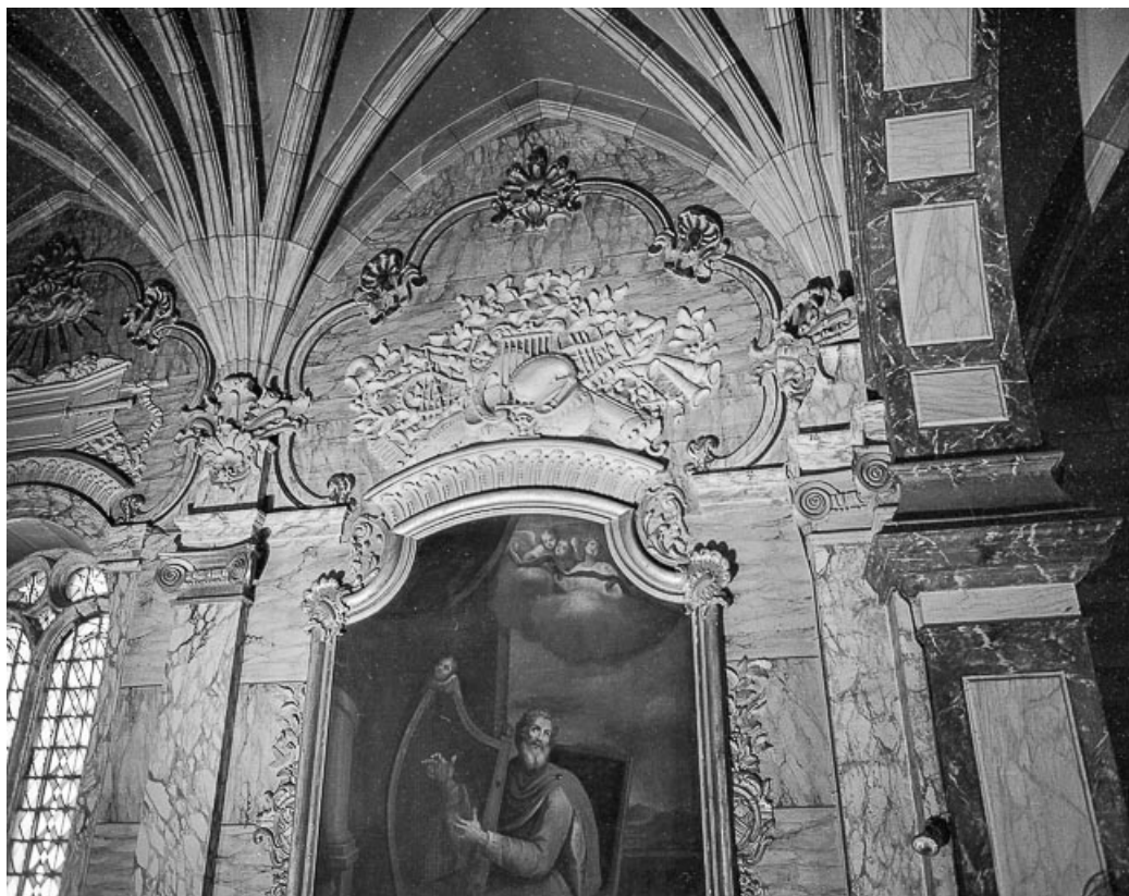
Mur droit, première travée. 25, Grand'Combe-Châteleu