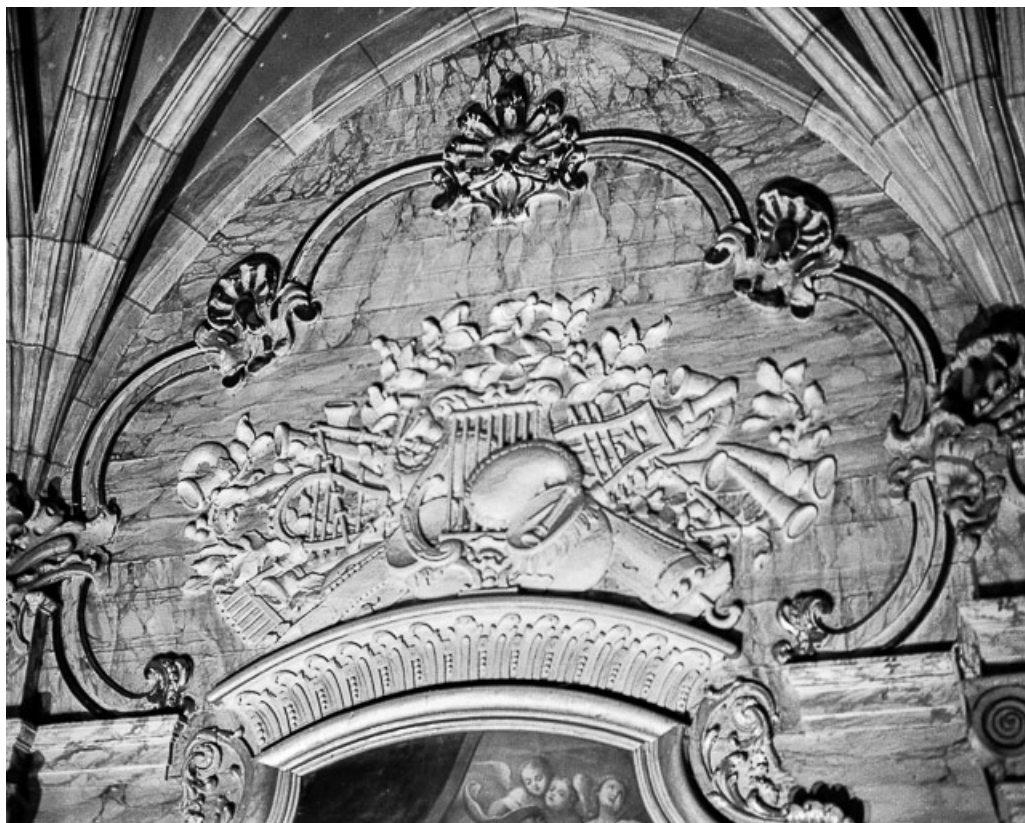
Détail : trophée d'instruments de musique, relief. 25, Grand'Combe-Châteleu