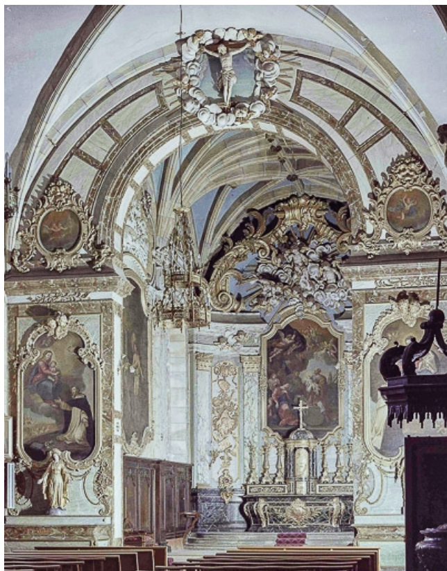
Décor du choeur : vue d'ensemble, de trois quarts.