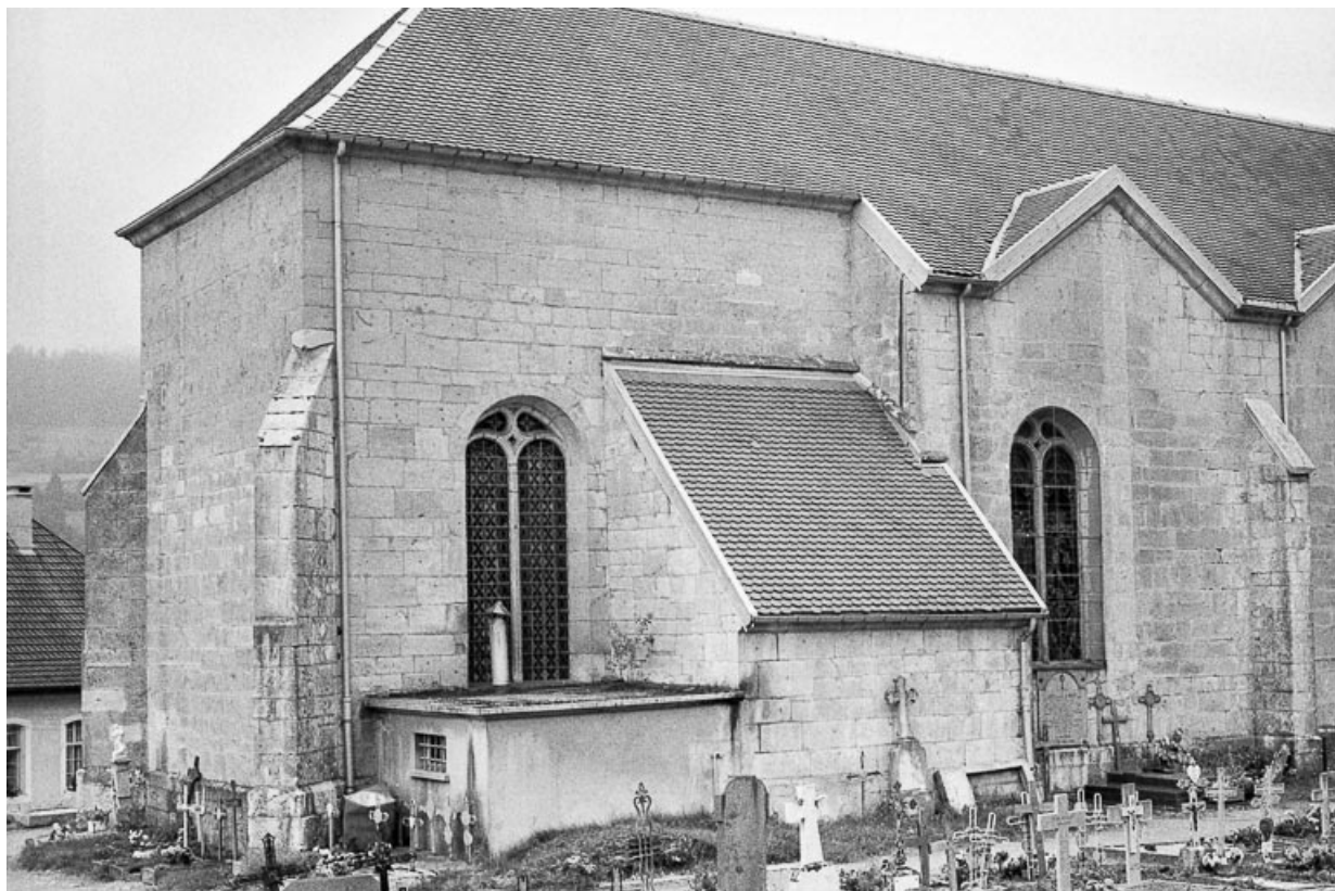
Façade latérale gauche et chevet.