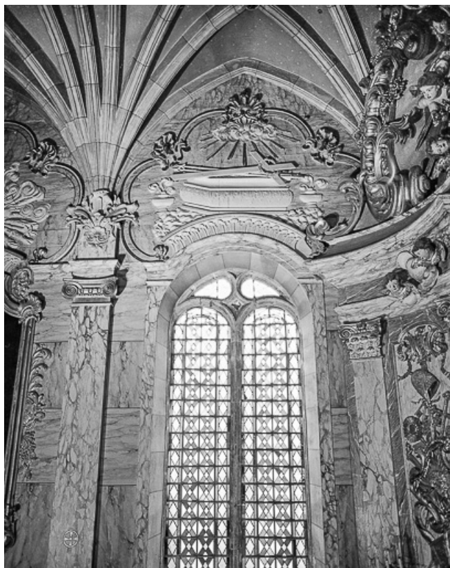
Mur gauche, deuxième travée.