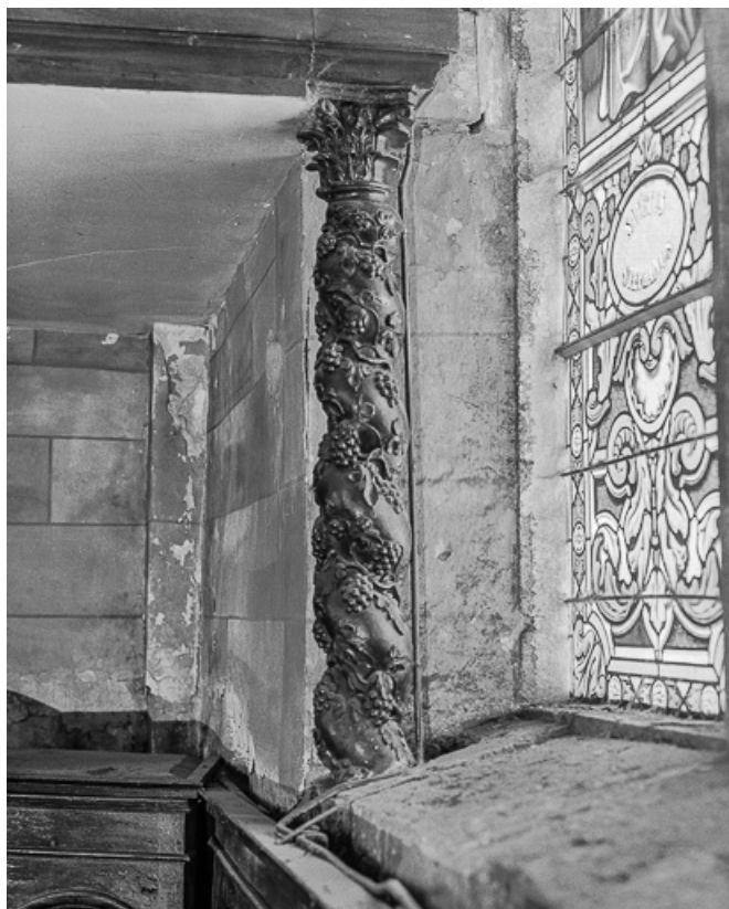
Colonne torse soutenant la tribune.