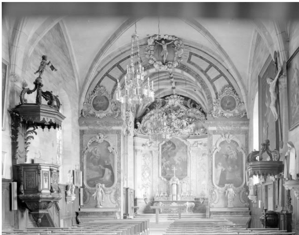
Intérieur : le chœur vu de puis la nef. 25, Grand'Combe-Châteleu