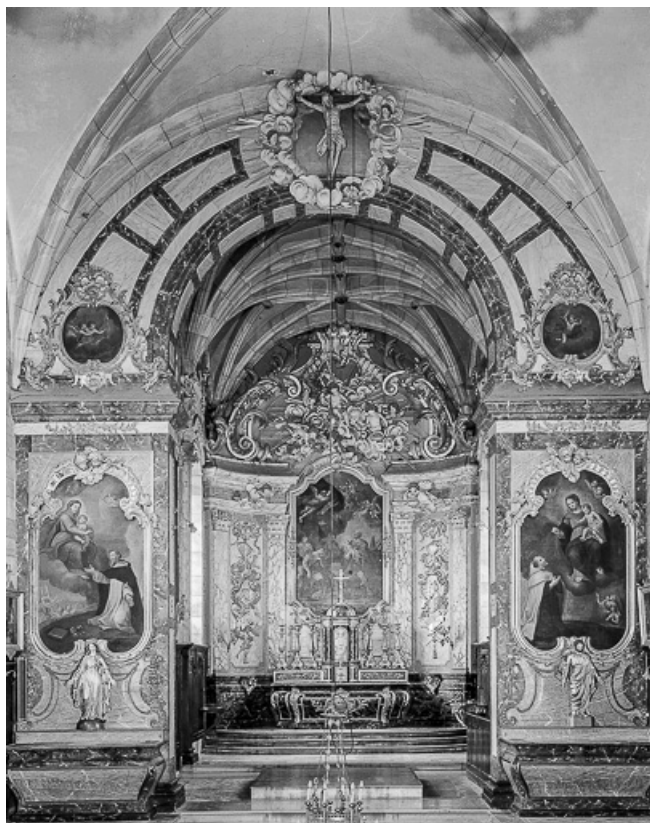
Choeur et mur est de la nef.