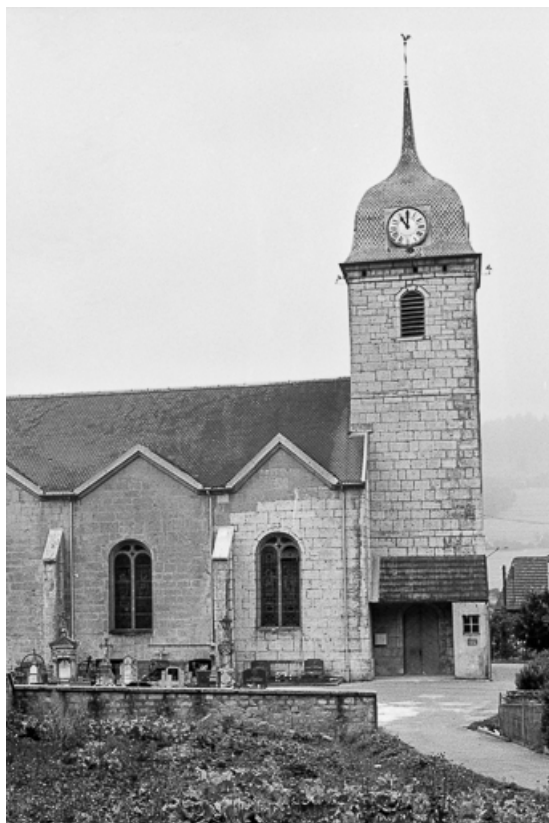
Façade latérale gauche et clocher.