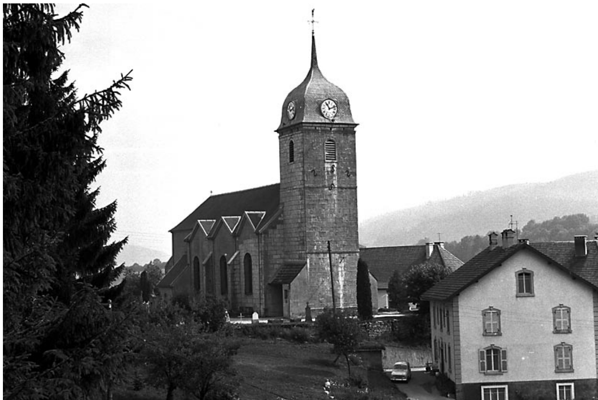
Vue d'ensemble de trois quarts gauche. 25, Grand'Combe-Châteleu