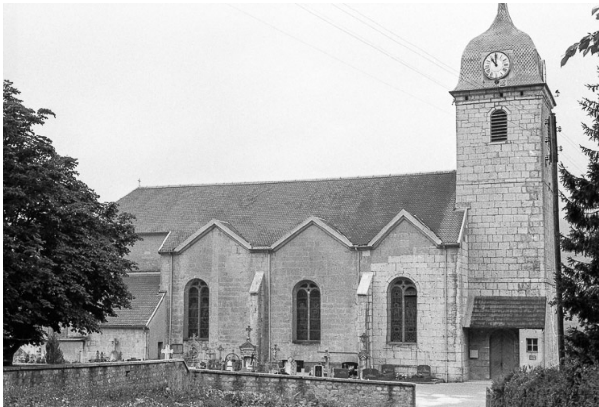
Façade latérale gauche. 25, Grand'Combe-Châteleu