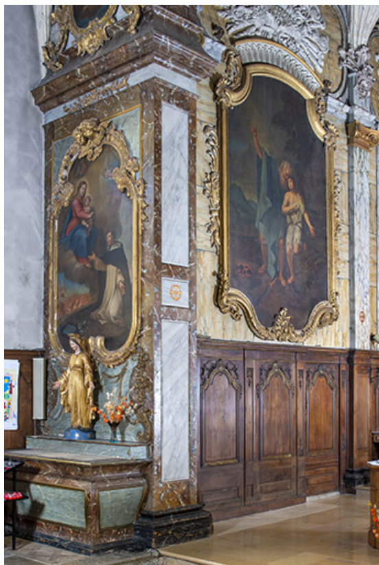
Décor du chœur en 2021 : partie gauche. 25, Grand'Combe-Châteleu