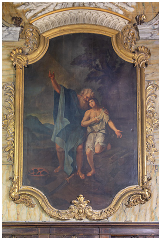
Tableau côté gauche du chœur en 2021. 25, Grand'Combe-Châteleu