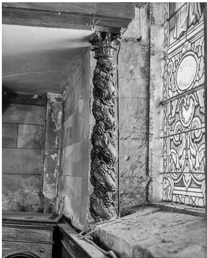
Colonne torse soutenant la tribune.