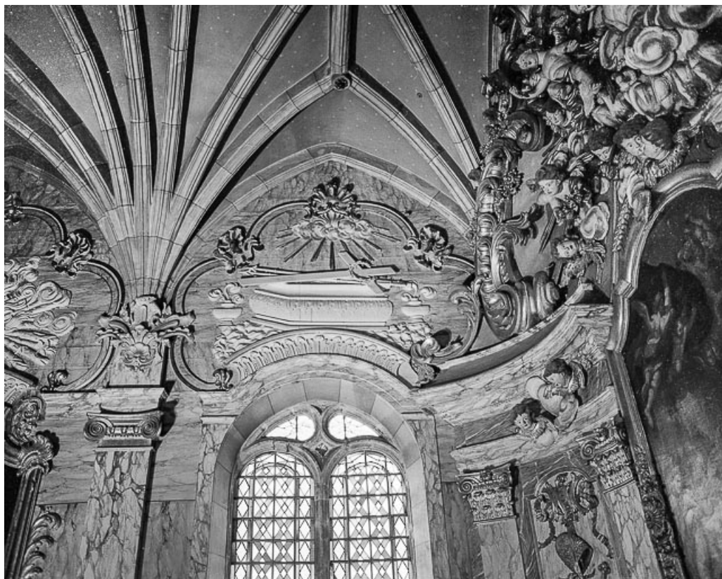
Mur gauche, deuxième travée. 25, Grand'Combe-Châteleu