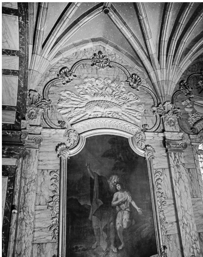
Mur gauche, première travée.