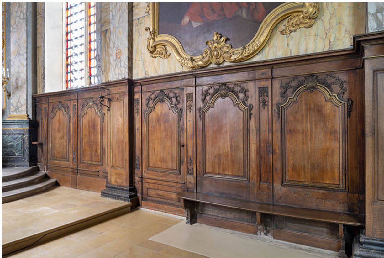
Lambris de demi-revêtement sur le côté gauche du choeur en 2021. 25, Grand'Combe-Châteleu