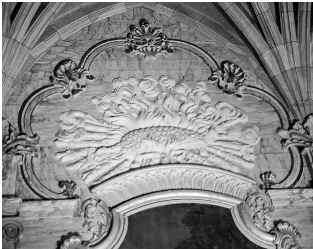
Détail : l'Agneau mystique, relief. 25, Grand'Combe-Châteleu