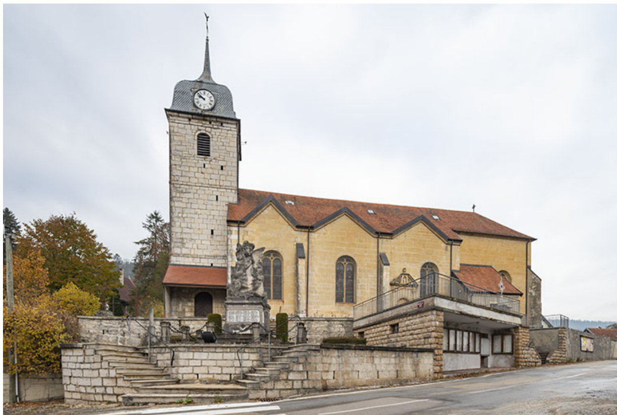
Façade latérale droite en 2021.