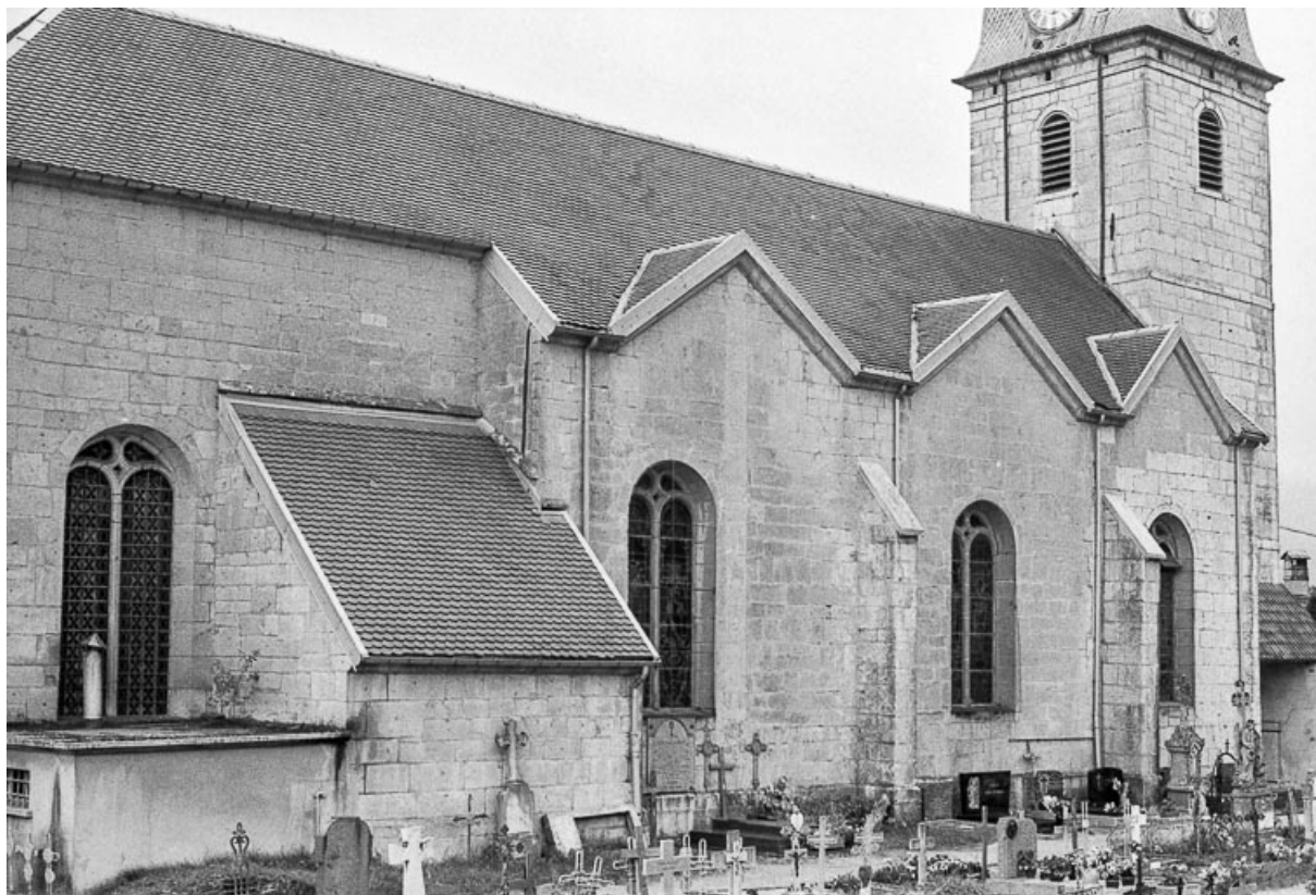
Façade latérale gauche, vue du nord-est. 25, Grand'Combe-Châteleu