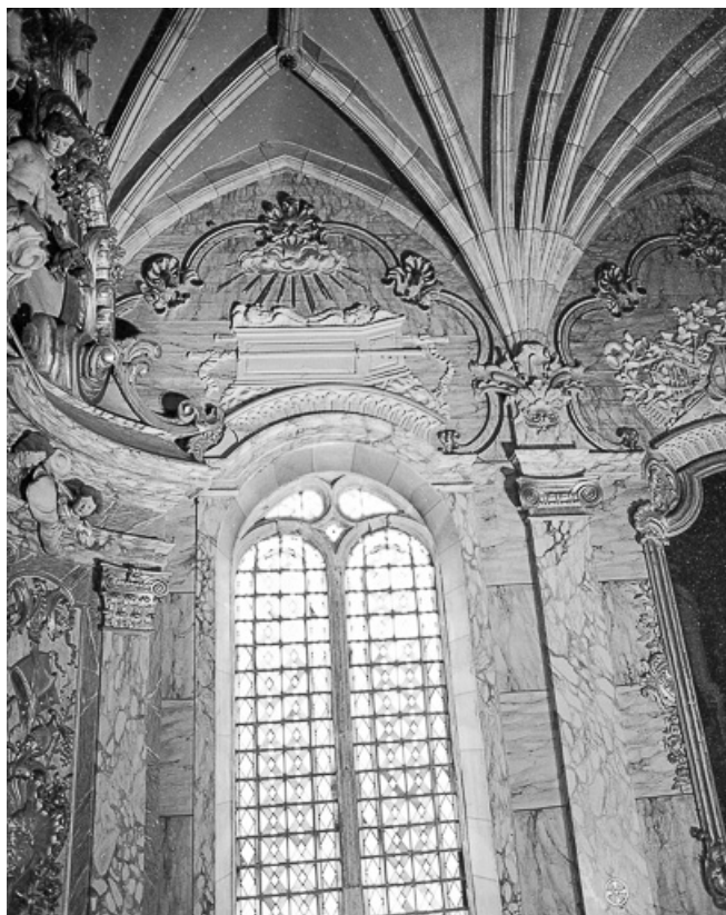
Mur droit, deuxième travée.