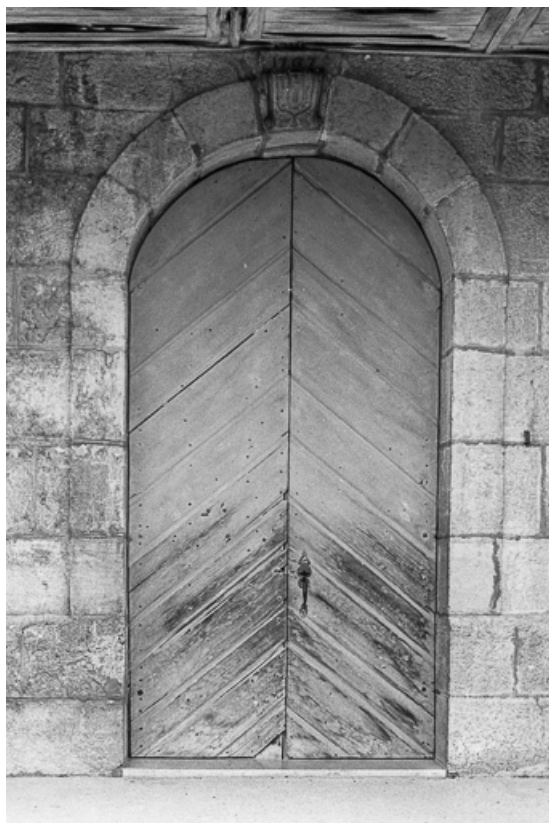
Portail latéral donnant dans le vestibule.