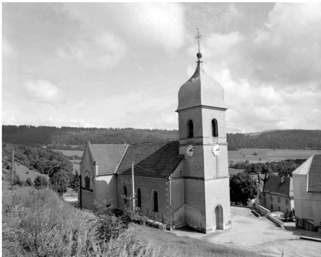
Façade latérale gauche. 25, Les Fins