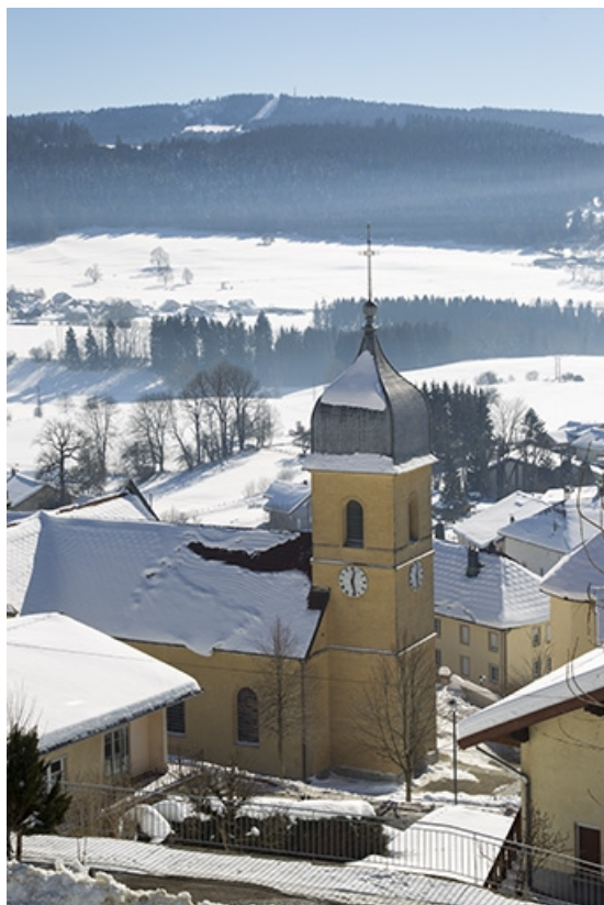
Vue d'ensemble en hiver.