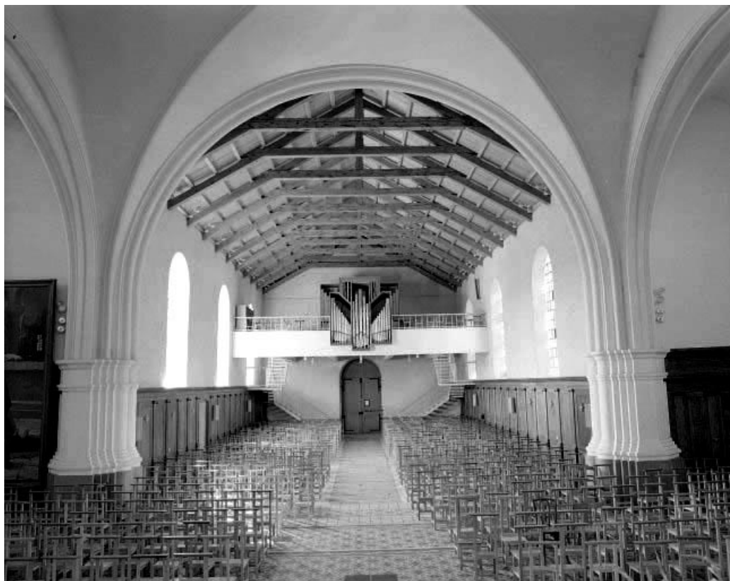
Intérieur : vue depuis le chœur.