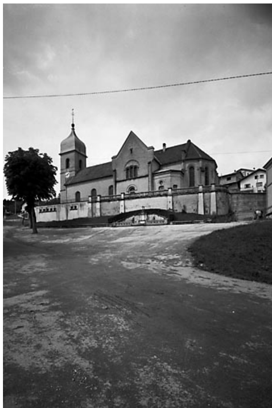
Façade latérale sud.