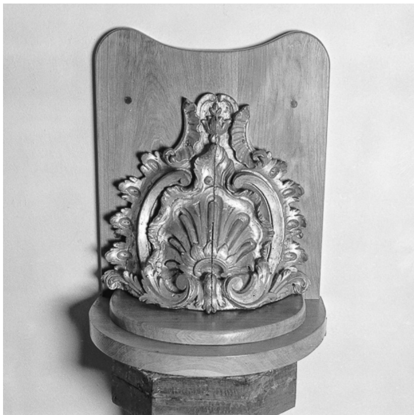
Console en bois doré. Vue de face.