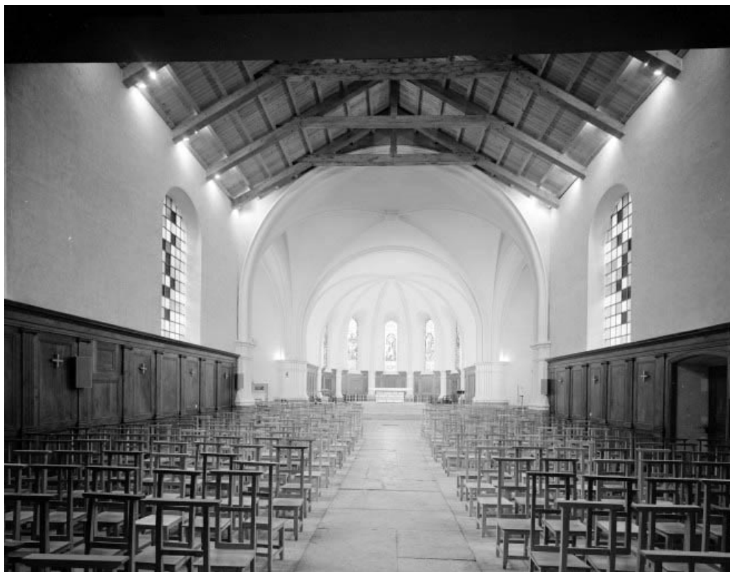
Intérieur : vue depuis l'entrée.