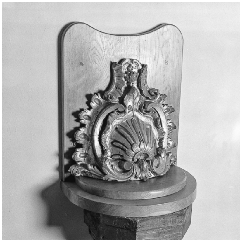
Console en bois doré : ue de trois quarts profil gauche. 25, Les Fins