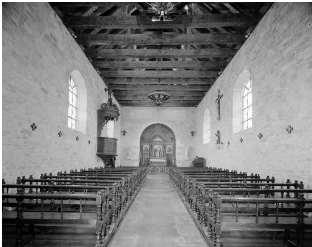
Intérieur : nef et chœur. 25, Saint-Gorgon-Main