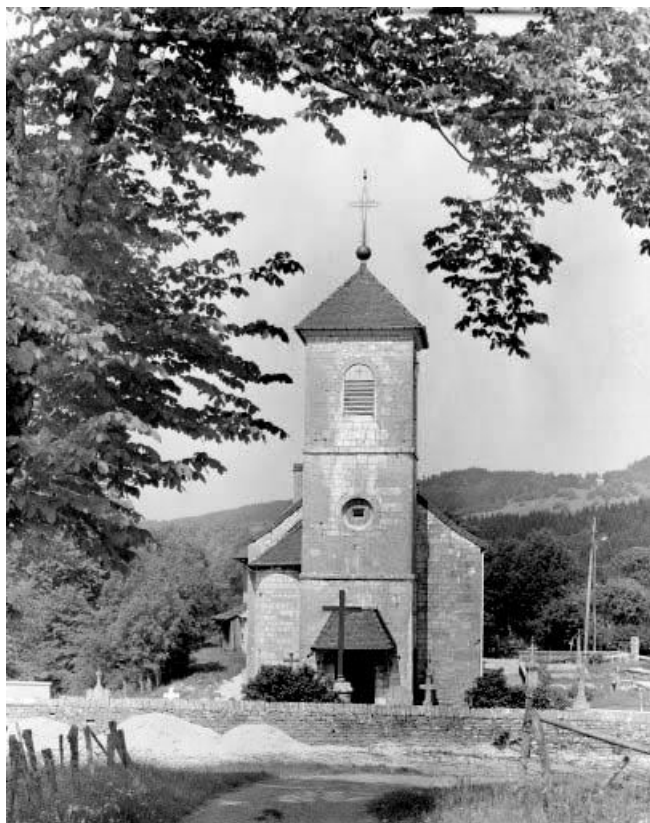
Façades antérieure. 25, Saint-Gorgon-Main