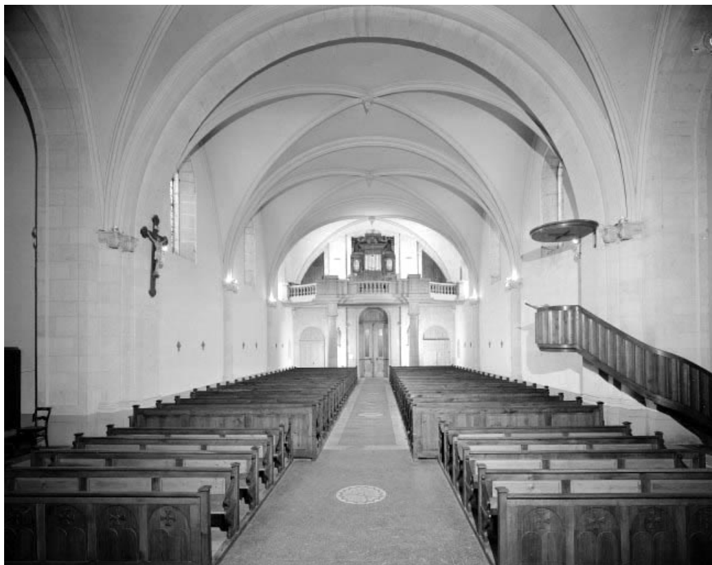
La nef vue depuis le chœur. 25, Gilley