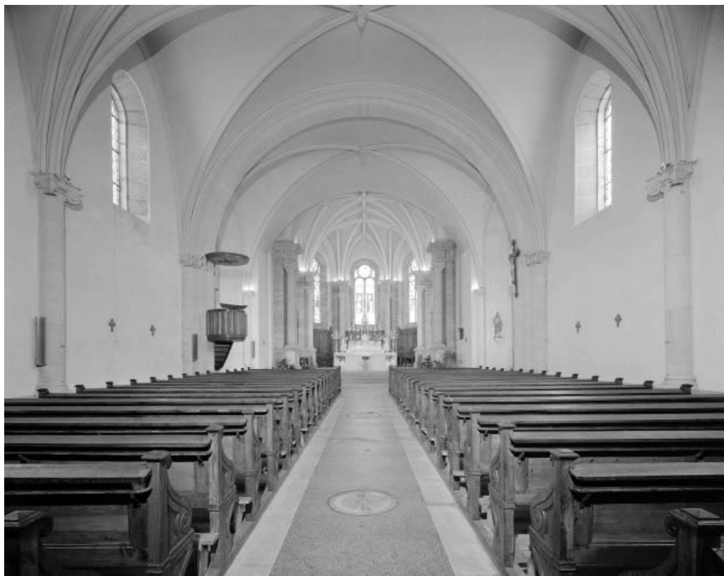
Intérieur : nef et choeur vus depuis l'entrée. 25, Gilley