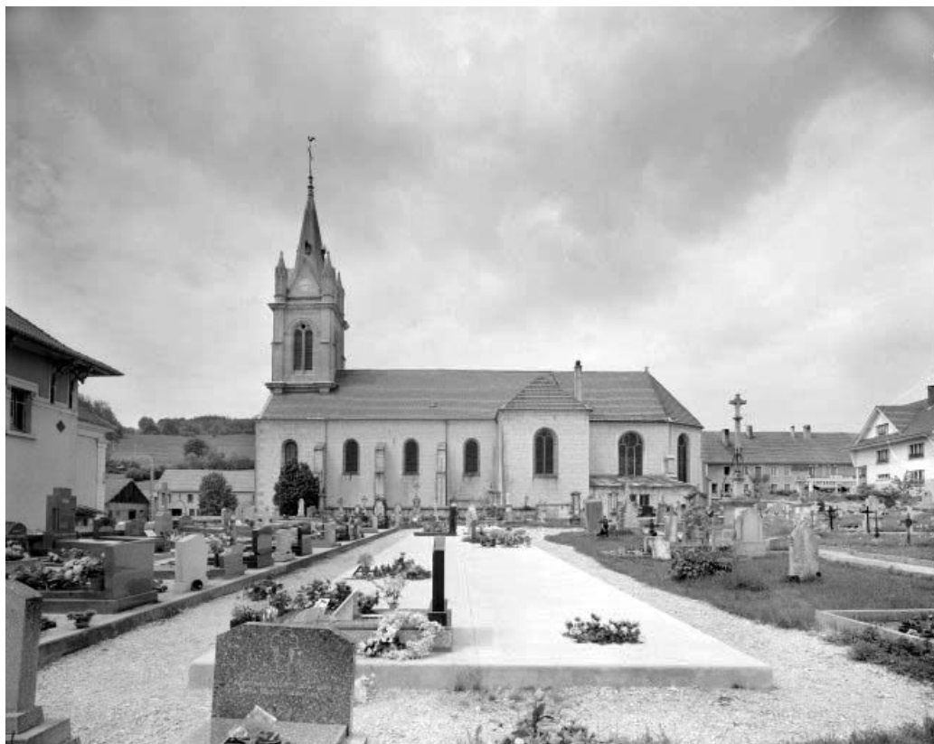
Façade latérale droite. 25, Gilley