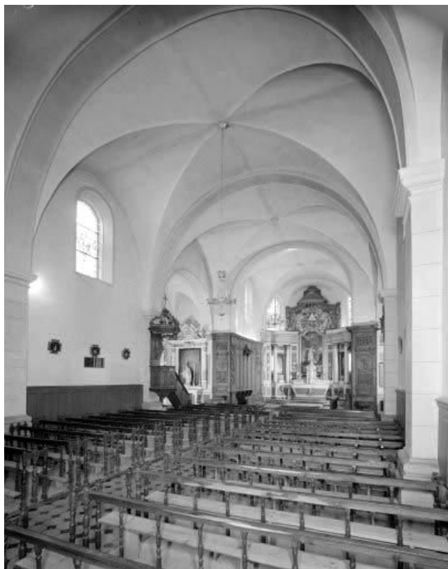
Intérieur: nef et chœur.