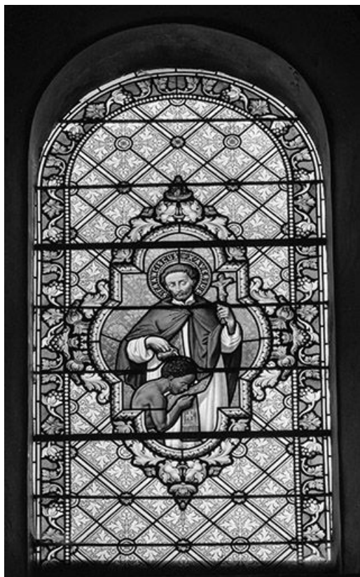
Baie : saint François-Xavier 25, Aubonne rue de l' Église