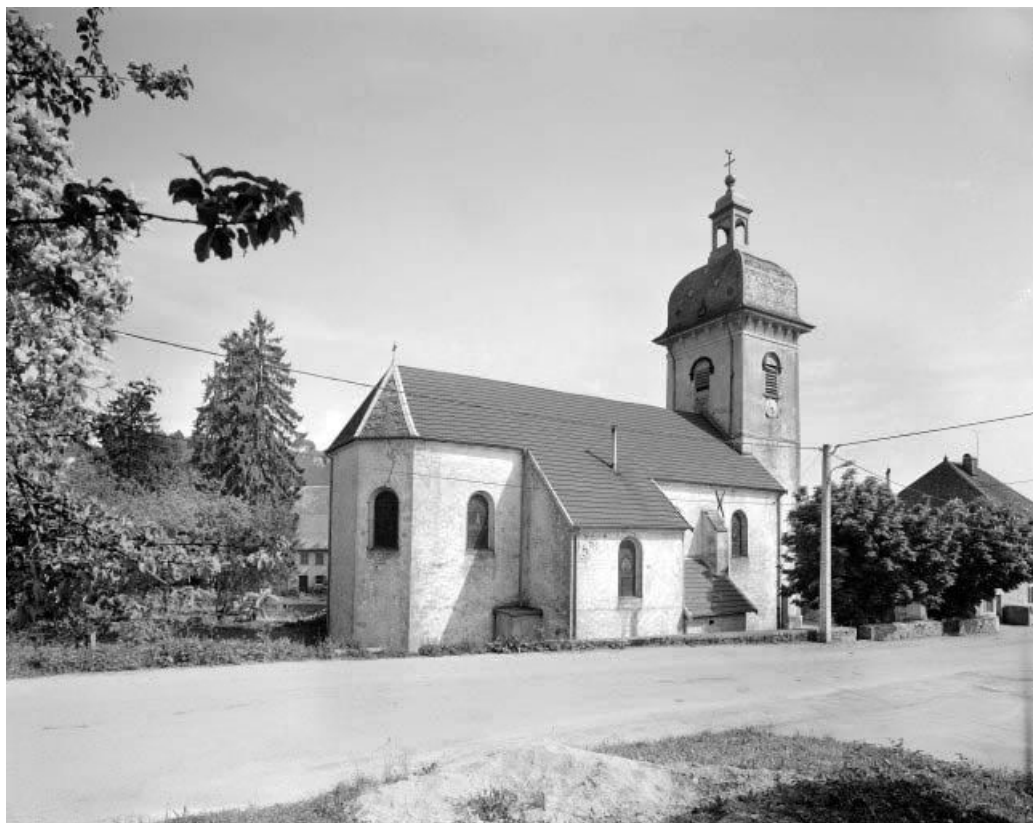
Façade latérale gauche et chevet.