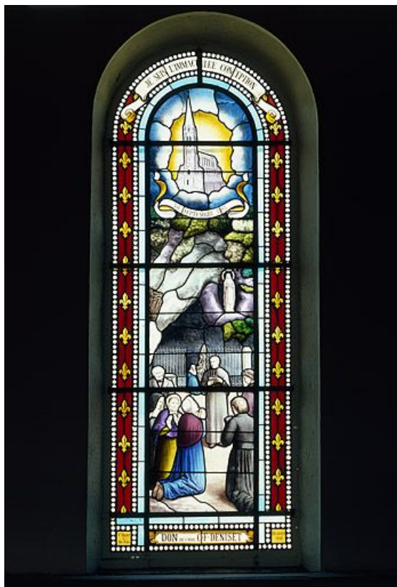
Baie 1 créée par Beyer et Fils aîné en 1897 : Immaculée Conception. Registre supérieur : apparition de la Vierge à Lourdes, bordure de fleurs de lys, registre inférieur : prédication et prières.