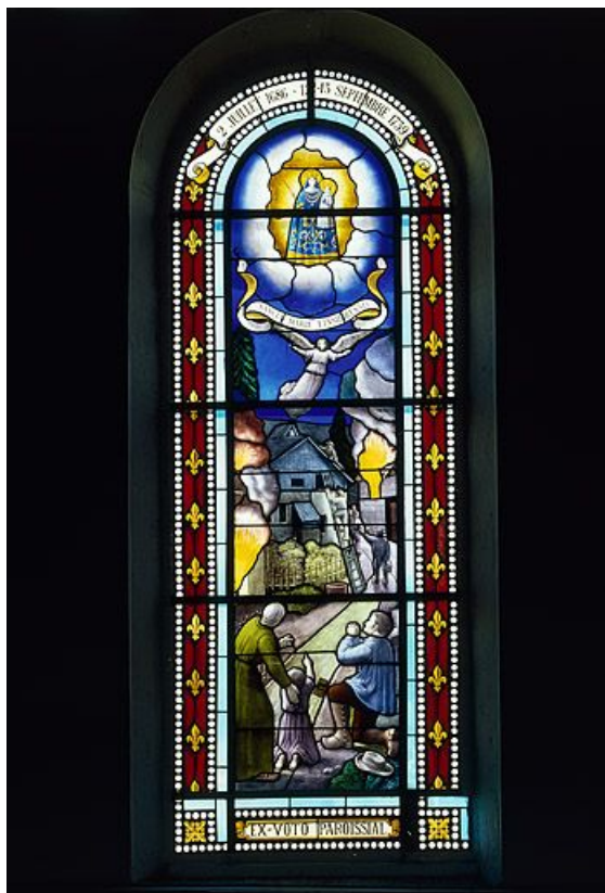
Baie 2 créée par Beyer : Notre-Dame d'Einsiedeln. Registre supérieur : apparition de la Vierge à l'Enfant, registre inférieur : incendie d'une maison, habitants en prière, bordure de fleurs de lys 25, Maisons-du-Bois-Lièvremont