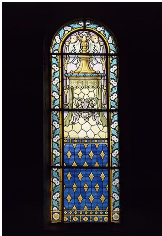
baies 3 et 4 créées par A. Gorgeon en 1902 : verrières décoratives, vitrerie avec dais et petits anges dans la partie supérieure. Baie 3 : vue d'ensemble.