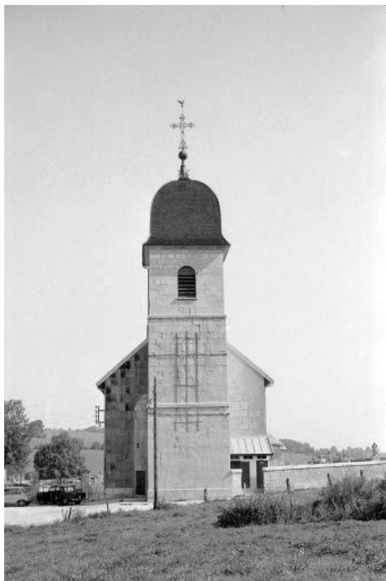
Vue de la façade avec clocher.

25, Maisons-du-Bois-Lièvre rue de l' Église, lieudit : Lièvre