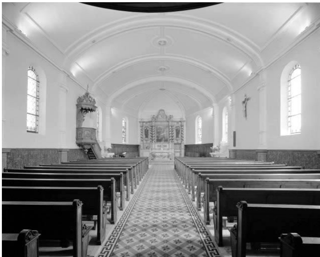
Intérieur : vue depuis l'entrée.

25, Maisons-du-Bois-Lièvre rue de l'Église, lieudit : Lièvre