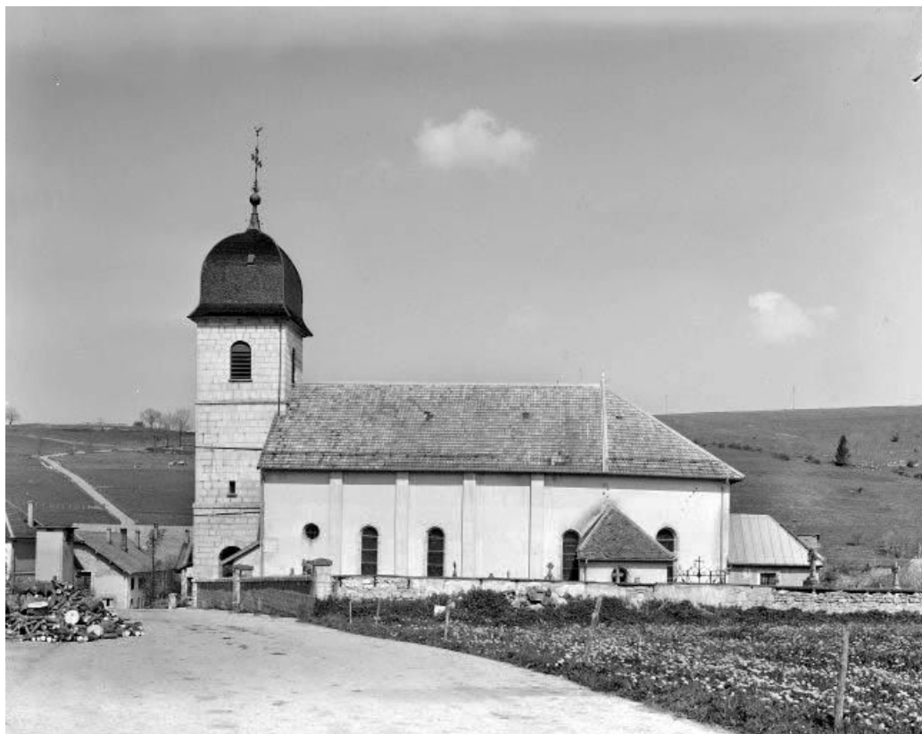
Extérieur : façade latérale droite.

25, Maisons-du-Bois-Lièvremont rue de l' Église, lieudit : Lièvremont