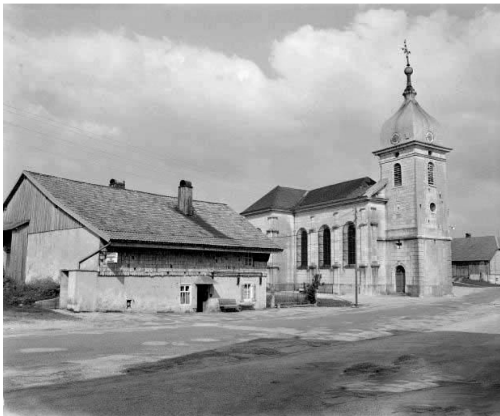
Vue de trois quarts et ferme à côté de l'église.