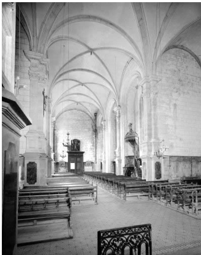
La nef vue depuis le chœur.