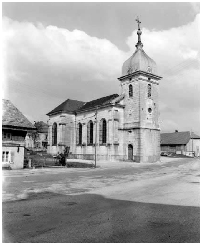
Façades antérieure et latérale gauche. 25, La Chaux