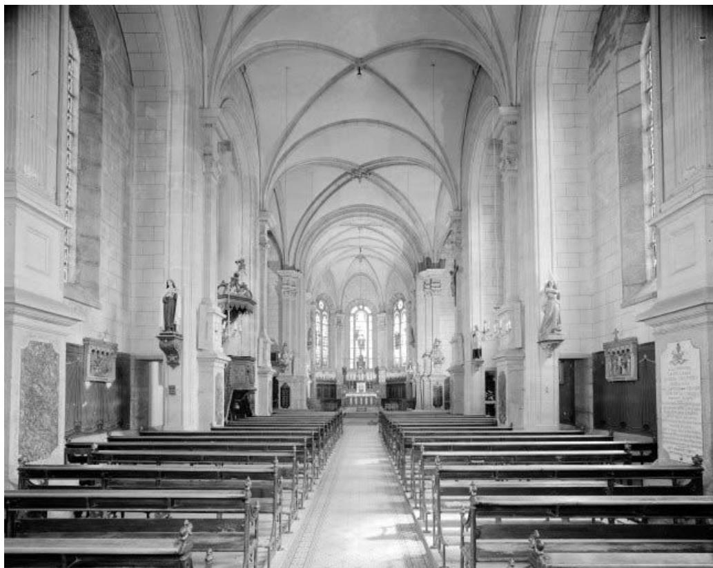
Intérieur : nef et chœur depuis l'entrée. 25, La Chaux