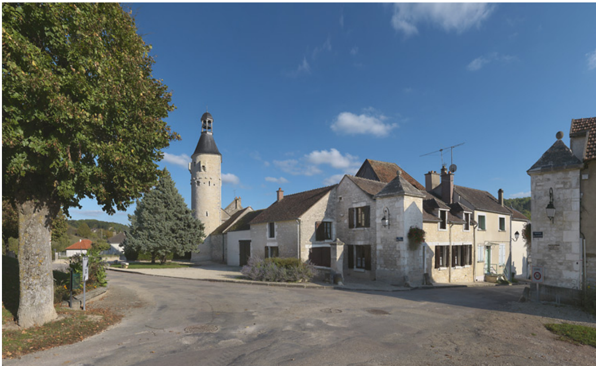
La tour dite de l'horloge et la porte de la Poterne. 89, Cravant