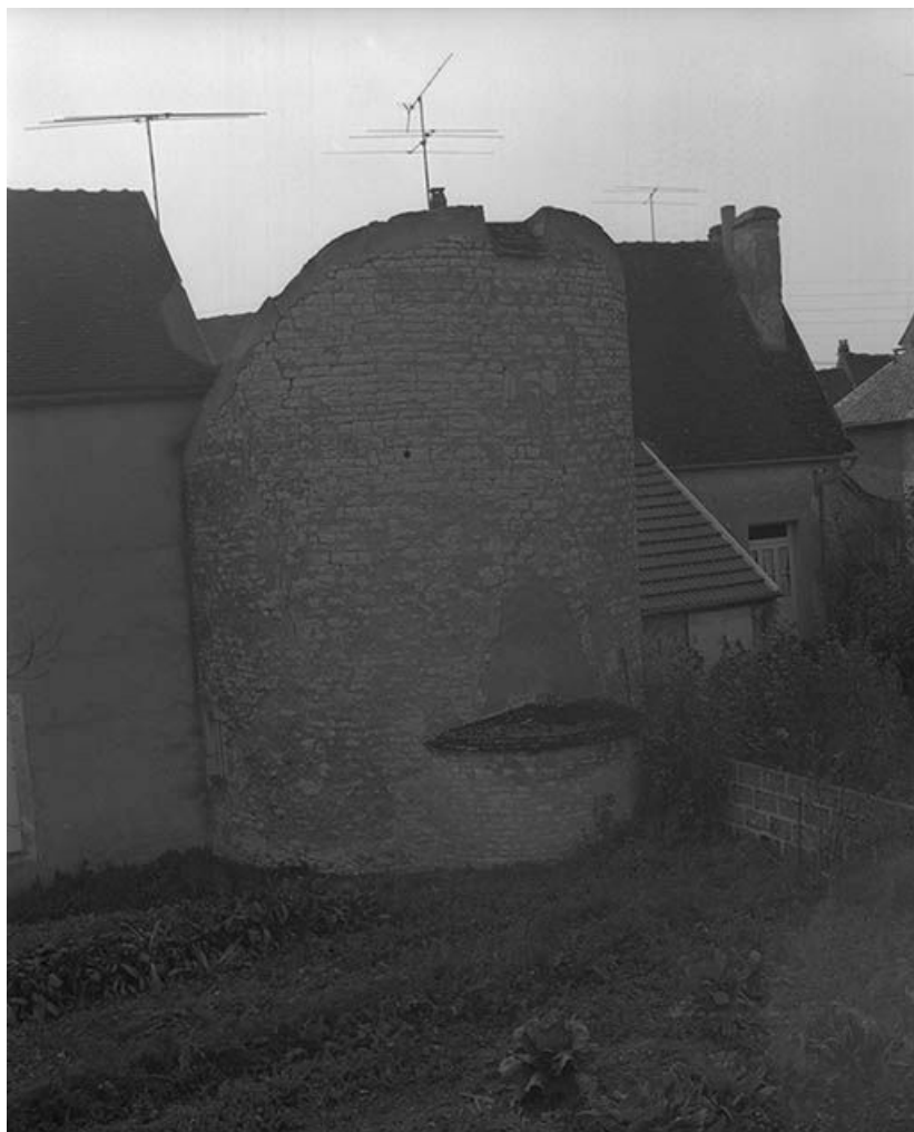
Tour sise parcelle AB 69, du cadastre de 1964 (C.V. 7) : vue d'ensemble. 89, Vermenton