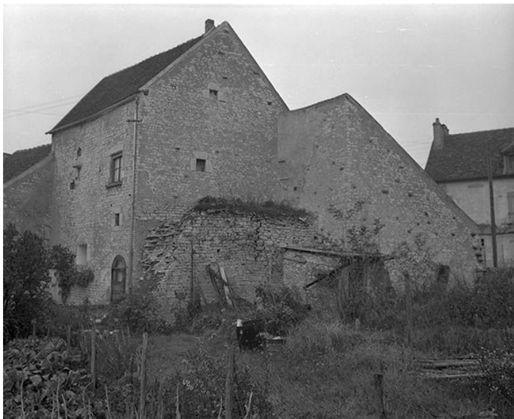
Vestiges de remparts sis parcelle AB 233, du cadastre de 1964 (C.V. 7). 89, Vermenton