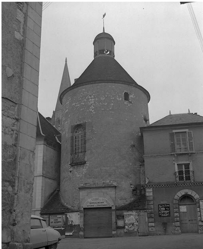
Tour du Méridien, sise parcelle AB 541, du cadastre de 1964 : face. 89, Vermenton