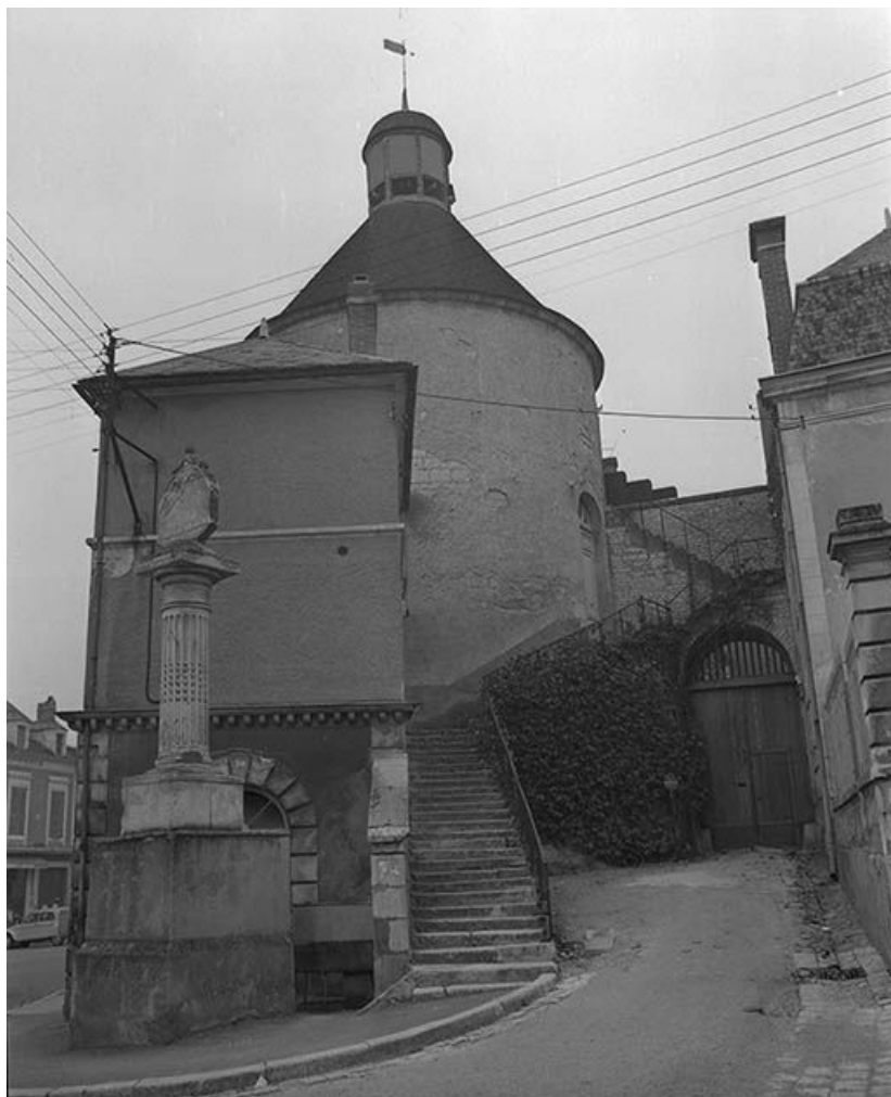
Tour du Méridien, sise parcelle AB 541, du cadastre de 1964 : tour et escalier. 89, Vermenton