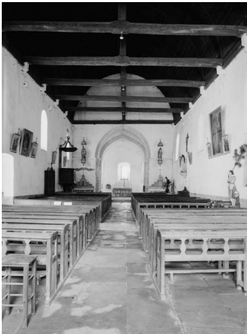
Nef et chœur.