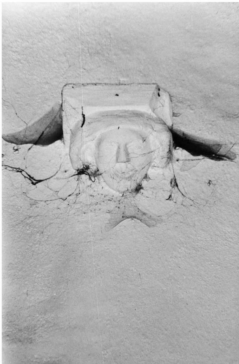
Corbeau. 89, Accolay