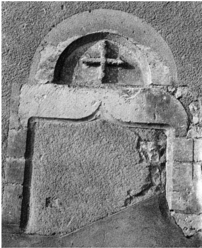
Porte murée, façade droite.