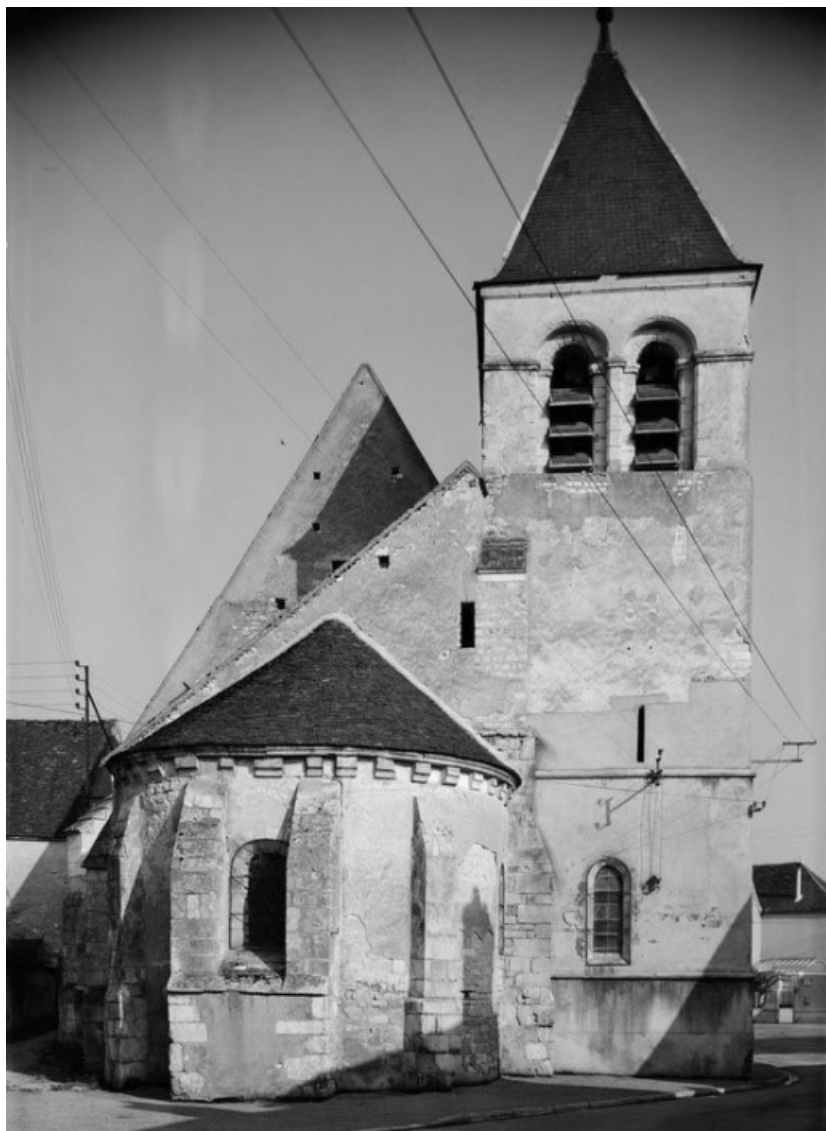
Chevet et clocher.