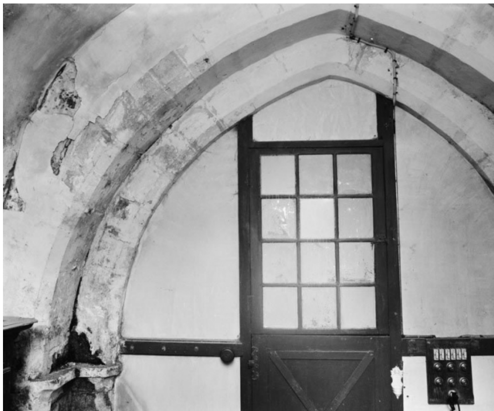
Arc situé entre le chœur et la sacristie. 89, Accolay