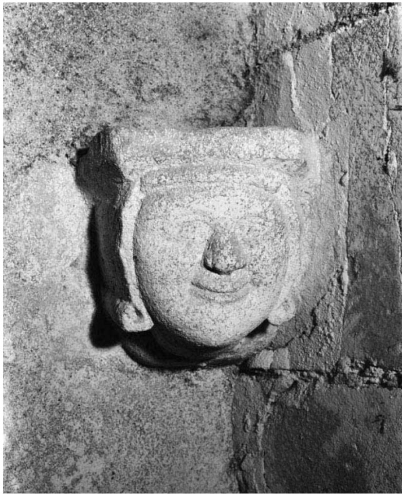
Culot avec visage sculpté dans le chœur.