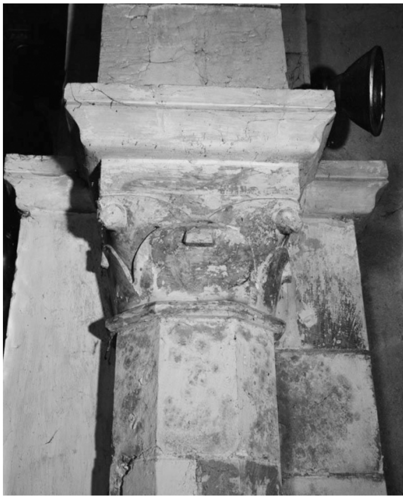
Chapiteaux de l'arc triomphal gauche.