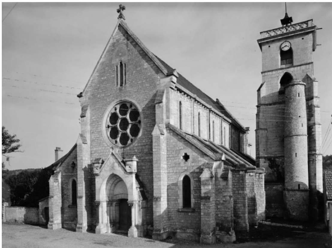
Façade et élévation droite.