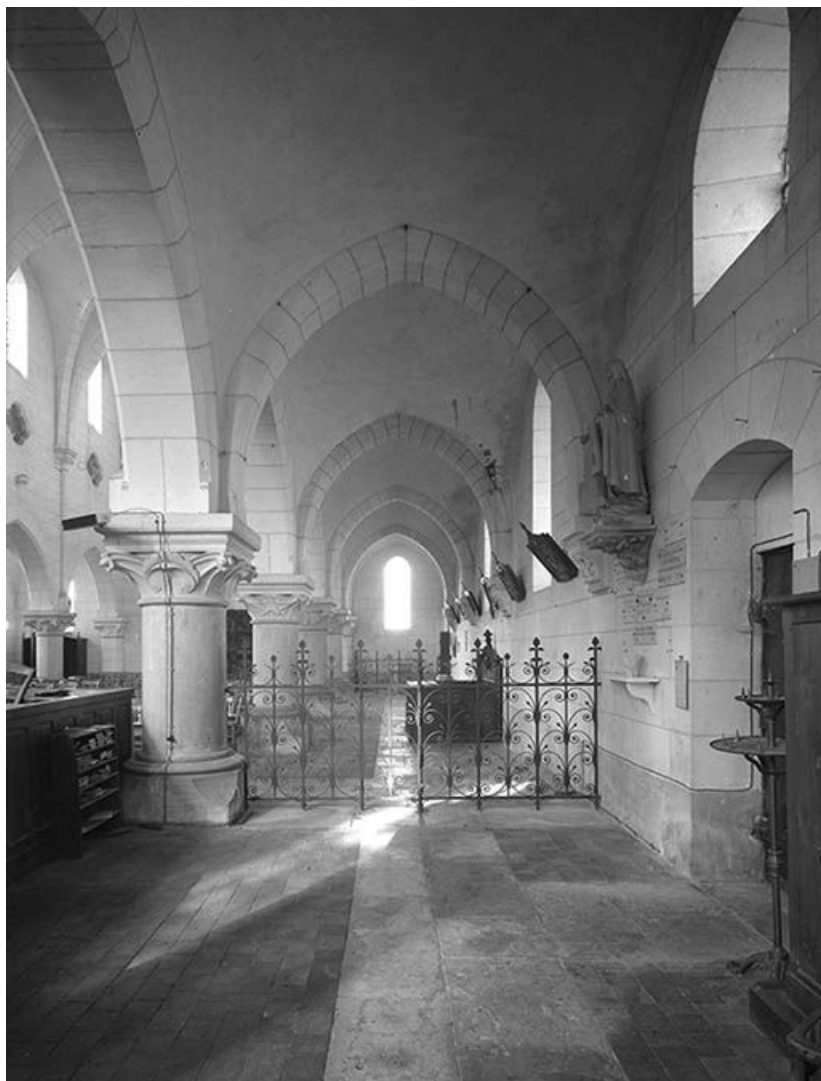
Collatéral gauche. 89, Mailly-la-Ville