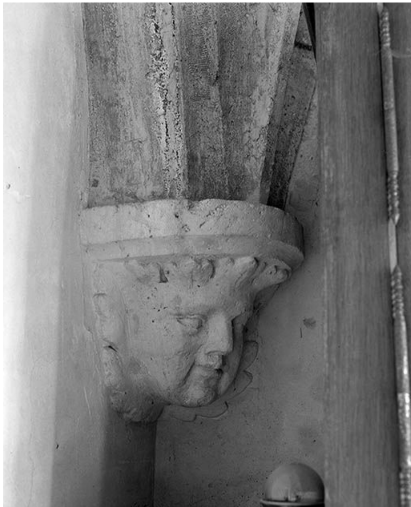
Sacristie, culot. 89, Mailly-la-Ville