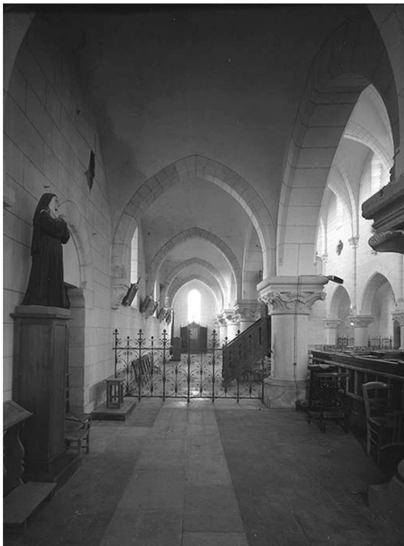
Collatéral droit. 89, Mailly-la-Ville