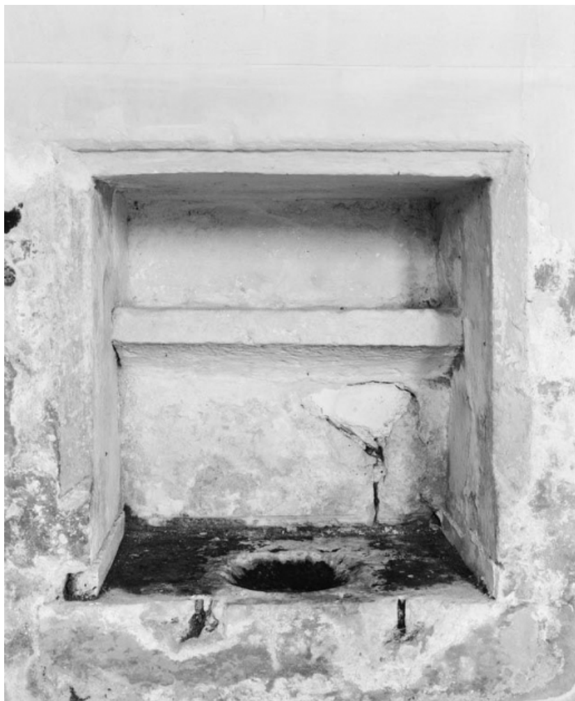
Lavabo du choeur.