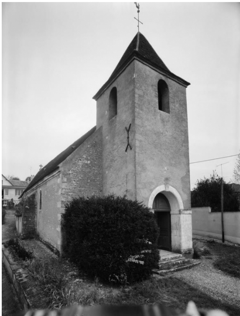
Façade antérieure et élévation gauche.